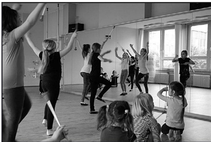
> Mažoretki w Trutnowie intensywnie trenowały