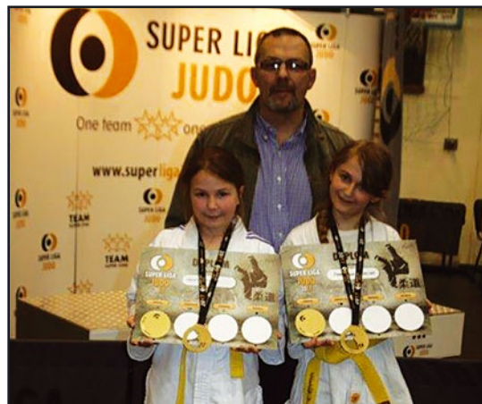
> Jaworzyńskie judoczki ze złotymi medalami

oraz Ania nie dały szans swoim przeciwniczkom wygrywając wszystkie swoje walki przed czasem. Występ naszych małych judoczek można więc uznać za bardzo udany. Zawodniczkom i trenerowi życzymy dalszych sukcesów w następnych edycjach Ligi.