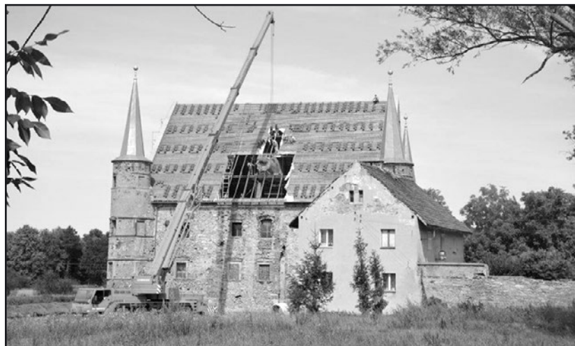
> Zanim zamek w Piotrowicach odzyska dawny blask...

osiągnięć w nauce i przemyśle. Zabudowania zabytkowego Folwarku o powierzchni 3,5 hektara przeznaczone zostaną na pomieszczenia, gdzie dokumentowana będzie historia rolnictwa od czasów najdawniejszych ze szczególnym uwzględnieniem okresu rewolucji przemysłowej oraz najnowszych osiągnięć w produkcji rolnej. Oprócz części muzealnej w budynkach folwarcznych powstanie „żywa farma” w której