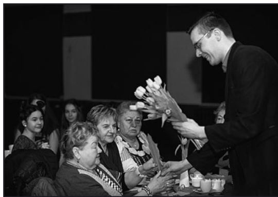
> W Dniu Kobiet nie może zabraknąć kwiatów dla Pań