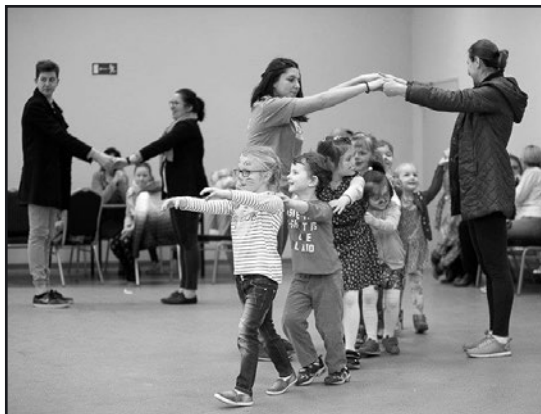
> Powitaniu wiosny towarzyszyły gry...

Każdy z uczestników konkursu został nagrodzony pamiątkowym dyplomem oraz słodkim upominkiem. Dziękujemy wszystkim za udział w konkursie i zapraszamy na wspólne witanie wiosny za rok.