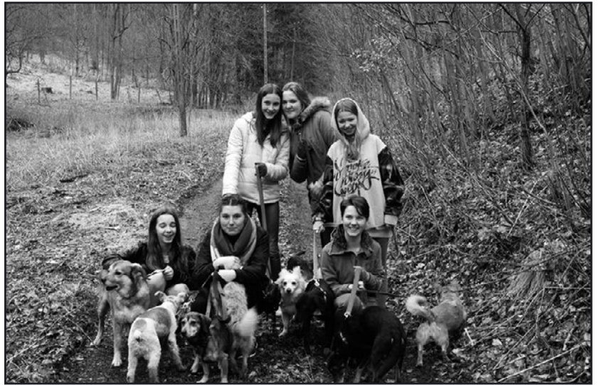
> Wolontariusze Klubu Młodzieżowego na spacerze z czworonogami