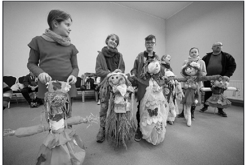
> Przygotowanie Marzanny wymaga sporo pracy

Po zabawach przyszedł czas na rozstrzygnięcie konkursu „Marzanna 2017”. W tym roku do udziału w konkursie zgłoszono aż