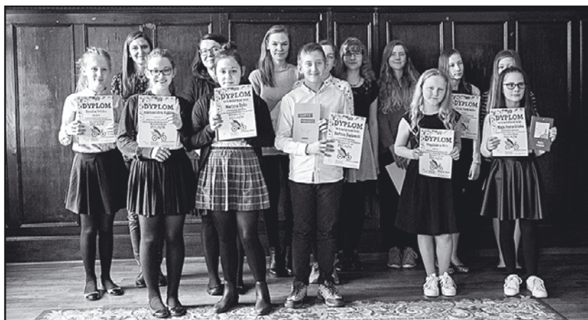
> Uczestnicy gminnego etapu konkursu recytatorskiego