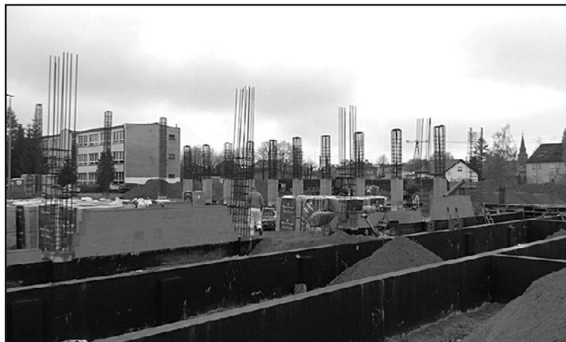
> Prace budowlane hali sportowej przebiegają planowo

Przypomnieć należy, że wykonawcą prac jest Przedsiębiorstwo Produkcyjno-Usługowe MIRS Sp. z o.o. z Oleśnicy. Wykonaw-