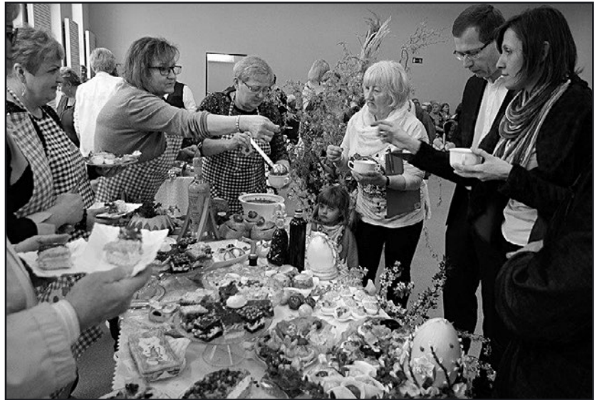
> Stoły wielkanocne zastawione były smakowitymi potrawami oraz były pięknie przystrojone