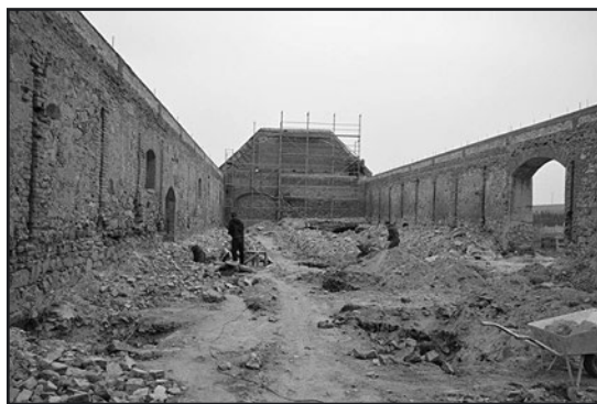
> ... należy wykonać wiele prac odbudowawczo-remontowych

Założeniem Fundatorów jest, aby zakończyć prace w ciągu 5 lat. Jednak już w drugiej połowie 2017 roku zostanie udostępniona do zwiedzania ekspozycja zabytkowych maszyn rolniczych.