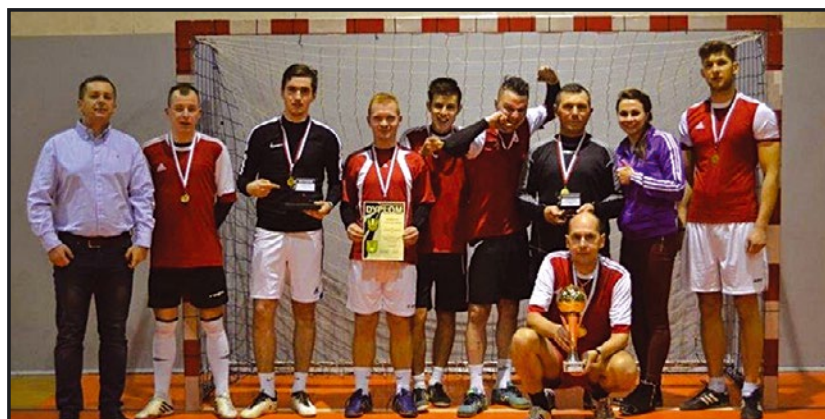
> Osiedle i Przyjaciele - zwycięzcy XIV edycji JALPH

Już dzisiaj zapraszamy do udziału w XV już edycji Jaworzyńskiej Amatorskiej Ligi Piłki Halowej, która wystartuje ponownie już jesienią.