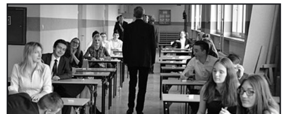
> Uczniowie podczas egzaminu gimnazjalnego

Prace gimnazjalistów zostaną sprawdzone przez egzaminatorów, a wyniki przysłane do szkół