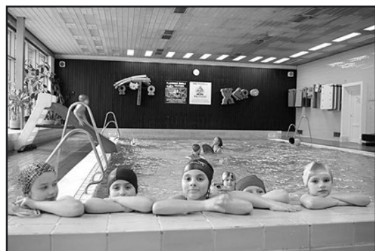
> Po treningach był czas na basen

godzin wieczornych, nie zabrakło czasu na zabawę i integrację pozataneczną. Doskonałym odpoczynkiem od