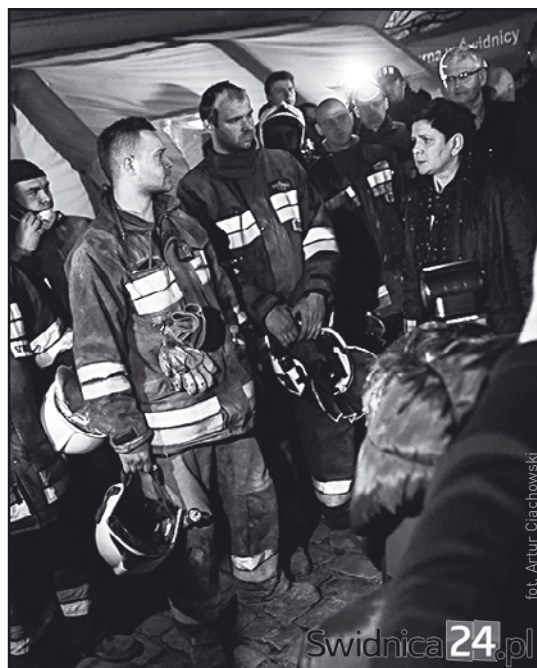
> Na miejscu akcji podziękowania strażakom złożyła Prezes Rady Ministrów Pani Beata Szydło