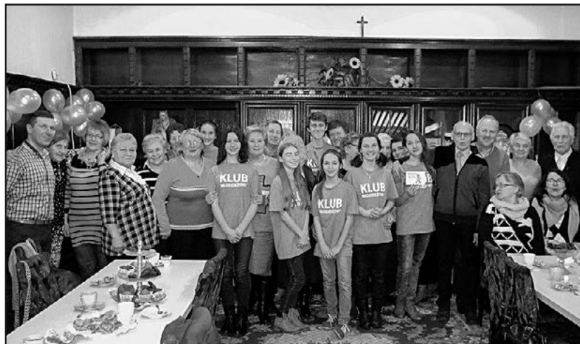
> Dzień Babci i Dzień Dziadka łączy pokolenia

z wolontariuszami seniorzy podjęli się także transformacji językowych, jakich wymagał konkurs slangu młodzieżowego.