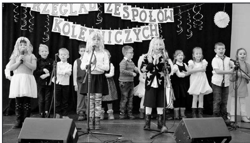
> Kolędowali najmłodsi