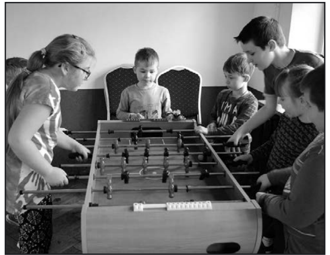
> W trakcie ferii SOKiB zaoferował dzieciom gry i zabawy

cyjne już wspólne wyjazdy do kina oraz sali zabaw „Loopy's World” we Wrocławiu sprawiły najmłodszym spędzającym ferie w mieście