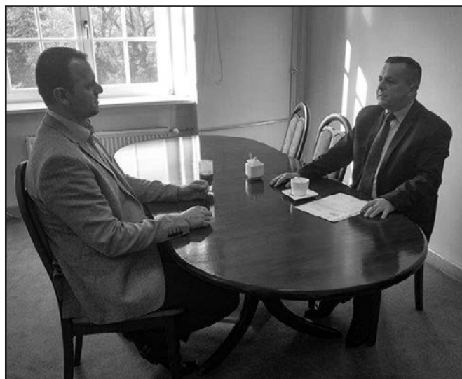
> Głównym tematem spotkania z Wicewojewodą było wdrożenie programu Maluch plus

współpracy Urzędu Wojewódzkiego z gminą w zakresie realizacji zadań zleconych wykonywanych przez gminę, których sprawną realizacją dotyczy bezpośrednio naszych mieszkańców.