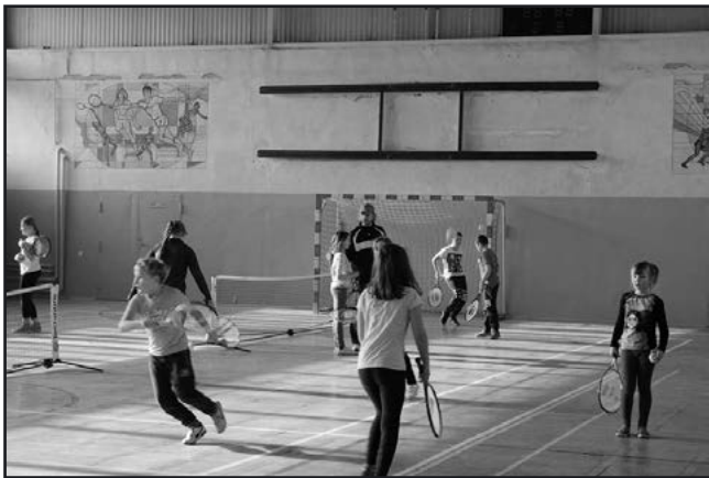
> zajęcia sportowe

ci w wieku od 6 do 12 lat uczestniczyła w porannych zajęciach