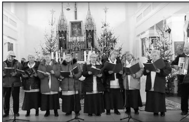
> Jaworzynianie wykonali kolędowy repertuar

plomy i puchary, a po występach zaproszono zespoły na wspólny poczęstunek przygotowany przez Stowarzyszenie „Cicha Woda”.