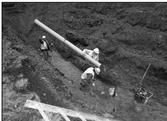
> Już niebawem powinny ruszyć prace w Piotrowicach

Na rozpatrzenie oczekuje wniosek dotyczący Pastuchowa, gdzie długość sieci wyniesie będzie ponad kilometr, a kosztorysowa wartość prac szacowana jest na ok. 11 mln zł brutto. Przy pozytywnym rozpatrzeniu wniosków prace w Pastuchowie przeprowadzone zostałyby w 2019 r.