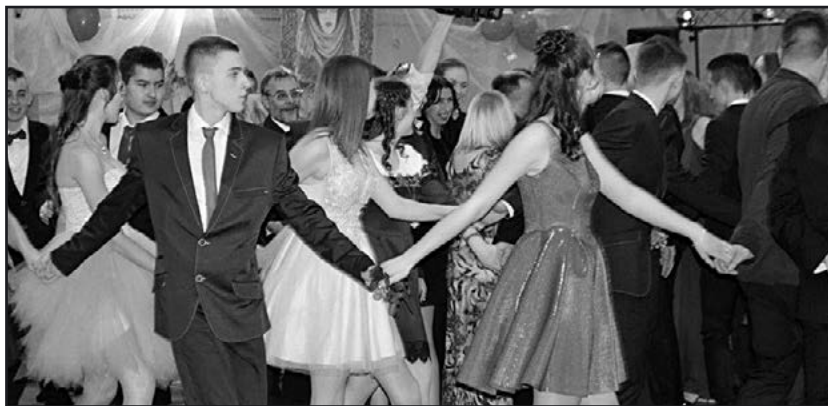
> Bal należy uznać za udany

szkoły i nauczycieli, którzy przyczynili się do organizacji balu, za co uczniowie składają Im serdeczne podziękowania.