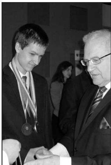
> M. Drąg uczestniczył w finałach wojewódzkich konkursów z zakresu kilku dyscyplin nauki

Stypendystom serdecznie gratulujemy i życzymy dalszych sukcesów.