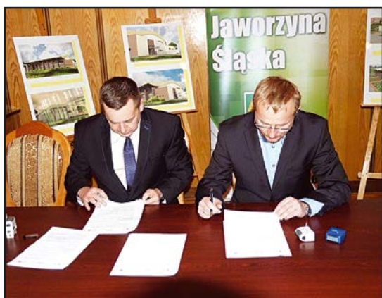
> Podpisanie umowy z wykonawcą