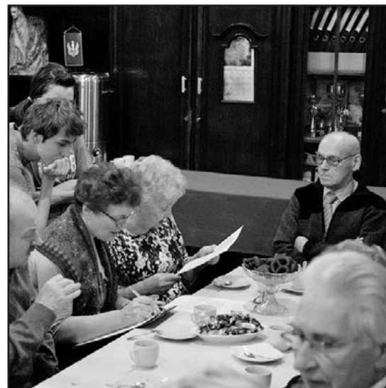
> Świętowano przy herbacie, kawie i piernikach

próbowali swoich sił w konkursie karaoke, śpiewając poszedł przybyłym gościom również quiz wiedzy o serialach i filmach sprzed lat. Wspólnie