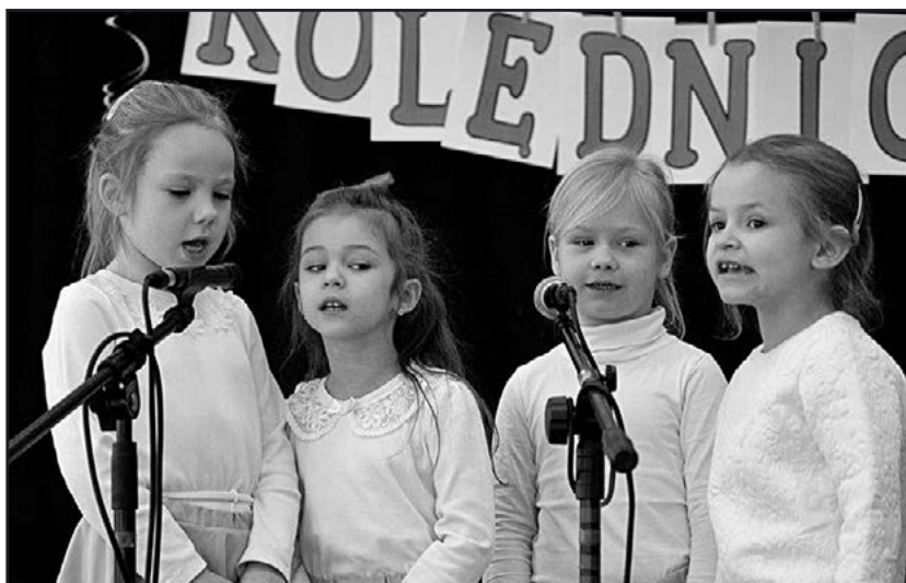
> i dziewczynki

udział w tegorocznym konkursie, jednocześnie już dziś zapraszają na kolejną edycję przeglądu, pielęgnującego naszą rodzimą piękną tradycję śpiewania kolęd i występów jasełkowych.