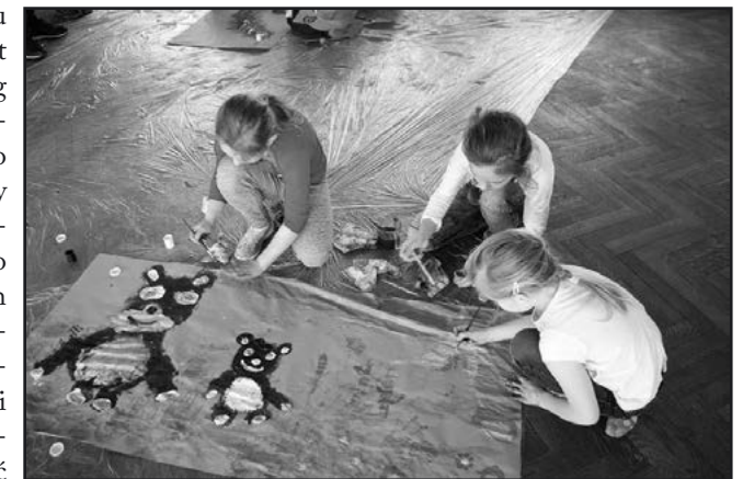
> zajęcia plastyczne

upagę'u oraz występ Klauna Jejku i warsztaty cyrkowe. Wiele wrażeń i pozytywnych emocji przyniosły dzieciom wycieczki. Tradycyjnie