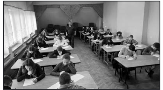
> Zmagania teoretyczne w ramach Turnieju Wiedzy Pożarniczej

Młodzi strażacy i strażaczki oprócz teorii sprawdzają się również w ćwiczeniach praktycznych. Okazją do