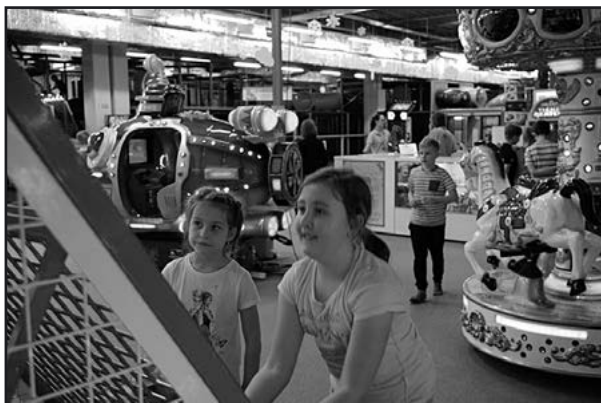
> oraz wycieczkę do sali zabaw

ziemnego, rozgrywkach gier w X-boxa i tańczyły szaloną zumbę.