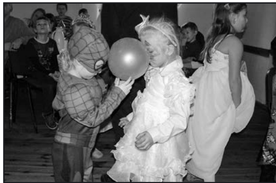
> Dzieci bawiły się w przebraniach