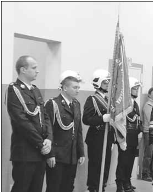
> Poczet sztandarowy podczas uroczystej zbiórki na przekazaniu remizy

Dobiegła końca prowadzona od wielu lat budowa remizy strażackiej dla OSP Jaworzyna Śląska. Oddanie jej w użytkowanie strażaków odbyło się na uroczystej zbiórce, na którą przybyło wielu znakomitych gości. Wśród zaproszonych zaszczytli swoją obecnością m.in.: