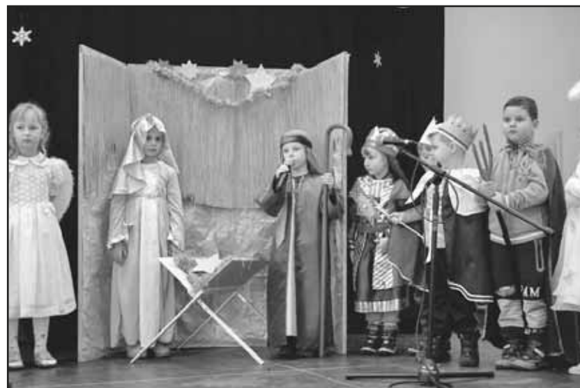
> Przegląd Zespołów Jasełkowych odbył się już po raz szesnasty