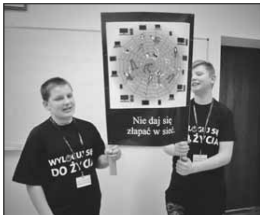
> Internet to nie wszystko...