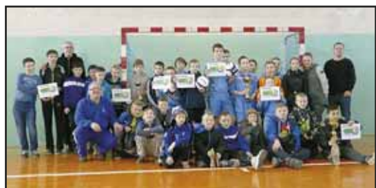
> Uczestnicy Turnieju Szkół Podstawowych

Organizatorzy dziękują wszystkim zawodnikom, szkołom oraz opiekunom, a także zebranym kibicom za udział w imprezie i jednocześnie zapraszają na kolejny Turniej w przyszłym roku.