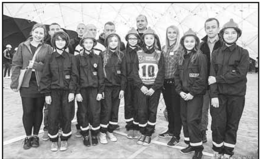
> Druhny i druhowie OPS Jaworzyna Śląska w Teplicach

ły udział w zawodach pięcioboju pożarniczego. Nasze dziewczyny nie dały się zaskoczyć i dzielnie poradziły sobie w każdym starcie. W zawodach brało udział, łącznie z naszą MDP, 42 drużyny podzielone na 3 kategorie wiekowe. Co ciekawe zawody odbyły się w hali sportowej.