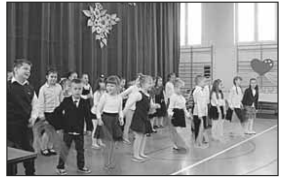
> Występ uczniów bardzo spodobał się Babciom i Dziadkom