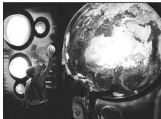
> Hydropolis – centrum wiedzy o wodzie zachwyciło uczestników wycieczki

oczywiście wielu zabaw ruchowych – obok rozgrywek gier w X-boxa, zabaw z chustą Klanzy czy bitwy na kolorowe kulki, uczestnicy zajęć mieli również okazję zatańczyć z zespołem „Fart” i spróbować sił w tańcu z tzw. Batonami, który zaprezentował zespół mażorettek ze Świdnicy. Drugi tydzień ferii upłynął pod znakiem wycieczek, poczynawszy od wizyty w nowej remizie strażackiej i wyjazdu do kina na film animowany, a kończąc na długo oczekiwanych wycieczkach do Wrocławia. Zabawa w sali zabaw „Loopy’s World” oraz zwiedzanie podwodnego świata