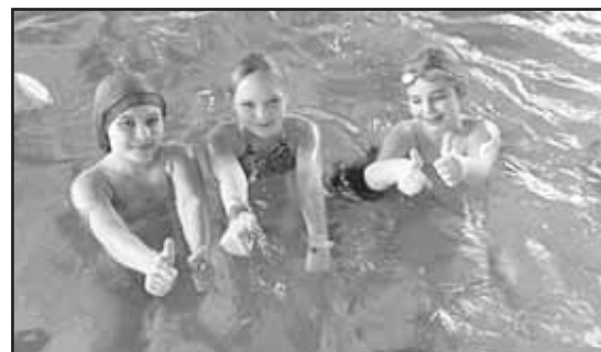
> Przyjemnym sposobem na spędzenie ferii był wyjazd na basen

„Hydropolis” przyniosły dzieciom niewątpliwie najwięcej wrażeń i zapewne choć trochę zrekomensowały ferie zimowe pozbawione śniegu.