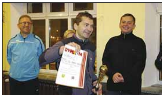
> Kapitan strażaków z Teplic odbiera dyplom i puchar za zajęcie V miejsca

6 lutego 2016 r. odbył się kolejny, co-rocny Turniej Piłki Halowej Szkół Podstawowych o Puchar Burmistrza Jaworzyny Śląskiej. Do rywalizacji stanęły reprezentacje szkół podstawowych z terenu gminy, łącznie w zawodach wzięło udział ponad 30 zawodników. Wszystkie mecze sędziował Za-stępca Przewodniczą-