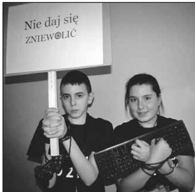
> ... korzystając z niego nie zapominajmy o realnym świecie

Zadaniem programu jest promowanie zdrowego stylu życia, stwarzanie okazji do rozwijania „pozakomputerowych” zainteresowań, promowanie czytelnictwa, rozwijanie różnorodnych zdolności uczniów oraz ukazanie negatywnych konsekwencji nadmiernego korzystania z