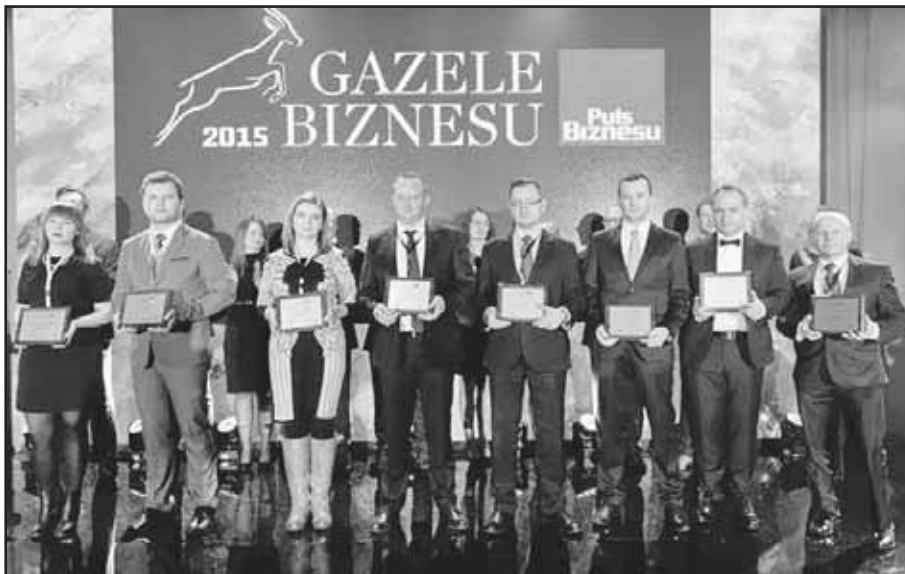
> Uroczyste wręczenie wyróżnień

nego oraz browarniczego. Niedawno firma uruchomiła drugi zakład w Jaworzynie Śląskiej, który zajmuje się projektowaniem i wykonywaniem ze stali nierdzewnej i kwasoodpornej: zbiorników magazynowych o różnych pojemnościach, pasteryzatorów, mieszalników procesowych, zbiorników ciśnieniowych jak i platform i podestów. W B&W Sp. z o.o. pracuje ponad 100 osób głównie z terenu naszej gminy.