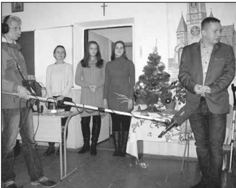
> W Czortkowie odbyło się świąteczne spotkanie z uczestnikami szkoły polskiej

Spędziliśmy na Ukrainie 3 piękne dni. Na każdym kroku spotykaliśmy się z ogromną życzliwością i gościnnością. Spotykaliśmy ludzi mających polskie korzenie. Pomimo, że mieszkają na obcej teraz ziemi, nie zapominają o Polsce – uczą się języka polskiego, poznają historię Polski oraz kultywują tradycje i zwyczaje swoich przodków.