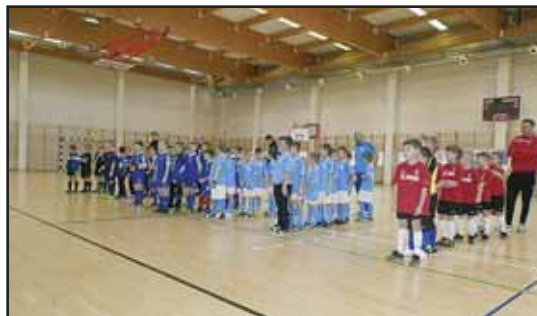
> Jaworzynę reprezentowały dwie drużyny

Zawodnikom towarzyszyło liczne grono kibiców, wśród któ-