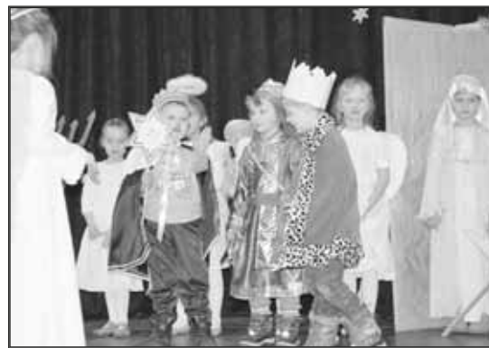
> Na scenie najmłodsi artyści