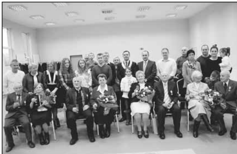
> Jubilaci w gronie najbliższych

również członkowie rodzin, którzy towarzyszyli Im tego dnia w uroczystości.