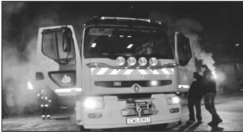
> Wóz bojowy OSP Pastuchów prezentuje się okazale

Mamy nadzieję, że wtedy, gdy będzie to potrzebne, auto sprawdzi się w boju, ale równocześnie oby takich sytuacji było jak najmniej.