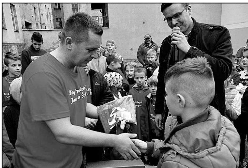
> Nagrody uczestnikom wręczył Burmistrz, który również przebiegł trasę

szego roku miały do przebiegnięcia dystans 200 metrów, młodzież (roczniki 1998-2004) – 750 metrów, dorośli zaś zmierzali się na dystansie 1750 metrów. Biegowi Niepodległości towarzyszyła wspaniała atmosfera rywalizacji fair play, a każdy uczestnik dobiegający do mety został nagrodzony gromkimi oklaskami kibiców.