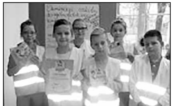
> Członkowie jaworzyńskiego Klubu Bezpiecznego Puchatka

Dzięki nim będzie on umiał rozpoznawać zagrożenia, bezpiecznie uczyć się i bawić. Przedstawiciele SKB ze Szkoły Podstawowej odwiedzili już wszystkich uczniów klas pierwszych i zapoznali z zasadami klubowymi, przekazali także książeczki. Do Klubu Bezpiecznego Puchat-