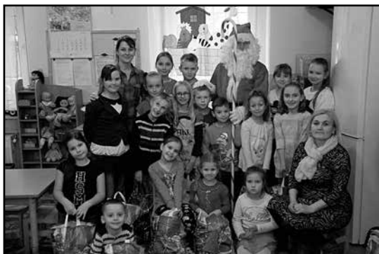
> Mikołaj nie zawiódł, dla każdego przyniósł paczkę