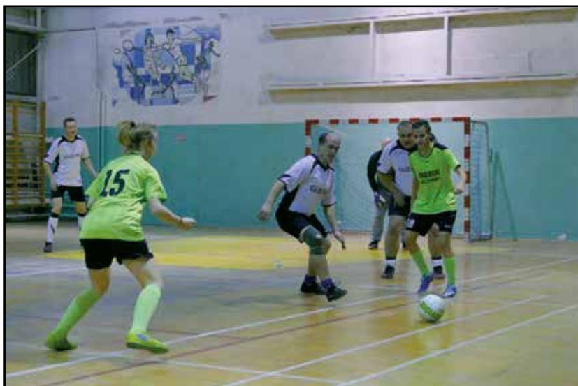
> W turnieju wzięła udział także drużyna kobiet