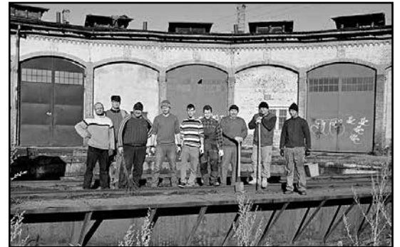
> Członkowie i sympatycy Stowarzyszenia Miłośników Kolei

serce parowozowni tj. obrotnica mają swoją historyczną wartość. Obiekt powstał wraz z uruchomieniem w roku 1843 połączenia kolejowego na trasie Wrocław Świebodzki – Świebodzice oraz dalszą rozbudową połączeń kolejowych kierunku Świdnica oraz Strzegom. Obiekt ten wchodzi w skład byłej szkoły kolejowej.