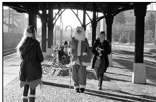
> Do Jaworzyny przyjechał pociąg

grzecznych dzieci – tych całkiem małych i tych nieco starszych.... Zaopatrzeni w worki pełne cukierków, prze-