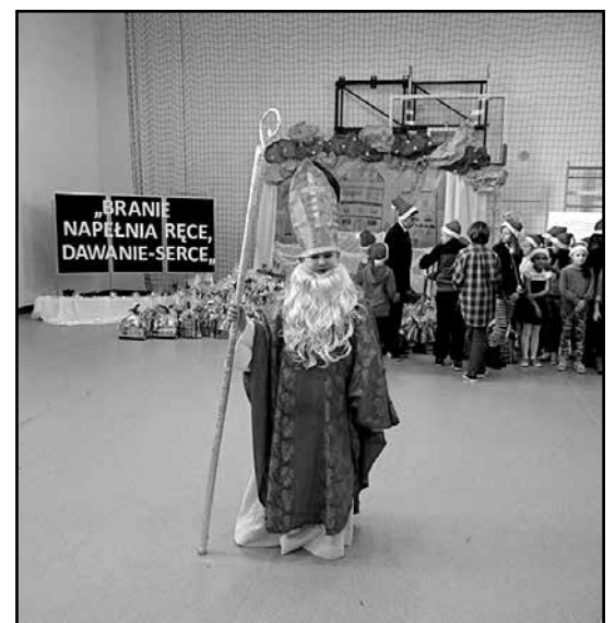
> Głównym bohaterem przedstawienia był Święty Mikołaj