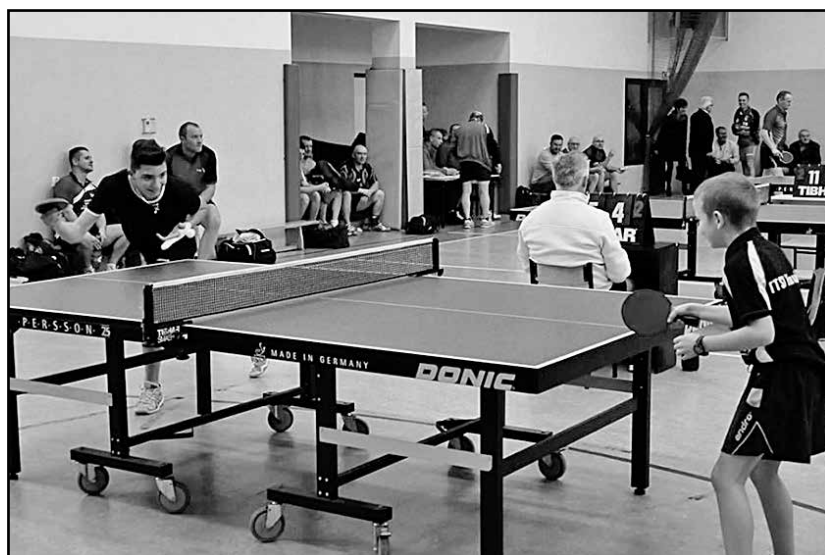
> Turniej tenisa stołowego o puchar Burmistrza

Szkole Podstawowej w Jaworzynie Śląskiej rozpoczął się IX Turniej Tenisa Stołowego o Puchar Burmistrza Jaworzyny Śląskiej, z okazji 97. Rocznicy Odzyskania Niepodległości, zorganizowany przez Sekcję Tenisa Stołowego Gminnego Ludowego Klubu Sportowego oraz Samorządowy Ośrodek Kultury i Bibliotekę Publiczną. W rozgrywkach wzięli udział zawodnicy z całego