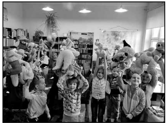
> Dzieci ze swoimi pluszakami

koniec, niczym Mądre Sowy, dzieci sprawdzały przydatność wynalazku, jakim jest zakładka do książki. Wspaniała zabawa sprawiła wiele radości najmłodszym, a także wznieciła jeszcze bardziej zapał do czytania książek.