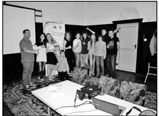
> Uczestnicy spotkania

Spotkanie to z pewnością zapoczątkuje serię następnych, gdzie