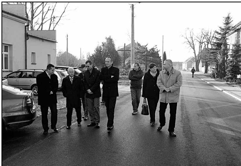
> W odbiorach uczestniczą zawsze przedstawiciele władz gminy i powiatu oraz wykonawcy prac

(od granicy miasta aż do końca miejscowości Czechy). Zakres wykonanych prac będzie z pewnością odczuwalny dla użytkowników,