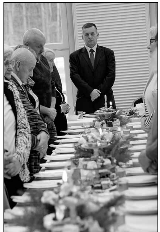
> Modlitwa przy wigilijnym stole

Na zakończenie każdy otrzymał upominki, przygotowane przez Gminę Jaworzyna Śląska.