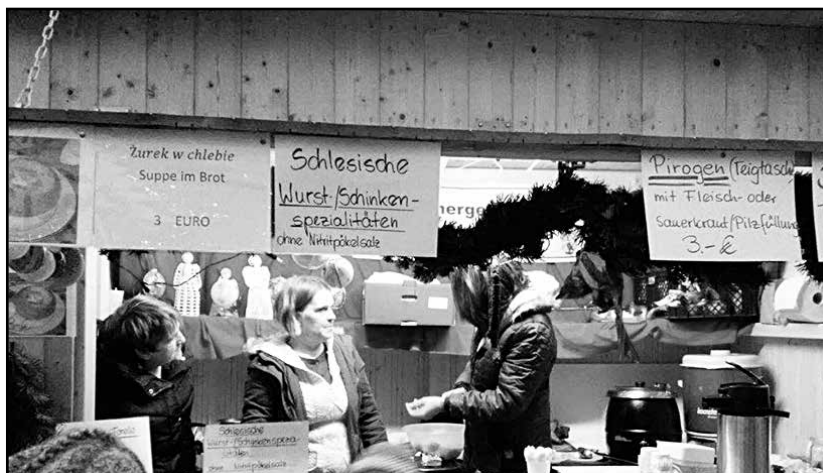
> Stoisko Bagieńca reprezentowało naszą gminę

likier „Krupnik”. Nasze wyroby cieszyły się dużym zainteresowaniem mieszkańców Dolnej Bawarii. Na stoisku nie zabrakło polskich kolęd i miłej atmosfery, która przyciągała odwiedzających i zachęcała do degustacji. Delegacja powróciła z życzeniami świątecznymi dla wszystkich mieszkańców gminy Jaworzyna Śląska od przyjaciół z partnerskiego miasta Pffeffenhausen.