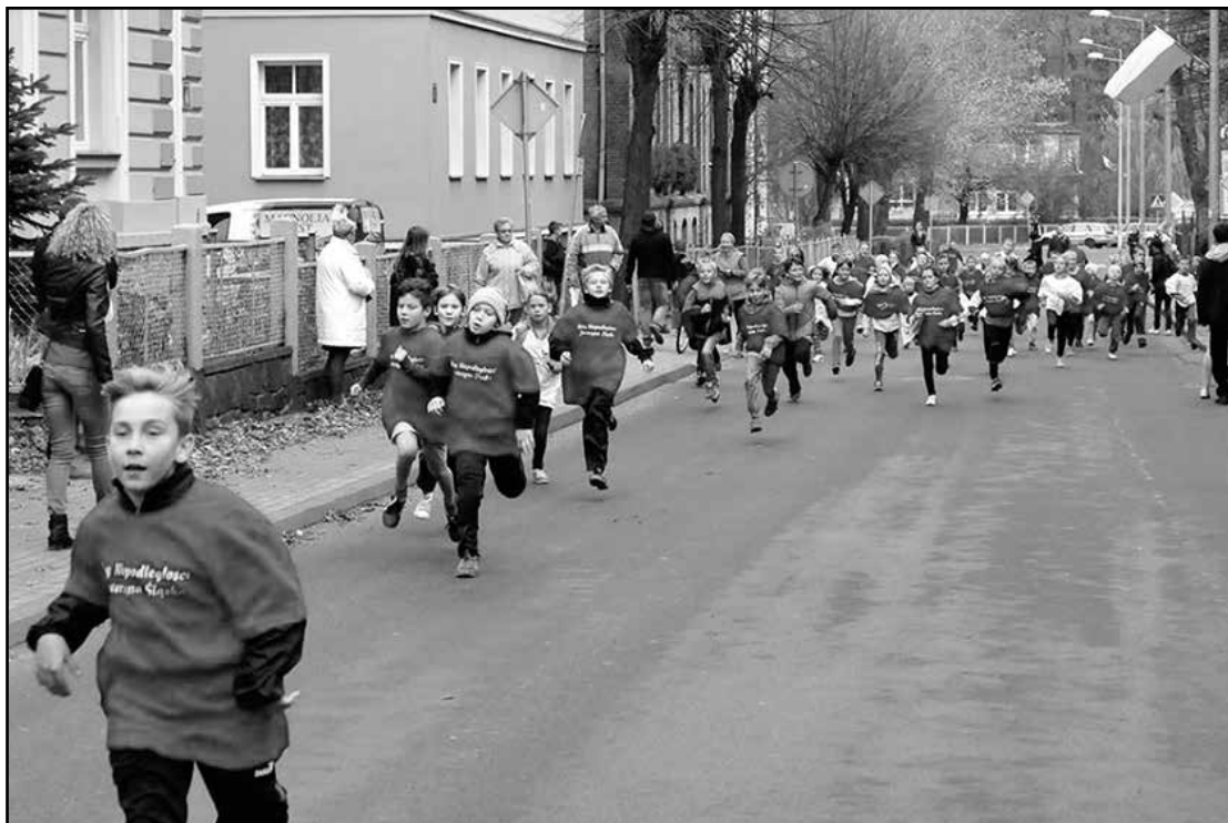
> Uczestnicy podczas biegu