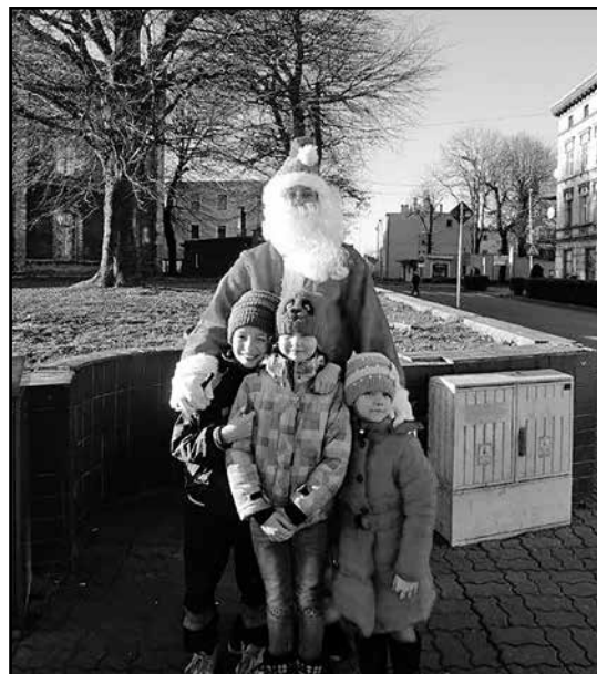
> Można było również zrobić sobie pamiątkowe zdjęcie

Tuż przed Bożym Narodzeniem, paczki od gminy partnerskiej Pffeffenhausen, burmistrzów i radnych naszej gminy trafią również do ponad dwudziestu rodzin z naszej gminy.