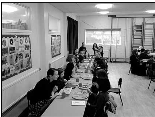
> Wspólny posiłek

Dzięki takim osobom granice między ludźmi zacierają się i znikają bariery.