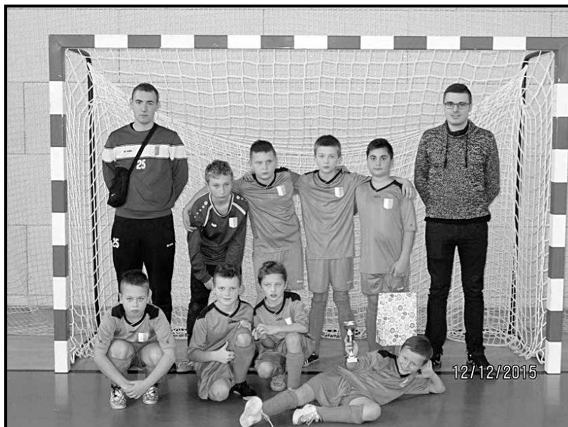
> Ekipa MKS-u

W grudniową niedzielę najmłodszy adepci futbolu z MKS Karolina zagraли w turnieju Górnik Wałbrzych CUP. W zmaganiach wystartowało 6 drużyn, w tym dwa zespoły reprezentujące barwy jaworzyńskiego klubu. Dla większości zawodników był to debiut w oficjalnych rozgrywkach i pierwsza możliwość rywalizacji z rówieśnikami.