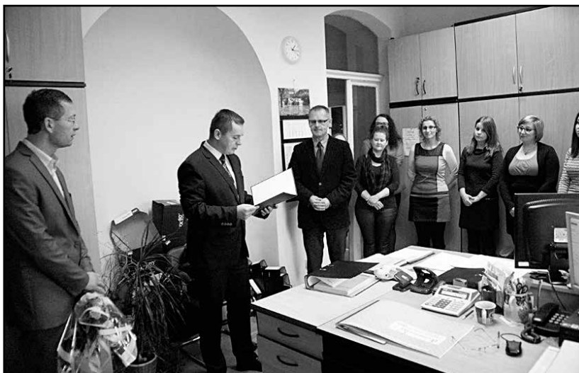
> Burmistrz Grzegorz Grzegorzewicz złożył serdeczne życzenia wszystkim pracownikom

Kameralne spotkanie przy kawie i okazjonalnym ciastku było też znakomitą okazją do rozmowy o bieżących problemach, jakich, na co dzień doświadczają pracownicy pomocy społecznej.