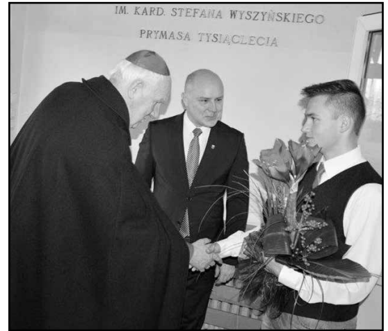
> Wizytacja kanoniczna w Gimnazjum

Zwracając się do zebranych ksiądz Biskup podkreślił jak ważne w dzisiejszych czasach jest wychowanie i uczenie młodego pokolenia wiary, tradycji oraz miłości do Ojczyzny i drugiego człowieka, a następnie przyszedł czas na rozmowy z gronem pedagogicznym.