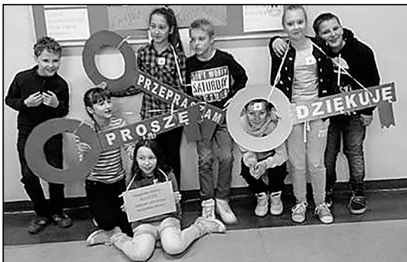
> Proszę, dziękuję, przepraszam, dzięki tym trzem słowom świat wokół nas może być lepszy