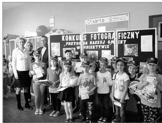
> Pamiątkowe zdjęcie uczestników konkursu

Wszyscy uczestnicy otrzymali nagrody i drobne upominki. Serdecznie gratulujemy wszystkim uczestnikom.