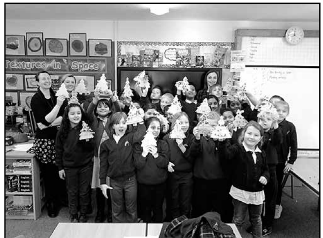
> Ozdoby świąteczne przygotowane przez uczniów