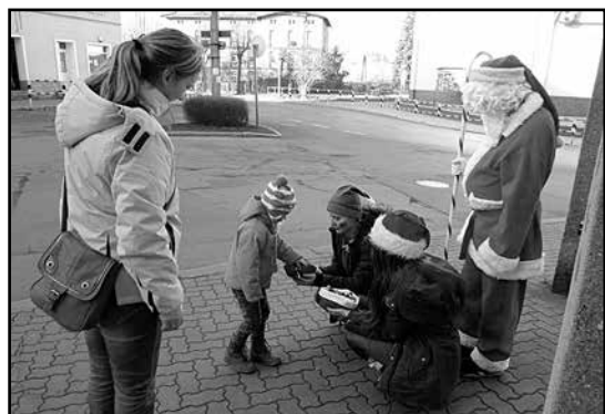
> Napotkane osoby częstował cukierkami

Święty Mikołaj wraz z Elfami przemierzali również ulicami w poszukiwaniu