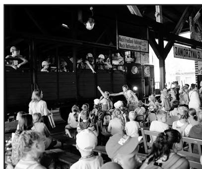
> Przywitanie specjalnego taboru