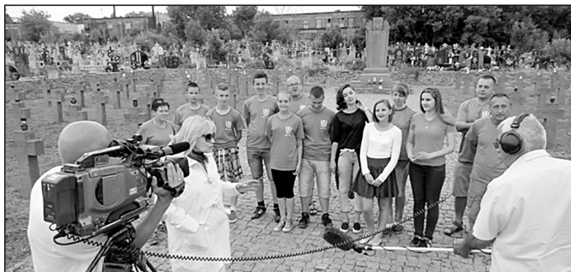
> Na miejsce przyjechała TV Wrocław