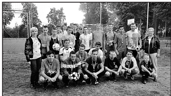
> Uczestnicy igrzysk

Organizatorami imprezy byli Sołtys Pastuchowa, Rada Sołectwa i OSP Pastuchów, Sołtys, Rada Sołectwa i OSP Pastuchów.