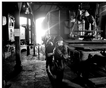
> Dzieci dbały również o stary tabor kolejowy

A oto fotorelacja z tej fantastycznej wakacyjnej przygody, której głównymi bohaterami były dzieci z naszej gminy: