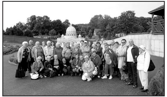
> Uczestnicy wyjazdu w parku miniatur sakralnych

kilku minut letniego deszczu przy zachmurzonym niebie umożliwiła wszystkim uczestnikom skorzystać w pełni z zaplanowanych atrakcji. Członkowie Zespołu Jaworznianie swoimi piosenkami i wspaniałym nastrojem zintegrowali grupę.