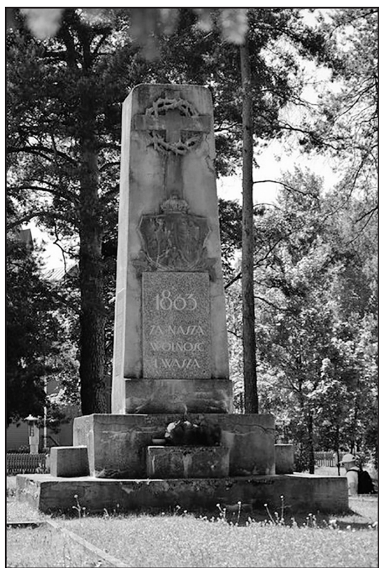
> Ślady Polskości są widoczne na każdym kroku

Ojców Dominikanów. Następnego dnia po przyjeździe przystąpiliśmy do pracy. „Nasz” cmentarz zajmuje około 6 hektarów powierzchni. Nie ma wyraźnie wydzielonej polskiej części. Grobów naszych przodków należało szukać wśród mogił pochowanych tam greko-katolików i zmarłych wyznania prawosławnego. Udało nam się uporządkować, odnowić i ocalić od zapomnienia blisko 100 mogił rodaków. Przybyliśmy tam w samą porę. Jeszcze kilka lat i po wielu z nich nie byłoby już śladu. Zarośnięte olbrzymimi krzakami, z ledwie widocznymi napisami na tabliczkach nagrobnych, dzięki naszej pracy ujrzały światło dzienne i odzyskały dawny blask. Należy też dodać, że część polskich grobów była zadbaną. Zapewne