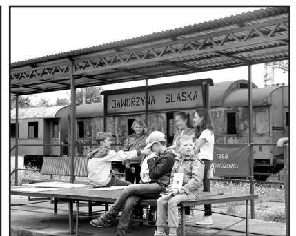
> Uczestnicy Przemysłowego Miasta Dzieci