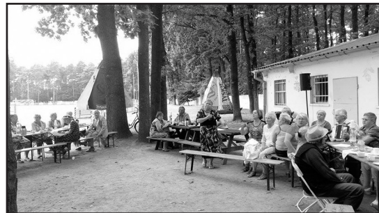
> Piknik okazał się sukcesem organizacyjnym