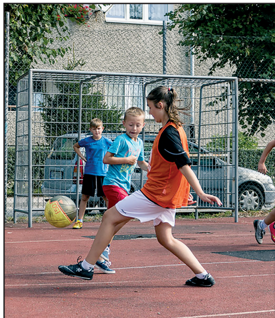
> Rywalizacja sportowa była widoczna na każdym kroku

W sobotę, 22 sierpnia br. Na boisku przy ulicy Ceglanej odbył się Turniej Piłki Nożnej dla dzieci uczęszczających do szkół pod-