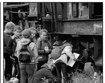
> Mali odkrywcy w muzeum