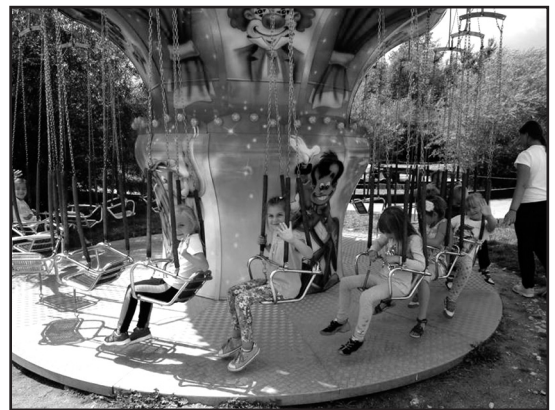
> W części rozrywkowej krasiejowskiego Dinoparku

przez Samorządowy Ośrodek Kultury i Bibliotekę Publiczną w Jaworzynie Śląskiej wraz z wolontariuszami z Klubu Młodzieżowego odwiedzili „Jura-Park” w Krasiejowie, gdzie czekały na nich dinozaury. Dzieci i młodzież z Jaworzyny Śląskiej zwiedzili także cyfrowy Park Nauki i Ewolucji Człowieka, w którym odbyli lot promem kosmicznym.