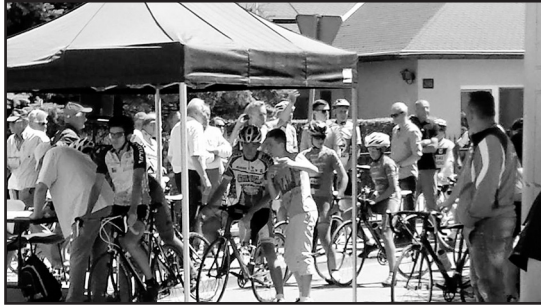
> Rywalizacja zaczyna się od startu

no zrobimy wszystko, aby tego dokonać. Jestem przekonany, że w przyszłości wyścig ten może wejść do programu Międzynarodowej Federacji Kolarskiej, żeby podnieść rangę tej imprezy, żeby mieć