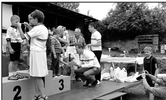
> Najmłodszy kolarze na podium