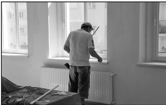
> Prace remontowe w szkole

Równocześnie zostały wymienione wszystkie futryny i drzwi wejściowe do klas oraz pomalowano ściany po zakończonych pracach elektrycznych. Koszt tych prac to kwota ok. 110 000,00 zł.