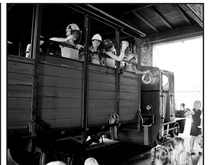
> Uroczysty wjazd pociągu