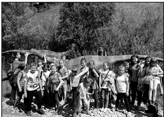
> Uczestnicy wyjazdu z dinozaurami

„Mezo” (występował na tegorocznych „Dniach Jaworzyny Śląskiej”).