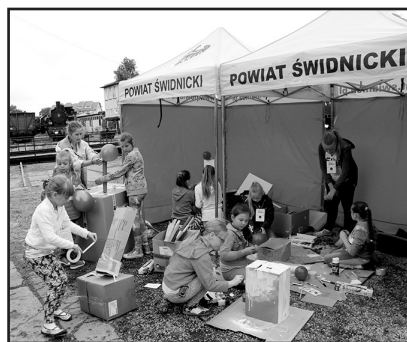
> Każdy mógł wykażać się artystycznie