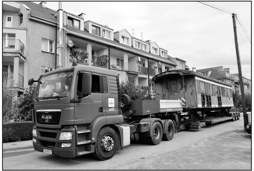
> Sprowadzenie wagonu było dużą operacją logistyczną

noclegowe dla gości i rodzin działkowców, którzy korzystali z Sali działkowca przy okazji różnych imprez organizowanych przez działkowców. Od roku 2004 wagon przestał pełnić swoją pierwotną rolę. W roku 2014 Stowarzyszenie zainteresowało się wagonem, który jak na obecne czasy jest w dość dobrym stanie. Prowadzone rozmowy z Zarządem ROD „Zacisze” przyniosły rezultaty, a wagon w roku 2015 sprzedano SMKJ za symboliczną kwotę. Stowarzyszenie dotarło do fabrycznych rysunków wagonu oraz producenta, którego jest firma StEG Simmering Austria. Wagon został zbudowany w roku 1904.