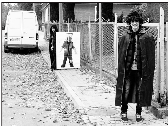
> Niespodziewanych gości można było spotkać na ulicach miasta

z Rycerzem. Zadania wpisywały się w historię Jaworzyny Śląskiej – trzeba było, bowiem odnaleźć „Bajkę”, w której dawniej oglądano bajki oraz tablicę pamiątkową, na której