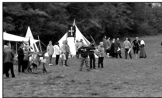
> Widzowie mogli m.in. postrzelać z łuku

Oprócz pokazów, widzowie mieli okazję sami przekonać się o