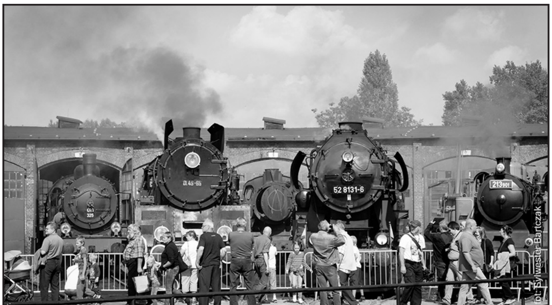
> Parowozy w pełnej krasie

Po raz pierwszy zwiedzający mogli także zapoznać się z pojazdami, w których zastosowano napęd parowy – walcami drogowymi, samochodem Brozka czy motocyklami, które również korzystały z pary.