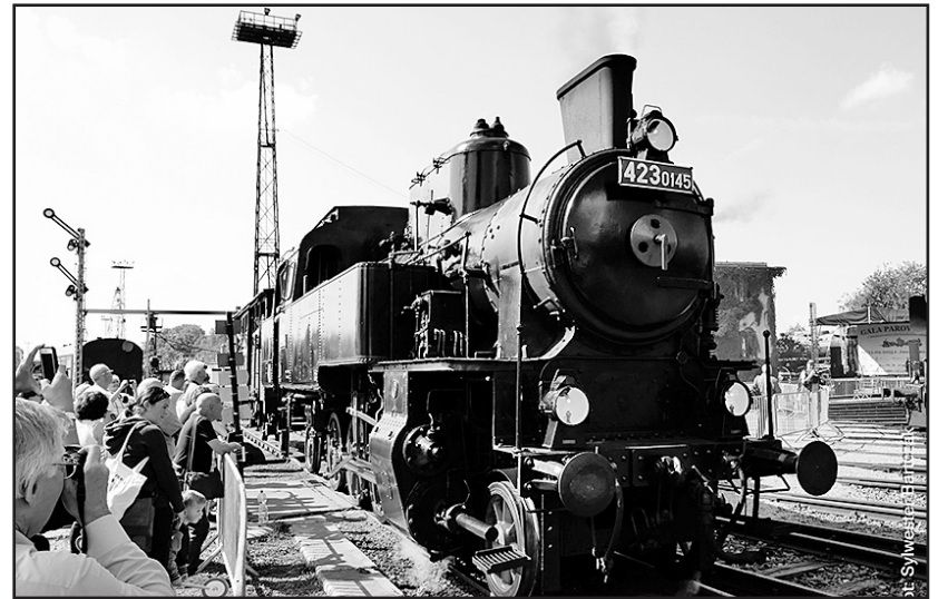
> Gala cieszyła się dużym zainteresowaniem

Organizowana przez Muzeum Przemysłu i Kolejnictwa impreza jest największą plenerową imprezą w tej części kraju, a w tym roku na jej sukces z pewnością wpływały również doniesienia o tzw. „złotym pociągu”, który kilkanaście kilometrów dalej miał wjechać do tunelu pod koniec wojny i nigdy z niego nie wyjechać. Podczas Gali odbyła się nawet konferencja w tej sprawie, na której rozmawiano o tym znalezisku. O jego historii, ostatniej podróży czy możliwościach kolejowych tamtego terenu.