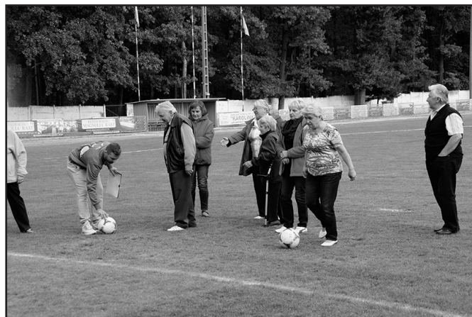
> Dzień sportowy odbył się na stadionie

Po południu, na Stadionie Miejskim odbyły się zabawy sportowe, zorganizowane przez członków