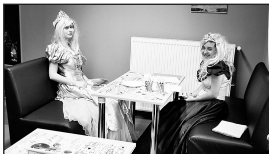
> Uczestnicy mogli wcielić się w różne postaci

znajduje się nazwisko autora książki pt. „O krasnoludkach i sierotce Marysi”.