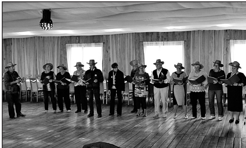
> Zakończenie Dni Seniora w Magnoli

sumowanie I Jaworzyńskich Dni Seniora, które odbyło się w Restauracji „Magnolia”. Na uroczystość przybyli licznie seniorzy