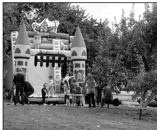
> Na dzieci czekały dmuchańce

wodzeniem cieszyła się strefa „dmuchańców” dla dzieci i loteria fan-