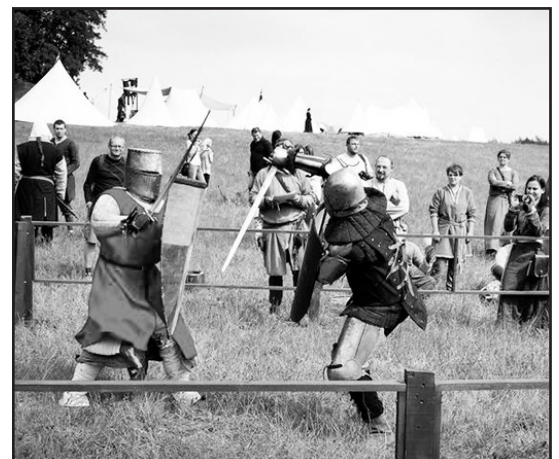
> Inscenizacja walki rycerskiej