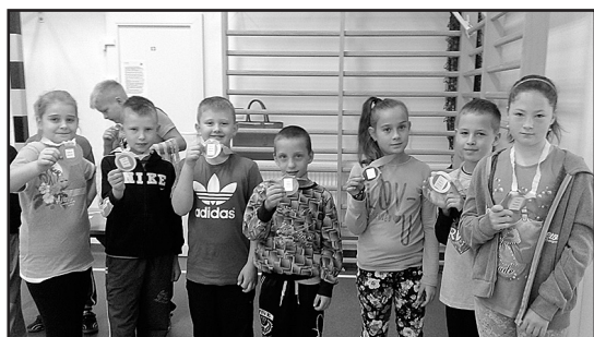
> Zwycięcy w konkursie

otrzymać medal Mistrza. Wszyscy uczniowie chętnie odpowiadali. Nad przebiegiem całego konkursu czuwało jury – uczniowie klasy piątej, którzy przygotowali medale dla zwycięzców i przeprowadzili konkurs.