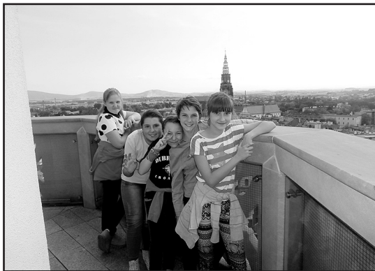
> Widoki z wieży ratuszowej były imponujące

sta i najbliższej okolicy z wysokości 38 metrów. Pogoda zdecydowanie dopisała, więc widoki