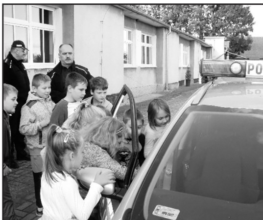
> Radiowóz policyjny był dużą atrakcją spotkania

mat bezpieczeństwa. Policjanci w rozmowie z dziećmi uczyli, co robić, jak się zachować, a przede wszystkim jak nie dopuścić do niebezpiecznych sytuacji. Prelekcja miała charakter rozmowy z dziećmi, które mogły wypowiedzieć się o swoich odczuciach czy doświadczeniach. Na koniec, oczywiście w formie żartów, naj-