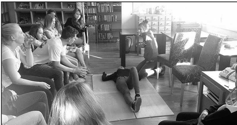
> Na szkoleniu uczono się m.in. udzielania pierwszej pomocy

znania tego tajemniczego okresu. Różnego rodzaju inscenizacje, bitwy rycerskie, tańce, obozowiska, potrawy oddające ducha tego okresu, świadczyły o atrakcyjności tego wydarzenia. Oprócz miejscowej ludności zjechało na niego wielu wojów i białogłowy.