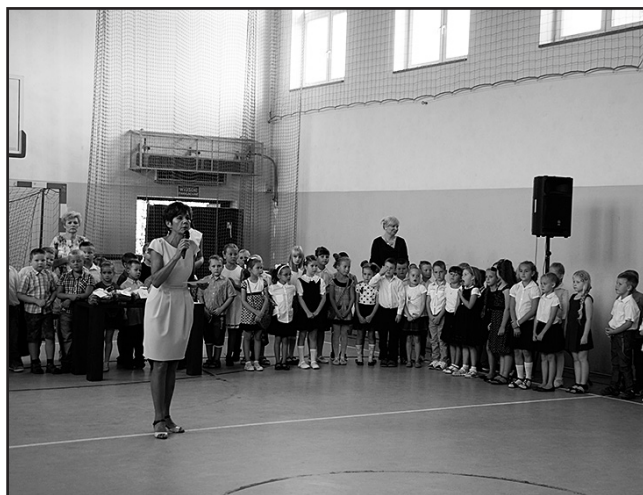
> Pani Dyrektor Szkoły Podstawowej w Jaworzynie Śląskiej wita pierwszoklasistów

Pierwszoklasistom, wszystkim uczniom oraz nauczycielom i pracownikom szkół życzymy samych sukcesów i uśmiechu, aż do następnych wakacji.