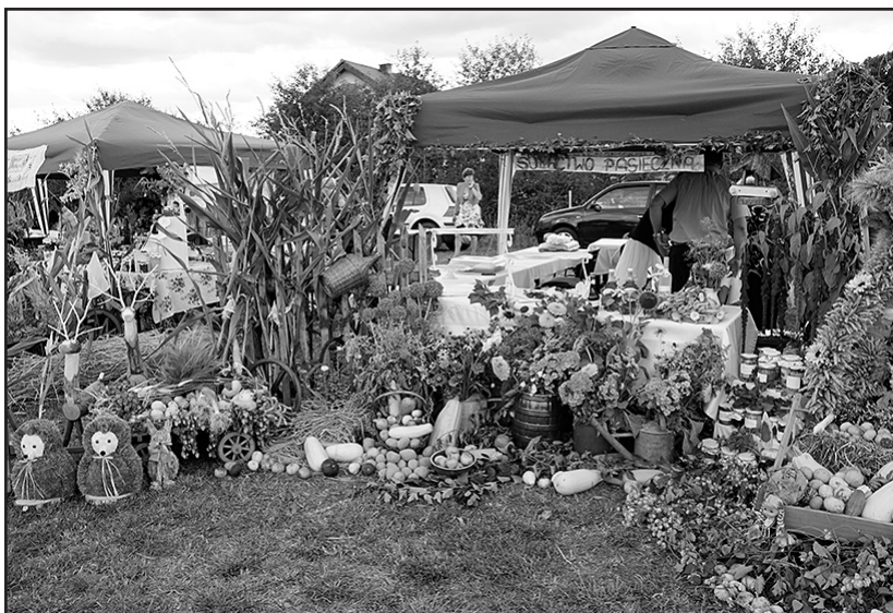
> Wszystkie stoiska zachwyciły swoim wykonaniem

najładniejsze stoisko. Zaskakujące pomysły, wspaniałe rękodzieła i dekoracje, a także różnorodność i oryginalność potraw nie ułatwiły jury decyzji. Ostatecznie komisja zdecydowała, że nagrody (sprzęt AGD) za najładniejsze stoisko powędrują do: Milikowic – I miejsce, Piotrowic Świdnickich – II miejsce i Czech – III miejsce. Komisja zdecydowała się również nagrodzić trzy najsmaczniejsze produkty lokalne. Swoim smakiem jury zachwyciły: kaczka i kapusta z golonką z Bolesławic, chleb swojski i swojska kiełbasa z Pasiecznej oraz „Specjał Sołtysa” ze Starego Jaworowa.