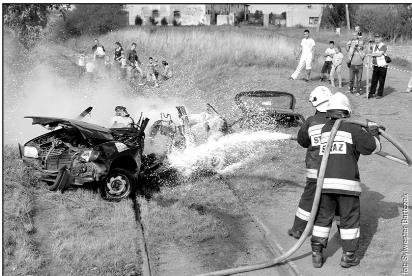
> Samochód został doszczętnie zniszczony

do akcji ratunkowej. Cała inscenizacja miała charakter maksymalnie realistyczny, tak, aby uzmysłowić oglądającym stopień zagrożenia nieodpowiedzialnego przekraczania przejazdów kolejowych. Zebrani na miejscu mieli okazję na własne oczy zobaczyć, jak daleko posunięte mogą być konsekwencje brawury i nieostrożności w takich miejscach. Była to także okazja do skoordynowanych ćwiczeń naszych służb ratunkowych w przypadku takiego zdarzenia.