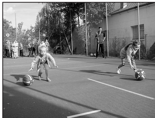
> Najmłodsi mogli sprawdzić się w wielu konkurencjach

stwierdzili, że widzą wśród najmłodszych swoich następców, którzy w przyszłości przejmą na siebie zobowiązanie ratowania ludzi w nagłych wypadkach. Popis swoich umiejętności kulinarnych dał także sołtys wsi Pasieczna, który dzielnie przygotowywał grillowe specjalne.