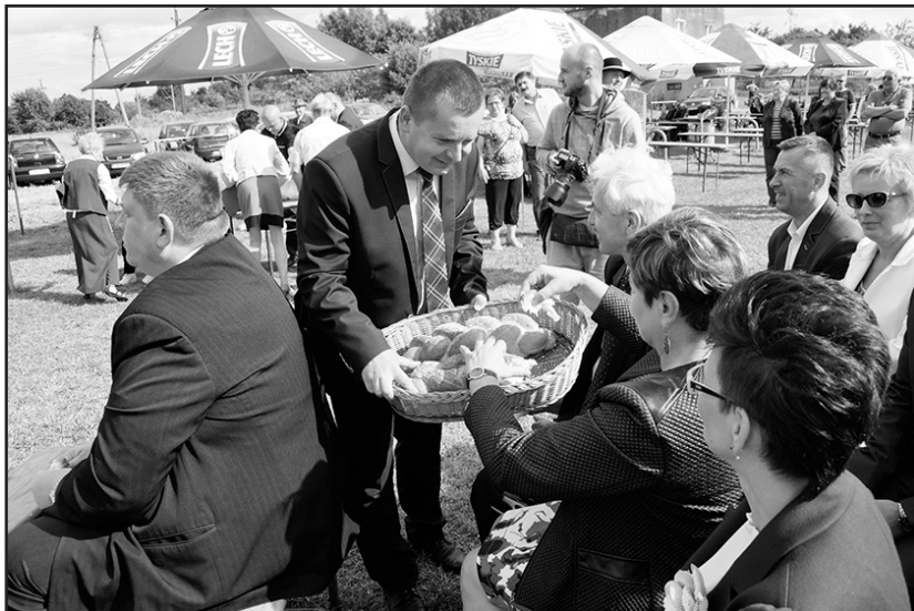
> Burmistrz pełnił rolę gospodarza

W części artystycznej wystąpiły zespoły ludowe. Na scenie zaprezentowali się „Jaworzynianie” oraz zespół folklorystyczny z gminy partnerskiej – Markt Pfeffenhausen, który szczególnie zachwycił publiczność pięknymi tańcami, strojami i spektakularnymi strzałami z batów.