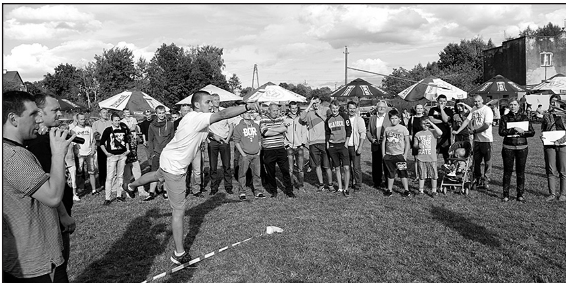
> Konkursom przyglądało się wielu kibiców

Jak co roku, podczas zabaw dożynkowych, dzieci mogły zjeżdżać na olbrzymiej zamkowej zjeżdżalni i korzystać z innych urządzeń rozrywkowych. Wieczorem przyszedł czas na zabawę taneczną, której oprawę muzyczną przygotował zespół Stan Band.