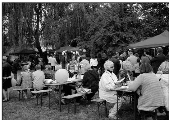
> Festyn przyciągnął wielu mieszkańców