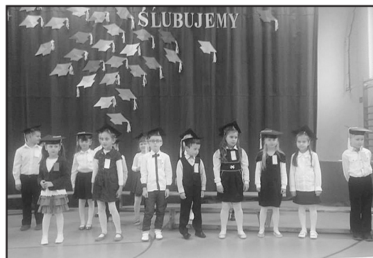
> Apel z okazji Dnia Edukacji Narodowej

i Starym Jaworowie odbyły się uroczyste pasowania i ślubowania pierwszoklasistów. Była to wyjątkowa uroczystość dla społeczności tych szkół, ale przede wszystkim dla ślubujących i ich rodziców.