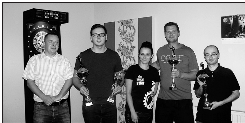
> Uczestnicy zawodów z trofeami

w zawodach, w których wzięło udział 13 osób z całego Powiatu Świdnickiego, była zacięta. Zawodnicy rywalizowali o puchar, ufundowany przez Burmistrza Jaworzyny Śląskiej.