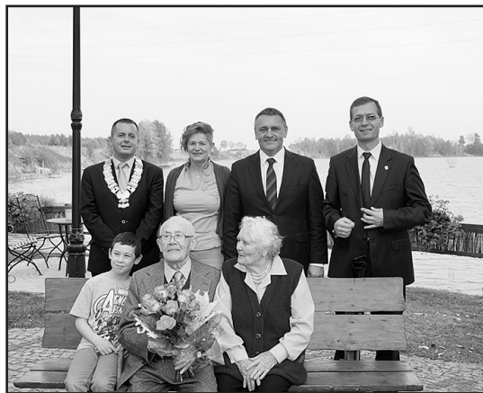
> Jubilat z żoną i gośćmi

gdy żartował ze zaproszonymi gośćmi. Niewykluczone, że wpływ na formę Pana Szczepana ma jego żona, z którą łączy dzień świątowań będą 70-tą rocznicę ślubu. Część „oficjalną” uroczystości zakończyło wspólne zaśpiewanie „200 lat” Jubilatowi i wzniesienie okolicznościowego toastu.