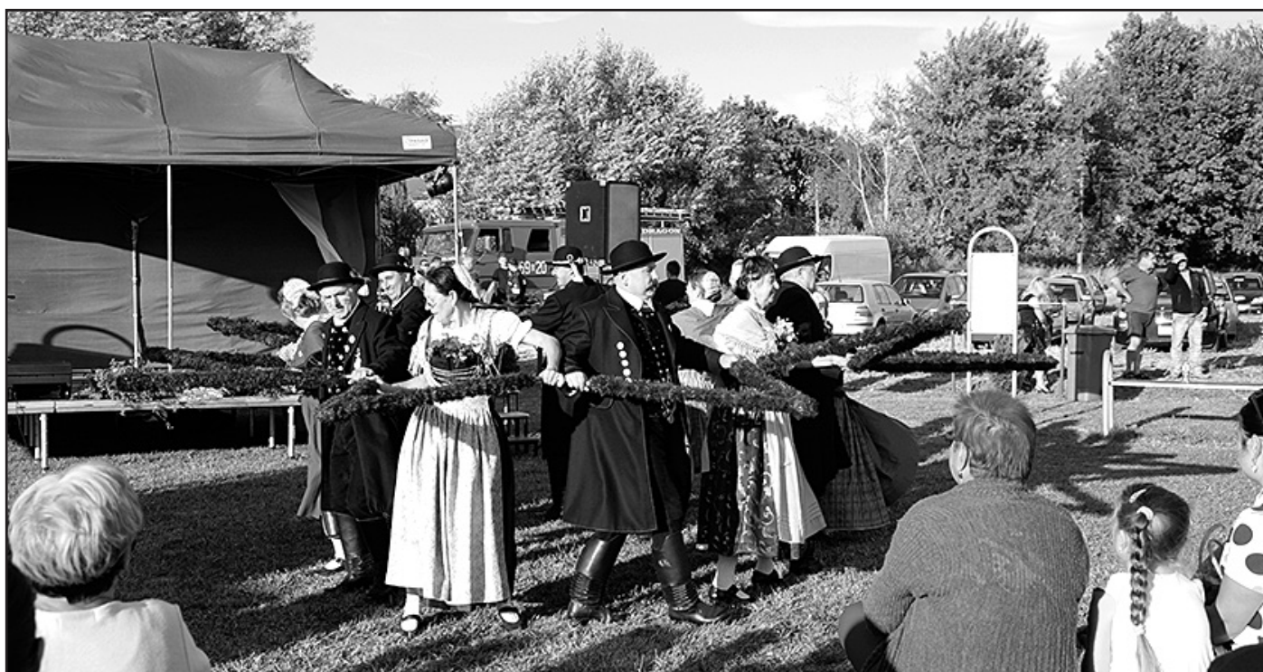
> Delegacja z Niemiec podczas występów artystycznych