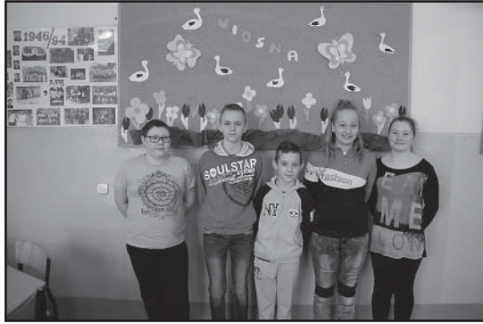
> Uczniowie 6 klasy Szkoły Podstawowej w Pastuchowie

próbnych. Porównując dwie części egzaminu odpowiedziały, że część z języka angielskiego przysporzyła im więcej trudności, ale są dobrej myśli. W podobnym tonie wypowiedzieli się uczniowie SP w Pastuchowie. Rafał Bie-