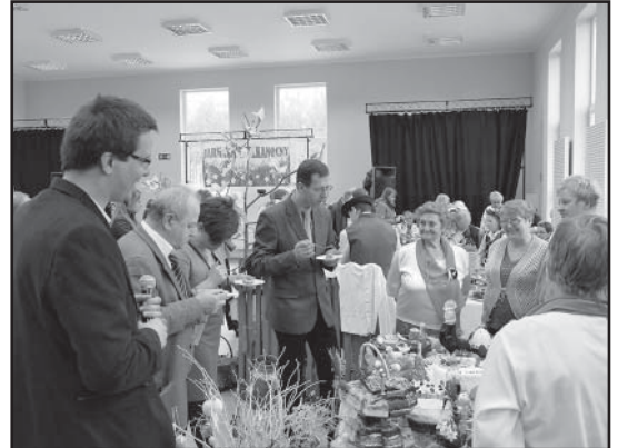
> Komisja konkursowa podczas degustacji potraw wielkanocnych

Impreza ta była także okazją do wręczenia nagrody dla