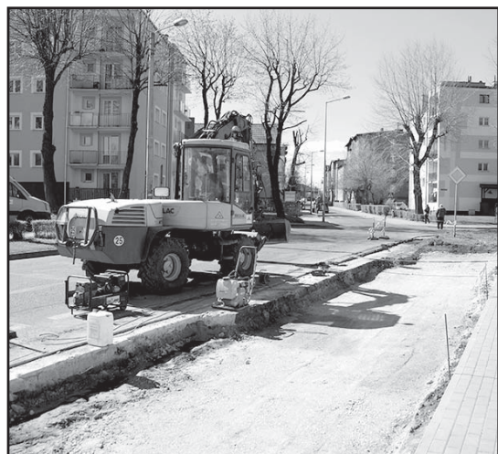
> Prace przy budowie parkingu

Prace wykonuje Służba Drogowa Powiatu Świdnickiego.