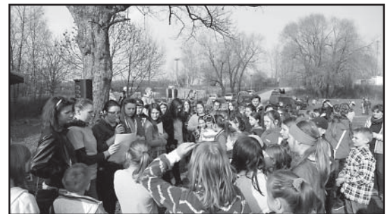
> Przywitanie wiosny na żwirowni

Ostatecznie werdykt jury konkursu przedstawiał się następująco: