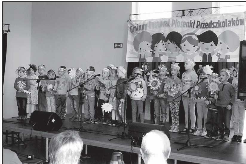
> Najmłodszy podczas występów scenicznych