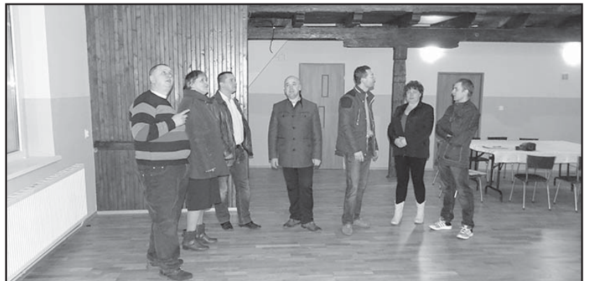
> Władze miasta odbierają wykonane prace na świetlicy.tif

Wartość realizowanego zadania wynosi 424 572,70 zł. Projekt finansowany jest w całości ze środków Unii Europejskiej w ramach Europejskiego Funduszu Społecznego.