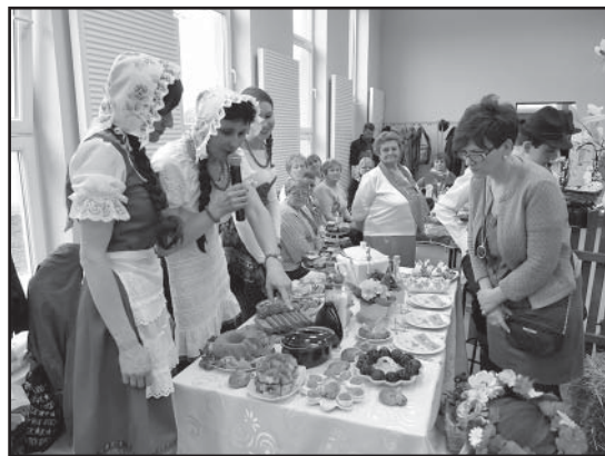
> Prezentacja stołów wielkanocnych

i Biblioteki Publicznej, były trudne ze względu na wysoki poziom nadesłanych prac. Ostatecznie podjęto następujący werdykt: