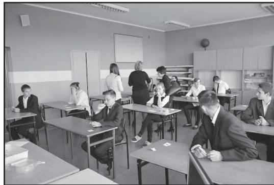
> Gimnazjaliści rozpoczynają egzamin

wej kształcenia ogólnego. Składał się on z trzech części: humanistycznej, matematyczno-przyrodniczej, a także z języka obcego nowożytnego. Egzaminy miały formę pisemną. Przystąpienie do egzaminu jest warunkiem ukończenia gimnazjum, ale nie określa się minimalnego wyniku, jaki zdający powi-