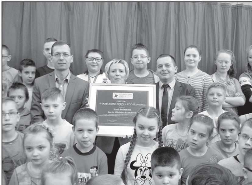
> Społeczność Szkoły Podstawowej w Pastuchowie z wyróżnieniem

Serdecznie gratulujemy laureatom, i życzymy kolejnych sukcesów.