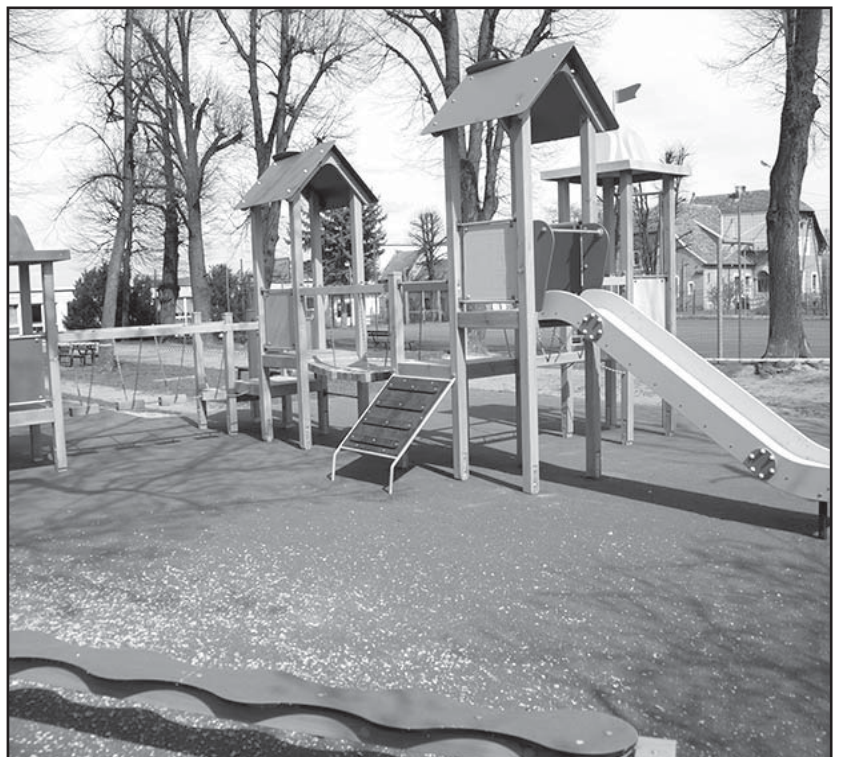
> Nowy plac zabaw przy szkole w Pastuchowie