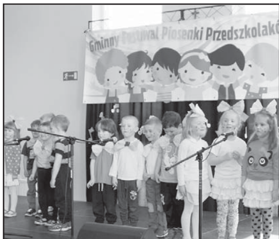
> Puchatki zajęły ex aequo pierwsze miejsce w najmłodszej kategorii

Każdy z uczestników konkursu oprócz pamiątkowego dyplomu otrzymał słodki upominek w podziękowaniu za występ, natomiast laureaci Festiwalu otrzymali nagrody rzeczowe.