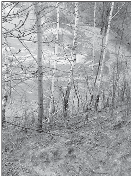
> Plamy zanieczyszczeń na wodzie

jaki sposób doszło do zanieczyszczenia. Mając na względzie troskę o tą uroczą część naszej gminy, służąc nam wszystkim, zwracamy się z apelem do mieszkańców, aby w przypadku, gdy zaobserwują, niepokojące zachowania osób zmierzające do zanieczyszczenia akwenu nie wahały się informować o tym organy odpowiedzialne za bezpieczeństwo nas wszystkich. Nie będzie to bowiem donosicielstwo, a troska o dobro wspólne jakim jest przyroda i środowisko naturalne.