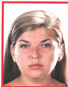
prześwieceniemia od tła