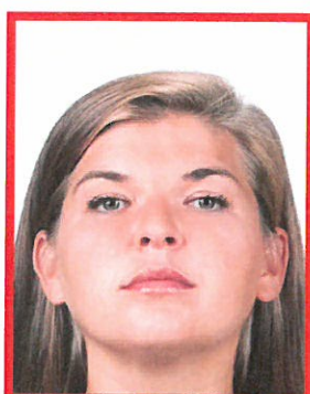
tz. żabia perspektywa