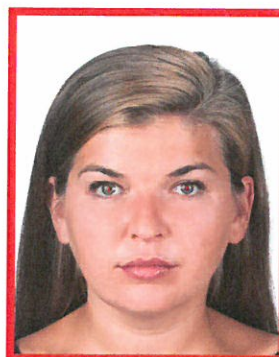
efekt czerwonych oczu