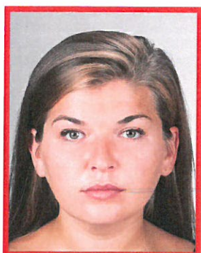
niejednolicie oświetlone tło

Tło białe oświetlone jednolicie, pozbawione cieni i elementów ozdobnych. Zdjęcie musi pokazywać tylko osobę fotografowaną (żadne inne osoby lub przedmioty nie mogą być widoczne).