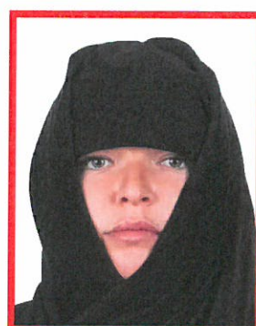
osoba z nakryciem głowy i twarzy