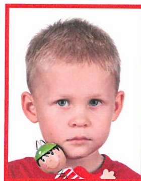
zabawka zakrywająca część twarzy

Należy pamiętać, że w przypadku dzieci do piątego roku życia nie są wymagane zdjęcia wykonywane według zasad obowiązujących przy fotografii osób pozostałych.