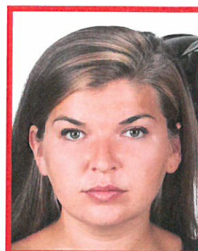
widoczny przedmiot w tle