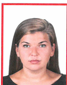
zbyt mała twarz