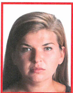
nierównomierne oświetlenie twarzy

Twarz musi być oświetlona równomiernie. Niedopuszczalne są refleksy (odbicia światła na skórze czy włosach powodujące białe plamy w tych miejscach) oraz cienie na twarzy.