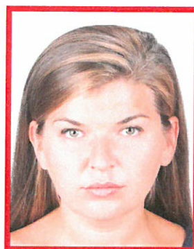
zdjęcie za jasne