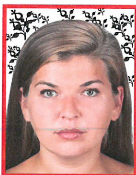
widoczny wzór na tle