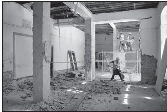
> Prace wewnątrz budynku dworca idą pełną parą

Modernizacji zostanie poddana część związana z obsługą podróżnych. W holu pełniącym funkcję poczekalni wykonawca wymieni posadzki, pomaluje ściany, zamontuje nowe oświetlenie, ławki i kosze na śmieci.