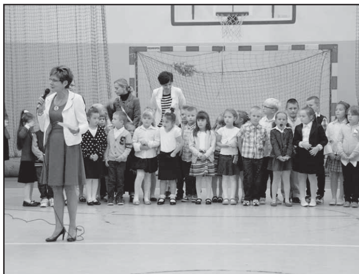
> Uroczyste rozpoczęcie roku szkolnego w Szkole Podstawowej w Jaworzynie Śląskiej

życzymy samych sukcesów i uśmiechu aż do kolejnych wakacji.