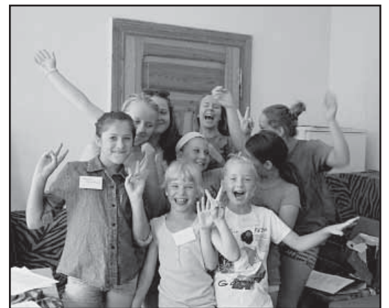
> Nie ma wątpliwości, że Kongres Dzieci przysporzył najmłodszym wiele radości