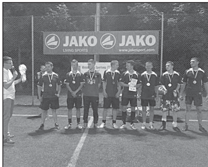
> Zwycięzcy tegorocznego nocnego turnieju - drużyna Absolwent Pasieczna