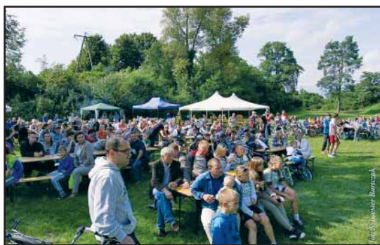
> Po zmaganiach odpoczynek w parku