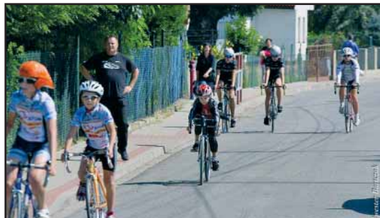
> Młodzi adepci kolarstwa na trasie wyścigu

Impreza była wspólną inicjatywą Miejskiego Klubu Sportowego „Karolina” oraz Stowarzyszenia „Nowice – Nasza Wieś”. Wyścig był również okazją do świętowania 50-lecia powstania sekcji kolarskiej MKS „Karolina”.