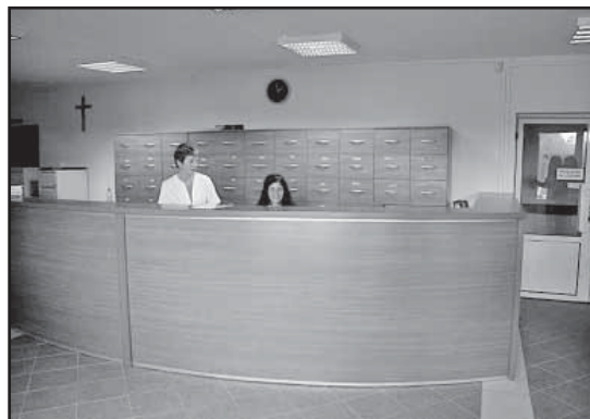
> Rejestracja w przychodni w nowej odsłonie

lacji elektrycznej wraz z oprawami oświetleniowymi, wymianę grzejników, wykonanie gładzi na ścianach i ich malowanie, wykonanie wiatrołapu, wymianę płytek wraz z cokołami na klatce schodowej oraz malowanie ścian klatki schodowej. Centralnym punktem na parterze będzie gruntownie zmieniona rejestracja. Wykonawcą prac remontowych była jaworzyńska firma RENODEKO, a wartość wykonanych prac zamknęła się kwotą ok. 100 000 zł.