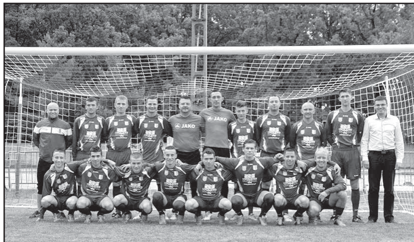
> Drużyna seniorów MKS Karolina