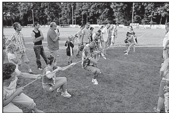
> Jedną z atrakcji pikniku była rywalizacja w przeciąganiu liny