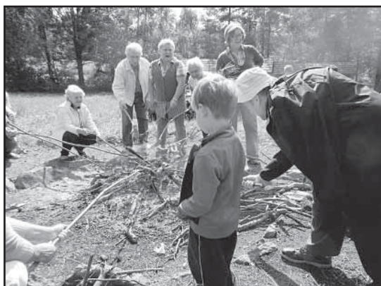
> Wspólne ognisko

Kolejną, trzecią już imprezą w ramach „Projektu Jaworzyna 60 +” realizowanego przez Fundację Spi-