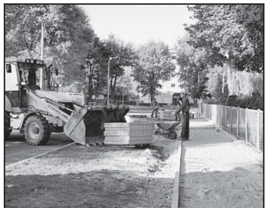
> Wykonawcą chodników w obrębie ulic Ogrodowej i Westerplatte była spółka gminna - ZUK

zniszczonej i nierównej nawierzchni chodnika na kostkę betonową w szarym kolorze.