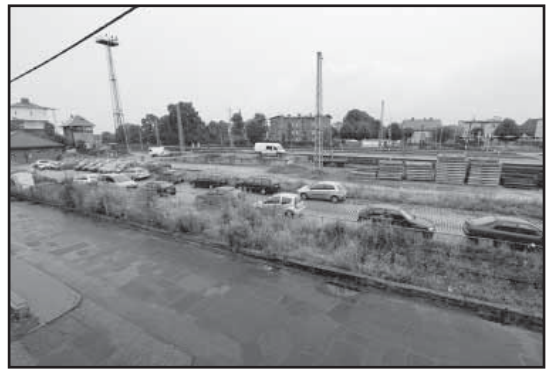
> Czas pokaże czy w tym miejscu powstanie parking z prawdziwego zdarzenia