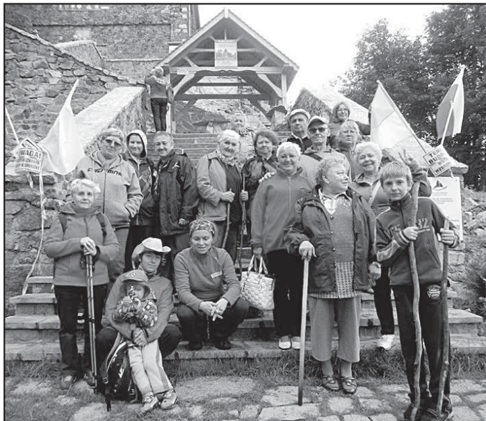
> Uczestnicy wycieczki przed kościołem w Sulistrowicach

Aktualnych informacji można szukać na stronie projektu - www.jaworzyna60plus.pl oraz pod numerem telefonu (+48) 530165873.