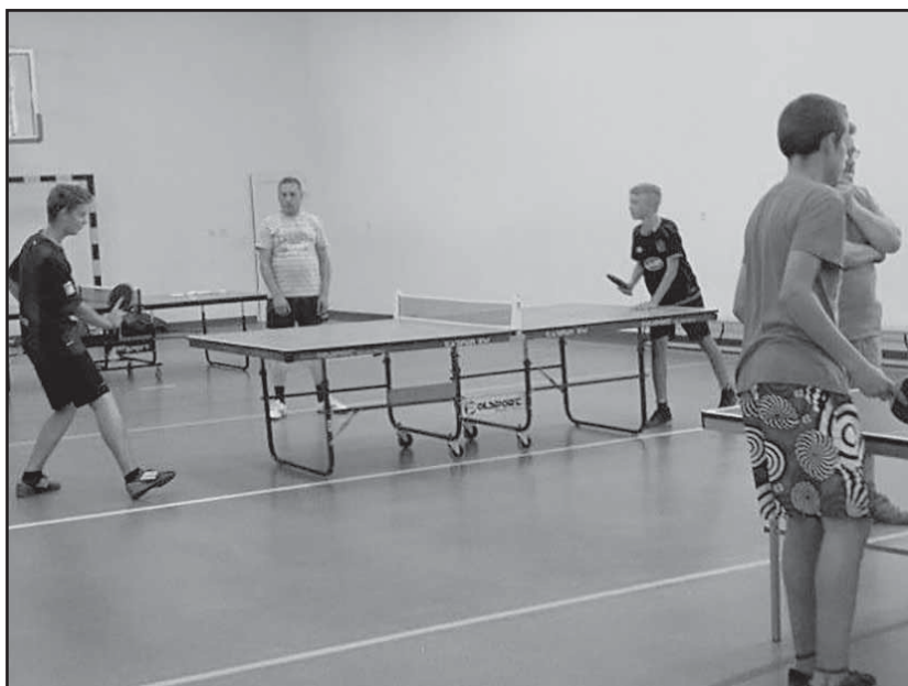
> Rywalizacja w tenisie stołowym cieszyła się dużym zainteresowaniem