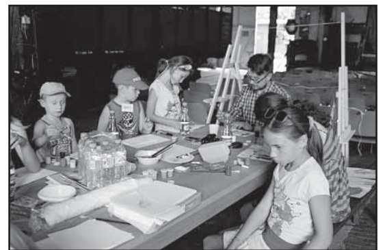
> Zajęcia plastyczne w ramach jednego ze zorganizowanych warsztatów

28 i 29 lipca 2014 roku w zabytkowej hali parowozowni Muzeum Przemysłu i Kolejnictwa w Jaworzynie Śląskiej odbył się Pierwszy Kongres Dzieci. Uczestniczyły w nim dzieci w wieku od 7 do 14 lat. Impreza nawiązywała do Miasta Dzieci, które w minionych latach było organizowane na terenie jaworzyńskiego Muzeum.