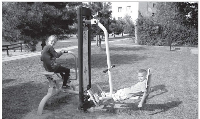
> FitPark największym zainteresowaniem cieszy się wśród najmłodszych

nym powietrzu, która cieszy się dużym zainteresowaniem mieszkańców. Nowością jest również uruchomienie strony internetowej (adres: www.osiedlejaworzyna.pl ), na której publikowane będą informacje dotyczące wydarzeń „osiedlowych”.