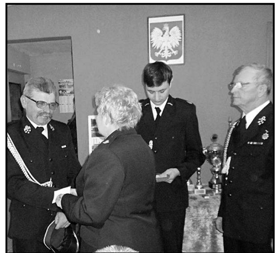
> Doroczne zebrania strażackie są okazją do podziękowań i wyróżnień

Przebieg zebrań bywa czasami burzliwy, jednakże dyskusje te mają na celu poprawę bezpieczeństwa lokalnej społeczności oraz poprawę efektywności działania i bezpieczeństwa strażaków ochot-