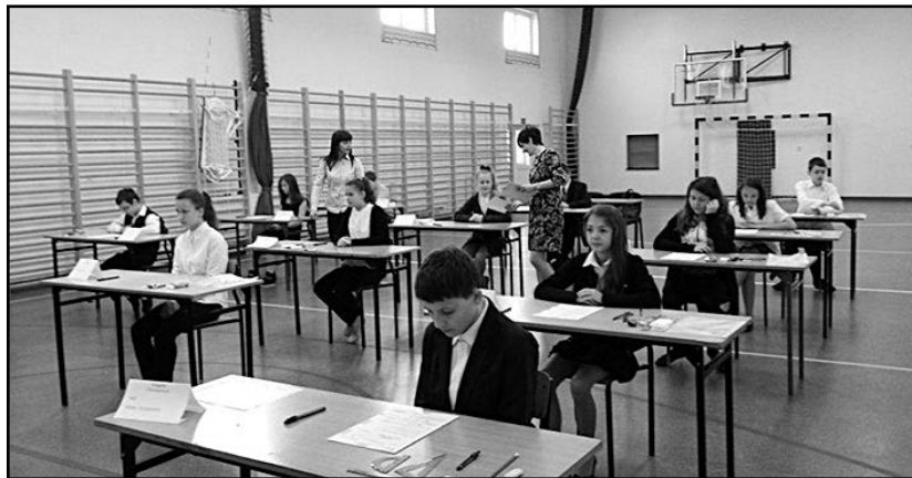
> Uczniowie ze Szkoły Podstawowej w Pastuchowie rozpoczynają rozwiązywanie testu