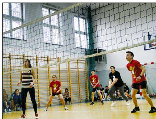
> Drużyny wystąpiły w mieszanych składach

Każda z drużyn otrzymała pamiątkowy puchar. Czołówka za zdobyte miejsce, czyli MRG Długoleka, MRM Świebodzice oraz MRM Jaworzyna Śląska – za udział w turnieju. Po finale tradycyjnie już rozegrano pokazowy mecz, pomiędzy drużyną samorządowców a reprezentacją złożo-