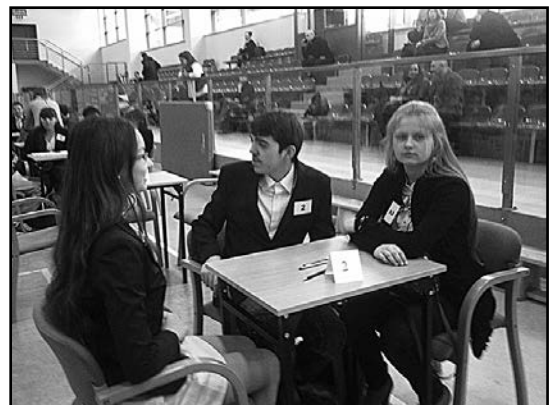
> Reprezentanci naszego Gimnazjum na konkursie w Karpaczu

ników. Po częściach oficjalnych spotkań przychodzi czas na rozmowy i integrację we własnym gronie.