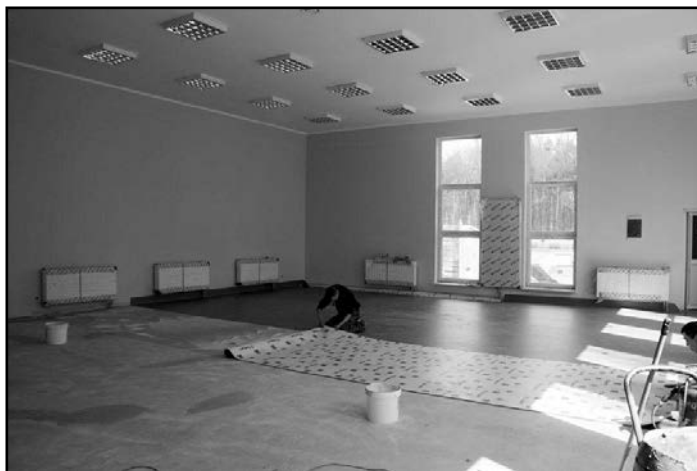
> Prace wykończeniowe w obiekcie na Stadionie Miejskim

Roboty budowlane zaczęły się w kwietniu 2013 roku. Ich roz-