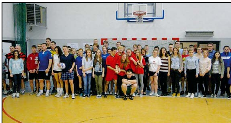
> Uczestnicy Turnieju Młodzieżowych Rad Miejskich

Na koniec warto dodać, że przy organizacji III Turnieju Młodzieżowych Rad Miejskich w Pilce Siatkowej o puchar Burmistrza pracowało ponad trzydziestu młodych ludzi. Poświęcili Oni swój wolny czas i za to należą Im się wielkie brawa. Pokazali w ten sposób, że młodzież potrafi