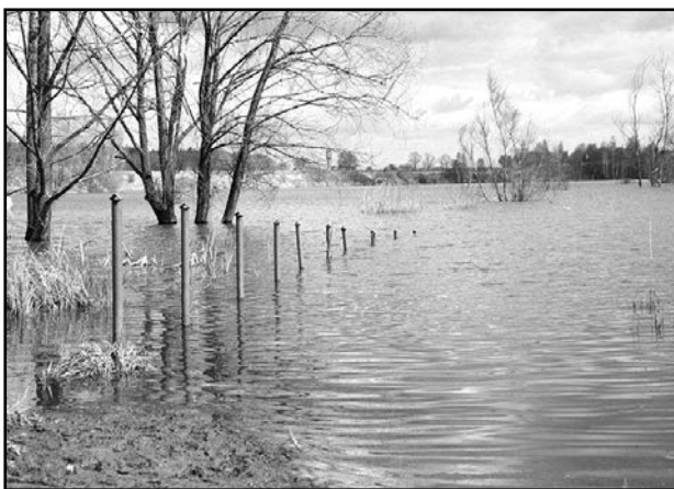
> Wzrasta poziom wody na „Żwirowni”

Żwirownia – łowisko ryb, teren rekreacji, kąpielisko – z tych wszystkich określeń którymi określano teren żwirowni w niedalekiej przyszłości aktualne może pozostać tylko to pierwsze, tj. łowisko ryb. Może tak się stać z powodu podnoszenia się poziomu wód w tym zbiorniku, który zwiększył się już na tyle, że zagraża nawet istniejącej w pobliżu restauracji Magnolia. Gmina podjęła działania mające