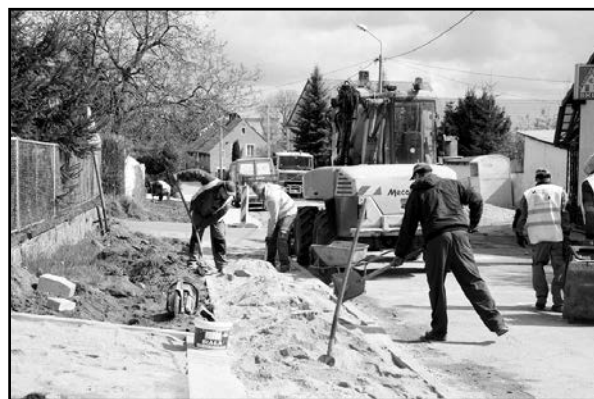
> Prace przy budowie chodników w Starym Jaworowie

Po przeprowadzeniu przetargów rozpoczęły się prace przy budowie nowych chodników w dwóch kolejnych sołectwach. Tym razem są to Milikowice oraz Stary Jaworów. W pierwszej wsi chodnik powstanie przy drogach powiatowych przebiegających przez tę wieś, a w Starym Jaworowie będzie ułożony wzdłuż drogi gminnej. W pierwszej wsi do ułożenia jest blisko 2000 m 2 kostki, a Starym Jaworowie blisko 600 m 2 . Prace wykonawcze rozpoczęto w kwietniu i obejmują one nie tylko ułożenie kostki,