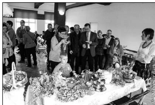
Przygotowanie wielkanocnego stołu to prawdziwa sztuka