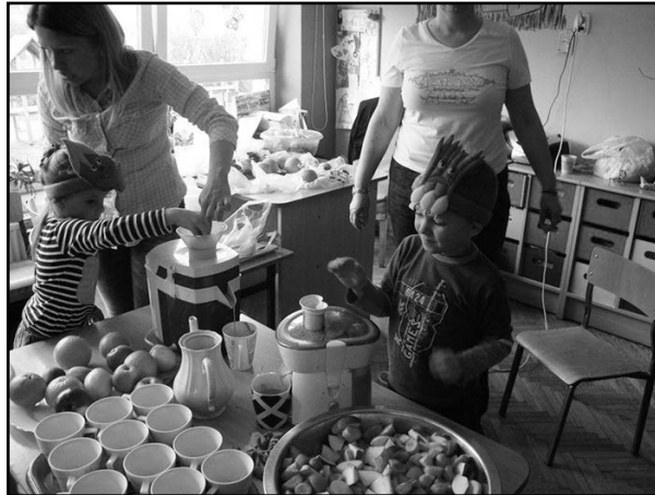
> Linia produkcyjna zdrowych soków owocowych

butelki z wodą zamiast słodkich i sztucznych soków. Z okazji „Dnia Marchewki” dzieci 6-letnie oraz 3 i 4- latki, przyniosły swoje ulubione owoce i warzywa, z których