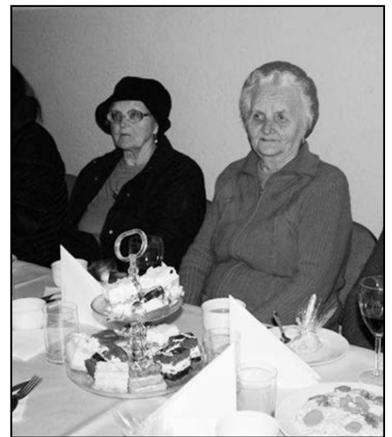
> W Pasiecznej Panie świętowały przy kawie i cięście

niezwykle przyjemnej atmosferze – przy kawie, pysznych ciastach i symbolicznej lampce wina.