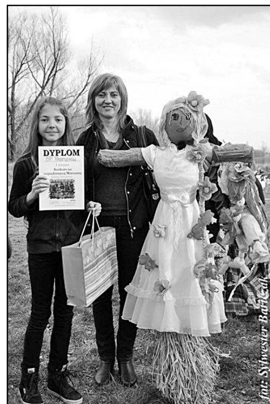
> Marzanna przygotowana przez uczniów ze Szkoły Podstawowej w Pastuchowie