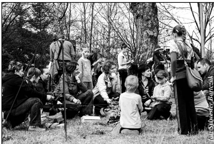
> Pierwsze tegoroczne ognisko