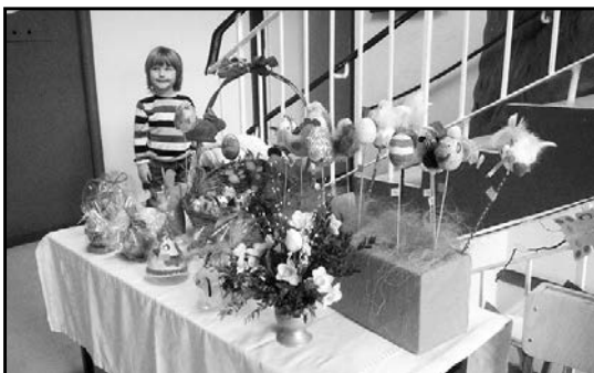
> Efekt pracy przedszkolaków był zachwycający

Przedsięwzięcie okazało się wielkim sukcesem, a nasze przedszkolaki to z pewnością przedsiębiorcze dzieci.