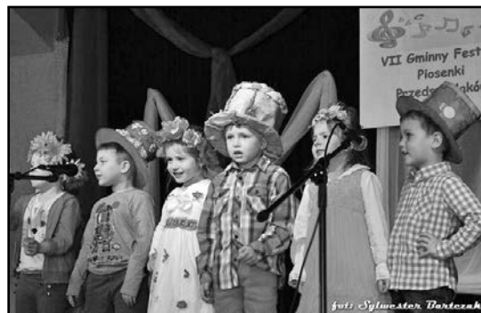
> ... ale i kreacje artystów robiły wrażenie

dziękują za udział w konkursie dzieciom i ich opiekunom i rodzicom.