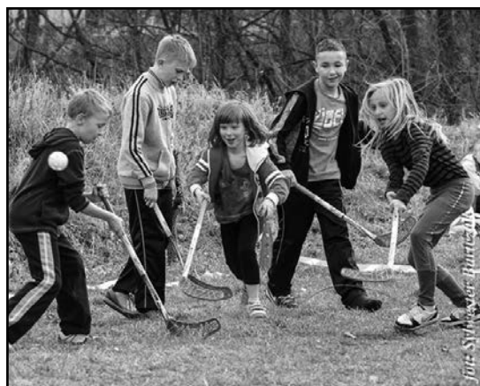
> Nie ma jak to rywalizacja na świeżym powietrzu