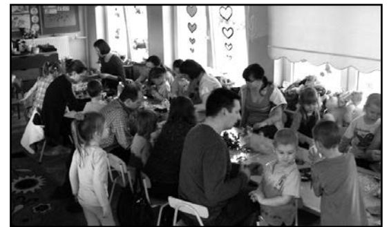
> Przedsiębiorcze przedszkolaki pracowały wraz z rodzicami

Efektem wspólnej pracy był zorganizowany 28 marca Kier-