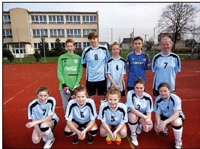
> Drużyna dziewcząt awansowała do kolejnego etapu Coca-Cola Cup

Trzymamy kciuki za nasze drużyny w kolejnych etapach rozgrywek.