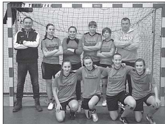
> Drużyna Darboru w komplecie