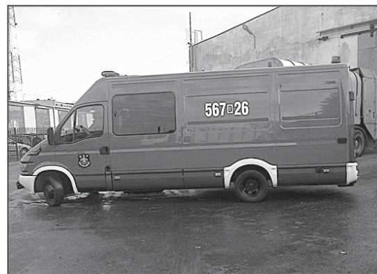
> Nowe auto strażaków z Bolestawic