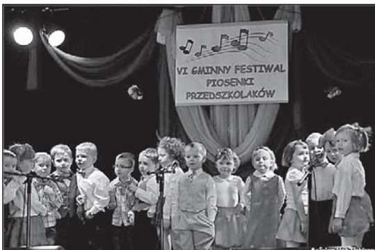
> Ubiegłoroczne występy

graficzne oraz piękne, estradowe kreacje, które wzbogaciły występy o dodatkowe wrażenia. Organizatorzy mają nadzieję, że w tym roku będzie podobnie i zapraszają chętnych do zapoznania się z Re-