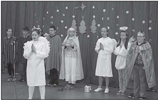
> W przedstawieniu zaangażowało się sporo młodych artystów