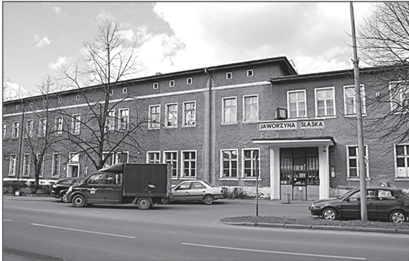
> Jaworzyński dworzec kolejowy - stan obecny

Z przykładowymi realizacjami, w których uczestniczyła firma, która zwyciężyła w przetargu, można zapoznać się na stronie firmy: www.fbdota.pl