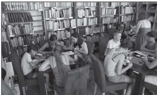
> Biblioteka to nie tylko księgozbiory, ale również miejsce wielu ciekawych zajęć

Początek roku, to okres przygotowywania podsumowań i rozliczeń. Prezentujemy garść statystyk z 2013 roku, dotyczących działalności Biblioteki Publicznej w Jaworzynie Śląskiej.