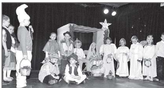
> Jasełka w niecodziennej aranżacji

Pragniemy podziękować wszystkim zespołom za udział w tegorocznym przeglądzie i jednocześnie zapraszamy do udziału w przyszłorocznej edycji jasełkowych zmagani.