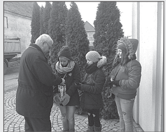
> W tej akcji każdy grosz się liczy

Słowa podziękowania również dla wszystkich wolontariuszy, którzy pomimo zimna i wiatru dzielnie stali z puszkami i rozdawali serduszka.