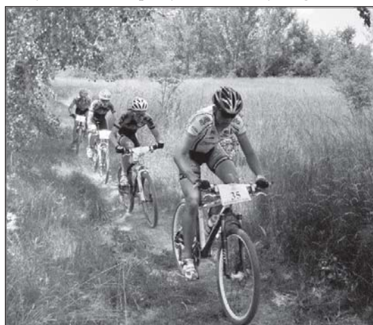
> Uczestnicy MTB na trasie

W 2014 roku sekcja kolarska Miejskiego Klubu Sportowego „Karolina” obchodzi pięćdziesięciolecie swojego istnienia, a oba wydarzenia uświetnią obchody tego jubileuszu.