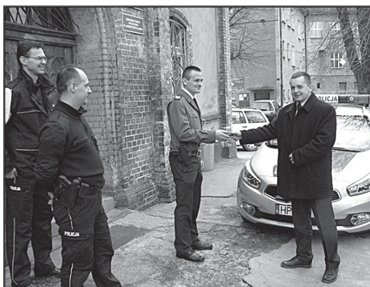
> Samochód będzie służył jaworzyńskim policjantom