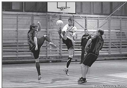
> Poziom rozgrywek na prawdę był wysoki

Mecze były bardzo wyrównane i często padały wyniki remisowe, a niektóre ze spotkań rozstrzygane były dosłownie w ostatnich sekundach. Efektowne bramki, obrony i parady bramkarzy cieszyły oczy zebranych na hali sportowej przy ulicy Powstańców widzów. W ferworze sportowej walki niektórzy druhowie czasami przekraczali zasady fair-play, lecz ich rozpalone głowy natychmiast „gasili” żółtymi kartkami sędziowie zawodów.