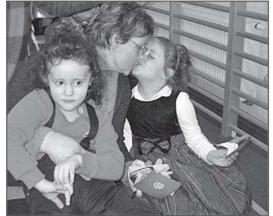
> Nie ma jak to babcia