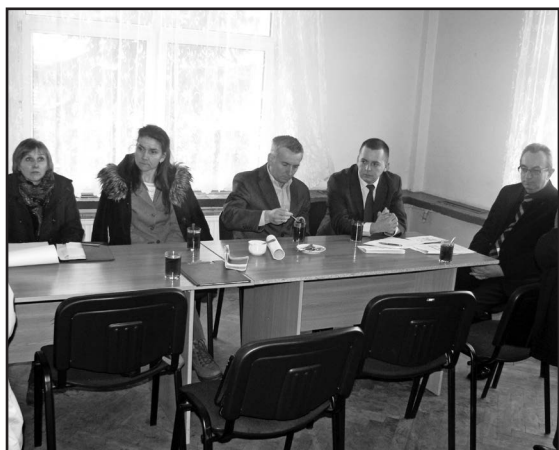
Tematem spotkania było scalanie gruntów