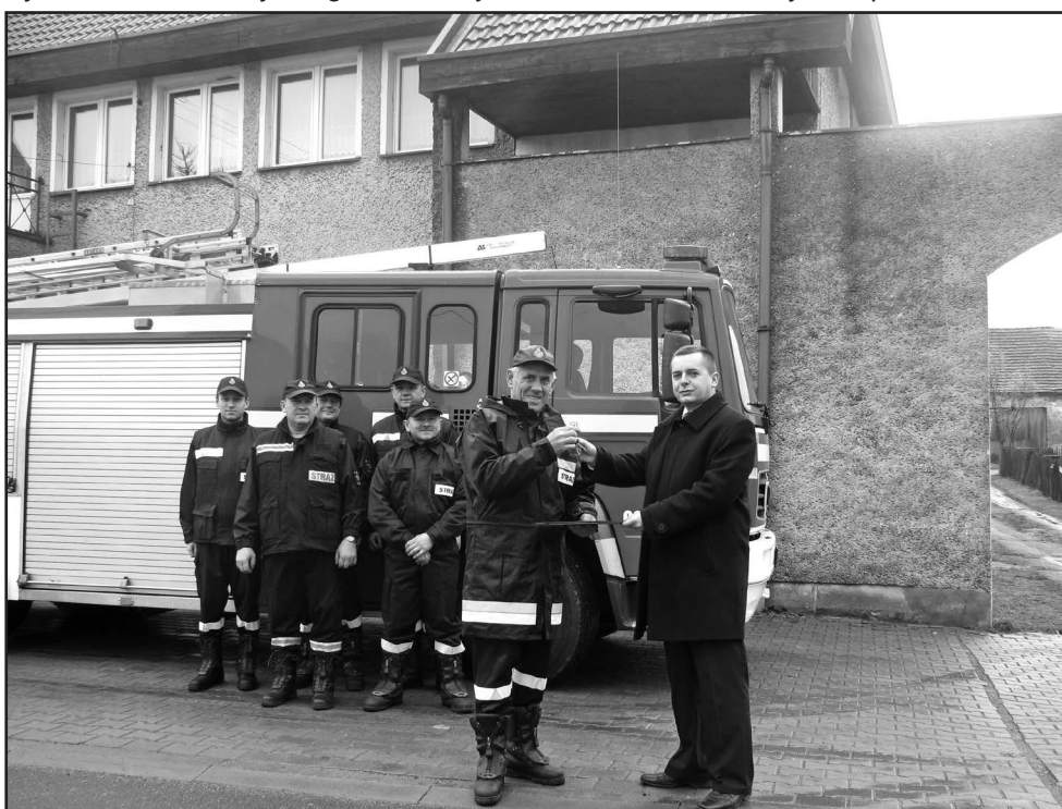
Burmistrz wręczył kluczyki od nowego wozu Prezesowi OSP

przekazany samochód nigdy nie zawiedzie. Prezes OSP Nowice podziękował zarówno władzom gminy za zakup auta, jak i radnym za przeznaczenie na ten cel środków. Zaznaczył, że otrzymany samochód gaśniczy nie tylko przyczyni się do poprawy bezpieczeństwa w naszej gminie, ale pozwoli strażakom ochotnikom z optymizmem patrzeć w przyszłość.