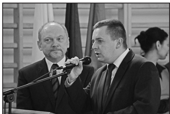
Burmistrz z Przewodniczącym Rady Miejskiej podziękowali wszystkim za współpracę w 2012 r.