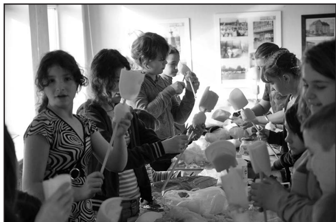
Dzieci samodzielnie wykonały lalki teatralne

upominków dla dzieci uczestniczących w zajęciach oraz Państwu Wychowankom, właścicielom Piekarni