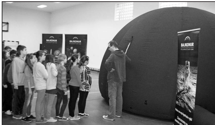
Dzieci podziwiali planety Układu Słonecznego