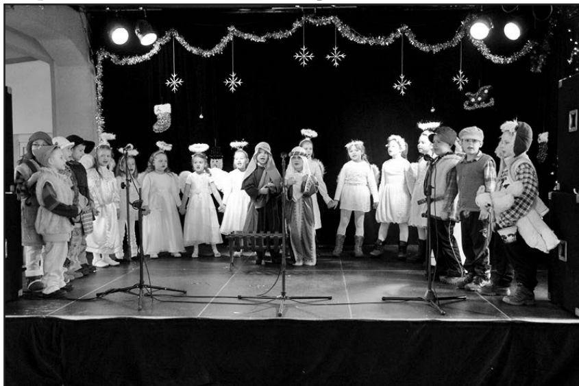
Grupa z Nowego Jaworowa

pów, komisja konkursowa, wyłoniła laureatów tegorocznego Przeglądu. I tak, trzecie miejsce i nagrodę finansową w kwocie 200 zł przyznano „Sowom” z Przedszkola w Jaworzynie Śląskiej. Drugie