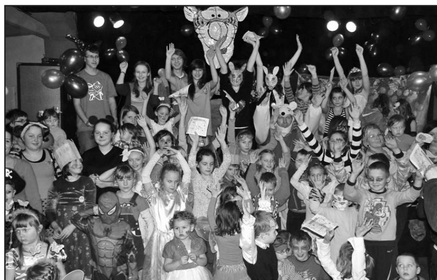
Uczestnicy balu karnawałowego

uczyli się segregować śmieci, układali puzzle i nie tylko. W przerwie odbywały się zabawy i konkursy. Na zakończenie każde dziecko