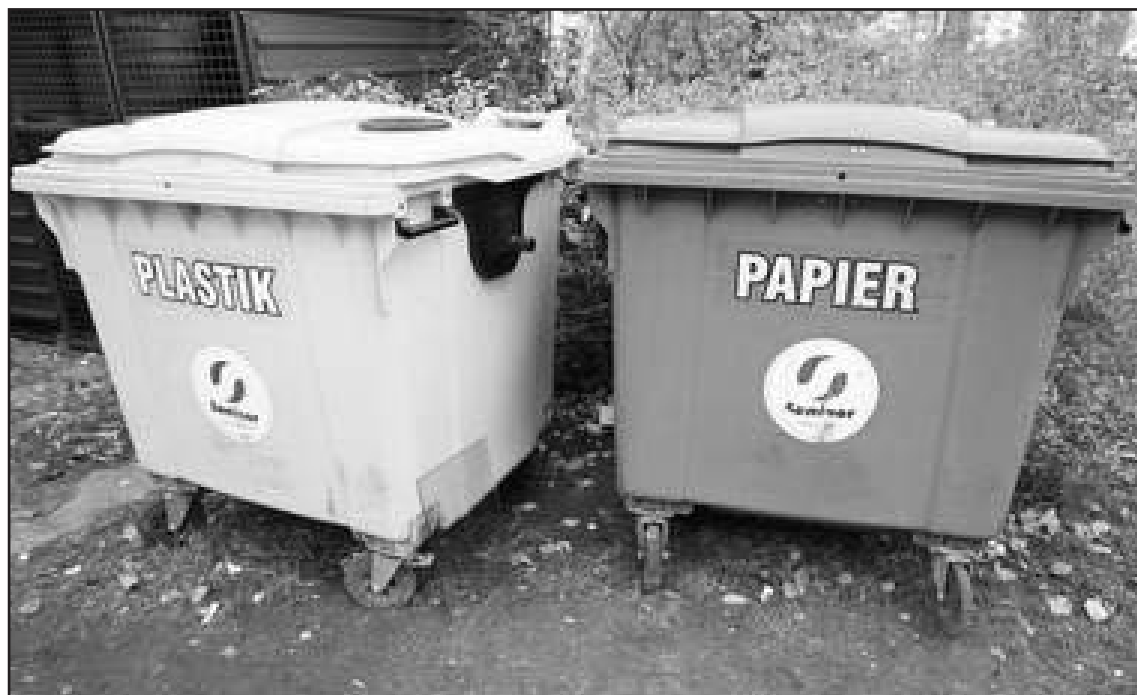
Każdy musi podjąć decyzję, czy samodzielnie będzie sortował śmieci

• Wspólnoty mieszkaniowe powinny wcześniej podjąć uchwały określające, czy będą segregować odpady czy też nie.