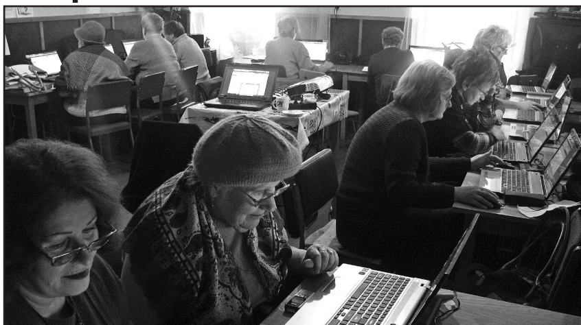
Seniorzy uczą się obsługiwać komputery

skorzystać z programu ASOS 2012/2013 dzięki uprzejmości Stowarzyszenia „Promotor” ze Świdnicy, które realizuje program ministerialny i zgodziło się przeprowadzić kurs w jaworzyńskim Klubie Seniora. Każdy z uczestników ma do dyspozycji swój komputer, który każdorazowo przywożony jest przez opiekuna projektu. Oprac. A.Z.