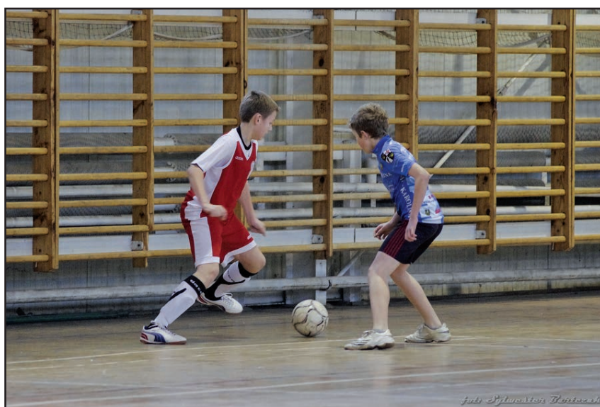
Reprezentanci szkół podstawowych stanęli do rywalizacji w turnieju piłki halowej