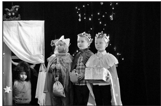
Trzej Królowie przybyli z Przedszkola