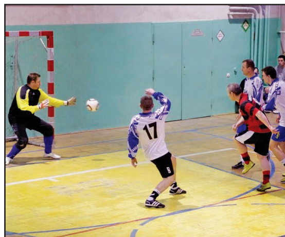
Zawodnicy zacięcie walczyli o dobry wynik

Wydawca: Urząd Miejski w Jaworzynie Śląskiej