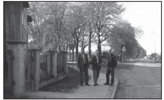
Odbiór chodnika na ul. Kasztanowej