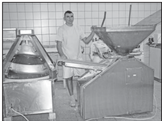
Tu odbywa się jeden z etapów produkcji chleba