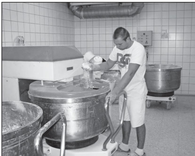
W tym urządzeniu znajduje się zakwas naturalny

A.Z.: Dlaczego zatem inne piekarnie nie mają takiego za-