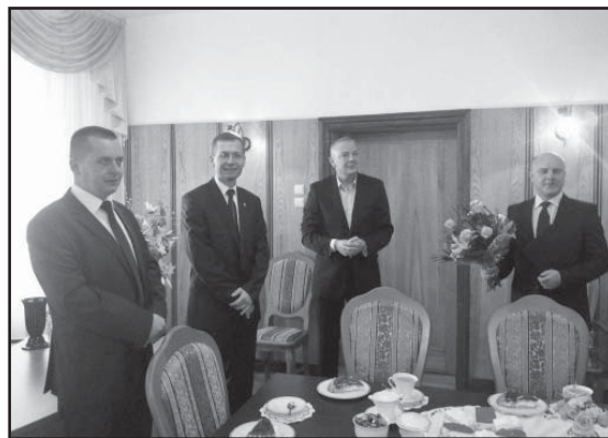
Burmistrz i Zastępca Burmistrza podziękowali Dyrektorom placówek oświatowych za ich pracę