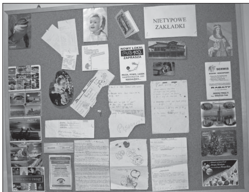
Wśród zakładek znalazło się dużo klasówek