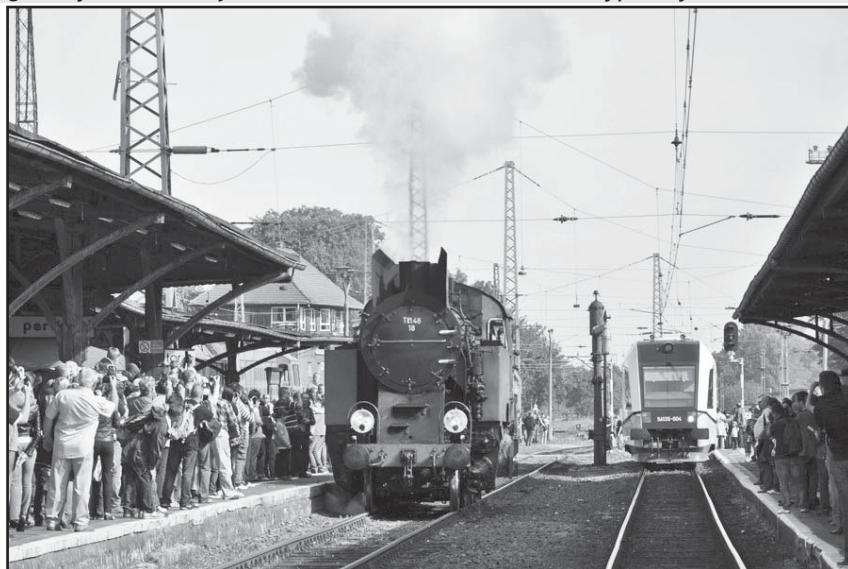
Wjeżdżające parowozy na jaworzyńską stację wzbudziły ogromne zainteresowanie

święto mieszkańców naszej Gminy i to oni powinni być jej adresatem, a przez to jej głównym beneficjen-