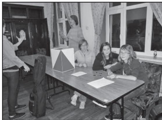
Komisja czuwała nad prawidłowym przebiegiem głosowania

Wszystkim startującym w wyborach gratulujemy osiągniętego wyniku, a zwycięzcom życzymy wytrwałości i sumienności w wykonywaniu obowiązków i wypełnianiu mandatu radnego. Młodzi Rad-