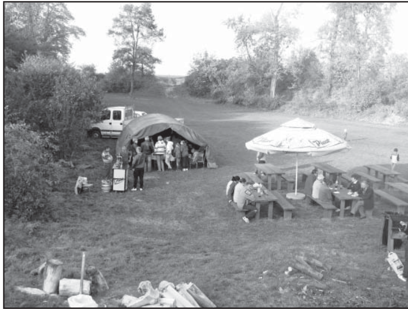
Pogoda dopisała podczas biesiady

i piezzone ziemniaki, a oprócz tego gospodynie przygotowały ruskie pierogi, pyzy, kopytka, czyli potrawy z ziemniaków oraz ciasta. Mieszkańcy Nowic i goście mieli okazję spotkać się, porozmawiać, spędzić czas