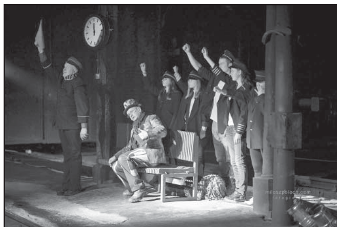
Wieczorny spektakl w Muzeum. Zagrała w nim jaworzyńska młodzież

by pozyskać więcej sponsorów, gdyż jest to bardzo droga impreza (do tej pory