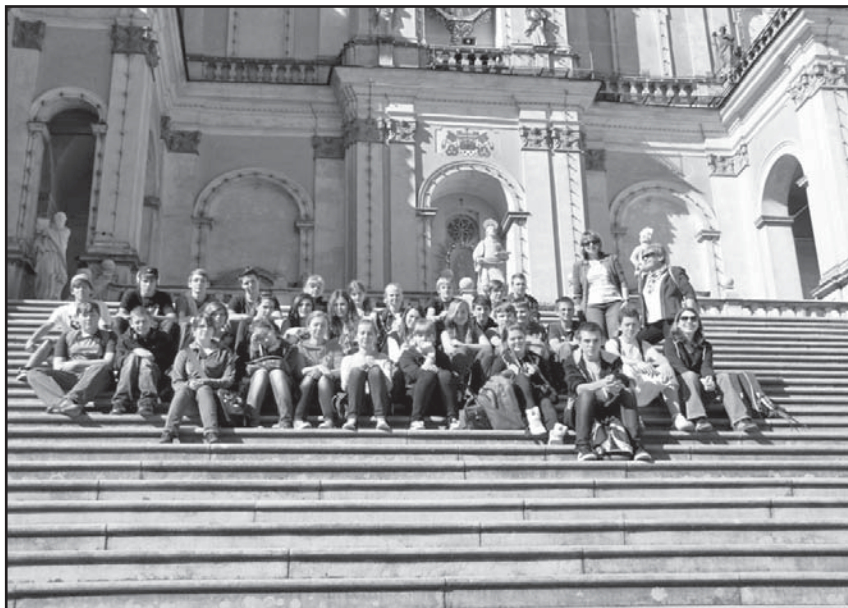
Uczniowie na wycieczce w Wambierzycach

zeum Kolejnictwa, Kościół Pokoju w Świdnicy, Bazylikę w Wambierzycach, Ostrów Tumski we Wrocławiu i tamtejsze ZOO. Byli również w Kudowie Zdrój i Kłodzku. W trakcie pobytu uczestniczyli również w warsztatach historycznych, które przeprowadzono w Międzynarodowym Domu Spotkań Młodzieży w Krzyżowej. Gości z Niemiec w Urzędzie Miejskim przyjął również Bur-