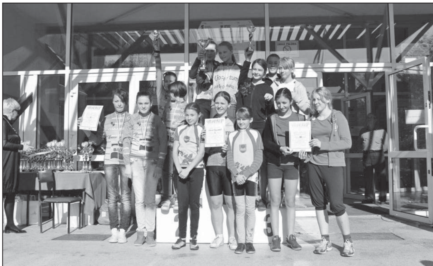
Drużyna dziewcząt z Jaworzyny Śląskiej zdobyła I miejsce