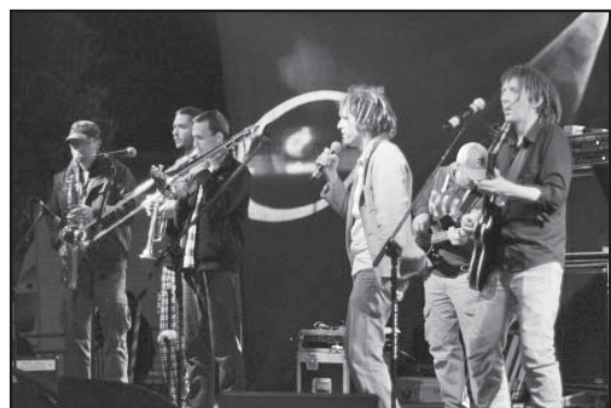
Na scenie w mieście wystąpiło wielu artystów

Tak było w muzeum, a co działo się w mieście?