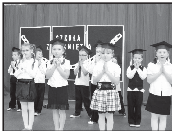
Program artystyczny przygotowali pierwszoklasiści