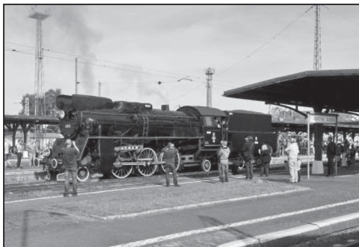
Parowóz 351019-5 przyjechał z Niemiec