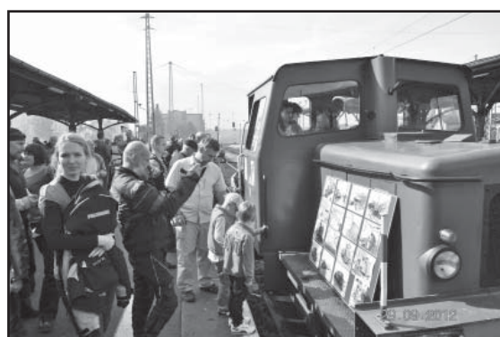
Wystawa lokomotyw spalinowych Historia i Współczesność

jen dzień i z pewnością nie praca jednego człowieka. Mieszkańcy przychodząc na imprezę widzą rozłożony już sprzęt estradowy, działająca