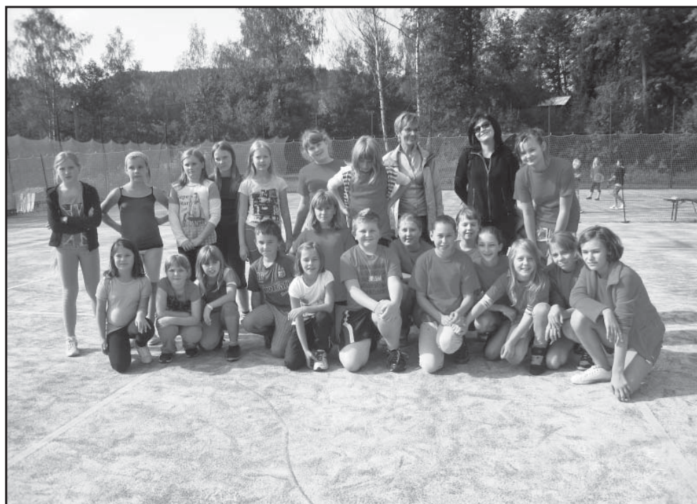
Uczniowie miło spędzili czas w Teplicach