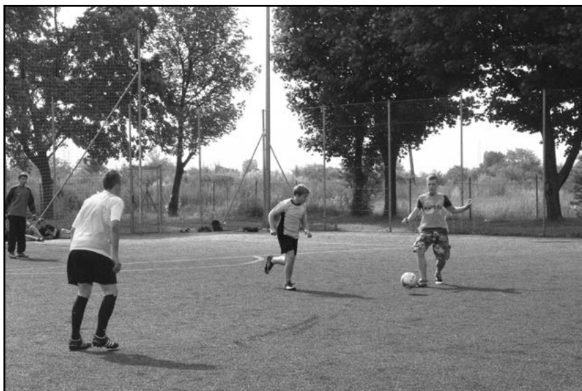
Rywalizacja drużyn podwórkowych

Zwycięzcą została drużyna „7 Krasnoludków”. Drugie miejsce zajęła drużyna „Dzikie Świnie” a miejsce trzecie przypadło w udziale „Kolorytowi Pastuchów”. Organizatorzy