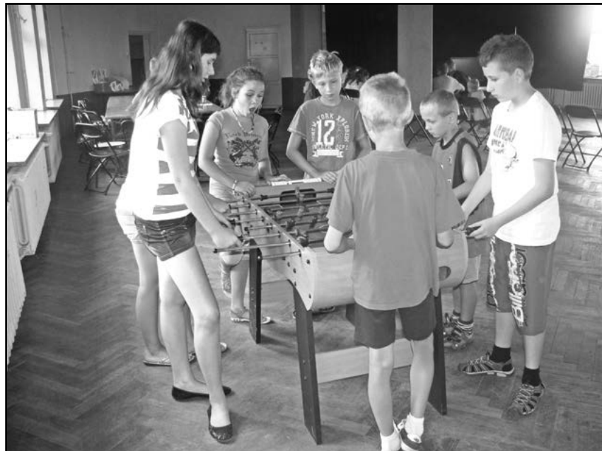
Dzieci chętnie korzystały z zajęć organizowanych w SOKiBP