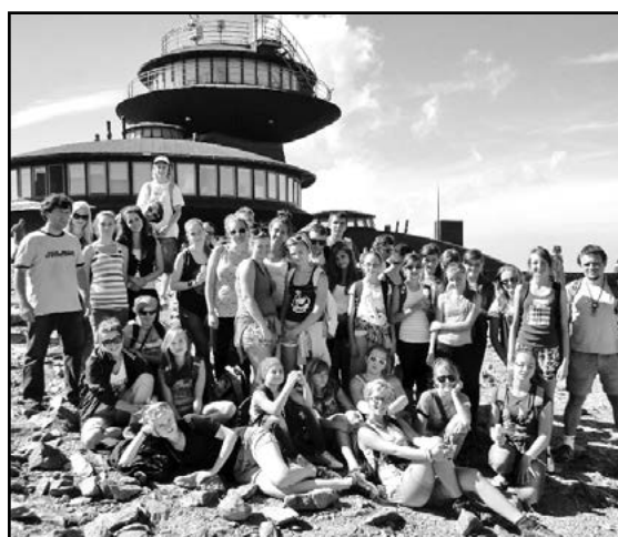
Kolejny szczyt zdobyty