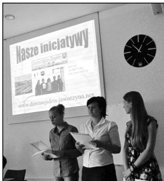
Młodzież z Jaworzyny przygotowała ciekawą prezentację

opowiedział o współpracy MRM z dorosłymi radnymi oraz o działaniach Klubu Młodzieżowego na terenie gminy. Uczestnicy konferencji mogli