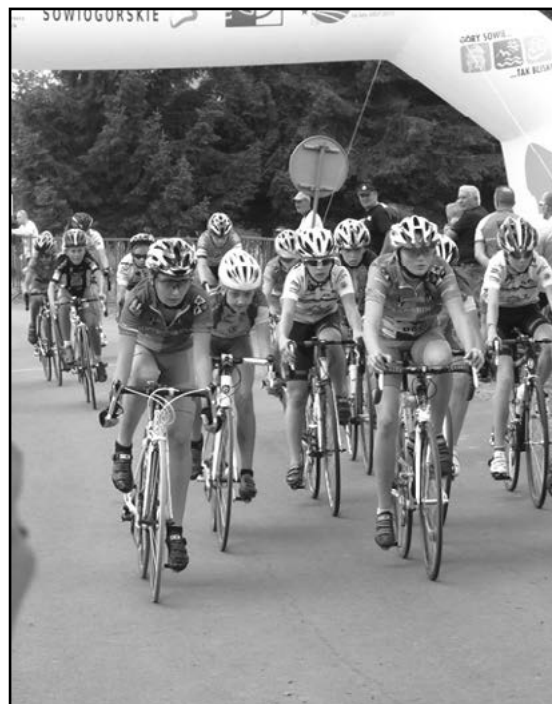
Zawodnicy podczas jednego z etapów wyścigu