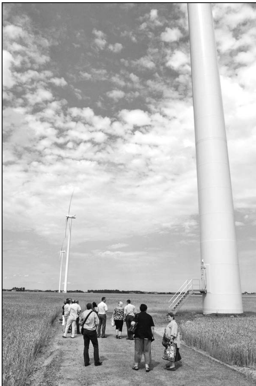
Farma elektrowni wiatrowych

nych wpływów do budżetu Gminy (około 10% przychodów całej gminy) oraz nowe drogi dojazdowe na polach uprawnych, z których korzystają rolnicy, a także ścieżki rowerowe na terenie całej gminy.