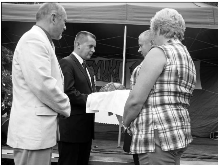
Burmistrz wraz z Przewodniczącym Rady Miejskiej odbierają z rąk Starostów Dożynkowych bochen chleba