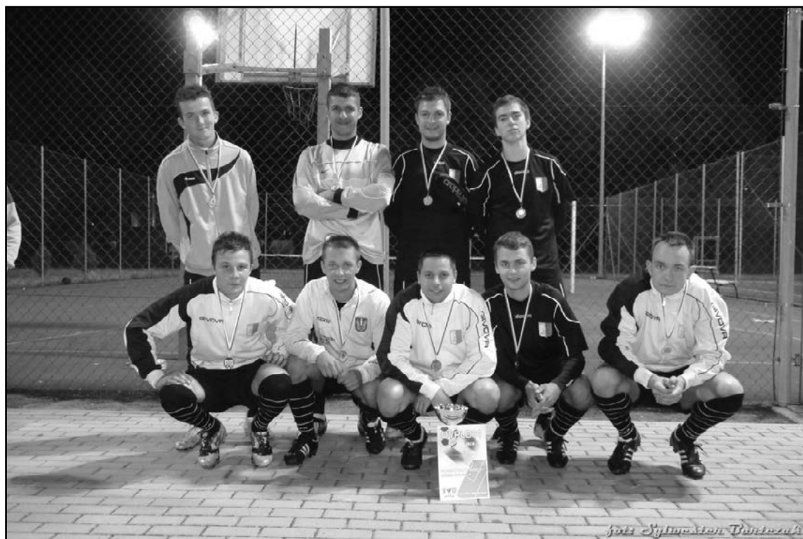
Zwycięzcy nocnego turnieju