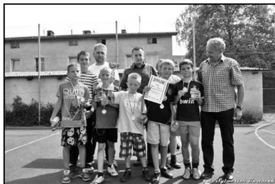
Zwycięzcy w turnieju Lato na korcie

ramach zorganizowanych form wypoczynku. Część osób zazwyczaj z rodzicami udawała się na kilkudniowe wycieczki.