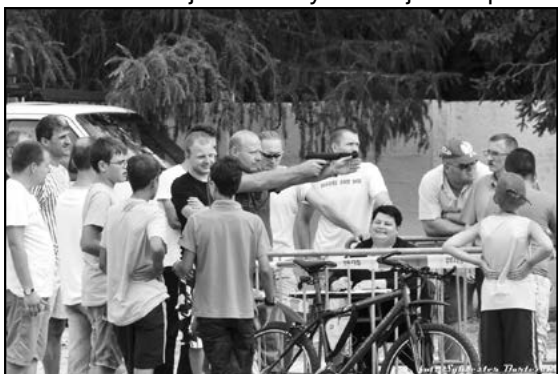
Turniej strzelania z broni pneumatycznej