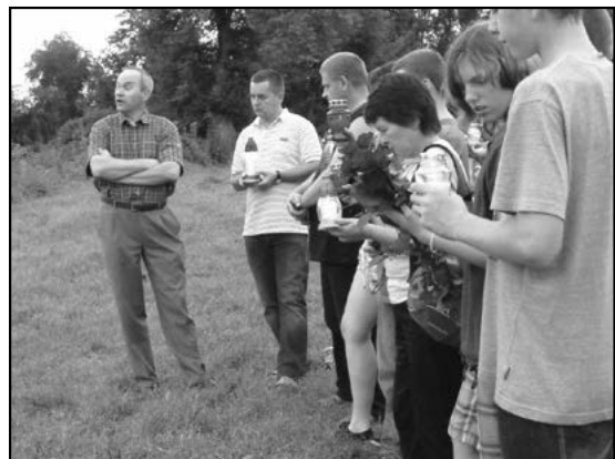
Na grobach zapalono znicze

Wzięliśmy się od razu do pracy. W trakcie tygodnia udało się uporządkować, a często nawet przywrócić