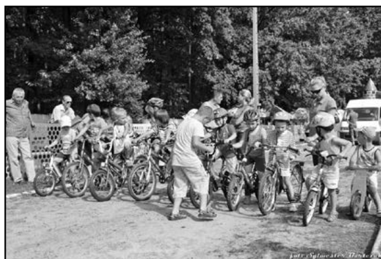
Dzieci ścigały się na rowerach

ki Nożnej o Puchar Przewodniczącego Komisji Zakładowej NSZZ „S”. W turnieju wzięły udział cztery drużyny: KZ NSZZ „S” ZPS „Karolina”, Zebra Sp. z o.o., ZOZ Ziemi Kłodzkiej i KZ NSZZ „S” Toyota Motor Poland Wałbrzych. W Turnieju zwyciężyła drużyna ZOZ Kłodzko. Drugie miejsce przypadło pracownikom firmy „Zebra”, a trzecie gospodarzom turnieju - piłkarzom z „Karoliny”. Na czwartym miejscu uplaso-