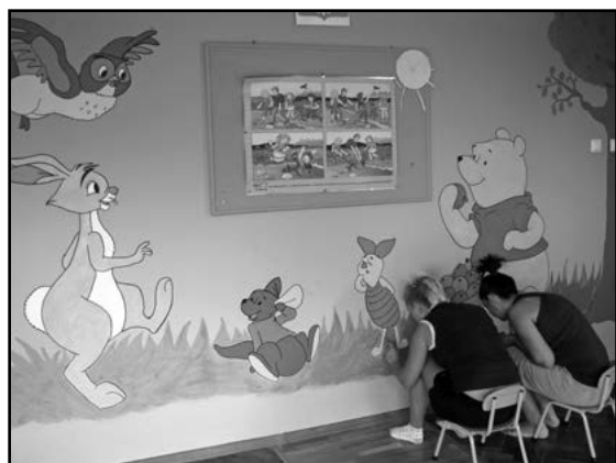
Ostatnie poprawki w sali żłobkowej

nika z wielofunkcyjnej świetlicy wiejskiej na boisko szkolne oraz wjazd na teren szkoły od ulicy Cukrowniczej.