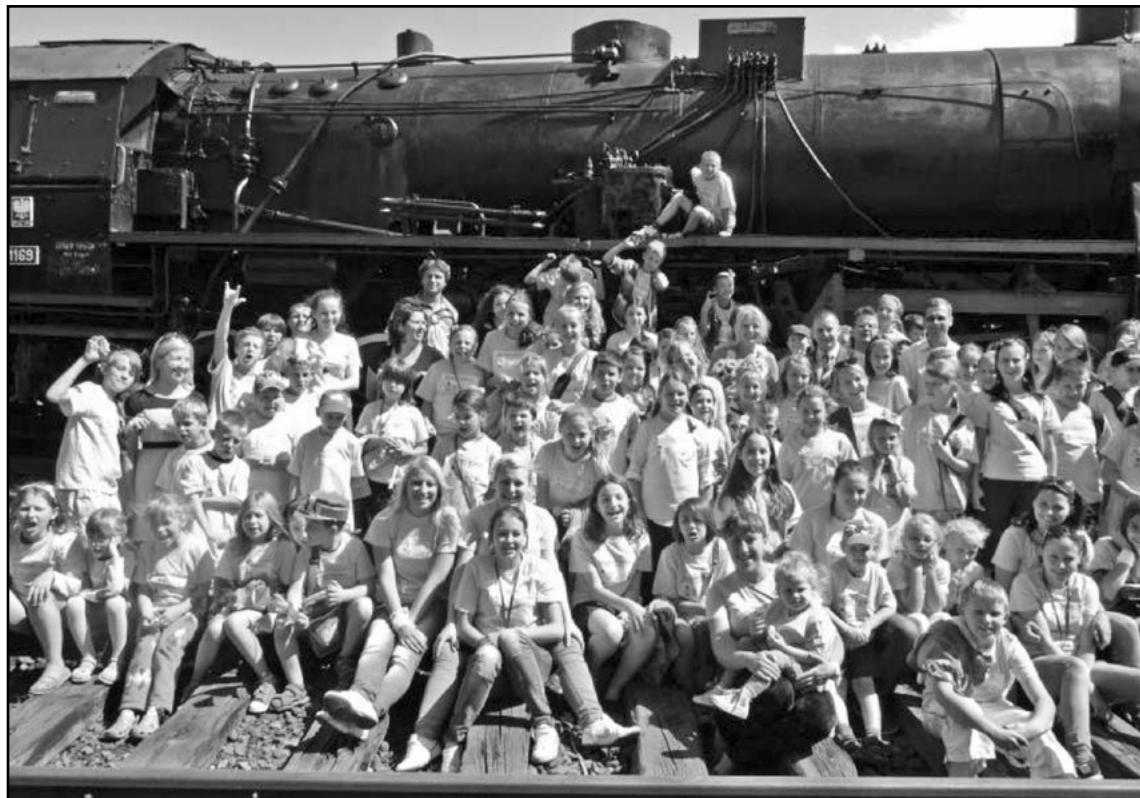
Mieszkańcy Miasta Dzieci