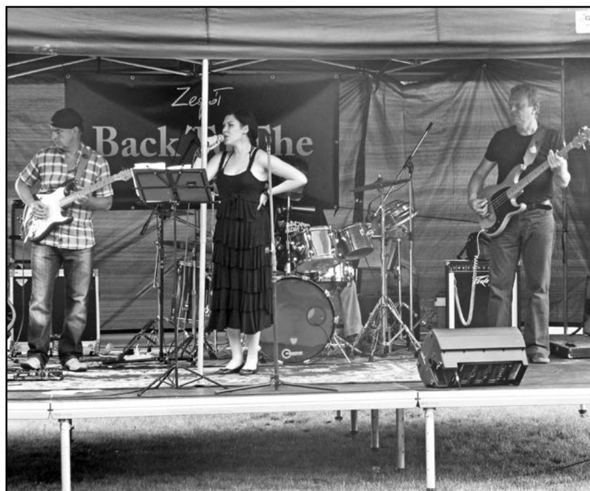
Czas na festynie umilał zespół Back to the Dreams

Imprezę przerwała gwałtowna burza, która okazała się