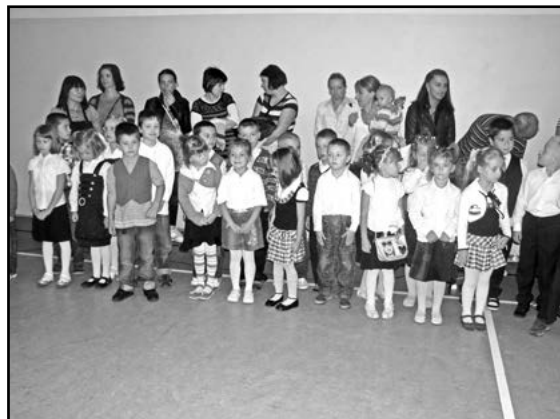
Najmłodsi w podstawówce

W tym roku szkolnym naukę w Polsce rozpocznie 4,8 mln uczniów oraz 660 tys. nauczycieli. Największe zmiany w nim czekają uczniów I klas szkół ponadgimnazjalnych; wkracza tam reforma edukacji wraz z nową podstawą programową nauczania.