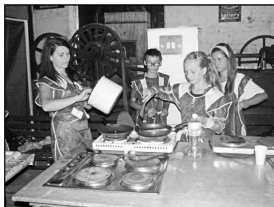
W kuchni przygotowywano pyszne jedzenie

Dziewczyny twierdzą, że „dzieci były grzeczne i łatwo można było je uspokoić”. Do Miasta Dzieci