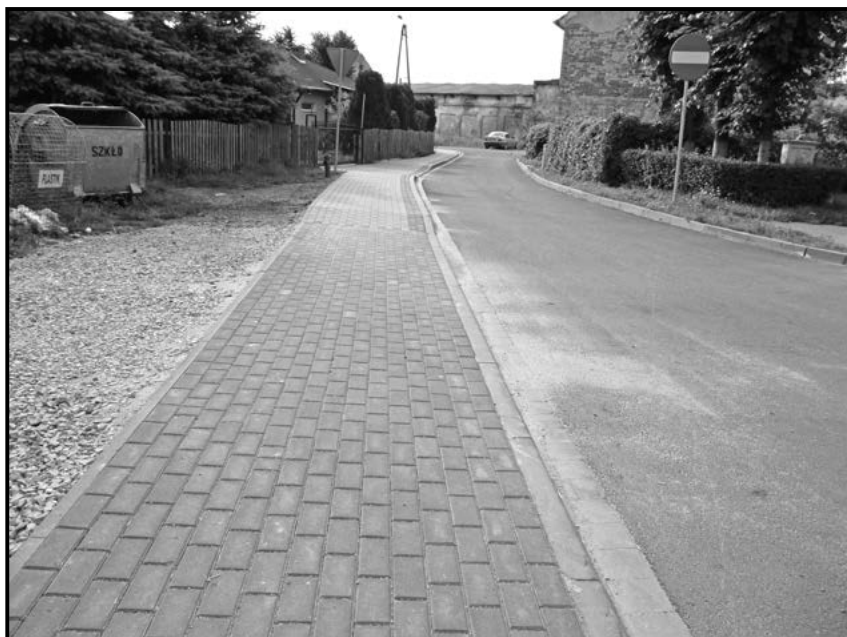
Nowy chodnik w Nowicach