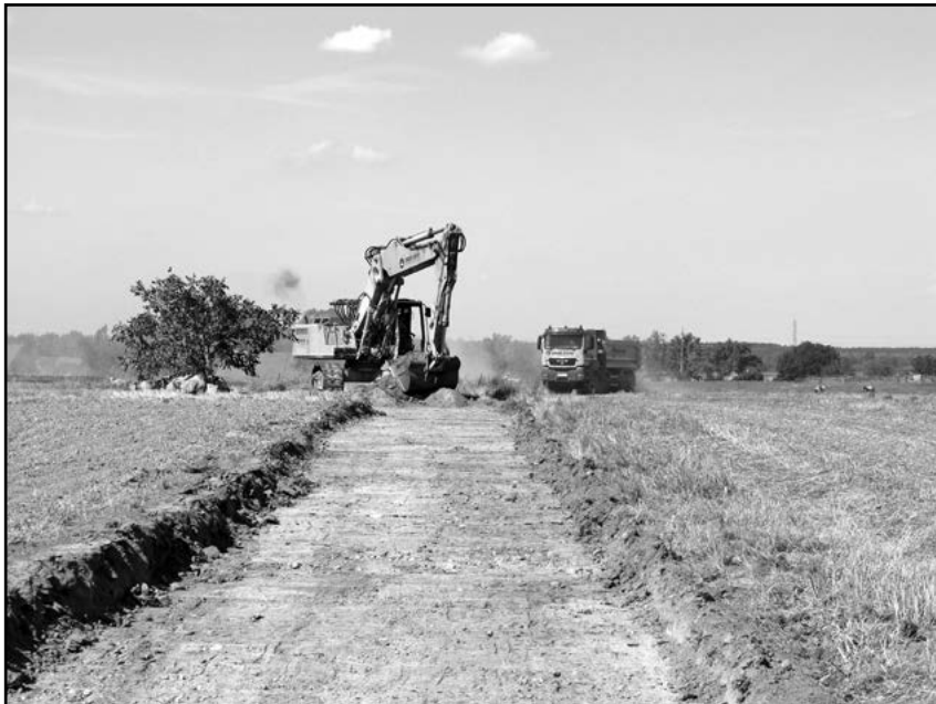
Budowa dróg w Milikowicach

Po zakończonym scalaniu gruntów rozpoczęła się budowa dróg w Milikowicach. Scalanie gruntów odbyło się w ramach