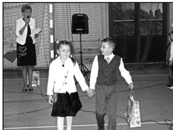
Słodkie na dobry początek