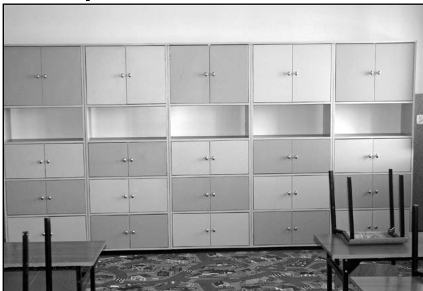
Na pierwszaków czeka wyremontowana klasa

Przed rozpoczęciem roku szkolnego, w Pastuchowie ukończono budowę chod-