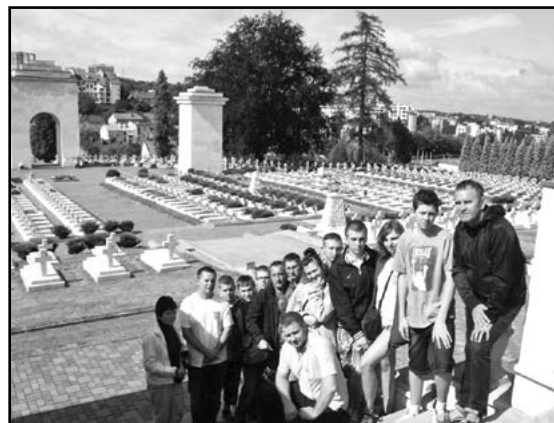
Na cmentarzu Orłąt Lwowskich

dniami przygotowań nadszedł czas wyjazdu na Kresy. Wcześniej ustalono, że miejscem pobytu i pracy naszej grupy będzie miejscowość Łataczów, niedaleko Chmielnickiego na Podolu. Tam, w Sanktuarium Matki Boskiej