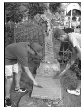
Młodzież z zapalem porządkowała groby