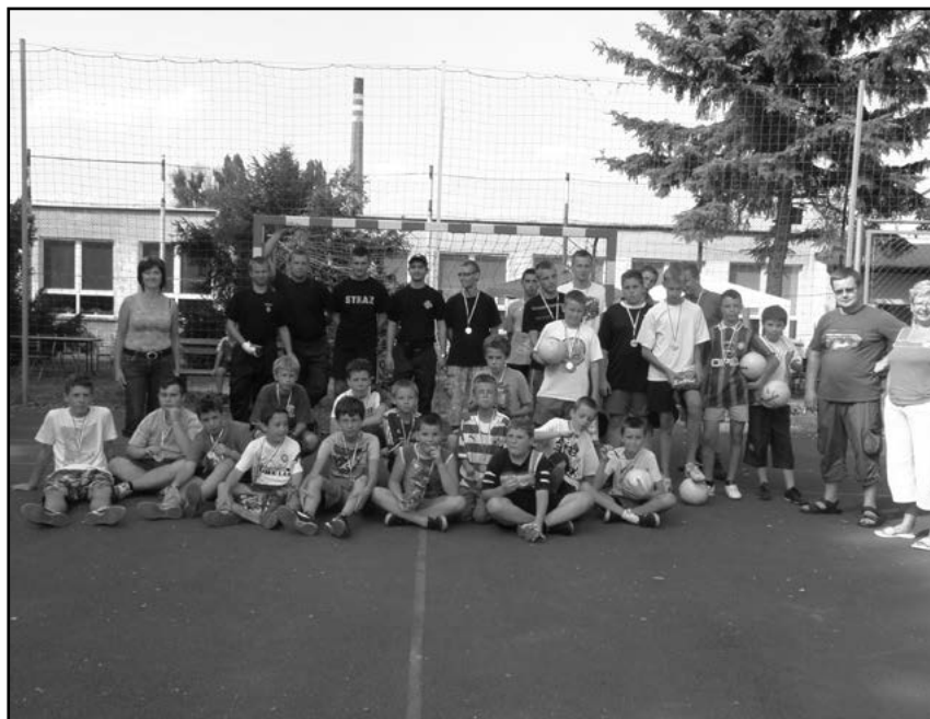
Zwycięzcy w Igrzyskach

nagrodzeni słodyczkami. Organizatorzy - Rada Sołecka Pa-