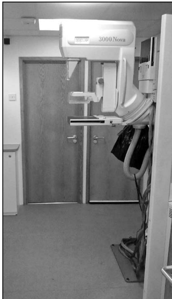
Tak wygląda urządzenie do wykonywania badań