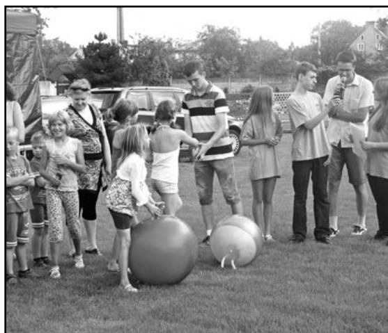
Konkurs w skokach na piłce