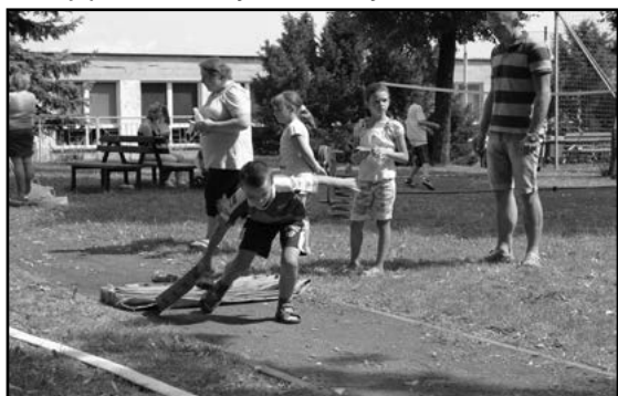
Zwijanie węża strażackiego na czas

Wszyscy zwycięzcy zostali, jak na prawdziwych igrzyskach, uhonorowani medalami oraz otrzymali nagrody rzeczowe. Pozostali uczestnicy za udział zostali