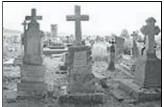
Na ocalenie czeka jeszcze wiele grobów

cy dla swojej zabytkowej nekropolii, przeznaczonej w tym czasie do likwidacji. Przez kolejne lata remontowaliśmy cmentarze w Drohobyczu, Bohorodczynie, Tuligłowach, Podhajcach Moczulance na Wołyniu, Berdyczowie, Lubarze, Żytomierzu, Brzeżanach. Przy pracach porządkowych i rekonstrukcjach pracują każdego roku uczniowie i nauczyciele dolnośląskich szkół, w ten szlachetny sposób spędzając wakacje. Do inicjatywy przyłączyło się wiele gmin z naszego województwa, w tym także Jaworzyna Śląska. 20 marca o godzinie 18:00 na antenie TVP Wrocław wyemitowany został odcinek „Studia Wschód”, w którym mogliśmy zobaczyć młodzież z na-