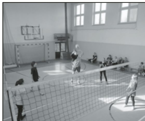
Walka o Puchar Burmistrza