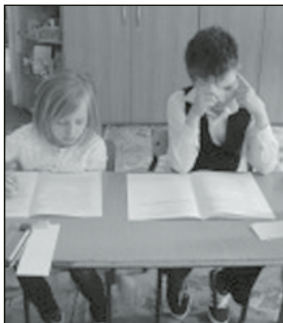
Pierwszy egzamin trzecioklasistów

tyczny, badający m.in. umiejętności liczenia, rozwiązywania zadań, a także praktyczne posługiwanie się zegar-