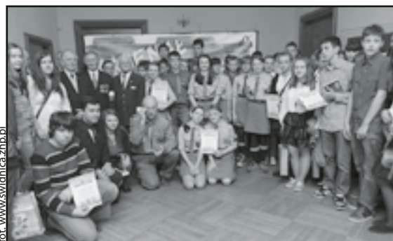
Uczestnicy VII konkursu Arsenał Pamięci

W świdnickiej Bibliotece Miejskiej już siódmy raz odbył się Powiatowy Konkurs „Arsenał Pamięci” poświęcony lekturze Aleksandra Kamińskiego „Kamienie na szaniec”.