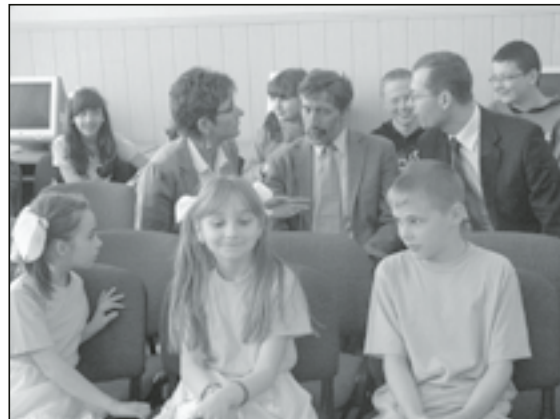
Ustalanie planu dalszej współpracy

Po obiedzie dzieci udały się do SOK-u, by obejrzeć dwie wysta-