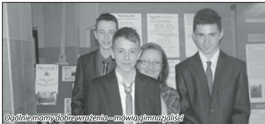
Ogólnie mamy dobre wrażenia - mówią gimnazjaliści