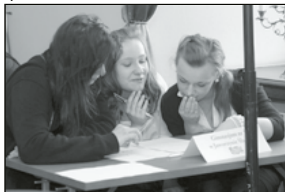
Reprezentacja Jaworzyny Śląskiej