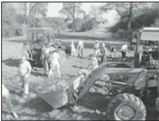
Praca w Koziarni