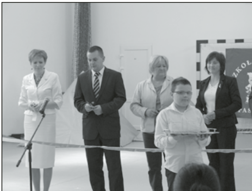
Symboliczne przecięcie wstęgi

Inwestycja budowy wielofunkcyjnej świetlicy wiejskiej w Pastuchowie zakończyła się we wrześniu 2011 r. Gmina na realizację zadania pozyskała środki finansowe zewnętrzne w ramach działania „Odnowa i Rozwój Wsi” objętego Programem Rozwoju Obszarów Wiejskich na lata 2007-2013. Proces budowy obiektu świetlicy rozpoczął się w roku 2010 r. Budowa obejmowała III etapy: stan surowy otwarty, prace wykończeniowe sanitariatów oraz prace wykończeniowe obiektu. W świetlicy wykonano salę o powiechchni 252,8 m, która będzie służyć społeczności