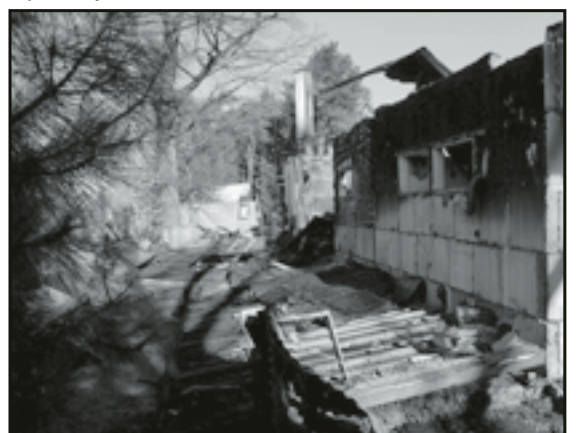
Prawie nic nie zostało