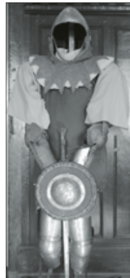
Jeden z eksponatów wystawy