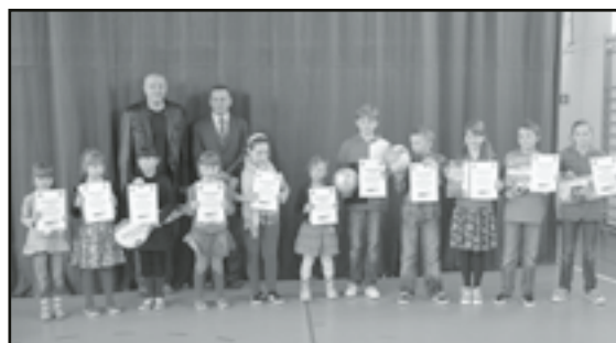
Wyróżnieni w konkursie uczniowie SP w Starym Jaworowie