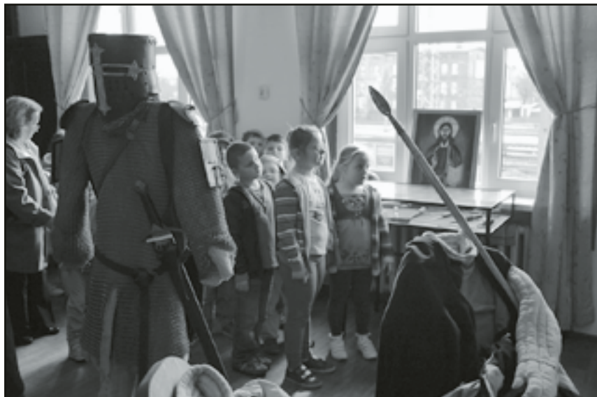
Dzieciom bardzo podobała się wystawa

Wśród zgromadzonych eksponatów, zwiedzający mogli obejrzeć repliki śre-