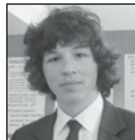
Paweł myślał, że będzie trudniej