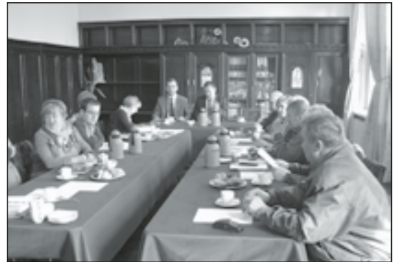
Na spotkaniu dyskutowano o problemach i planach wsi naszej gminy