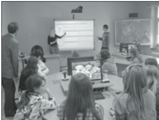
Goście oglądali nowoczesną pracownię

Uczniowie z Teplic mieli okazję porozmawiać ze swoimi rówieśnikami. Zobaczyli również naszą nowo-