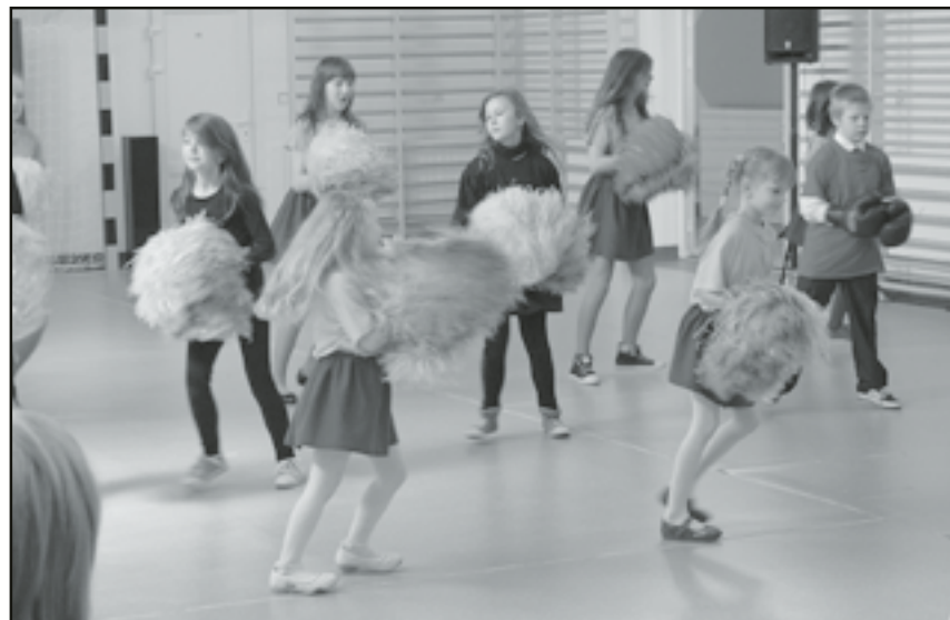
Występ artystyczny dzieci z Podstawówki w Pastuchowie