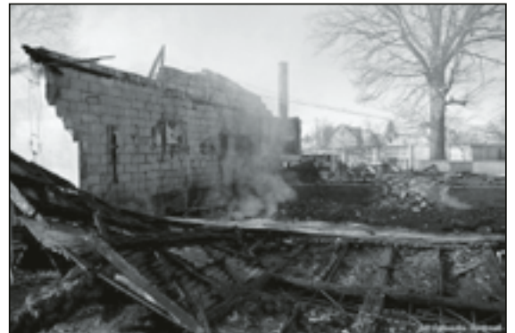
Pożar na stadionie