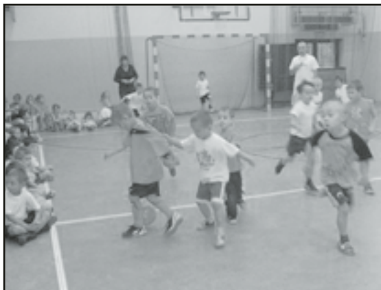
Piłkarze z Przedszkola w akcji