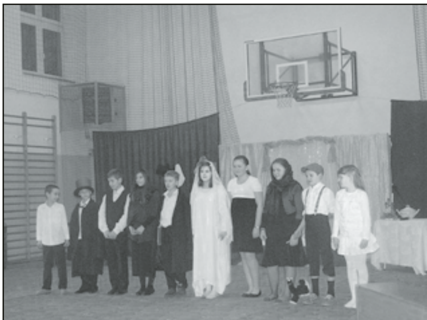
Aktorzy ze Szkoły Podstawowej w Jaworzynie Śląskiej

Dzieci były doskonale przygotowane, scenki opowiadania przeplatał taniec i śpiew, a dekoracje i rekwizyty dopracowane do najmniejszego szczegółu, choć sceną była przecież szkolna sala gimnastyczna. Młodzi aktorzy zostali nagrodzeni owacjami na stojąco, a podziękowania otrzymały również panie nauczycielki, któ-