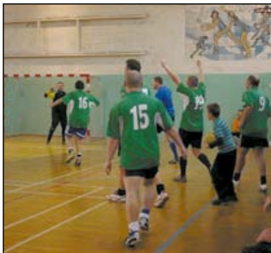
Drużyna OSP Bolesławice cieszy się z awansu do meczu finałowego