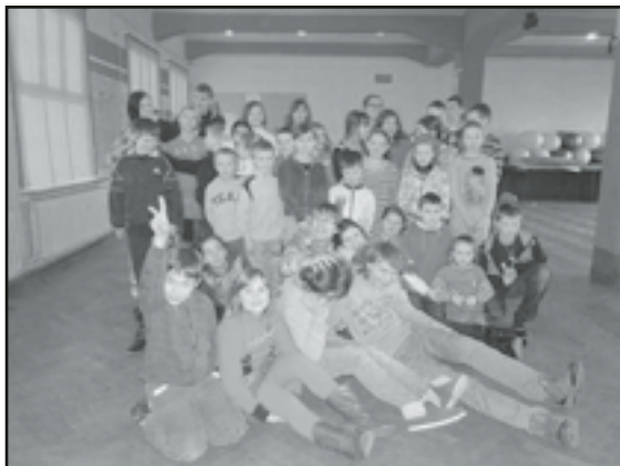
Wszystkim uczestnikom humory dopisywały