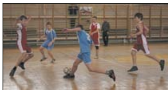
Efektywne zwody i dryblingi