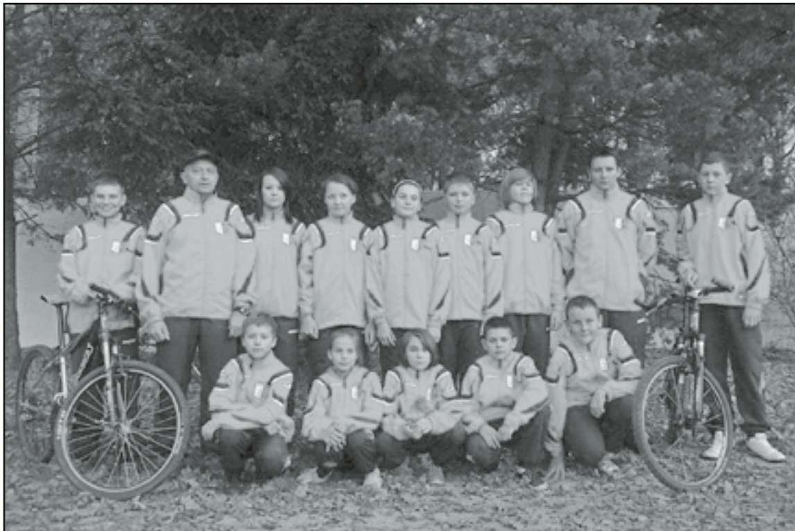
Zawodnicy sekcji kolarskiej MKS Karolina