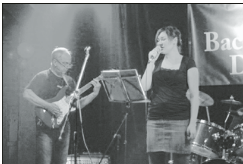
Część artystyczna Wielkiego Finału WOŚP

Jak zawsze w gminie Jaworzyna Śląska finał WOŚP nie odbył się bez echa i mieszkańcy nie zawiedli. Podczas tegorocznej akcji uzbierano 7088,78 zł.