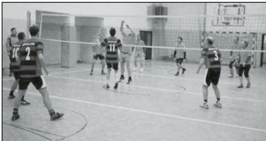
W meczu siatkówki, po wyrównanej rywalizacji lepsi okazali się Tepliczanie

W pierwszy piątek lutego, w sali widowiskowej Samorządowego Ośrodka Kultury odbyło się tradycyjne spotkanie noworoczne władz gminy z przedstawicielami organizacji pozarządowych, przedsiębiorcami oraz kierownikami jednostek organizacyjnych naszej gminy.