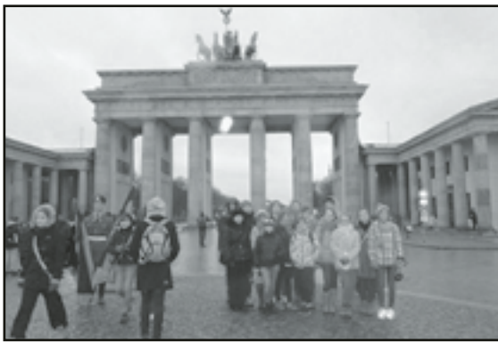
Podczas powrotu w Berlinie

Młodzież testowała również kreatywne i alternatywne narzędzia