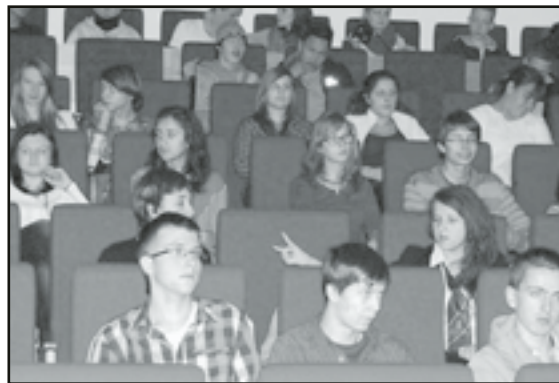
Zajęcia w Kolding

W spotkaniu uczestniczyło 100 osób – 50 z Polski i 50 z Danii. Młodzież mieszkała w Sjolund niedaleko Kolding. Oprócz przygotowań do konferencji podsumowującej, która odbyła się 16.01.2012 z udziałem