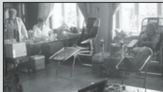
Sala Ośrodka Kultury zmieniła się w centrum krwiodawstwa