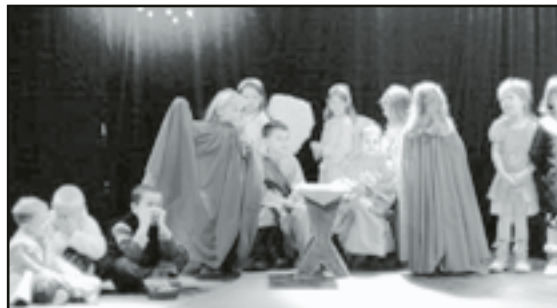
W przygotowanie występów aktorzy włożyli dużo serca