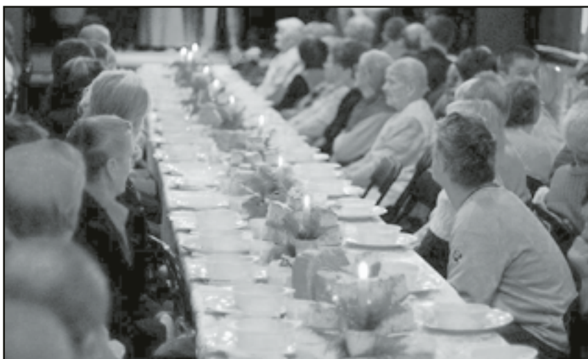
Do wieczerzy wigilijnej zasiadło wielu samotnych mieszkańców gminy