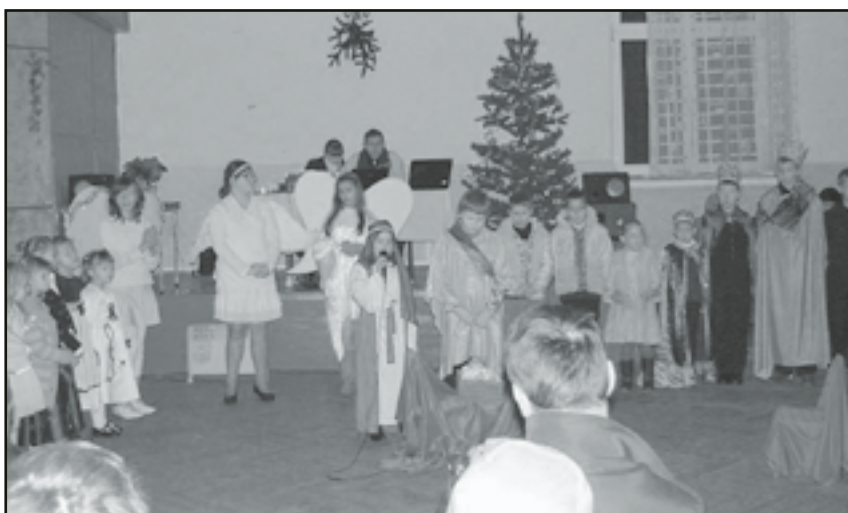
Jasełka w wykonaniu dzieci z Pasiecznej