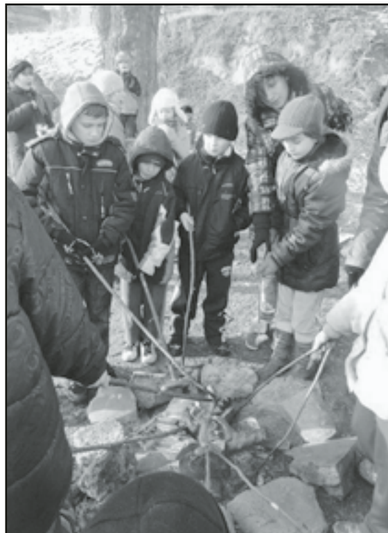
Pieczone kiełbaski smakowały wyśmienicie