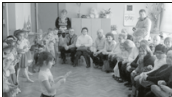
Babcie i Dziadkowie byli niezwykle dumni z występów swoich wnuczków

Święto babci i dziadka to dzień niezwykle, nie tylko dla dzieci.