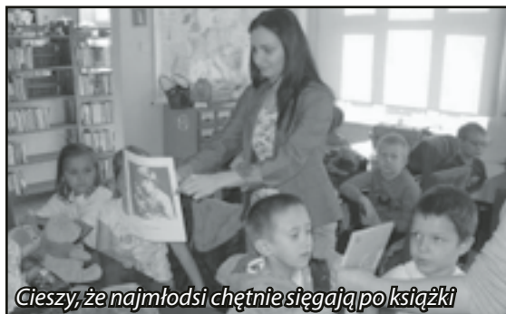
Cieszy, że najmłodszy chętnie sięgają po książki

Ogółem w roku 2011 Biblioteka Publiczna zarejestrowała 1370 czytelników, z czego 594 na terenach wiejskich. Wszyscy czytelnicy wypożyczyli łącznie 19281 książek. Statystycznie więc każdy mieszkaniec naszej gminy, bez względu na wiek wypożyczył w roku 2011 co najmniej dwie książki. Najliczniejszą grupę czytelników stanowią dzieci do 15 roku życia. Zarejestrowano ich aż 597, co stanowi prawie połowę wszystkich czytelników. W porównaniu z rokiem 2010 ilość czytelników nieznacznie wzrosła (o 31 osób), natomiast wypożyczyliśmy zdecydowanie więcej książek (o 1101 więcej wypożyczeń). Tak-