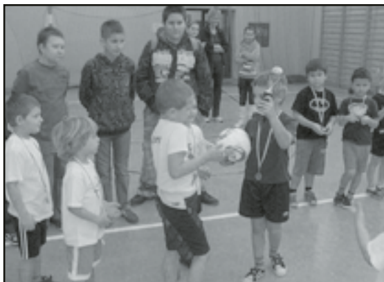
Zwycięzcy z pucharem

Przedszkole Samorządowe z Grupą Żłobkową w Jaworzynie Śląskiej zorganizowało I Turniej Piłki Nożnej. Do rywalizacji przystąpiły dzieci z grupy 5 i 6-latków. Walka o puchar była zacięta. Zwycięzcy zostali wyłonieni dopiero w rzutach karnych.