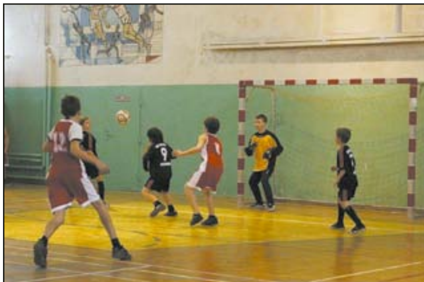
Bramkarze podczas turnieju mieli sporo pracy

14 stycznia br., odbył się coroczny Turniej Szkół Podstawowych w piłce nożnej. Do rywalizacji z zawodach stanęły drużyny szkół podstawowych z gminy Jaworzyna Śląska oraz gościnnie drużyna ministrantów z parafii Św. Józefa w Jaworzynie Śląskiej.