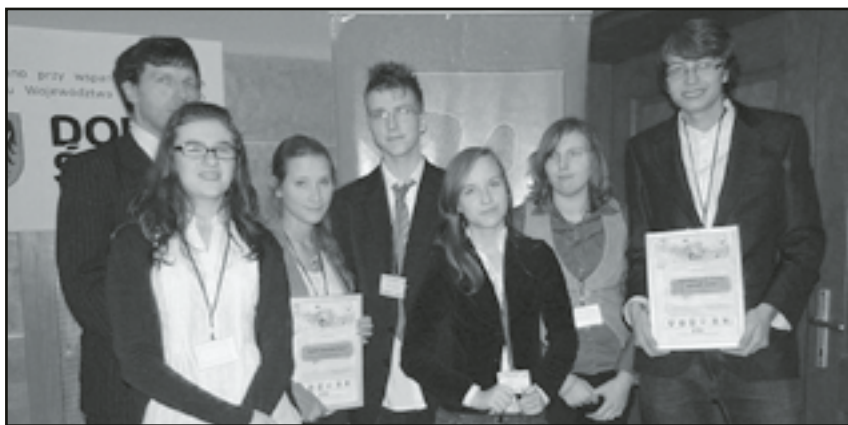
Nasza młodzież ze zdobytymi wyróżnieniami

Gmina Jaworzyna Śląska wygrała konkurs „Gmina przyjazna młodzieży”.