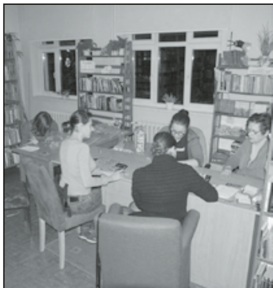
Każdy z Finałów kończy żmudne liczenie zebranych datków

nie w drugą niedzielę stycznia każdego roku. W tym roku WOŚP zbierała fundusze na zakup sprzętu ratującego życie wcześniaków oraz pomp insulinowych dla chorych na cukrzycę kobiet w ciąży.