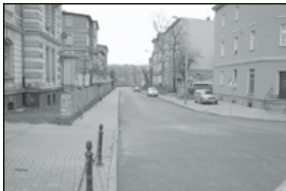
Nowa nawierzchnia asfaltowa od kilku dni cieszy kierowców i pieszych