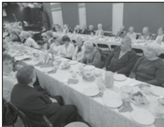
Spotkanie przy wspólnym stole uświetniły nie tylko smaczne potrawy, ale też występy artystyczne