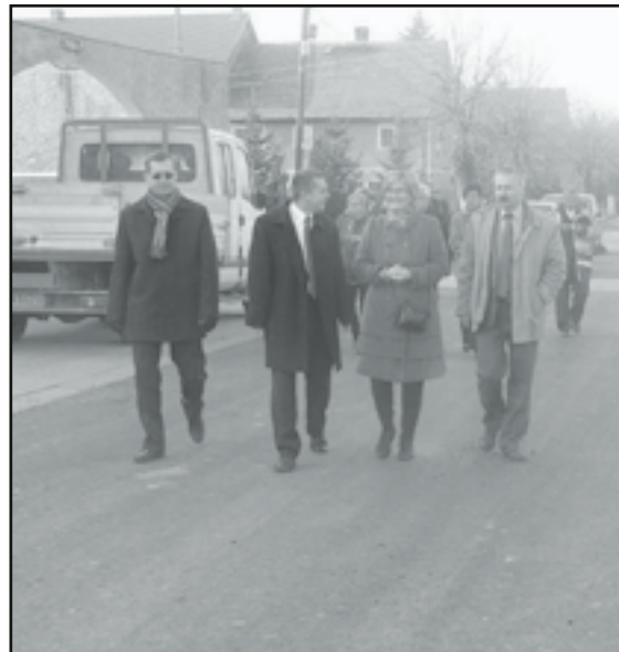
Władze powiatu i gminy podczas odbioru drogi