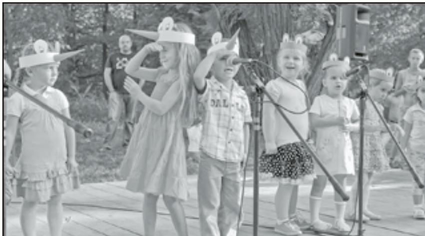
Przedszkolaki dały popis umiejętności wokalnych i gry aktorskiej

W części artystycznej zaprezentowały się dzieci z milikowickiego przedszkola, szkoły podstawowej w Mokreszowie oraz zespoły wokalaneczne z Dobromierza, Mokreszowa i Głuszycy. Stoiska przyciągały zapachami potraw – mało kto mógł się oprzeć domowym wypiekom, pierogom, szaszłykom, grochówce czy porcji prosiaka z rożna. Przedszkolaki również włączyły się w część kulinarną – razem z paniami upiekły ciasta. Biorąc udział w różnorodnych konkursach, można było zdobyć cenne nagrody takie jak zmywarka, odkurzacz czy wiertarka. Ogromnym powodzeniem wśród najmłodszych cieszyły się balonowe zwierzaki, które dzieci dostawały za udział w