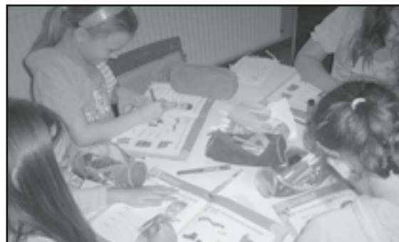
Uczniowie podczas dodatkowych zajęć z języka angielskiego

Dzieci bardzo podobała się atmosfera na zajęciach. Na podsumowanie projektu w an-