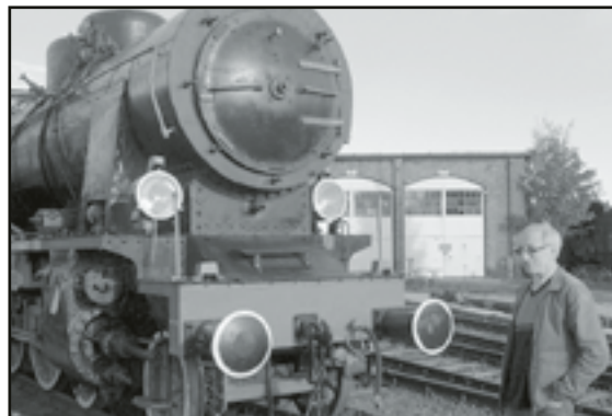
Zbigniew Gryzgot całe życie związany był z parowozownią, teraz jest kustoszem muzeum

Czego życzyć osobie, która przed trzema miesiącami obcho-