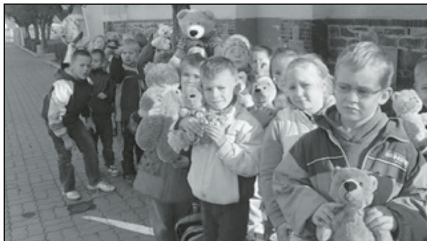
Podczas wyprawy do biblioteki okazało się, że prawie każdy ma swojego Kubusia

Kubuś Puchatek to ulubieniec milionów dzieci na całym świecie. Obchodzi w tym roku swoje 85 urodziny!