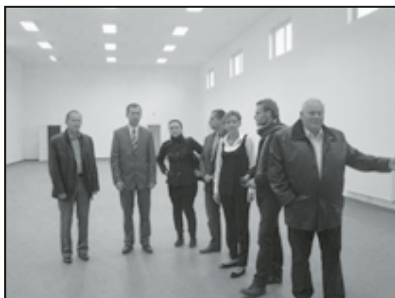
Władze gminy, dyrektor szkoły i przedstawiciele wykonawcy podczas odbioru, 2 listopada

W listopadzie oficjalnie oddano obiekt do użytku. W świetlicy znajduje się sala, która służy zarówno mieszkańcom do organizowania imprez kulturalnych i spotkań jak i uczniom szkoły podstawowej do zajęć wychowawczych fizycznego. Znajdują się w niej również: zaplecze kuchenne, pomieszczenia sanitarne oraz szatnie i biblioteka. Budynek pełni także dodatkową funkcję łącznika między dwoma istniejącymi budynkami Szkoły Podstawowej w Pastuchowie. Inwestycja została zrealizowana przy udziale środków pozyskanych w ramach programu Rozwoju Obszarów Wiejskich na lata 2007-2013 w wysokości 500