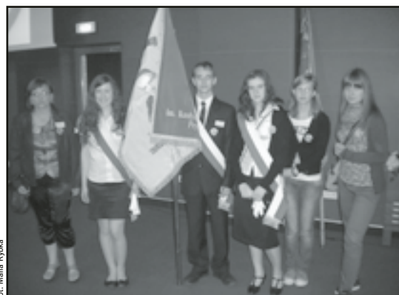
Delegacja jaworzyńskiego gimnazjum w Warszawie

na temat: „Czy można być orłem szybującym w przyszłość Ojczyzny”. Oprócz części oficjalnej zorganizowane zostały również warsztaty przygotowane przez doktorantów Uniwersytetu Kardynała Stefana Wyszyńskiego na temat: „Walka dobra ze złem”. Spektakl był bardzo interesujący. Po nim miała miejsce rozmowa aktorów z uczestnikami na temat pojawiania się w życiu człowieka dobra i zła. Udział w zjeździe zakończyła Msza św. odprawiona przed campusem UKSW. Zjazd