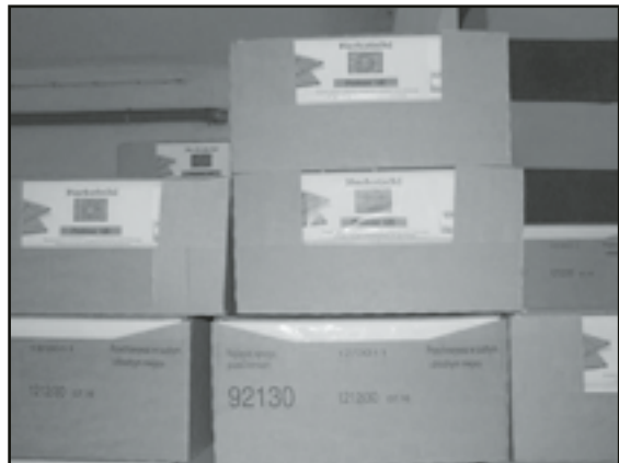
Żywność czeka na potrzebujących

Ponad 7 ton żywności trafiło w czerwcu do Ośrodka Pomocy Społecznej w Jaworzynie Śląskiej w ramach Programu PEAD 2011 – dostarczanie nadwyżek żywności dla najuboższej ludności UE.