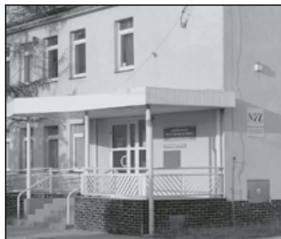
Rocznie w przychodni szukają pomocy dziesiątki tysięcy pacjentów

opinie i wnioski dotyczące m.in. udzielania zamówień na świadczenia zdrowotne, zakupu aparatury i sprzętu medycznego, przekształcenia lub likwidacji przychodni. Wspomaga również dy-