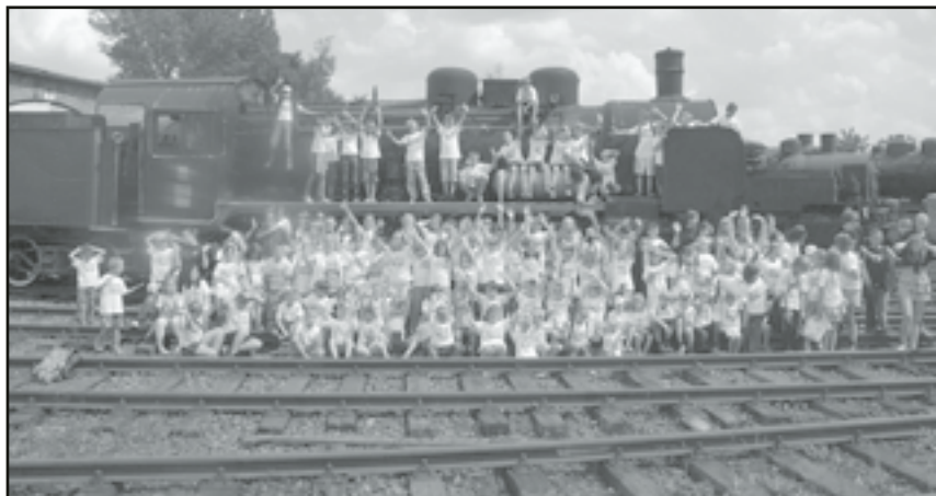
Obywatele Miasta dzieci na zakończenie wspólnej zabawy

Już po raz czwarty Muzeum Przemysłu i Kolejnictwa w Jaworzynie zaprosiło najmłodszych mieszkańców z gminy i powiatu świdnickiego do zabawy.