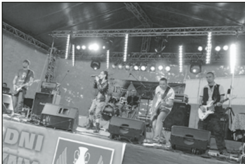
W piątek, 1 lipca, świetny koncert zagrał zespół Fireflower z Kielc, zeszłoroczny zwycięzca Przeglądu „Rock na murawie”