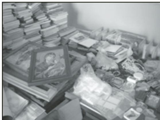
Wśród darów były i przybory szkolne jak i przedmioty kultu religijnego