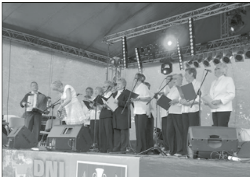
Na scenie zaprezentowali się także seniorzy z Jaworzyny