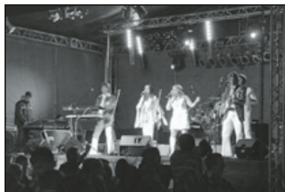
Zespół Abba cover przeniósł wszystkich w niezapomniane lata 80. Podczas koncertu bawili się zarówno młodzi jak i starsi mieszkańcy Jaworzyny