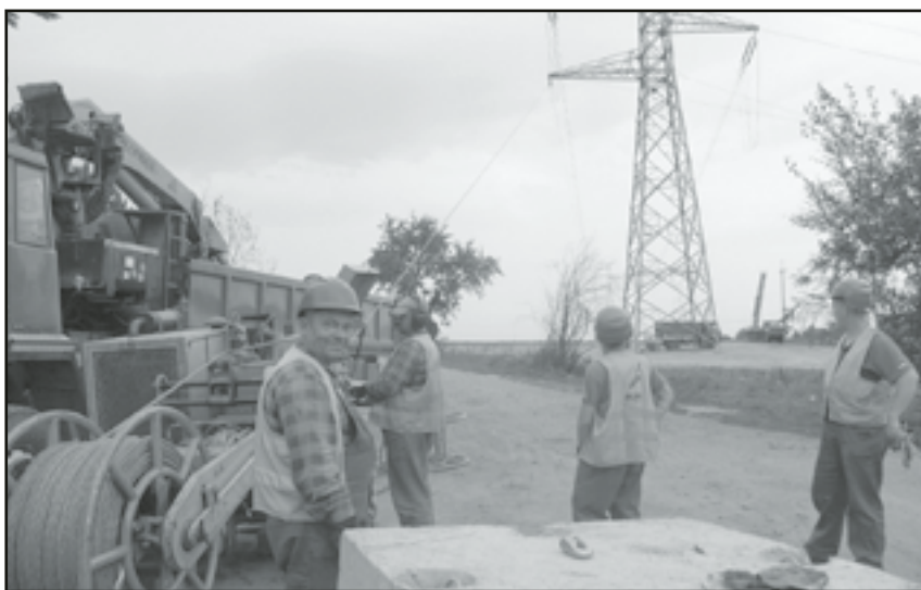
Ekipę można spotkać na budowie nawet w niedzielę

osiem gmin: Świdnicę, Jaworzynę Śląską, Żarów, Marcinowice, Mietków, Sobótkę, Kąty Wrocławskie i Kobierzycę. Na terenie Gminy Jaworzyna Śląska linia ma długość ponad 8 kilometrów. Inwestycję realizuje spółka Polskie Sieci Elektroenergetyczne Operator SA. Wykonawca na swojej stronie www.nowaliniawroclaw.pl podkreśla główne korzyści z budowy: po- prawa pewności zasilania odbiorców, zmniejszenie strat w przesyłach energii, sprostanie za- potrzebom na ener- gię w gminach, gdzie in- tensywnie się inwestuje,