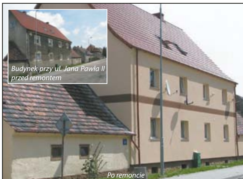
Budynek przy ul. Jana Pawła II przed remontem