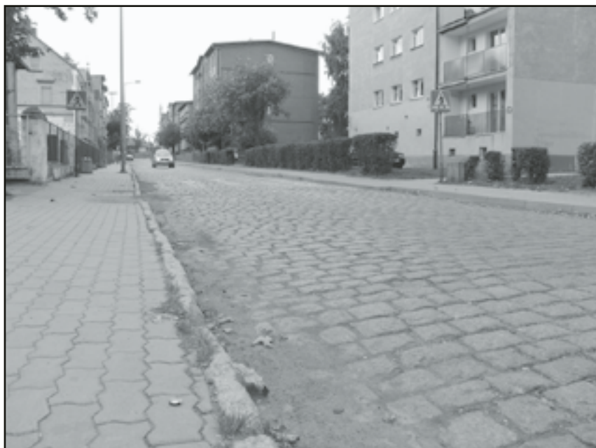
Do końca roku na ul. Westerplatte pojawi się asfalt