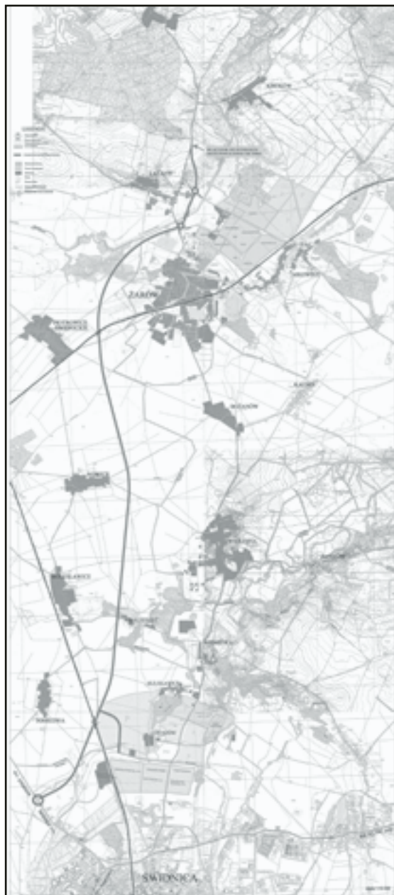
Przebieg łącznika do autostrady A4