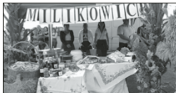
Okazałe stoiska przygotowane przez sołectwa

komisja zdecydowała, że nagrody (sprzęt AGD) ufundowane przez Lokalną Grupę Działania „Szlakiem Granitu” za najładniejsze stoisko powędrują do: Piotrowic Świdnickich (I miejsce), Pastuchowa (II miejsce) i Starego Jaworowa (III miejsce). W konkursie na najlepszy produkt lokalny I miejsce zdobyła Pasieczna, II miejsce Miliukowice, a III miejsce Bolestawice. Warto zauważyć, że w przygotowywaniu dożynkowych wystaw i potraw zaangażowani byli również młodzi mieszkańcy wsi. Kto ceni rozrywkę, mógł zobaczyć scenki kabaretowe i posłuchać pieśni ludowych w wykonaniu jaworzyńskiego Związku Emerytów Rencistów i Inwalidów.