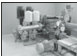
Stacja Uzdatniania Wody wzbogaciła się o nowe urządzenia

Koszt inwestycji to 1,8 mln zł. Gmina pozyskała część potrzebnych funduszy – 500 tys. zł z Programu Rozwoju Obszarów Wie-