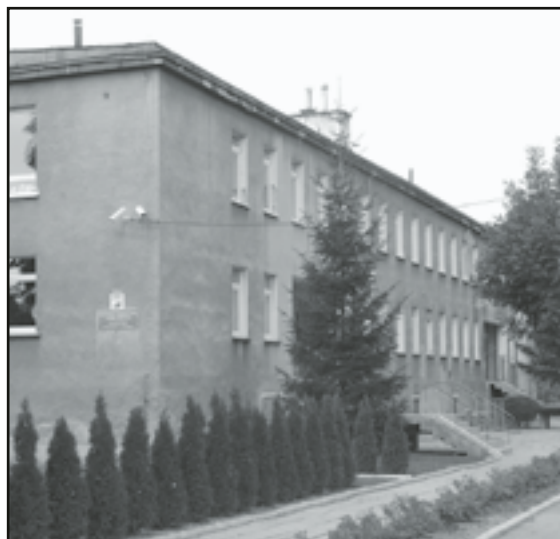
Przedszkole będzie miało nowy dach jeszcze w tym roku