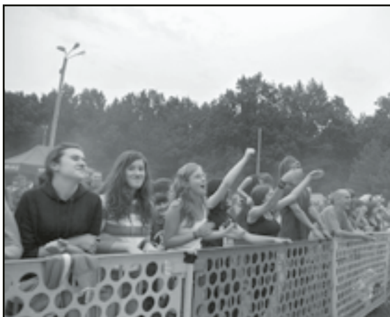
Publiczność żywo reagowała na estradowe występy. Tutaj w czasie koncertu Zabili mi żółwia