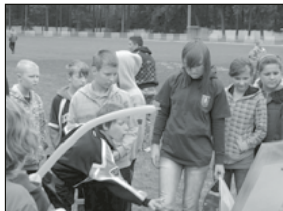
Zabawy i konkursy dla najmłodszych przygotowała jaworzyńska młodzież