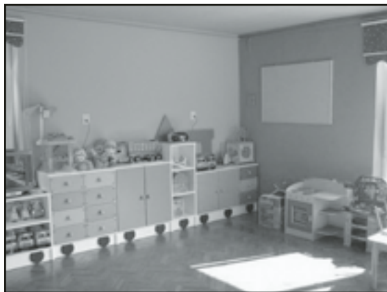
Miło wrócić po wakacjach do odnowionych sal

cyjach wrócili do odnowionych pomieszczeń. Jaki jest efekt remontów? W jaworzyńskim przedszkolu wyremontowano taras, pojawiły się na nim nowe stoliki i krzesła. W jednej z sal dokonano renowacji podłogi, malowania ścian, wymieniono drzwi i instalację elektryczną. Zakupiono również nowe wyposażenie i materiały dydaktyczne. W Szkole Podstawowej w Jaworz-