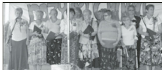
Seniorzy przygotowali piosenki i skecze

Związek Emerytów Rencistów i Inwalidów zrzesza ludzi w celu „poprawiania ich warunków socjalno-bytowych oraz uczestniczenia w życiu społecznym przez współdziałanie z organami władzy i administracji publicznej, samorządowej,