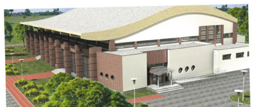
Rozpoczęcie budowy nowej hali sportowej