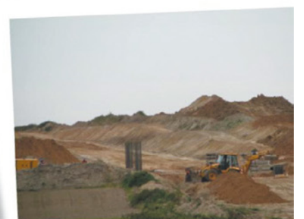
Budowa drogi do autostrady