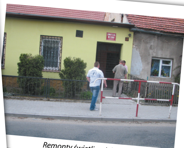
Remonty świetlic wiejskich