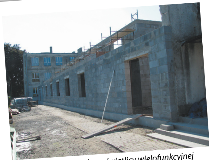
Rozpoczęcie budowy świetlicy wielofunkcyjnej