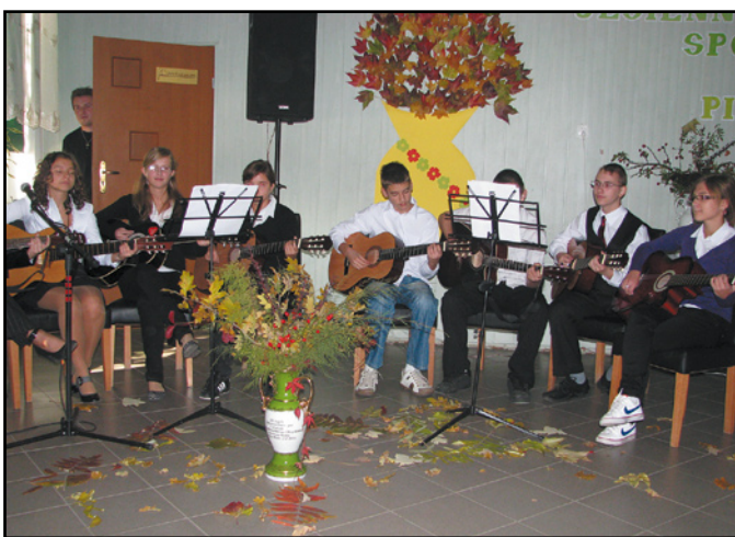
Młodzież specjalnie dla swoich nauczycieli przygotowała program artystyczny