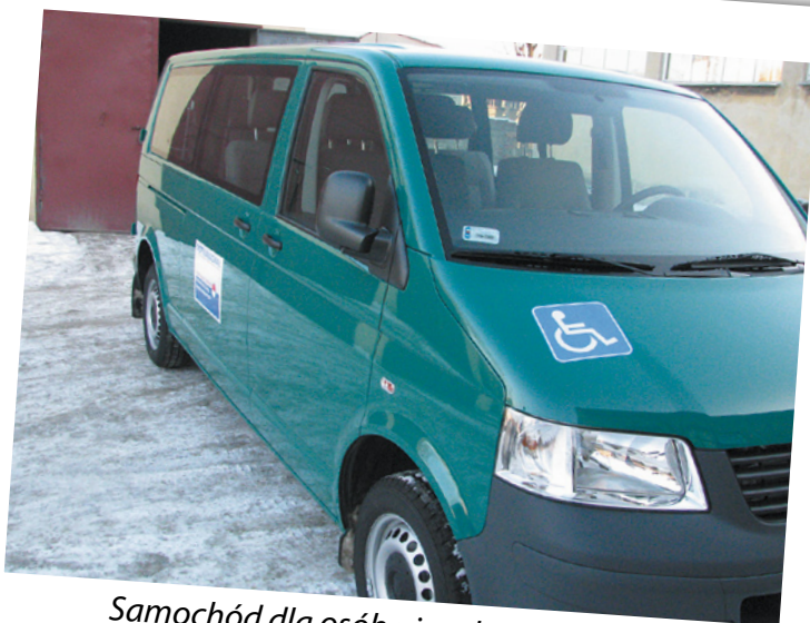
Samochód dla osób niepełnosprawnych