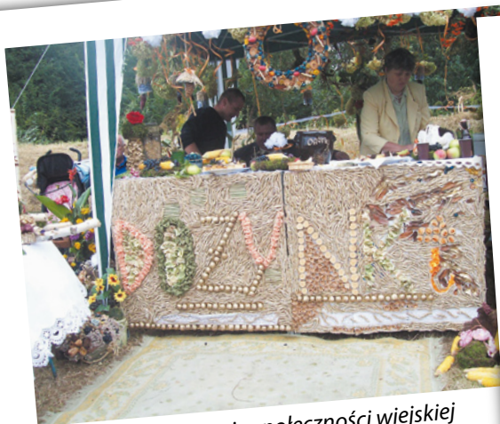
Intergracja społeczności wiejskiej