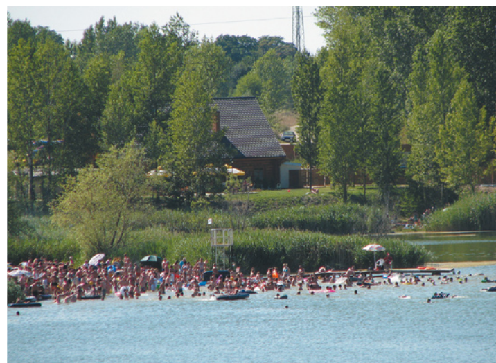
Żwirownia - miejsce letniego wypoczynku