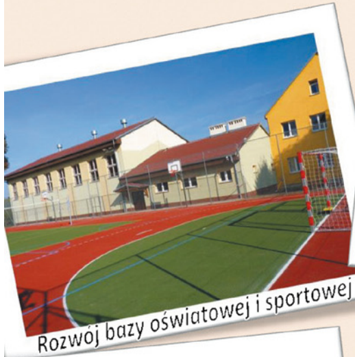
Rozwój bazy oświatowej i sportowej

W obliczu zbliżającego się końca kadencji czuję się zobowiązany do przedstawienia sprawozdania z mojej czteroletniej pracy. Minione cztery lata były okresem rozwoju Naszej Gminy. Udało się zrealizować zakładane plany. Wspólnym wysiłkiem zadaliśmy o to, by Gmina Jaworzyna Śląska stała się miejscem przyjaznym Mieszkańcom. Przeprowadzonych zostało wiele inwestycji. Zmodernizowana została baza oświatowa. Poprawie uległo bezpieczeństwo mieszkańców. Za pośrednictwem Rozmaitości Jaworzyńskich przedstawiam Państwu efekty mojej pracy oraz decyzji podejmowanych wspólnie z Radą Miejską.