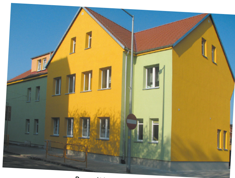
Rozwój bazy oświatowej