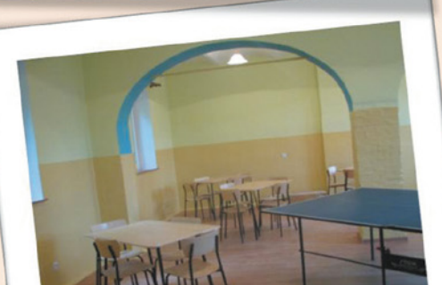
Remonty świetlic wiejskich