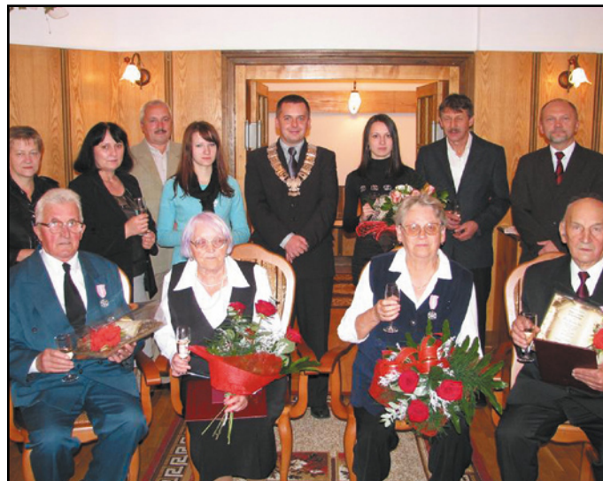
Dostojni jubilaci w październiku świętowali 50-lecie pożycia małżeńskiego