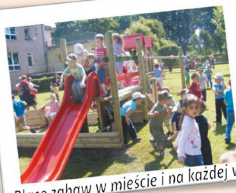
Place zabaw w mieście i na każdej wsi