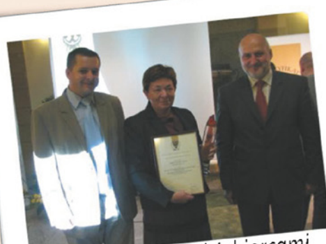
Współpraca z przedsiębiorcami