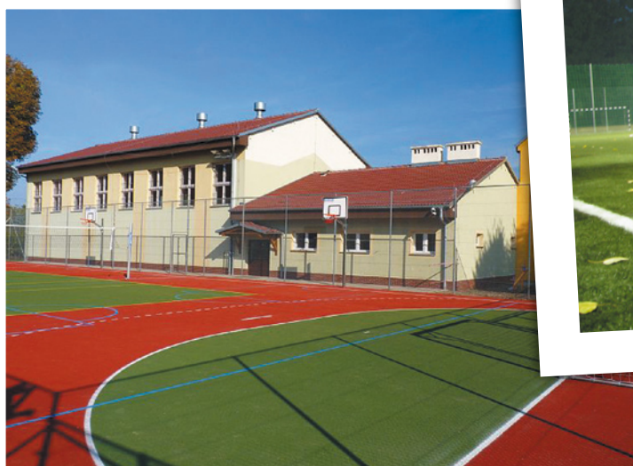
Rozwój bazy oświatowej