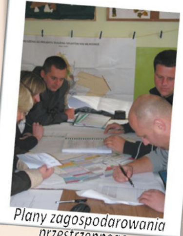
Plany zagospodarowania przestrzennego