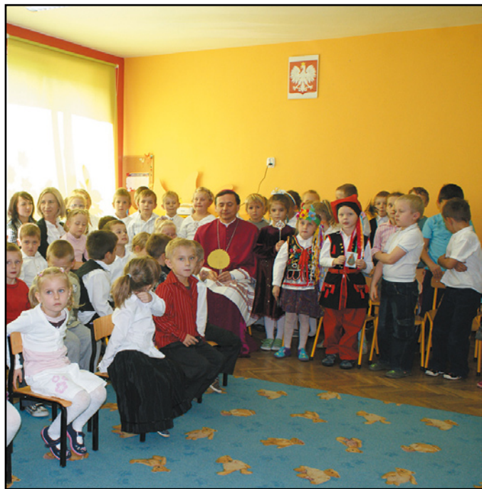
Kolejnym punktem wizyty biskupiej w Jaworzynie było spotkanie z najmłodszymi mieszkańcami - tu z przedszkolakami