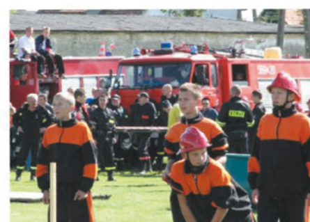
Rozwój ochotniczych straży pożarnych