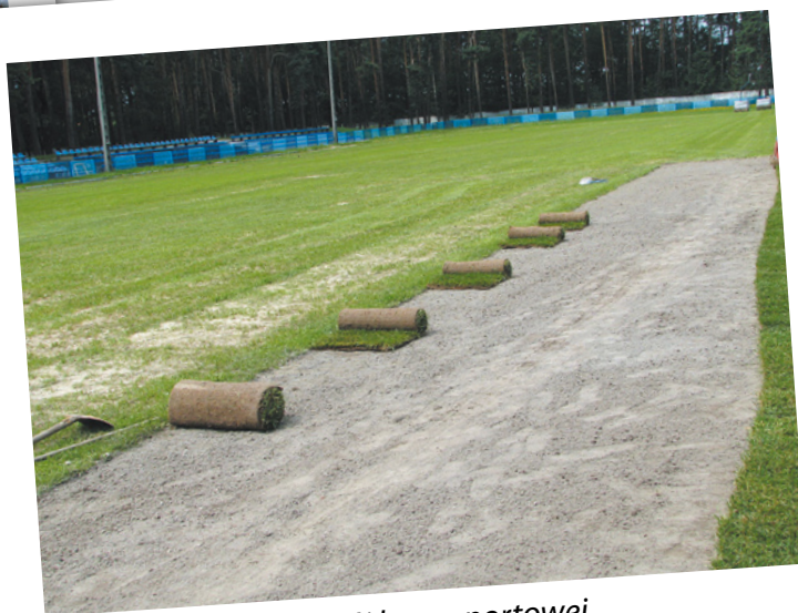
Rozwój bazy sportowej