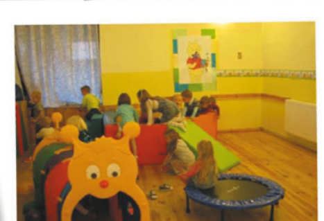
Edukacja najmłodszych, przedszkola na wsiach