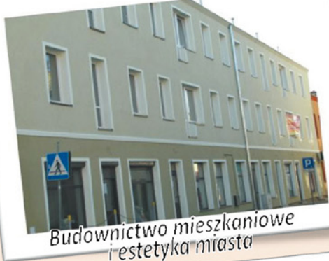
Budownictwo mieszkaniowe i estetyka miasta