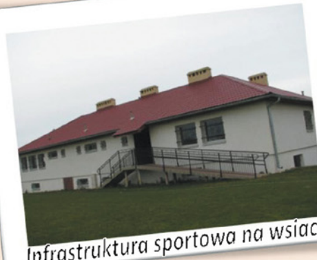
Infrastruktura sportowa na wsiach