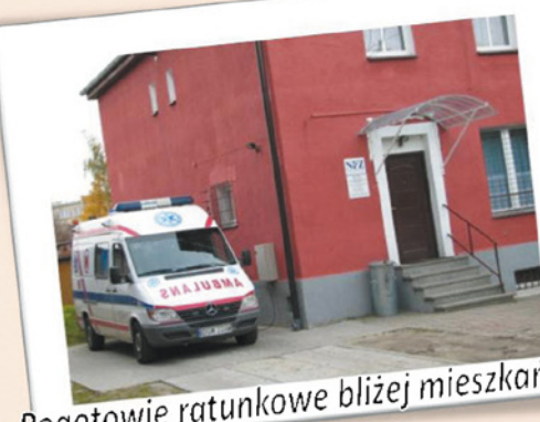
Pogotowie ratunkowe bliżej mieszkańców