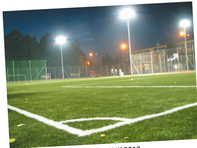
Kompleks boisk ORLIK 2012