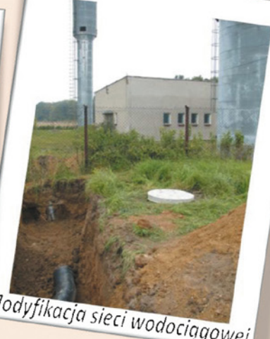
Modyfikacja sieci wodociągowej