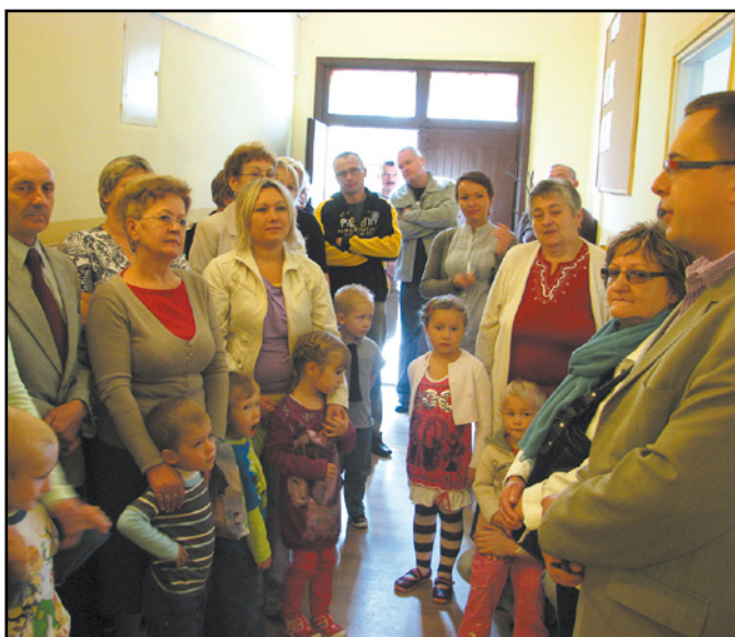
Tym razem z przedszkola cieszą się dzieci z Milikowic