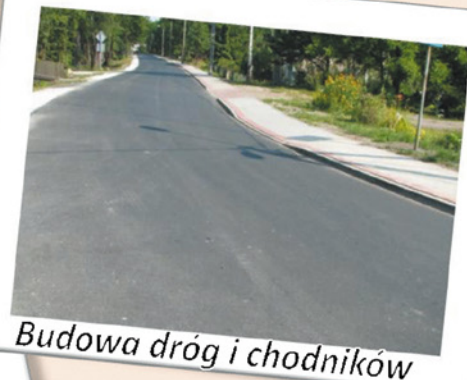
Budowa dróg i chodników