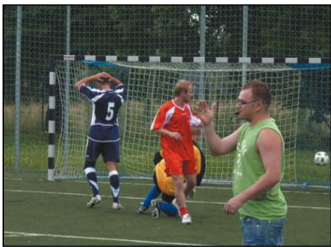
Wielkim turniejem piłki nożnej uczczono 30 obchody Solidarności w Jaworzynie Śląskiej

„Solidarność” przy ZPS „Karolina” sp. z o.o. zapowiada, że podobne imprezy będą organizowane w przyszłości nie tylko w okolicach rocznicy podpisania Porozumień Sierpniowych.