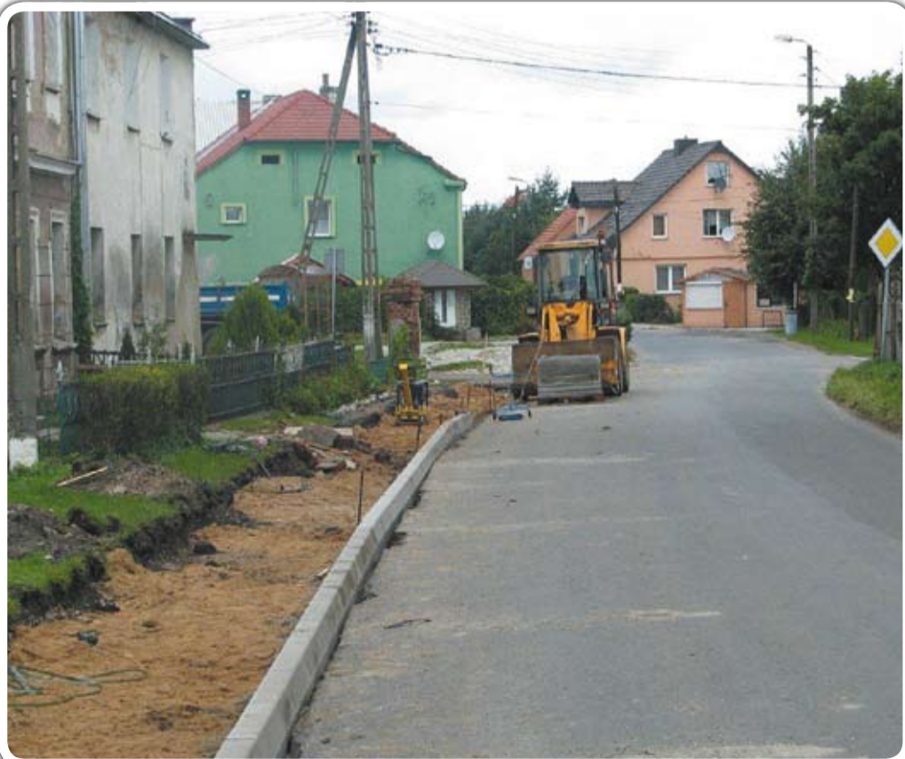
Powstają również chodniki. Rozpoczęto budowę chodnika w Nowicach

Boisko w godzinach zajęć szkolnych będzie służyło uczniom. Po zakończeniu pracy szkoły z boisko będzie dostępne dla wszystkich mieszkańców aż do wieczora, bowiem planuje się również jego oświetlenie. Wykonawcą prac, po przetargu nieograniczonym, została Firma Bud-Ziem z Pszenna, budująca m.in. jaworzyńskiego Orlika. Pozwala to mieć nadzieję, że inwestycja zostanie zrealizowana solidnie i terminowo, tak by uczniowie jeszcze we wrześniu mogli korzystać z boiska. Przewidywany koszt inwestycji to kwota blisko 400 tys. zł brutto. Warto zaznaczyć, że będzie to już trzecie nowoczesne boisko powstałe przy szkołach. W przyszłym roku planowana jest budowa podobnego boiska przy ostatniej z gminnych szkół w Starym Jaworowie