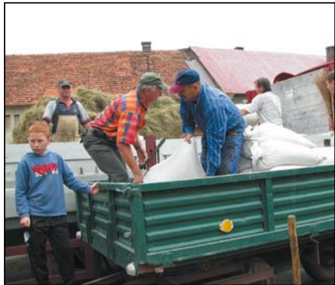
Rolnicy z naszej gminy nie zapomnieli o swoich kolegach z zalanych terenów