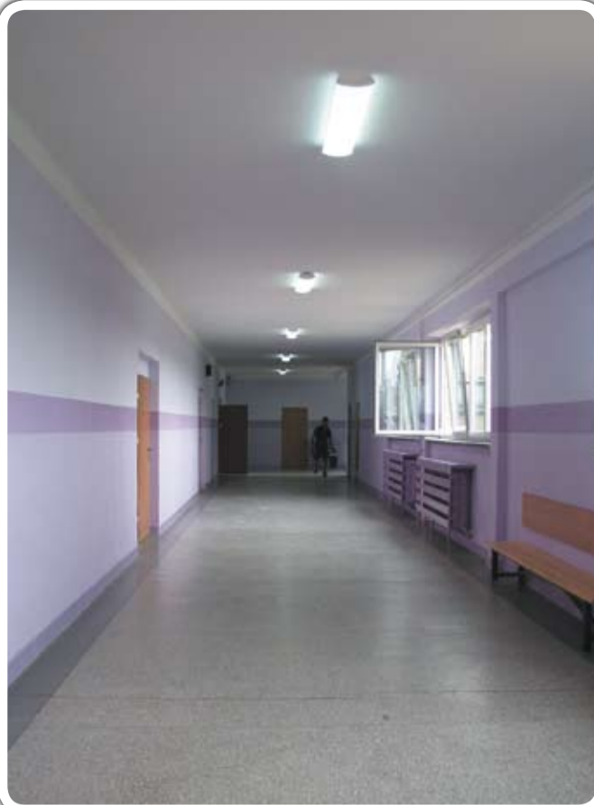
Wakacje to jak zwykle czas remontów w szkołach. Remont przeszło również jaworzyńskie gimnazjum