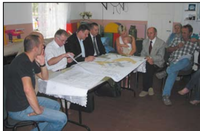
W ramach scalania gruntów na terenie wsi remontowane mogą być np. drogi i mosty

Sukcesem zakończył się udział w Programie Rozwoju Obszarów Wiejskich na lata 2007-2013, w zakresie działania „Poprawianie i rozwijanie infrastruktury związanej z rozwojem i dostosowywaniem rolnictwa i leśnictwa przez scalanie gruntów”, który obejmował Milikowice.