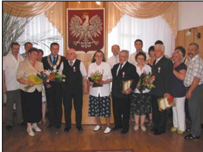
W uroczystości, która z tej okazji odbyła się w Jaworzynie Śląskiej parom towarzyszyły całe rodziny

księgi z życzeniami i kwiaty. Jubilatów składamy serdeczne gratulacje oraz życzymy wszelkiej pomyślności i zdrowia na dalsze lata wspólnego życia.