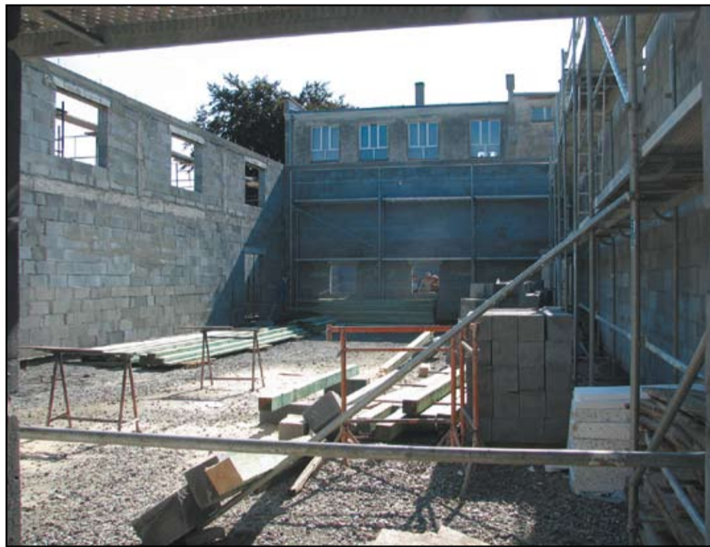
Trwają prace przy budowie wielofunkcyjnego budynku

Na realizację tego zadania gmina pozyskała środki finansowe zewnętrzne w wysokości 500 000 zł w ramach działania „Odnowa i Rozwój Wsi” objętego Programem Rozwoju Obszarów Wiejskich na lata 2007-2013. Pierwszy etap prac potrwa do końca sierpnia 2010 r. Obejmuje on wykonanie obiektu w stanie surowym otwartym. Po zakończeniu inwestycji obiekt będzie posiadał salę ogólnodostępną z przeznaczeniem na organizowanie imprez kulturalnych społeczności wiejskiej i gminnej, bibliotekę, zaplecze kuchenne, szatnię, pomieszczenia sanitarne, oraz magazyn sprzętu. Należy zaznaczyć, że z sali korzystać będą również dzieci ze Szkoły Podstawowej w Pastuchowie, które w nowej świetlicy znajdą również miejsce na zajęcia wychowania fizycznego.