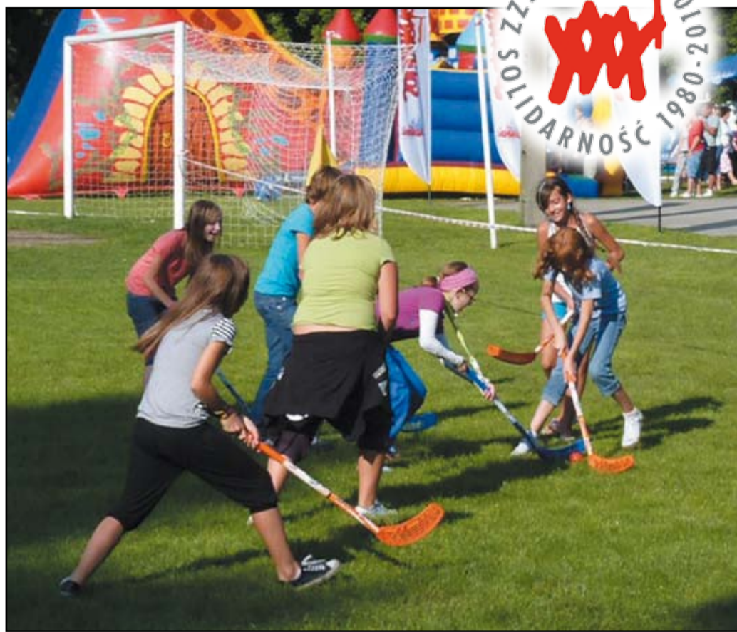
Dla każdego coś miłego, czyli dla najmłodszych znalazło się mnóstwo atrakcji

Podczas imprezy odbyła się także loteria fantowa dla członków NSZZ „Solidarność”, podczas której wylosowani szczęśliwcy otrzymali