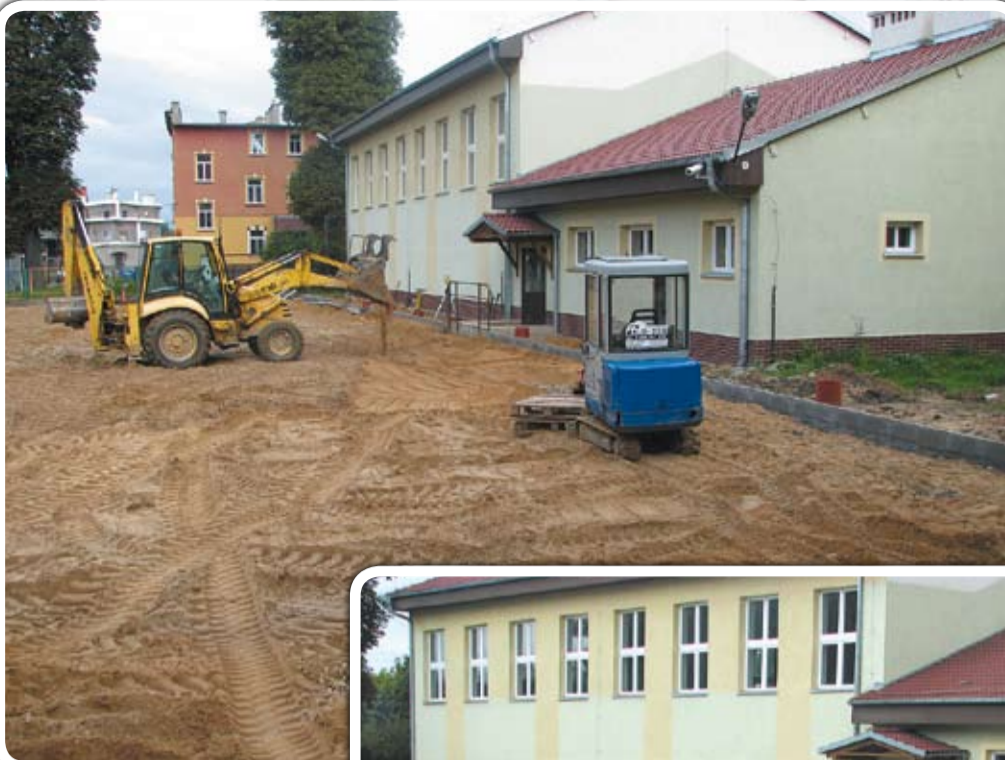
► Przy sali powstaje boisko wielofunkcyjne o wymiarach 20 m x 44 m, służyć będzie do gry w piłkę. Nawierzchnia boiska zostanie wykonana z tworzywa poliuretanowego z podbudową z kruszywa kamiennego oraz drenażem odwadniającym powierzchnię boiska. Teren przyległy zostanie utwardzony kostką betonową. Boisko zostanie ogrodzone siatką o wysokość 4 m

Rozstrzygnięto również przetarg na zadanie „Budowa przesyłowej sieci wodociągowej z SUW poprzez ul. Węglową i Świdnicką do Jaworzyny Śląskiej i Witkowa”, w wyniku którego udało się zaoszczędzić 1 mln. w stosunku do zakładanej kwoty. 500 tys. złotych na zrealizowanie zadania pochodzić będzie z Programu Rozwoju Obszarów Wiejskich, w ramach Działania Podstawowe Usługi dla Gospodarki i Ludności Wiejskiej. Inwestycja powinna zostać zakończona do czerwca 2011 r.