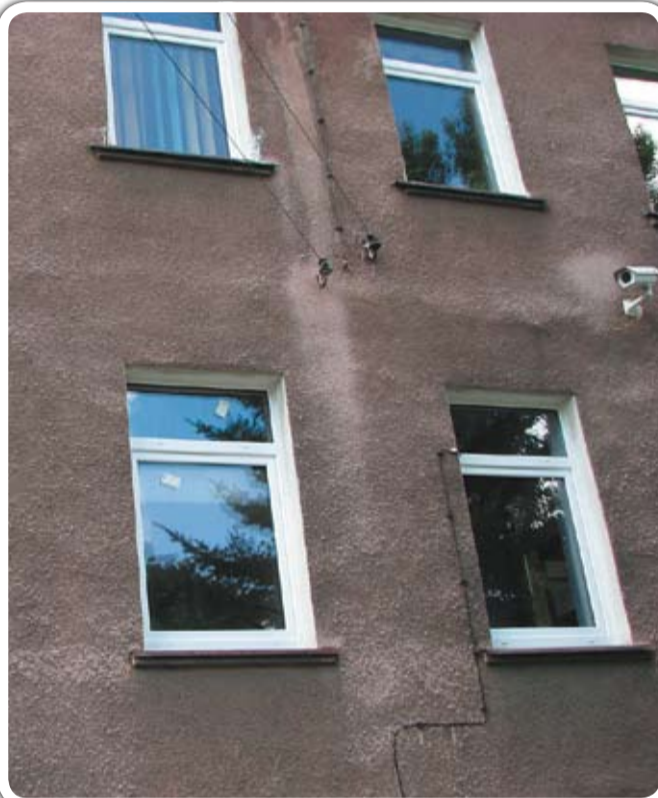
W Przedszkolu Samorządowym wymieniono okna. Zakres zrealizowanych prac obejmował demontaż starych oraz montaż nowych 46 okien z PCV wraz z obróbką murarską. Wykonawcą prac wartych blisko 24 tys. zł brutto była miejscowa firma. Na dzień dzisiejszy w budynku Przedszkola wymienione zostały już wszystkie okna