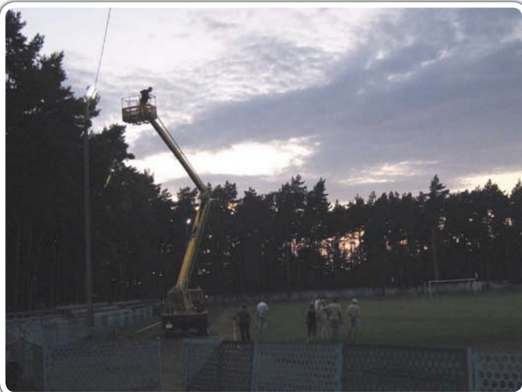
Remont stadionu miejskiego w Jaworzynie Śląskiej

Co zmieniło się na stadionie? Wymieniono stare, nieekonomiczne oświetlenie na nowe. Założono nowe przewody izolowane i zamontowano tablicę sterowniczo-bezpiecznikową. Zamontowano 12 szt. nowych projektorów oświetleniowych. Przeprowadzona modernizacja oświetlenia zasadniczo poprawi jakość oświetlenia na stadionie i pozwoli na przeprowadzanie treningów, a nawet zawodów w porze wieczorowej. Przy lepszej jakości oświetlenia zużywanej będzie jednocześnie mniej energii elektrycznej, co pozwoli na obniżenie kosztów oświetlenia. Koszt zadania to kwota ok. 50 tys. zł