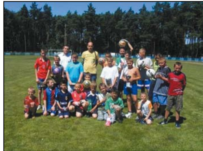
Podczas wakacji w Jaworzynie Śląskiej odbywały się spotkania dla dzieci, które w wakacje zostały w mieście