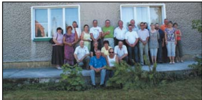
Spółdzielnia w Pastuchowie świętowała swoje 60 urodziny

Warto podkreślić, że w ostatnim rankingu Rolniczych Spółdzielni Produkcyjnych, przygotowanym przez Instytutu Ekonomiki Rolnictwa Gospodarki Żywnościowej Spółdzielni w Pastuchowie zajęła 62 miejsce.