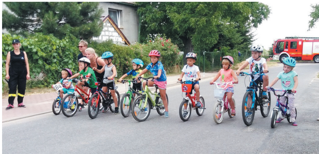
W zawodach mogą brać udział wszyscy, także najmłodszy adept jazdy rowerowej.

Szczegółowy regulamin dostępny jest na stronie www.mkskarolina.com .