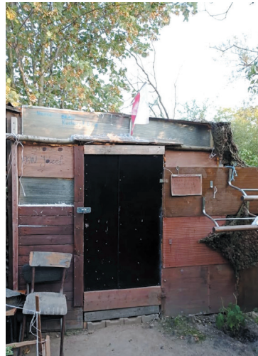
Po lewej altanka, po prawej zgłiszcza po pożarze.

Altana była dziełem nowickiej młodzieży. Zbudowali ją od podstaw w kwietniu 2020 r. - Podrzuciłem pomysł stworzenia takiego miejsca znajomym z wioski. Uzgodniliśmy wszystko