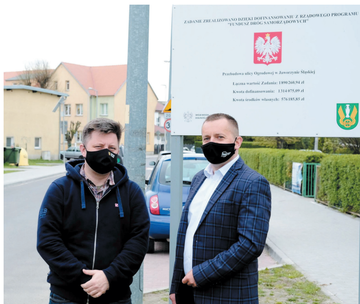
Minister Michał Dworczyk wspólnie z burmistrzem Grzegorzem Grzegorzewiczem zapoznał się z przebiegiem najważniejszych gminnych inwestycji.

Podczas wizyty minister zapoznał się także z wagą drugiej inwestycji, pn. przebudowa drogi w Starym Jaworowie, która znajduje się na liście rezerwowej, oczekującej na dofinansowanie w ramach pojawiających się oszczędności lub zwiększonej puli środków. Zakłada on przebudowę pasa drogowego o dł. 670 mb.