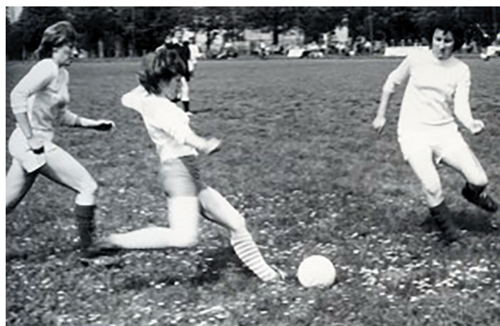
Żeńska drużyna piłkarska „Karolinki” dostarczała mnóstwo emocji.

budowę nowej siedziby. Inwestycję zrealizowano w ciągu dwóch kolejnych lat. W maju 2014 r. uroczystie oddano do użytku nowoczesny obiekt wielofunkcyjny na stadionie.