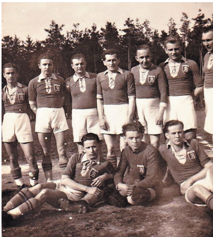
Drużyna KS Budowlani swój pierwszy mecz rozegrała 12 marca 1950 roku. (foto z 1948 r.)