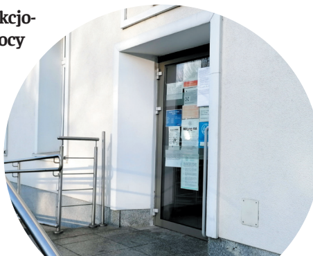
Spotkania będą odbywać się w soboty w siedzibie Ośrodka Pomocy Społecznej w Jaworzynie Śląskiej

Poradnia wygrała konkurs ogłoszony przez Urząd Miejski w Jaworzynie Śląskiej. Zgodnie z umową, od 15 marca działa telefon zaufania dla osób znajdujących się w kryzysie małżeńskim, rodzinnym i trudnościach wychowawczych (m.in. uzależnienie od komputera, telefonu). Aby uzyskać pomoc, należy dzwonić pod nr tel. 668 777 028