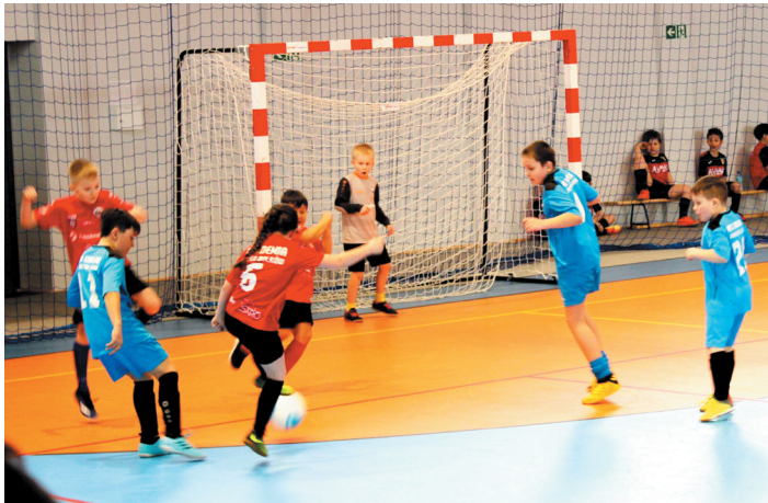
Zawodnicy zaprezentowali ogromne umiejętności piłkarskie.

8 drużyn rywalizowało ze sobą w turnieju piłki nożnej dla żaków, jaki został rozegrany w sobotę 13 marca w Jaworzynie Śląskiej. Co ważne, w rozgrywkach wyjątkowo nie liczyły się zdobyte bramki, lecz gra fair-play i dobra zabawa.