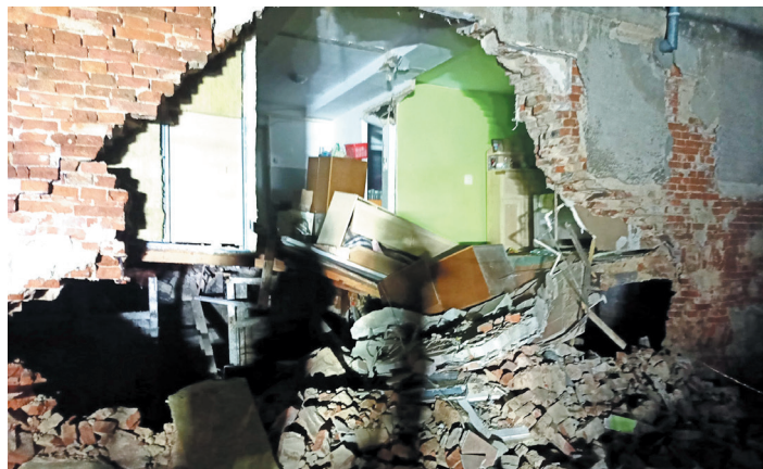
Ściana runęła 27 lutego. Teraz od dalszej decyzji wspólnoty będzie zależeć przyszłość budynku.