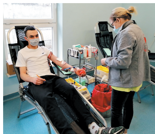
Styczniowa zbiórka krwi w Jaworzynie Śląskiej cieszyła się sporym zainteresowaniem mieszkańców gminy

W dniu oddania krwi należy być wy- spanym, wypoczętym i zdrowym, nie można wykazywać objawów prze- zię- bienia. Nie należy przyjmować żadnych leków (nie dotyczy to większości suplementów diety, czyli np. popularnych preparatów witaminowych czy środków antykoncepcyj- nych, należy jednak poinfor- mować o tym lekarza kwalifi- kującego). Przed przyjściem do centrum krwiodawstwa trzeba zjeść lekki posiłek, a w ciągu 24 godzin przed pobra- niem krwi wypić ok. 2 litrów płynów. Należy mieć przy sobie dokument tożsamości ze zdjęciem, najlepiej dowód osobisty. Przed oddaniem krwi należy także ograniczyć