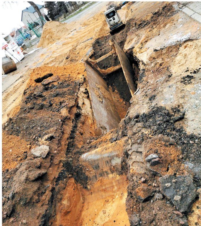
Trwają prace przy budowie kanalizacji w Pastuchowie. Na zdjęciu ul. Kolejowa

W drugiej połowie 2020 roku udało się wyłonić wykonawcę robót budowlanych – przedsiębiorstwo HYPMAR Mariusz Hypta z Modłęcina. Wyłoniono także firmę zarządzającą projektem, świadczącą nadzór archeologiczny oraz firmy świadczące nadzory inwestorskie w branżach: sanitarnej, elektrycznej i drogowej. 28 września 2020 r. przekazano wykonawcy plac budowy i rozpoczęto prace. – Udało nam się uzyskać oszczędności w trakcie prowadzenia postępowań przetargowych. Oferty zawierały niższe ceny, niż wstępnie zakładano. Te pieniądze Zakład Usług Komunalnych planuje przeznaczyć na realizację innego zadania z zakresu budowy kanalizacji sanitarnej