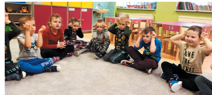
Przedszkolaki bardzo chętnie uczą się języka migowego. Co ciekawe, poznane znaki wykorzystują potem w zabawach.

Nauczanie języka migowego to niezwykła innowacja pedagogiczna, w jaworzyńskiej placówce realizowana jest w ramach projektu „Migające maluchy”. - Nauka polskiego języka migowego to nie tylko świetna zabawa dla dzieci, ale zapoznanie