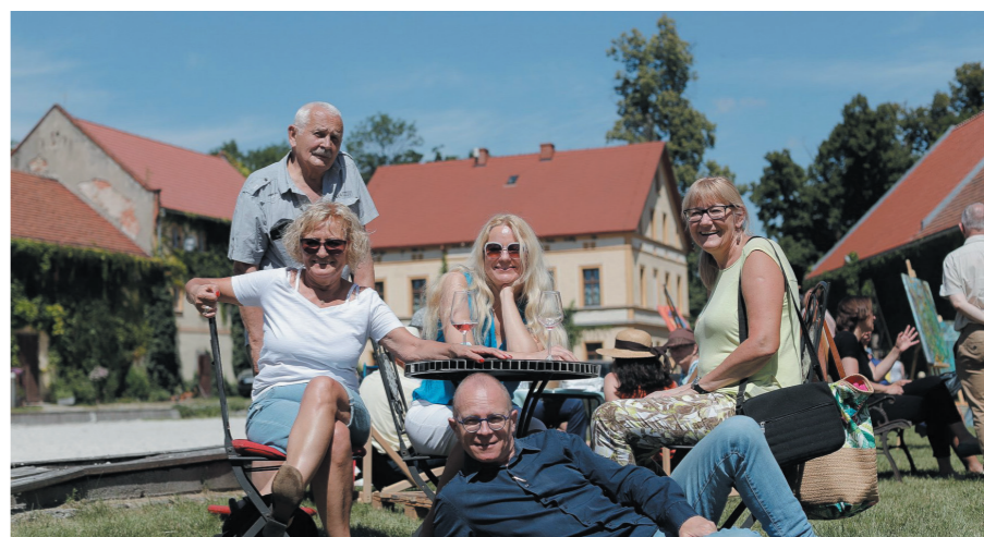
Fundacja Spichlerz Kultury jest organizatorem wielu wydarzeń społeczno-kulturalnych. Do kalendarza na stałe wpisują się m.in. Dzień Sąsiada, czy koncerty organizowane w ramach Festiwalu Bachowskiego