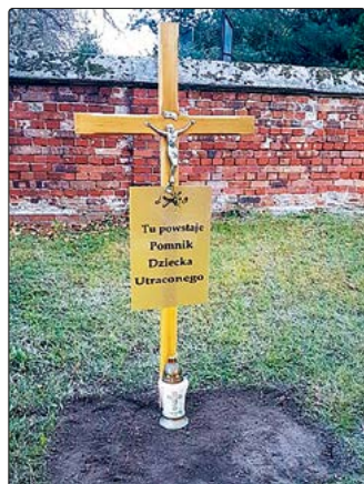
Pomnik ma powstać na miejskim cmentarzu

15 października każdego roku obchodzony jest na całym świecie Dzień Dziecka Utraconego - dzień pamięci o dzieciach, które straciły życie w wyniku poronienia lub zaraz po narodzeniu. Dla tych dzieci oraz ich rodziców i rodzin chcemy wybudować skromny pomnik na cmentarzu komunalnym w Jaworzynie Śląskiej. We wrześniu 2019 roku zawiązał się Społeczny Komitet