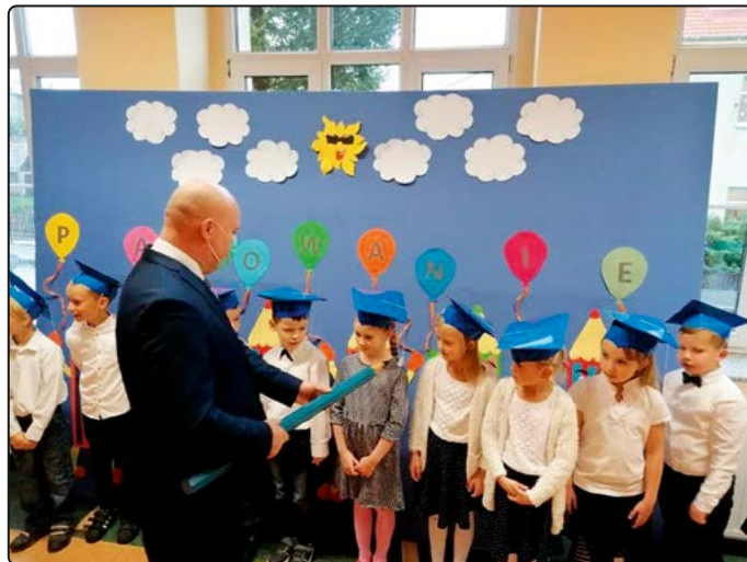
› Pasowanie na ucznia

roku. Rangę wydarzeniu nadają dyrektorzy szkół i ich wielkie ołówki lub długopisy, którymi dokonują pasowania. Dzieci z tej okazji przygotowują program artystyczny. Rozdawane są legitymacje uczniowskie i drobne upominki pomagające w nauce. Niestety w tym roku pandemia powoduje liczne