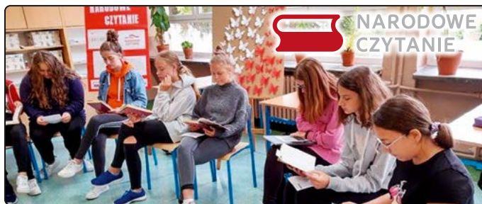
› Narodowe Czytanie w Szkole Podstawowej w Jaworzynie Śląskiej

sięganie do największych dzieł polskiej literatury. W tym roku wybór padł na „Balladynę” Juliusza Słowackiego. Czas epidemii w sposób szczególnie pokazał, jak duże znaczenie mają książki. W sytuacji, gdy osobiste relacje międzyludzkie stają się problematyczne, książki dają jakąś namiastkę tego, co zabiera epidemia. Sięgając po polską literaturę,