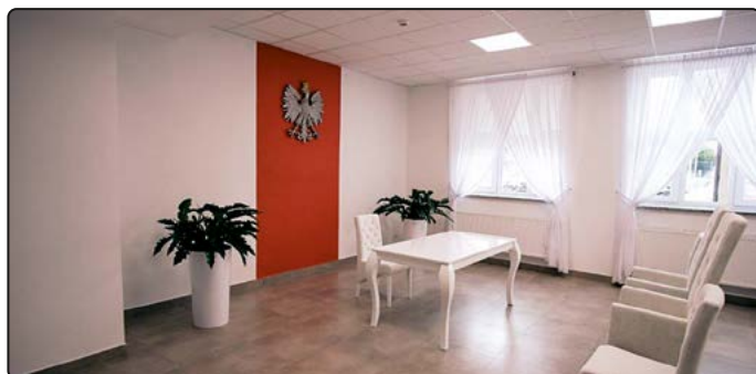
› Sala ślubów i Urząd Stanu Cywilnego funkcjonują przy ul. Powstańców 3

Warto również przypomnieć, że obok pomieszczeń biurowych, latem do użytku została oddana nowa sala ślubów, w której nowożeńcy mogą zawrzeć cywilny związek małżeński.