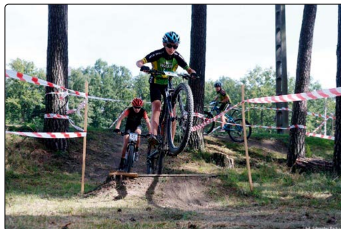
... i była bardzo wymagająca...