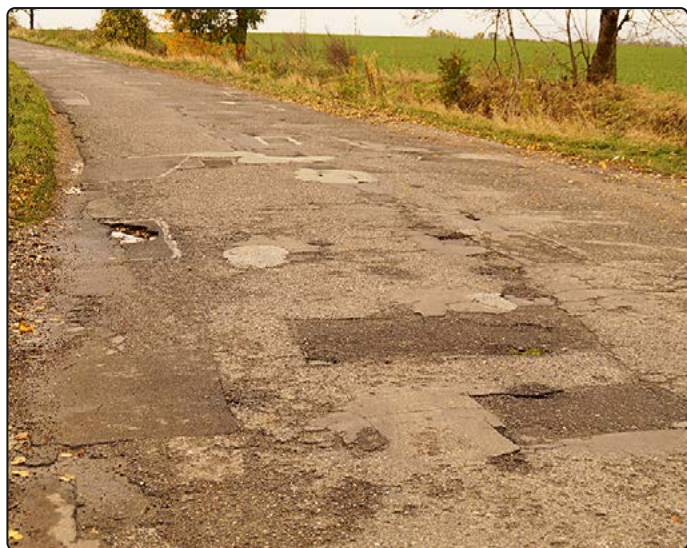
› Droga Jaworzyna Śląska-Bolesławice czeka na remont

Wyłonieniem wykonawcy udało się zakończyć przetarg na remont drogi gminnej Jaworzyna Śląska-Bolesławice.