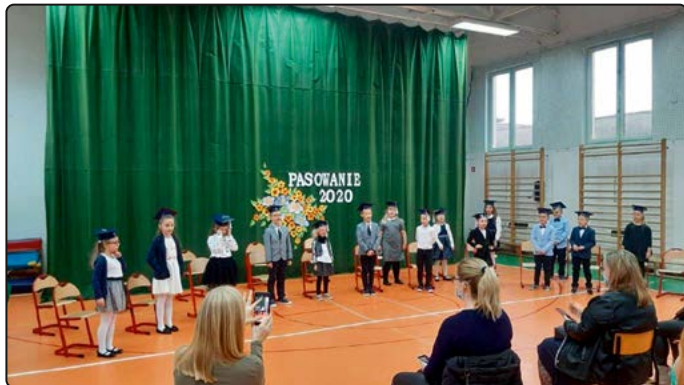
› Pierwszy występ na szkolnym apelu

roku szkolnego, to zazwyczaj pierwsza większa szkolna uroczystość z udziałem pierwszaków. Najmłodszy z niecierpliwością czekają na dzień, w którym staną się prawdziwymi uczniami i poprzez pasowanie zostaną włączeni do społeczności szkolnej. Dzień pasowania często organizowany jest, gdy upłynie już kilka pierwszych tygodni na-