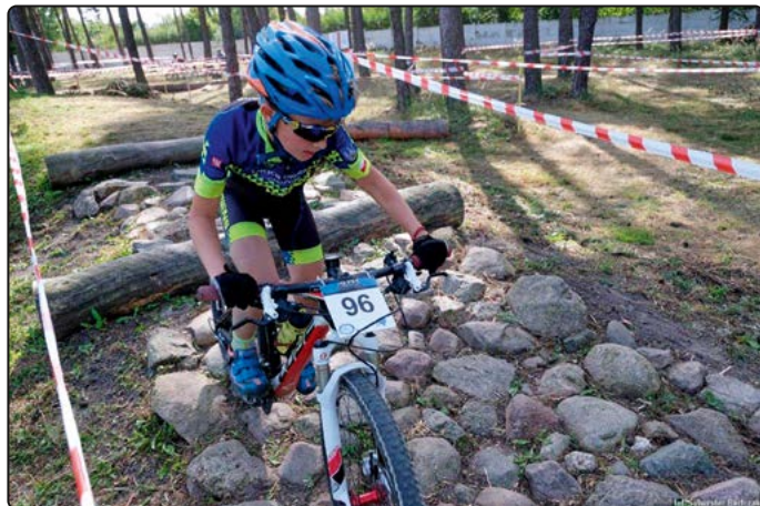
Trasa została wyznaczona na stadionie...

Na starcie w tym roku zameldowało się 135 młodych adeptów kolarstwa.