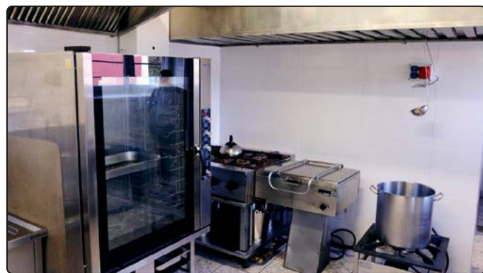
› Oprócz remontu stołówka szkolna wyposażona została w nowe sprzęty

Dodać należy, że w stołówce szkolnej przygotowywane są smaczne i zdrowe