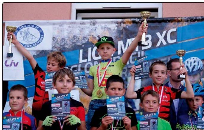
... a satysfakcja kolarzy duża