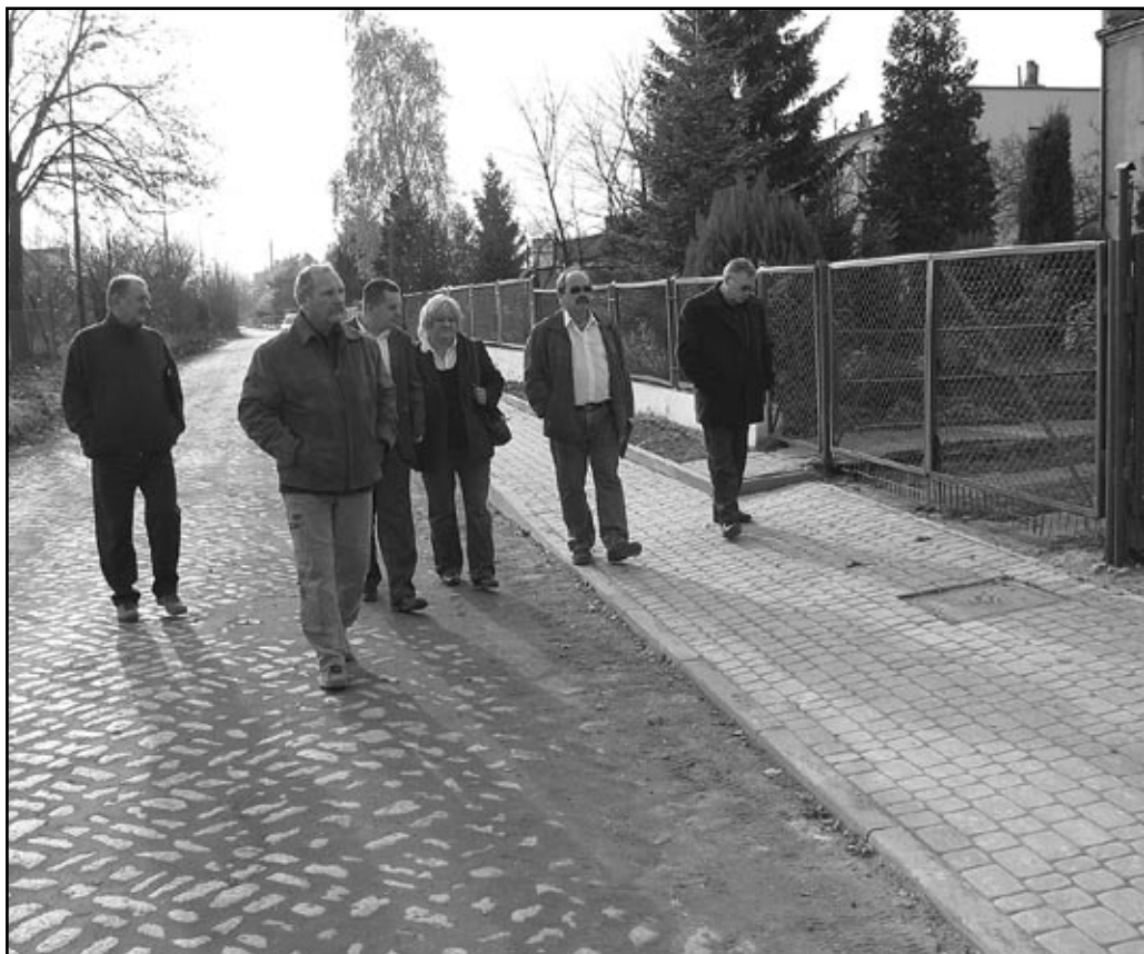
Remont chodnika we wsi Pastuchów zakończony, w obecności władz gminy inwestycja została odebrana