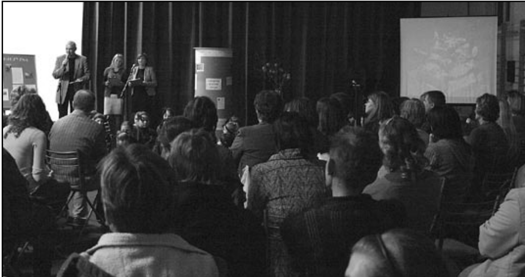
Uczniowie Szkoły Podstawowej w Starym Jaworowie pamiętają o ludziach najbardziej potrzebujących, to właśnie dlatego postanowili pomóc chorym dzieciom