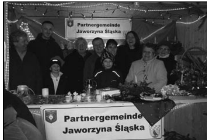
Delegacja z wsi Bolestawice i Stary Jaworów gościła w niemieckim mieście Pffeffenhausen

jak najlepszej strony. Na pięknie przybranym stoisku ugięto się od różnych świątecznych smakołyków, własnoręcznie wykonanych ozdób choinkowych, stroików, porcelany i gadżetów promocyjnych. Nasze stoisko cieszyło się ogromnym powodzeniem i zainteresowaniem.