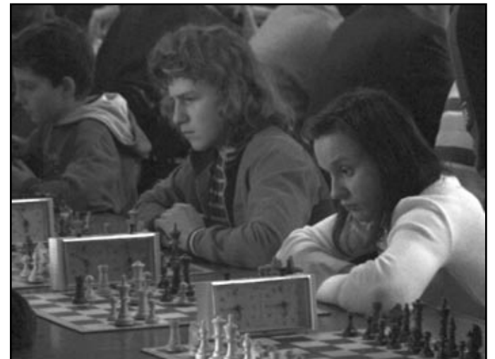
Prawdziwa frajda dla fanów szachów. 6 grudnia w Jaworzynie Śląskiej rozegrany został Mikołajkowy Turniej Szachowy