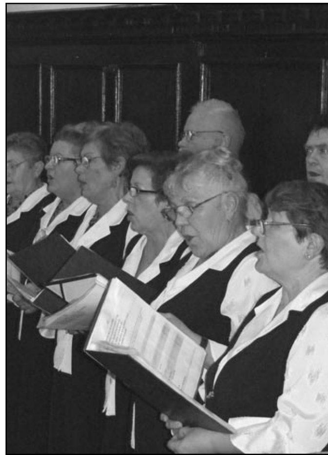
Tegoroczne obchody święta 11 listopada uświetnił występ zespołu „Wrzosi”, który zaśpiewał pieśni patriotyczne

◀ W spotkaniu zorganizowanym z okazji obchodów odzyskania przez Polskę niepodległości wzięli udział mieszkańcy oraz władze gminy