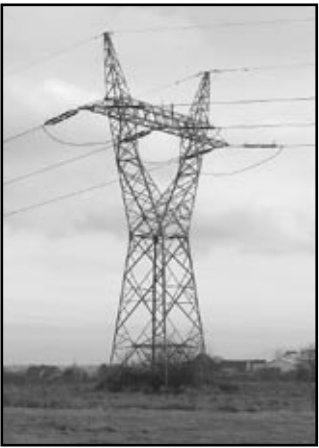
Tradycyjne linie przesyłu energii sąsiadują z zabudowaniami mieszkalnymi. Porównanie ich estetyki z estetyką wiatraków jest oczywiście kwestią subiektywnych ocen...

W kolejnym dniu obrad, bowiem było już po północy radni przystąpili do prezentacji przygotowanych wcześniej apeli. Większość rajców zdecydowała się poprzeć apel do posłanki Zalewskiej . Apelują w nim o zaangażowanie w prace legislacyjne, których efektem będą precyzyjne przepisy regulujące problematykę farm wiatrowych (treść przyjętego apelu prezentujemy w ramce). Zakończona po pierwszej w nocy następnego dnia, sesja stworzyła na pewno możliwość prezentacji argumentów obu stronom, ale czy zmieniła przekonania jej uczestników? Czas pokaże. Przeciwnicy wiatraków zapowiedzieli bowiem dalszą walkę z... wiatrakami.