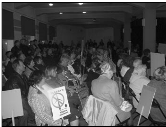
Salę widowiskową Samorządowego Ośrodka Kultury wypełniło ponad 150-ciu mieszkańców. Było to nadzwyczajne posiedzenie Rady Miejskiej w Jaworzynie Śląskiej. Wśród nich byli zarówno zwolennicy i przeciwnicy wiatraków oraz mieszkańcy, którzy postanowili poznać argumenty obu stron. Przeciwnicy wiatraków wyposażyli się nawet w specjalne tabliczki, chcąc wyrazić w ten sposób swój protest przeciwko budowie elektrowni