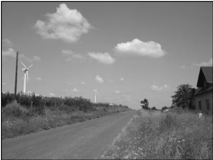
W innych częściach kraju odległość wiatraków od zabudowań mieszkalnych jest znacznie mniejsza niż 500 metrów