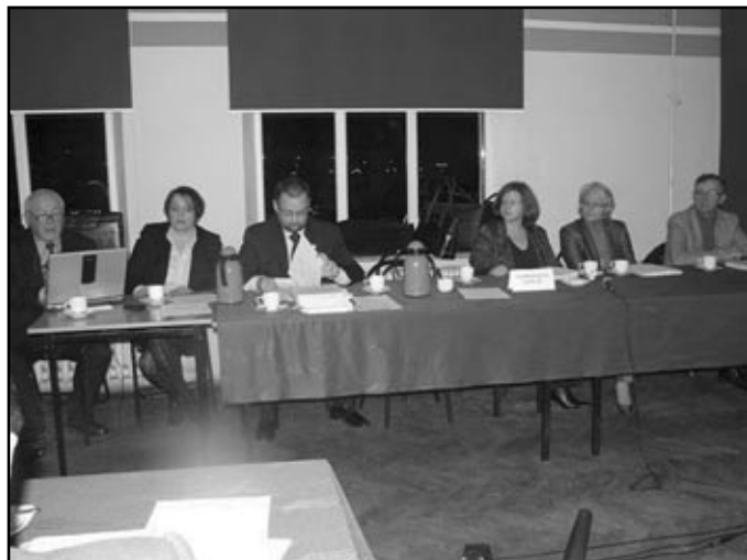
Zaproszeni goście starannie prezentowali swoje racje. Odpowiadając na liczne pytania z sali

Po wystąpieniach zaproszonych gości Przewodniczący Rady Miejskiej rozpoczął dyskusję. Gorąca na początku