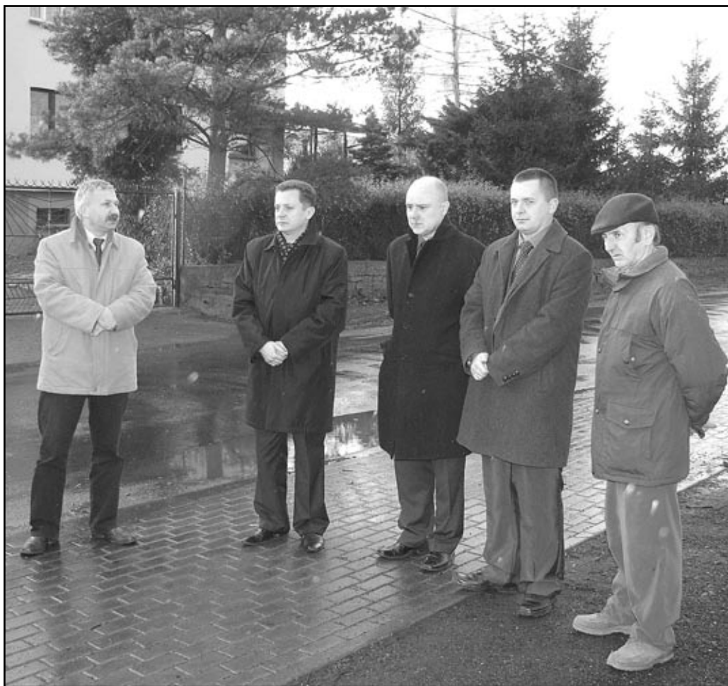
W odebraniu chodnika uczestniczyły nie tylko władze samorządowe gminy Jaworzyna Śląska ale również przedstawiciele starostwa i sołectwa (wszyscy na zdjęciu)