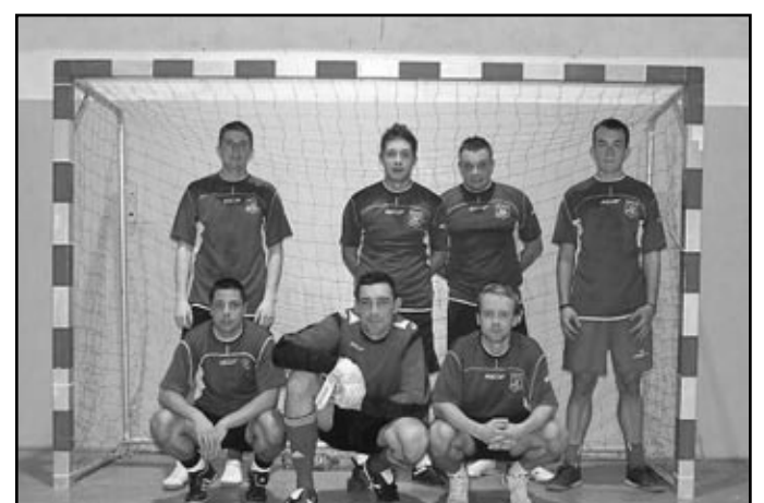
Drużyna „Docenianych” w pełnym składzie