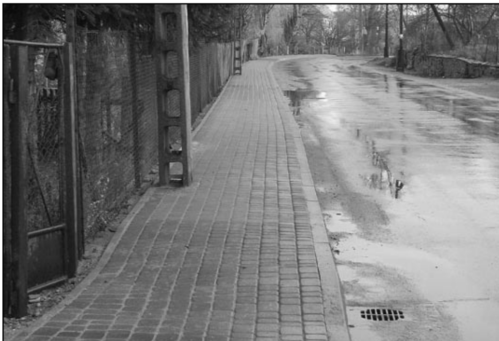
To kolejny oddany do użytku nowy chodnik w tym roku. Przypomnijmy, iż zadanie udało się zrealizować dzięki zaangażowaniu władz samorządowych oraz powiatowych

Tel./faks: (074)585-41-36, e-mail: rozmailtości@jaworzyna.net