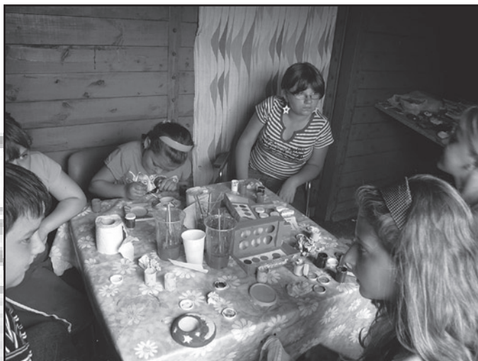
W pracowni ceramicznej powstają przepiękne dzieła artystyczne z gipsu. Odlewane, później malowane zasilają galerię, w której każdy chętny może je kupić. To będzie również wspaniała pamiątka niezapomnianych chwil spędzonych z jaworzynskim muzeum