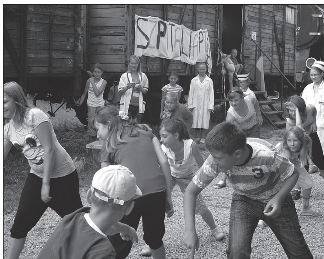
Dużym powodzeniem cieszył się taniec, którego choreografię tworzyli mieszkańcy Miasta Dzieci oraz wolontariusze