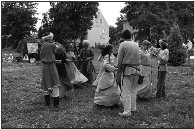
Średniowieczne tańce i zabawy zawsze są jedną z większych atrakcji

Średniowieczny. Na zaproszenie Bractwa Rycerskiego Św. Barbary stały się następujące grupy rekonstrukcji historycznej: „Cornu Cervi” z Osady Kopaniec, Bractwo Rycerskie Zamku Grodno, Strzegomscy Joannici oraz Chorągiew Rycerstwa Śląskiego „Vratislavia”. Przybyli widzowie mogli obejrzeć podczas imprezy pokazy walk