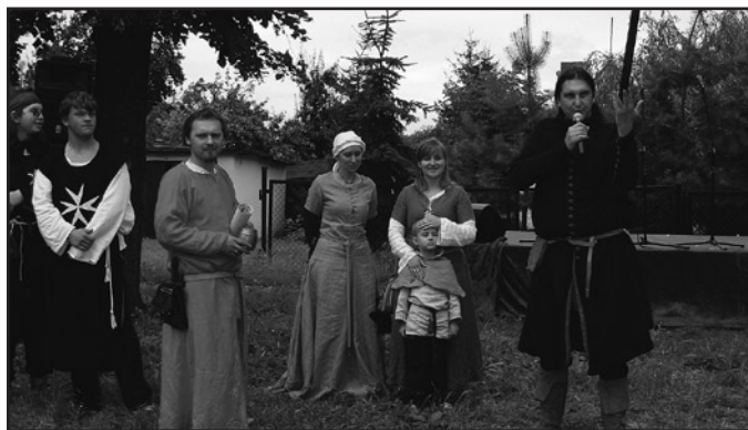
Organizacja średniowiecznych festynów już na stałe wpisała się w harmonogram prac jaworzyńskiego Ośrodka Kultury, również z roku na rok efekty tej pracy są powalające a mieszkańcy doskonale się bawią

wykonaniem nowej nawierzchni chodników wraz z wymianą obrzeży trawnikowych przy ulicach Ekerta i Kościuszki w Jaworzynie Śląskiej. W ramach zadania ułożono blisko 1 200 m 2 nawierzchni z kostki betonowej wraz z dojazdami do budynków. Wszystko dzięki staraniom władz miasta.