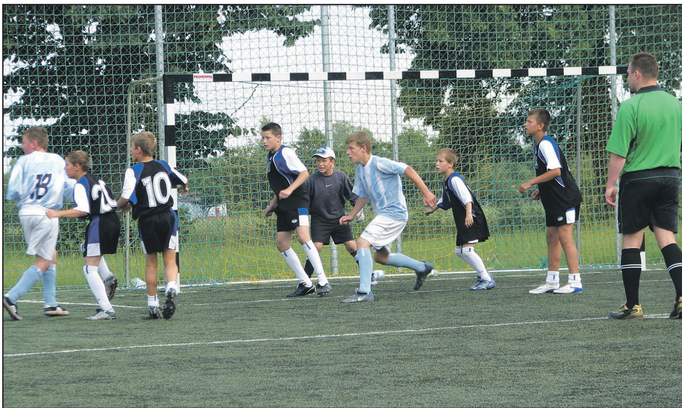
W ubiegłym roku w Jaworzynie Śląskiej otwarte zostało boisko Orlik. Od początku cieszyło się ono ogromnym uznaniem. Co chwilę są tam prowadzone rozgrywki

Wszystkim wymienionym składamy w tym miejscu podziękowania za zaangażowanie w organizację rozgrywek. Impreza została dofinansowana ze środków budżetu gminy.