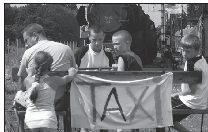
W „Mieście Dzieci” nie brakuje postoiu taxi i taksówki, którą w tym wypadku jest zabytkowa drewniana. Zawód taksówkarza jest jednym z najbardziej pożądanym fachem w jaworzynskim miasteczku. Nie ma się czemu dziwić

Kobiety, jak to kobiety większość czasu spędzały oczywiście w butikach z bardzo modnymi strojami