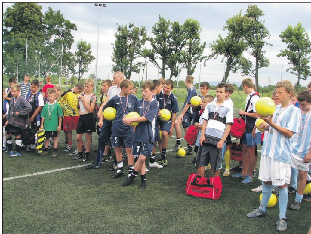
W tym roku na obiekcie rozegrana została już ósma edycja Otwartej Ligi Drużyn Podwórkowych. Zgłosiło się do niej sześć drużyn