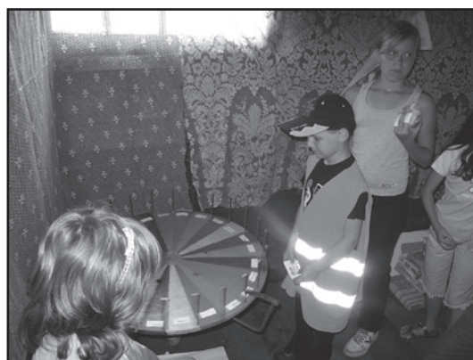
A po pracy trochę rozrywki. I to w salonie gier z prawdziwego zdarzenia. Choć nie ma tu ruletki, ale można poszukać szczęścia grając w koło fortuny. Każdy zwycięzca otrzymał fanty lub konkretną kasę czyli pociąg i lokomotywę