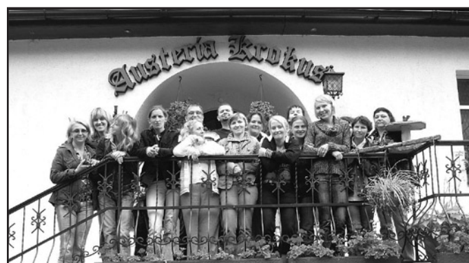
„Bądź aktywny na rynku pracy” – uczestnicy kilkudniowego szkolenia z zakresu autoprezentacji (na zdjęciu) z pewnością wiedzą już jak zaprezentować się pracodawcy, by otrzymać wymarzoną posadę

Pierwsze trzydniowe, trwające po 8 godzin zajęcia, z trzech kolejnych modułów, odbyły się jeszcze w maju a ich tematyką było „Skuteczna autoprezentacja”. Kolejne szkolenia pod nazwą „Bądź aktywny na rynku pracy” miały miejsce w czerwcu i w lipcu. Cykl szkoleń zakończył się w sierpniu, wtedy odbył się ostatni moduł. Obejmował on zagadnienia z zakresu asertywności. Zajęcia odbywały się w gospodarstwie agroturystycznym w