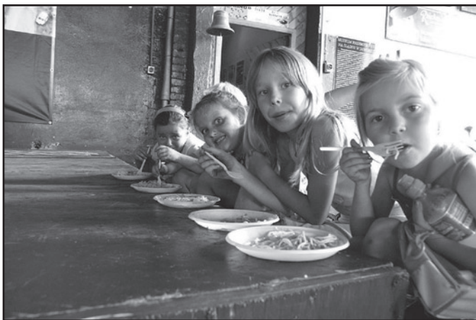
Tym razem na obiad pyszne spaghetti, ale wcześniej można było zjeść pyszne buteczki wypiekane w piecu Państwa Wychowanków piekarzy z Jaworzyny Śląskiej. Za dobrą pracę należy się dobra zapłata i dobry posiłek – to jedno z haseł Miasta Dzieci