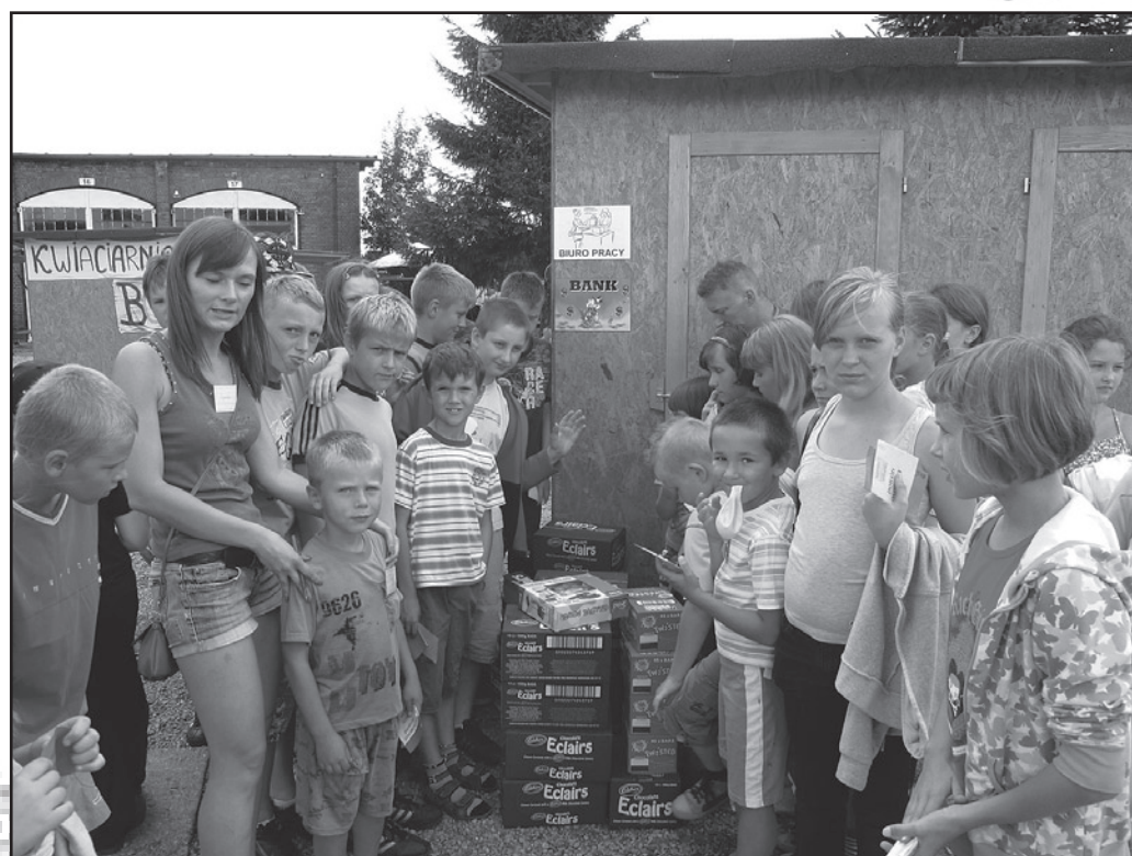
W „Mieście Dzieci” system pracy jest dwuzmianowy, a każda dniówka ogranicza się do dwóch godzin rzetelnej pracy w zawodzie. Koniec dnia pracy tuż przed obiadem, który dzieci jedzą w muzeum po raz kolejny sprowadza pracowników pod drzwi banku, gdzie wypłacana jest wypłata