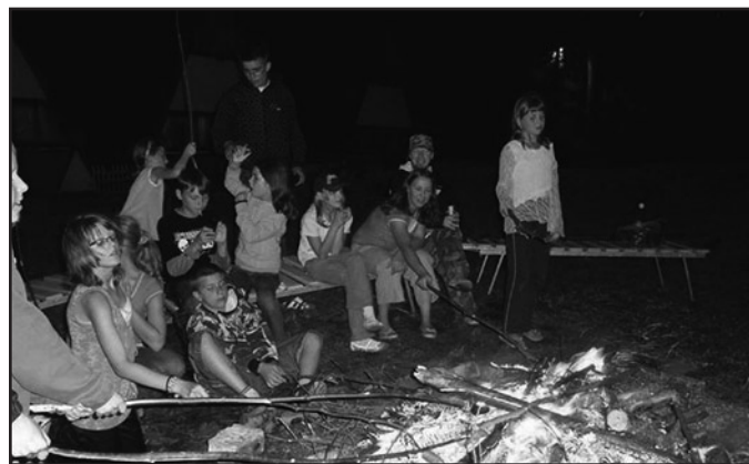
Wieczory dzieci spędzały przy ognisku, śpiewając i piekąc kiełbaski

W drodze konkursu do realizacji zadania wybrana została oferta Fundacji „Nasze dzieci” z Żarowa. Nad morze, do Sarbinowa wyjechało 25 dzieci. Podczas dwutygodniowej kolonii wakacyjne nie tylko cieszyli się pobylem nad Morzem Bałtyckim, ale również brali udział w zajęciach profilaktycznych. Nasi najmłodsi mieszkańcy wrócili