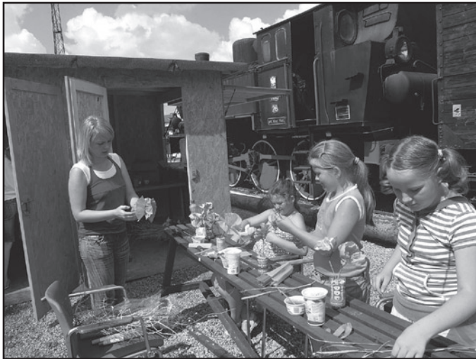
W kwiaciarni powstają piękne bukiety, które każdy z mieszkańców może kupić za zarobione wagony i pociągi. Takimi pięknymi wyrobami na pamiątkę byli też obdarowani sponsorzy i wolontariusze, którzy przyczynili się do realizacji edukacyjnego programu