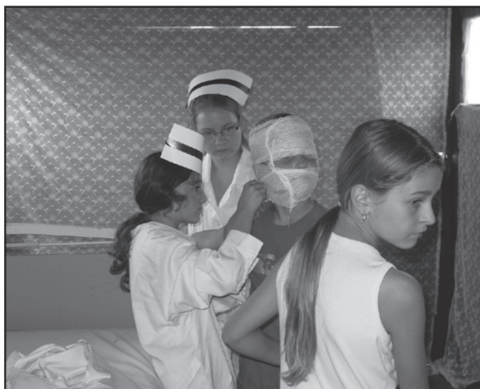
Blisko 200 dzieci uczestniczących w zajęciach pod stałą opieką wolontariuszy – studentów oraz szpitala, w którym każda dolegliwość zostaje natychmiast zdiagnozowana i leczona. Gdy nie ma pacjentów młodzi lekarze i pielęgniarki ćwiczą udzielanie pierwszej pomocy

którzy dzięki wolontariuszom dobrym chęciom i sponsorom sprawili, że dla wielu dzieci te wakacje pozostaną niezapomniane. „Miasto Dzieci”, które odbywa się w Jaworzynie Śląskiej po raz drugi to edukacyjna zabawa przeznaczona dla dzieci w wieku od 6 do 14 lat.