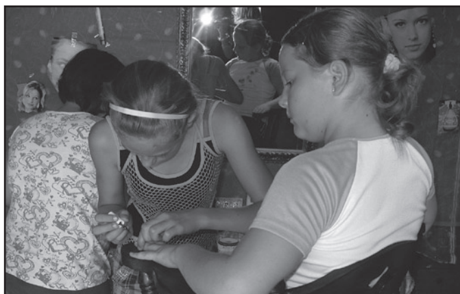
No proszę – tu można zarobić pracując w salonie piękności jako fryzjerka lub manicurzystka, ale też wydać zarobione lokomotywy. Laki, piękne paznokcie i modny makijaż wychodzą spod zdolnych rąk profesjonalistek, które pracują na niezłych kosmetykach i środkach pielęgnacyjnych