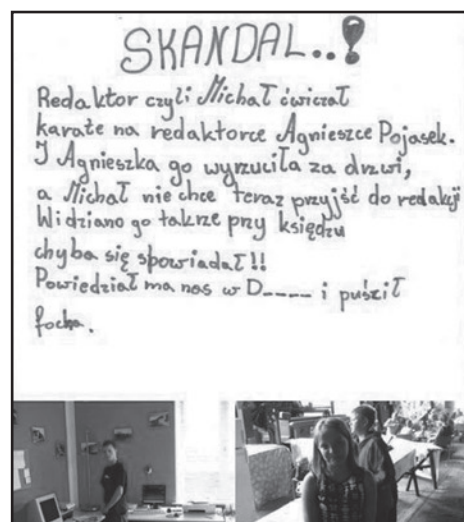
Jak w każdym porządnym mieście nie mogło zabraknąć niezależnej prasy, która rzetelnie relacjonowała wszelkie wydarzenia związane z życiem miasta. Dziennikarze prześcigali się w zdobywaniu miejskich informacji, a gdy ich brakowało opisywali incydenty, które miały miejsce w ich redakcji. A czasami było gorąco..