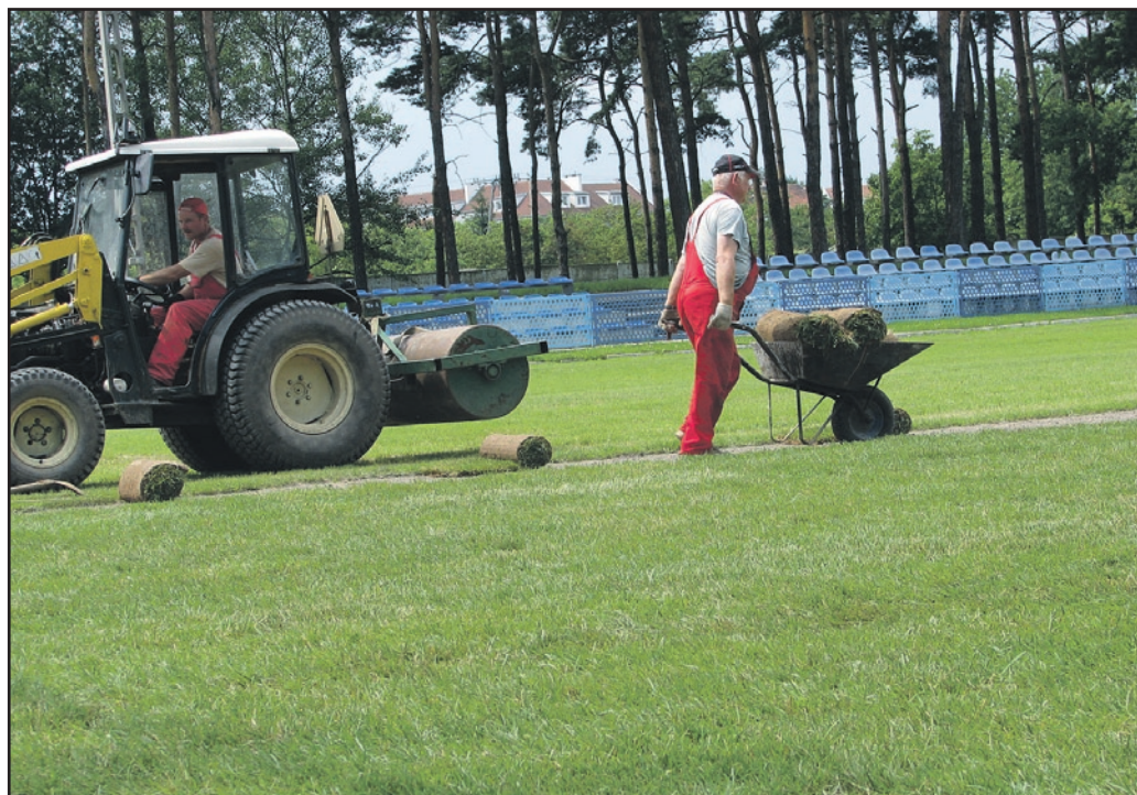
Prace remontowe przy głównej płycie stadionu miejskiego