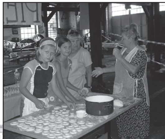
Nie lada wyzwanie. Dzieci uczyły się w mieście wszystkim, również tego jak upiec coś pysznego