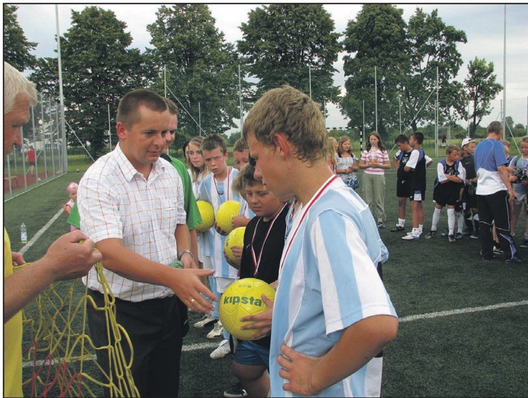
Nie było zwycięzców ani przegranych, każdy z uczestników otrzymał od burmistrza Jaworzyny Śląskiej upominki