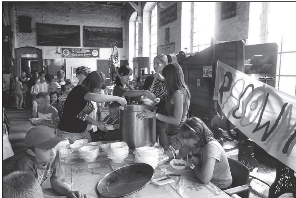
Po pracy jak w każdym dobrym przedsiębiorstwie można było zjeść posiłek regeneracyjny. Podopieczni i wolontariusze z Miasta Dzieci codziennie spożywali obiady dzięki restauratorom z powiatu świdnickiego. Podziękowania za naszym pośrednictwem skierowane są do firm Żar-Med Żarów, restauracji „Na Skarpie”, restauracji „Łażnia”, hotelu Piast Roman – ze Świdnicy, restauracji „Syrena” w Strzegomiu oraz piekarni Państwa Wychowanków w Jaworzynie Śląskiej