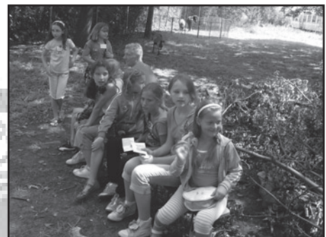
A po ciężkim dniu pracy czas na relax... może w zoo? Tak, tu w cieniu odpoczywa się najlepiej