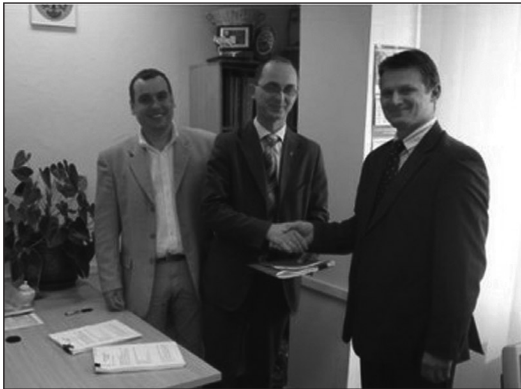
Lokalna Grupa Działania, która skupia siedem gmin naszego powiatu, w tym Jaworzynę Śląską zajmuje wysoką lokatę w województwie dolnośląskim