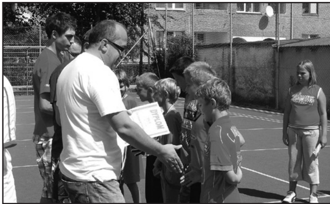
Dyplomy, medale i wspaniałe prezenty były nagrodami dla dzieci biorących udział w kolejnej edycji turnieju „Lato na korcie”

W drugiej edycji turnieju „Lato na korcie”, który został rozegrany 8 sierpnia wystartowało 5 drużyn.