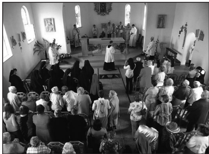
Uroczyste poświęcenie kościoła we wsi Czechy to z pewnością jedna z ważniejszych uroczystości dla jej mieszkańców