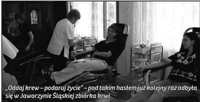
„Oddaj krew – podaruj życie” – pod takim hasłem już kolejny raz odbyła się w Jaworzynie Śląskiej zbiórka krwi

Mieszkańcy Jaworzyny Śląskiej kolejny raz udowodnili, jak ważne są dla nich zbiórki krwi. Ta, została zorganizowana już kolejny raz i kolejny raz frekwencja dopisała.