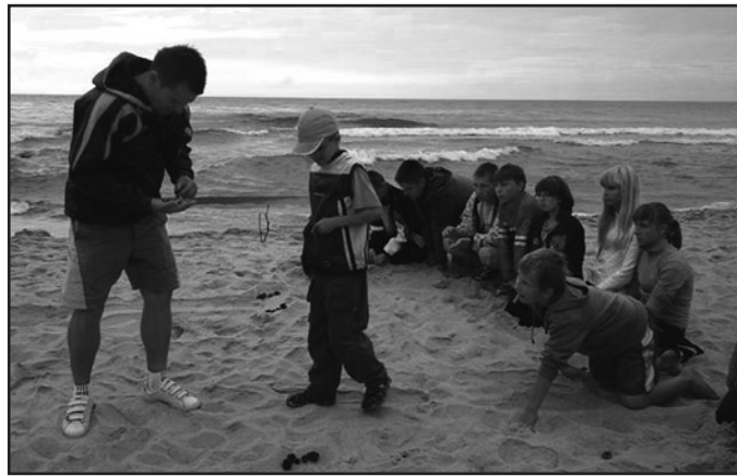
Dni upływały na spacerach i wspólnych zabawach na piaszczystej plaży