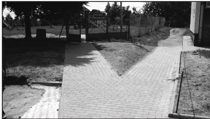
Chodniki przy ulicy Ekerta i Kościuszki w Jaworzynie Śląskiej zyskały na jakości. W sierpniu zakończył się ich remont

na niespodziewane oberwanie chmury impreza została w połowie przerwana, a rycerze zmuszeni byli stoczyć ostatnią walkę w strugach ulewnego deszczu. Również z tego powodu nie odbył się planowany koncert zespołu „Scandicus” oraz pokaz tańca z ogniem w wykonaniu grupy „Łatwopalni”.