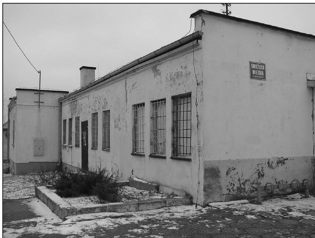
Budowa wielofunkcyjnej świetlicy wiejskiej w Pastuchowie

W tym roku planuje się również budowę świetlicy wiejskiej w Pastuchowie, która także będzie pełniła rolę łącznika dwóch budynków Szkoły Podstawowej w Pastuchowie. Koszt inwestycji wyniesie ok. 1 miliona 863 tysięcy złotych. W sfinansowaniu przedsięwzięcia ma pomóc wniosek składany w ramach Programu Rozwoju Obszarów Wiejskich – działanie 3.4 Odnowa i Rozwój Wsi. W obiekcie zaprojektowano salę, która będzie służyła społeczności wiejskiej w organizowaniu imprez społeczno-kulturalnych, spotkań społeczności wiejskiej jak i będzie służyła dzieciom Szkoły Podstawowej w Pastuchowie do zajęć wychowania fizycznego. W świetlicy będą znajdować się również takie pomieszczenia jak zaplecze kuchenne, pomieszczenia sanitarne oraz szatnie i pomieszczenie biblioteki.