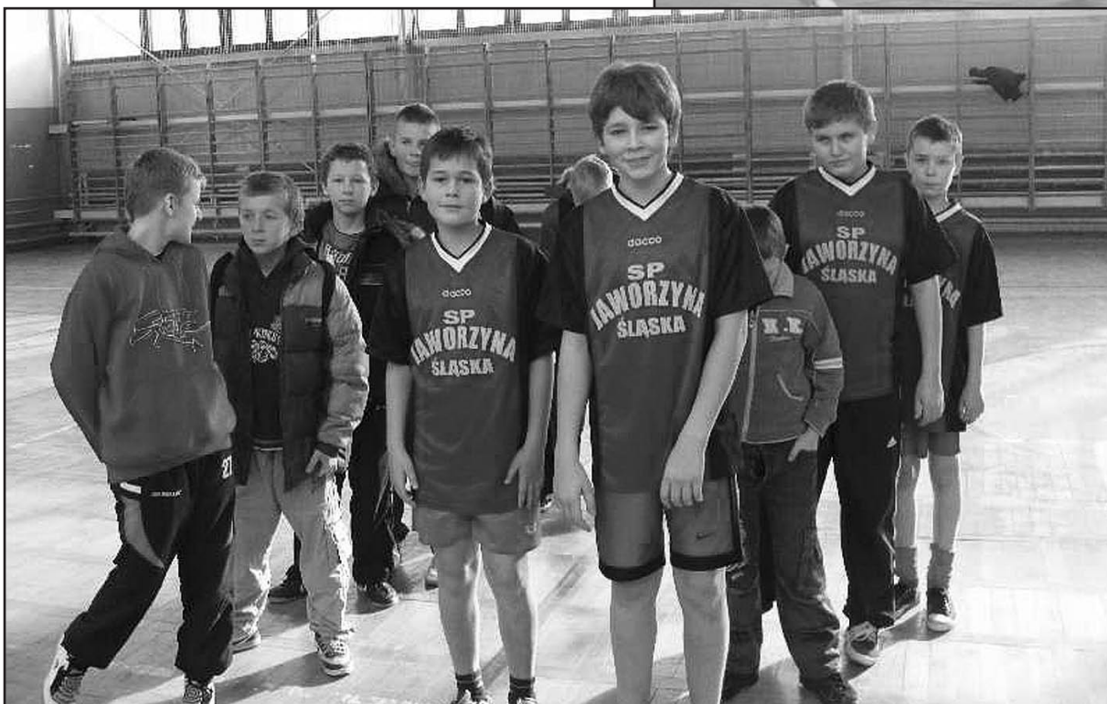
Uczniowie kontra samorządowcy – również oni sprawdzali swoje siły na boisku