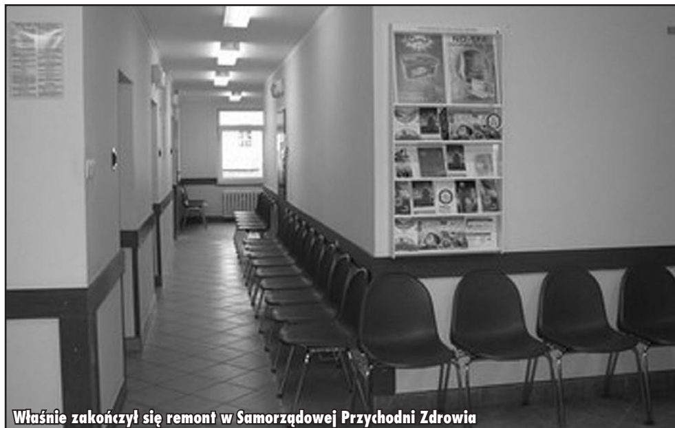
Właśnie zakończył się remont w Samorządowej Przychodni Zdrowia

Prace remontowe były prowadzone z reguły w weekendy, tak aby nie utrudniać sprawnej pracy przychodni i nie stanowić uciążliwości dla pacjentów. W ramach wykonanych prac pomalowano przyjemnymi kolorami pomieszczenia, zamontowano rolety oraz żaluzje w gabinetach. Dodatkowo zakupiono nowe krzesła dla oczekujących pacjentów a stare poddano renowacji. Wartość wykonanych prac wyniosła około 38 tysięcy złotych.