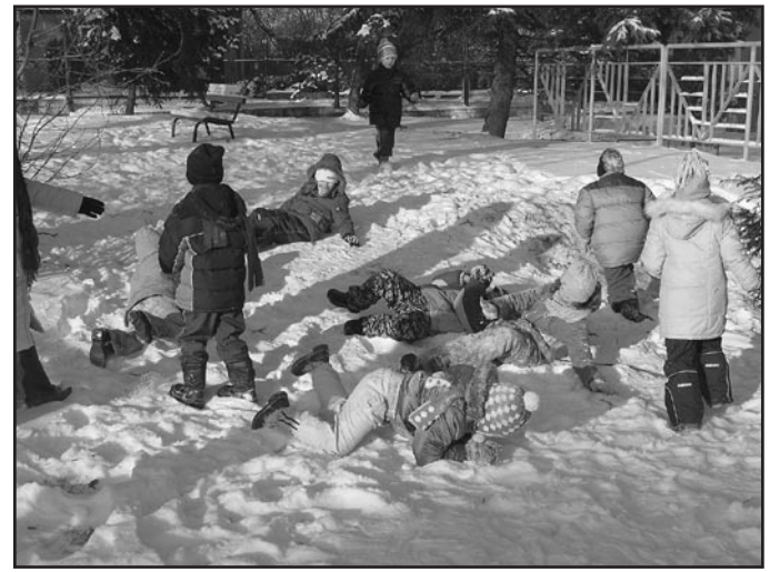
Kino, basen i mnóstwo innych atrakcji czekało na dzieci biorące udział w nowatorskim projekcie pod tytułem „Pożyteczne ferie”