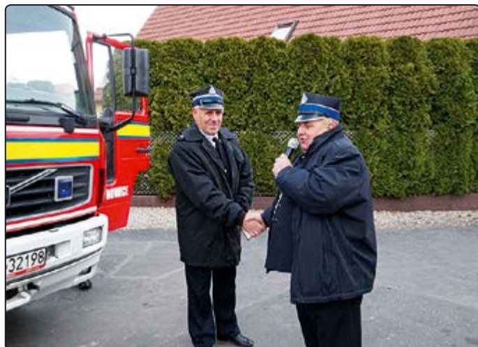
... natomiast VOLVO trafiło do Pasiecznej