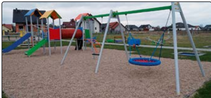
Plac zabaw powstał w ramach programu OSA

odpowiedniej bezpiecznej dla użytkowników nawierzchni. OSA – czyli Otwarta Strefa Aktywności powstała na jednej z gminnych działek pośród osiedla domków jed-