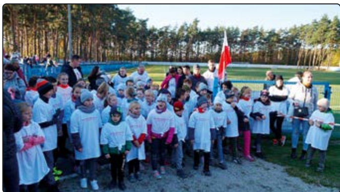
› Do biegu stanęli również najmłodsi

nia” na zaproszenie Fundacji Studio Wschód i TVP Polonia, mieli zaszczyt uczestni-