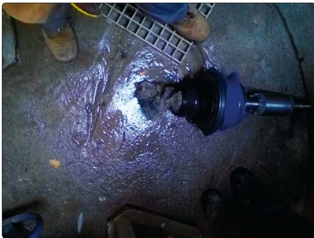
Unieruchomiony przez nieczystości (ścierka) wirnik pompy w tłoczni ścieków w Piotrowicach

Należy mieć świadomość, że niemal codzienne czynności związane z pracą urzędnika do udrażniania i oczyszczania kanalizacji obsługiwanego przez dwóch pracowników ZUK-u, czy też praca osób wyposażonych w spiralę elektryczną lub konwencjonalną