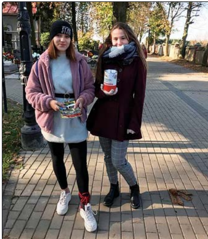
› Wolontariusze zbierali datki na wszystkich cmentarzach w naszej gminie

W tym roku do kwesty przyłączyła się również Szkoła Podstawowa z Pastuchowa oraz Szkoła Podstawowa ze Starego Jaworowa. Wolontariuszy wspierali również księ-