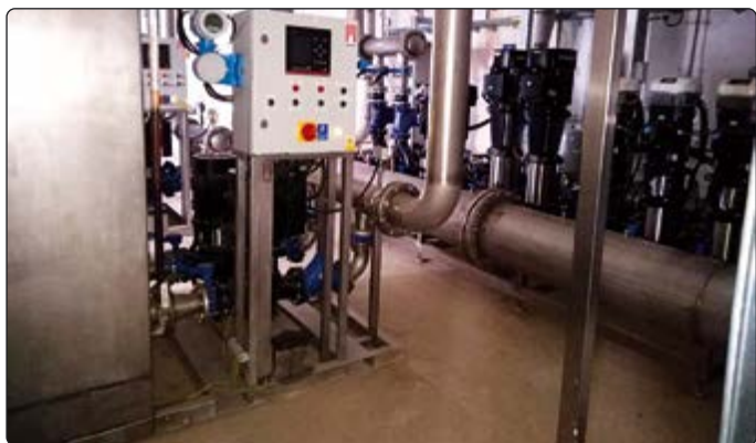
Stacja uzdatniania wody po gruntownej modernizacji

Z pewnością, w trosce o bezpieczeństwo mieszkańców w przyszłości, nie można pozwolić na pozostawienie bez reakcji podejmowania działań, jeśli nawet niemających w zamiarze, to faktycznie wywołujących niepotrzebny strach.