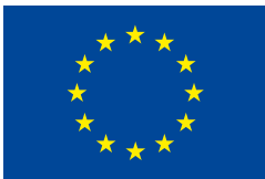
Europejski Fundusz Rolny na rzecz Rozwoju Obszarów Wiejskich