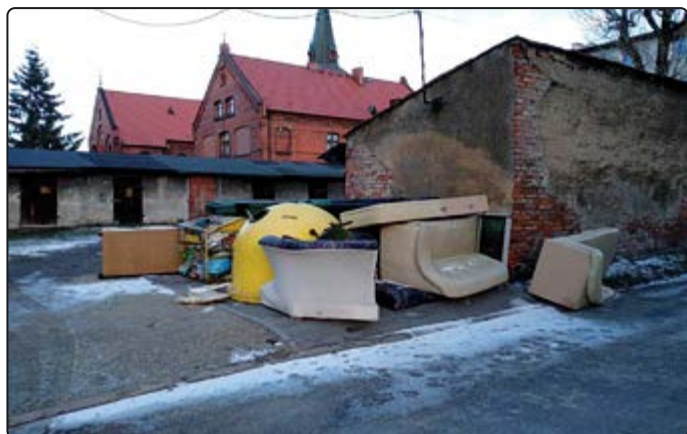
› Zadasz czystości - zachowaj ją sam!

każdej ilości), baterie i akumulatory, opakowania po farbach, zużyte opony z samochodów osobowych (jednorazowo w ciągu miesiąca do 10 sztuk), odpady zielone do Gminnego Punktu Selektywnej Zbiórki Odpadów Komunalnych (GPSZOK) znajdującego się na terenie ZUK przy ul. Świdnickiej 9, który jest czynny w każdą środę od 12.00 do 20.00 oraz w każdą sobotę od 8.00 do 16.00. Odpady wielkogabarytowe wystawiamy przed posesję tylko i wyłącznie w terminach zbiórek. W pozostałe dni odpady te nie będą odbierane. Tym samym unikniemy sytuacji przedstawionych na zdjęciach poniżej: