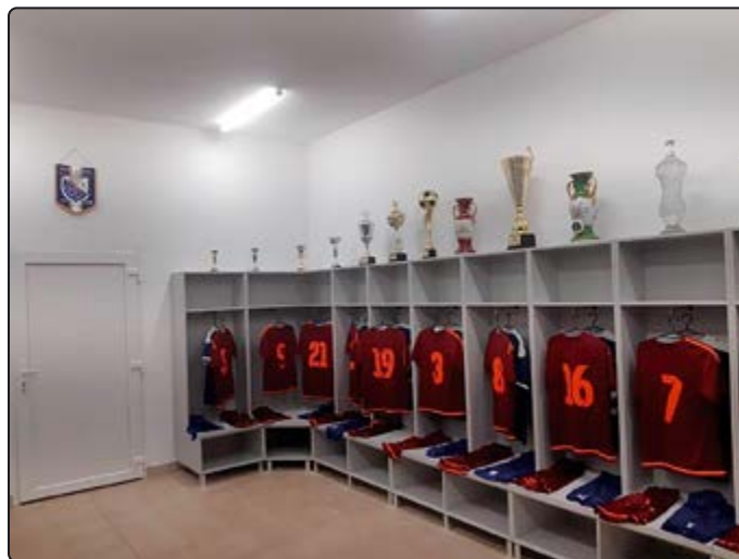
› Nowa szatnia Gromu Witków wewnątrz...

Oficjalne otwarcie obiektu połączone zostało z jubileuszem. 29 listopada oba wydarzenia świętowali piłkarze