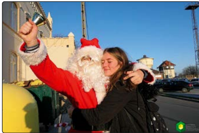
› Święty Mikołaj spacerował po ulicach miasta...

Wizyta Świętego Mikołaja mogła się odbyć dzięki sponsorom, którym składamy