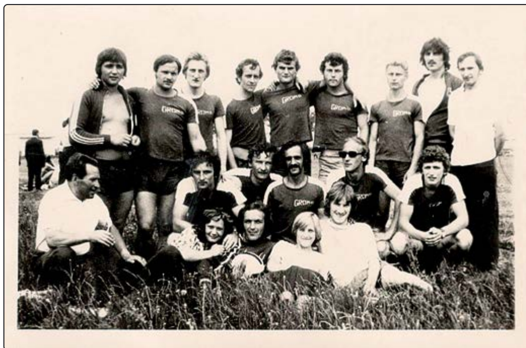
› Zdjęcie archiwalne drużyny Gromu Witków z lat 70-tych