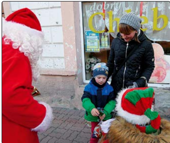
› ... oprócz uścisków rozdał także słodycze

kołaj rozdał, każdemu dziecku paczkę pełną słodkości, którą jak zapewnił, osobiście pakował ze swoimi pomocnikami. Dla dzieci to był wyjątkowy dzień, w którym nie zabrakło