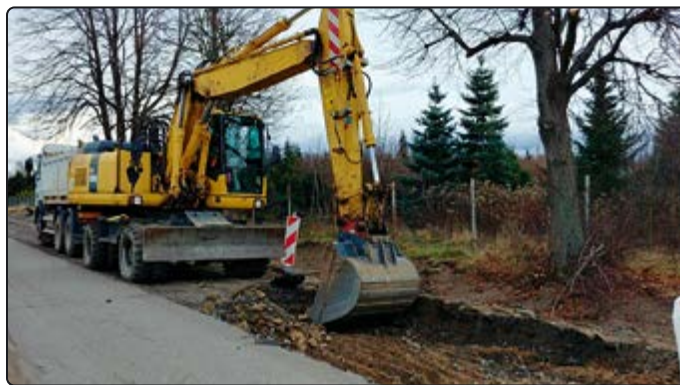
› Ciężki sprzęt wjechał na ul. Wolności

Na tym nie koniec dobrych wiadomości dotyczących infrastruktury drogowej. W 2020 roku przebudowana