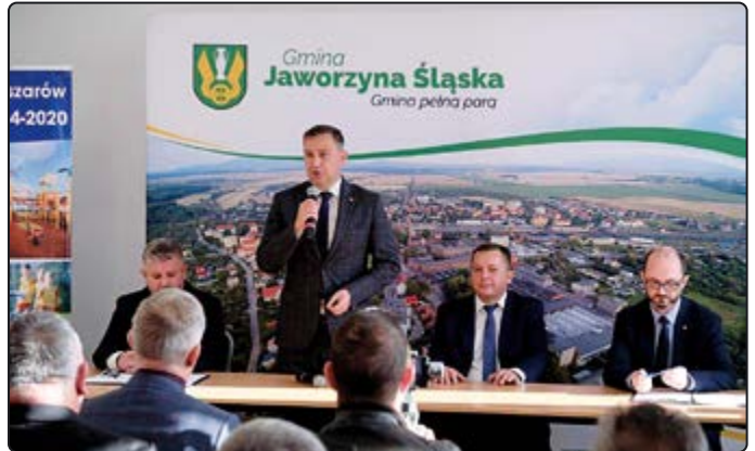
Podpisanie umowy miało miejsce w Jaworzynie Śląskiej

w całości pokryty ze środków zewnętrznych, z czego 5,120 mln zł stanowią środki refundowanych dotacji unijnych, natomiast pozostała część pochodzi bezpośrednio z budżetu Województwa Dolnośląskiego.