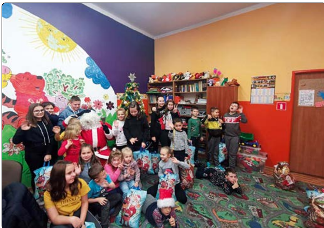
› ... gdzie został serdecznie przyjęty przez dzieci