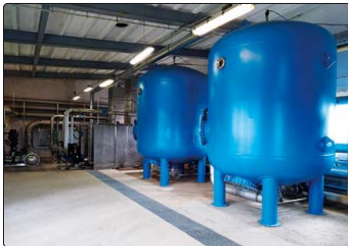
Nowoczesne filtry na stacji uzdatniania wody

1) doprowadzić wodę w następujących punktach: Bolesławice 25, Pastuchów ul. Wyzwolenia 22, „ZGKIM” Jaworzyna Śląska ul. Świdnicka 9, SUW Jaworzyna Śląska do norm sanitarnych pod wzglę-