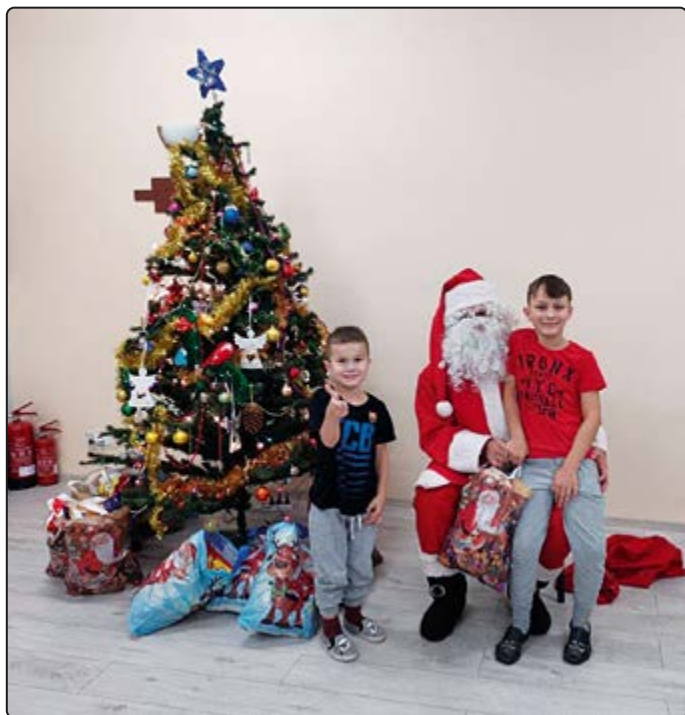
› Był także w świetlicach środowiskowych...