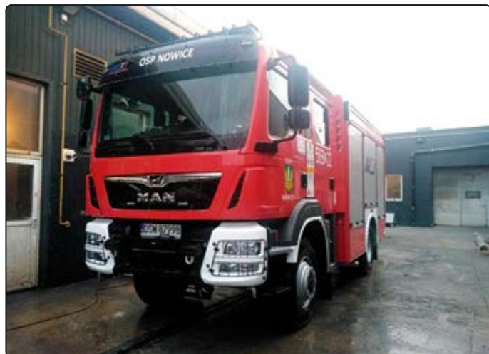
MAN prezentuje się okazale...

Dotychczas używanym Volvo strażacy z Nowic przejechali do Pasiecznej. Tam już pod remizą czekały druhy,