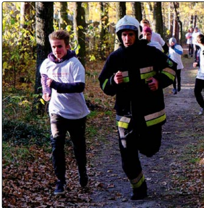
› Każdy z uczestników biegu biegł w dowolnie dobranym stroju

czyć w obchodach na Litwie. Tam uczestniczyli w uroczystościach, m.in. na terenie istotnej dla Polaków nekropolii – Cmentarzu na Rossie. Brali również udział w mniej oficjalnych uroczystościach biegając na etapie XXV Sza-