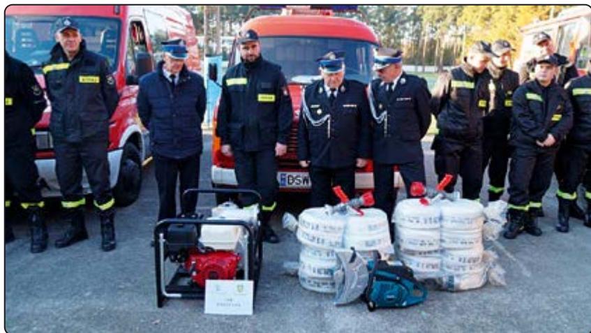
W dniu naszego narodowego święta strażacy odebrali sprzęt z programu „Mały Strażak”

w ramach programu „Mały Strażak”. Był to program realizowany przez Wojewódzki Fundusz Ochrony Środowiska i Gospodarki Wodnej we Wrocławiu, który miał na celu podnoszenie i unowocześnianie potencjału technicznego służb ratowniczych powołanych do zapobiegania i likwidacji zagrożeń środowiska i poważnych awarii i ich skutków mających wpływ na środowisko na terenie województwa dolnośląskiego. Do naszych jednostek trafiły m.in. motopompy szlamowe, motopompa, piły spalinowe, przecinarka do betonu i stali czy też kamera termowizyjna. Uroczyste przekazanie sprzętu jednostkom miało miejsce w Dniu Niepodległości na Stadionie Miejskim w Jaworzynie Śląskiej. Zakupiony sprzęt kosztował ponad 87 tys. zł z czego ponad 70 tys. zł pochodziło z dotacji. Mamy nadzieję, że będzie on jak najbardziej używany, ale gdy będzie to już konieczne, wtedy okaże się niezawodny.