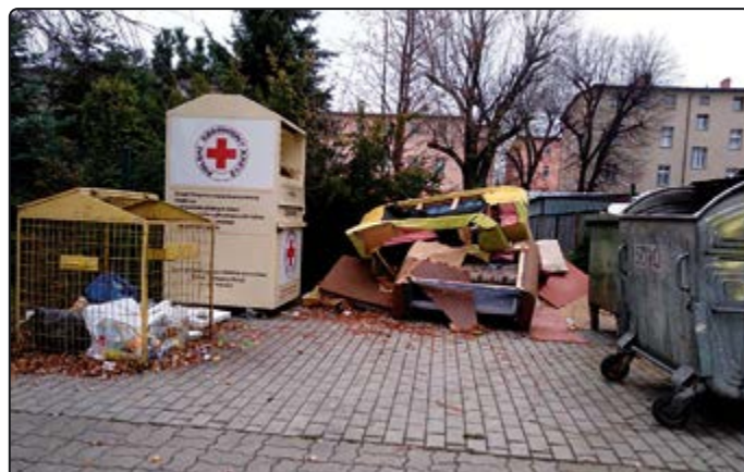
› Te śmieci powinny zostać dostarczone do punktu składowania odpadów