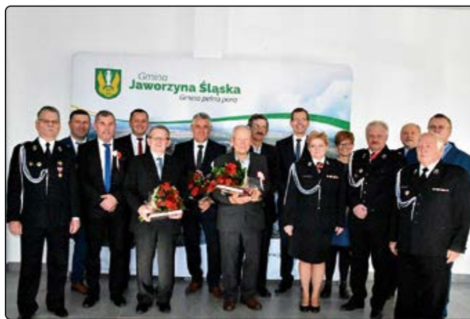
› Grono Zasłużonych dla Gminy Jaworzyna Śląska