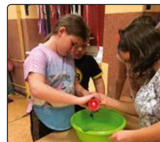
› Lanie wosku

przyszłość spełni się, dopiero czas pokaże... Wieczór zakończyła dyskoteka, która była ostatnią okazją do zabawy przed nadchodzącym Adwentem.