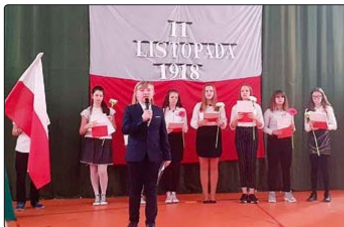
W szkołach odbyły się okolicznościowe akademie...

głorocznych edycji sprzyjały frekwencji. Na starcie biegu zameldowało się ponad 200-stu uczestników. Podzieleni na trzy kategorie wiekowe, w okolicznościowych koszul-