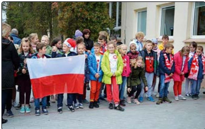
› ... oraz wspólne śpiewanie hymnu

Natomiast wolontariusze zaangażowani w akcję „Mogile pradiada ocal od zapomnie-