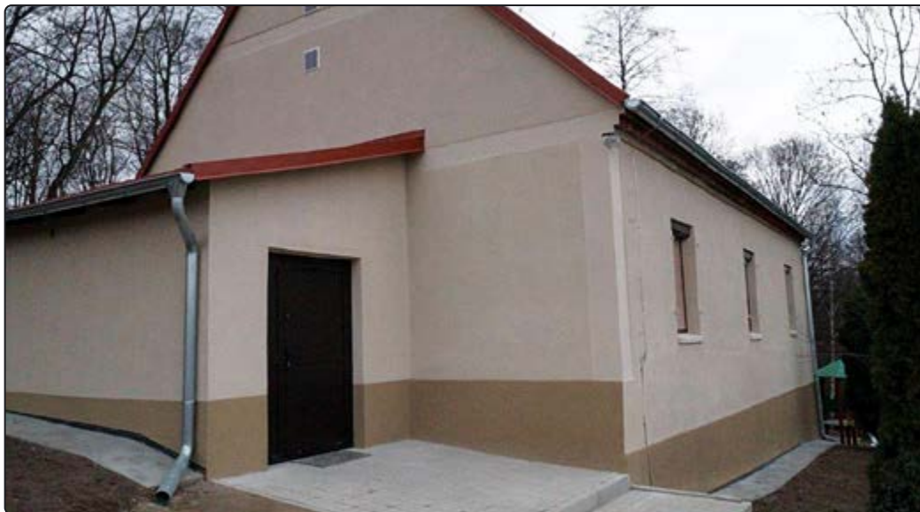
Świetlica w Bagieńcu przeszła remont wewnątrz i na zewnątrz

Mamy nadzieję, że świetlica po remoncie będzie służyć mieszkańcom rozbudowującego się Bagieńca jako miejsce spotkań i integracji społeczności wsi.