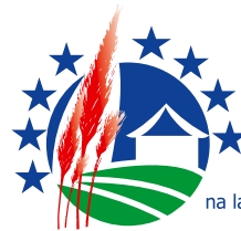
Program Rozwoju Obszarów Wiejskich na lata 2014-2020