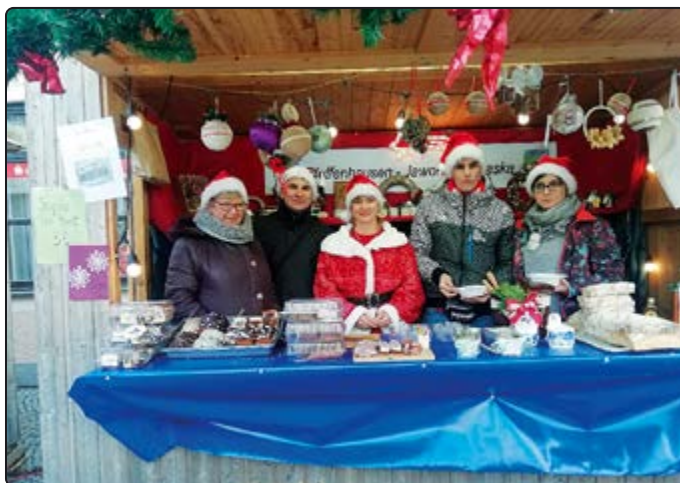
› Na jarmarku polskie stoisko przygotowali i zaprezentowali mieszkańcy Pastuchowa

cało i szczęśliwie przywożąc od mieszkańców Pffeffenhausen życzenia świąteczne.