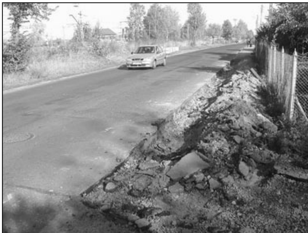
Doskonała wiadomość dla mieszkańców Jaworzyny Śląskiej. Władze gminy przystępują do budowy jednego z najważniejszych zadań – budowy odcinka sieci wodociągowej

- W ostatnich latach zwiększyła się awaryjność sieci wodociągowej w gminie. Wybudowana w latach 70-tych w ramach Dolnośląskiego Projektu Wodociągowania magistrala wodna o długości około 8,5 km doprowadza wodę nie tylko do południowej części miasta, ale również za jej pośrednictwem zasilane w wodę są sołectwa: Witków, Milikowice, Stary i Nowy Jaworów, Bolesławice, Bagieniec i Tomkowa, a więc połowa mieszkańców naszej gminy – mówi