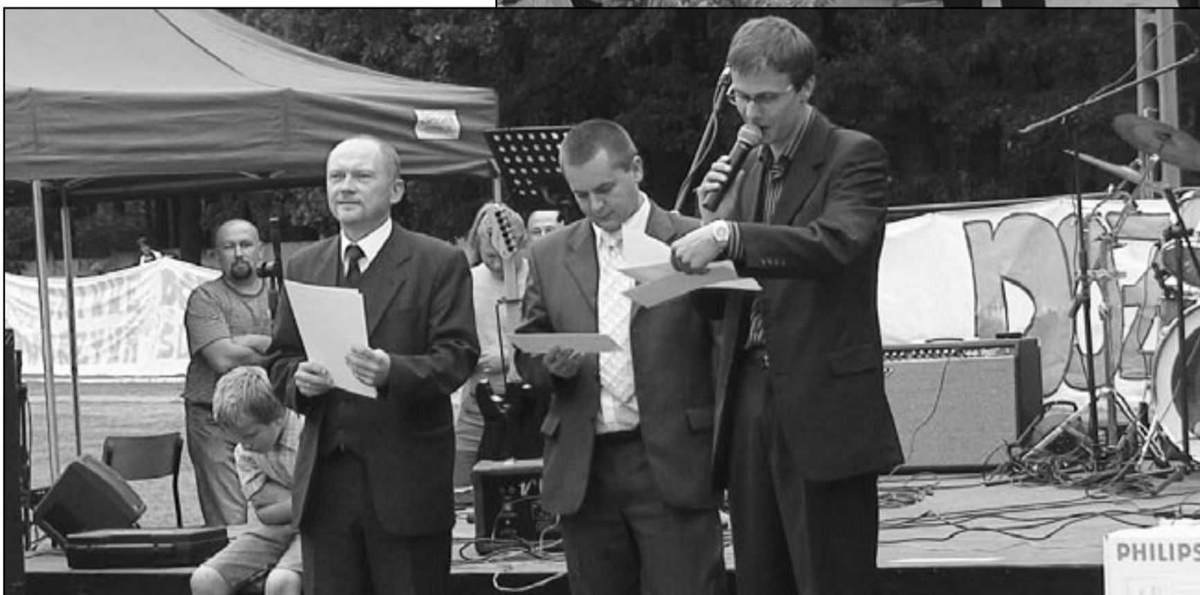
Dożynki były tym bardziej wyjątkowe, że Jaworzyna Śląska gościła swoich czeskich partnerów z miasta Teplice nad Metují