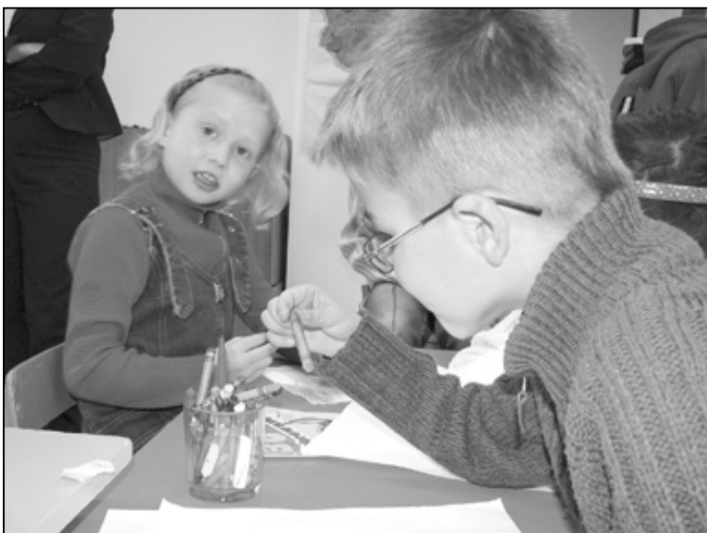
Chociaż nowe meble z całą pewnością bardzo się w świetlicy przydadzą, to dla dzieci nie one są najważniejsze. Tu panuje miła i ciepła atmosfera