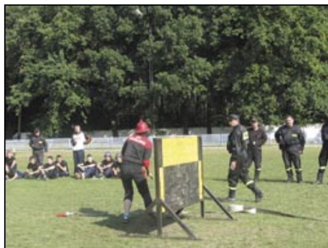
Osiemnaście drużyn strażackich startowało w V powiatowych zawodach strażackich rozegranych w Jaworzynie Śląskiej

- OSP Nowice – IV miejsce W rywalizacji o Puchar Komendanta Powiatowego PSP trzy czołowe miejsca zajęły drużyny: - OSP Burkatów i MDP Burkatów – I miejsce, - OSP Witoszów i MDP Witoszów – II miejsce, - OSP Jaworzyna Śląska i MDP Jaworzyna Śląska – III miejsce. Wszystkie drużyny nagrodzono: dyplomami, pucharami, medalami. Gratulujemy wszystkim drużynom zajętych miejsc i życzymy dalszych sukcesów.