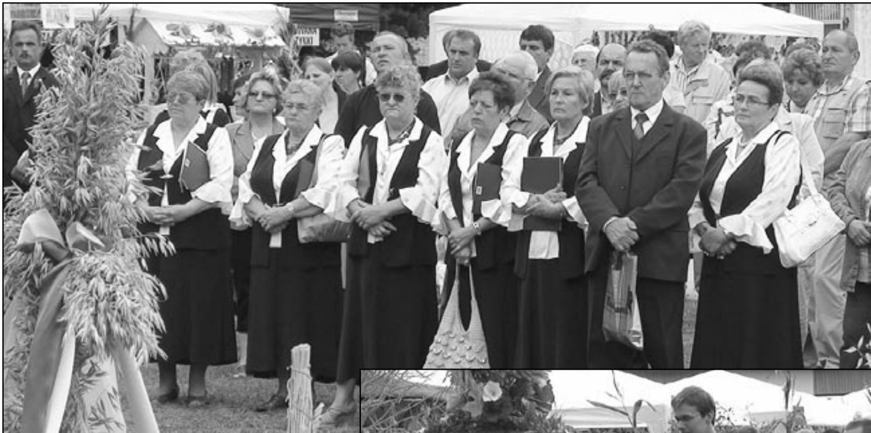
Jedną z atrakcji były występy zespołu „Wrzosa”, który zachwycał poezją recytowaną oraz wykonywanymi pieśniami