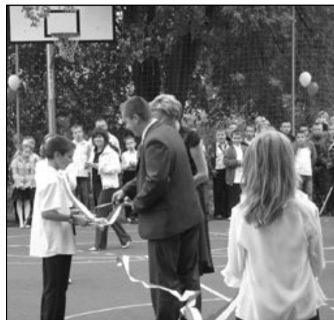
Sporto to trwało, ale udało się. Władze gminy Jaworzyna Śląska stały na wysokości zadania, dzieciaki z Pastuchowi nie będą narzekać na nudę – mają wielofunkcyjne boisko

Lata oczekiwań, niekończące się tygodnie pracy i wiecznie ponawiane pytanie: „Kiedy wreszcie skończą”? - To wszystko za nami! Przy Szkole Podstawowej w Pastuchowie powstało boisko, z którego możemy być dumni.