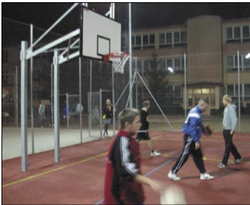
Żadna nowość, że zwycięzcami okazała się drużyna gospodarzy jak zwykle w bardzo mocnym składzie