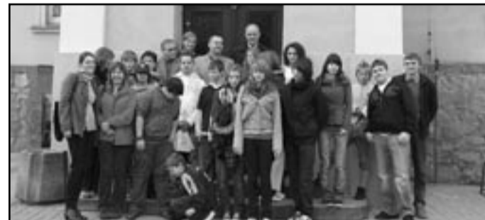
20 uczniów i nauczycieli z partnerskiego Pffenhausen gościło w Jaworzynie. Była to okazja nie tylko do zwiedzenia miasta ale też wymiany doświadczeń