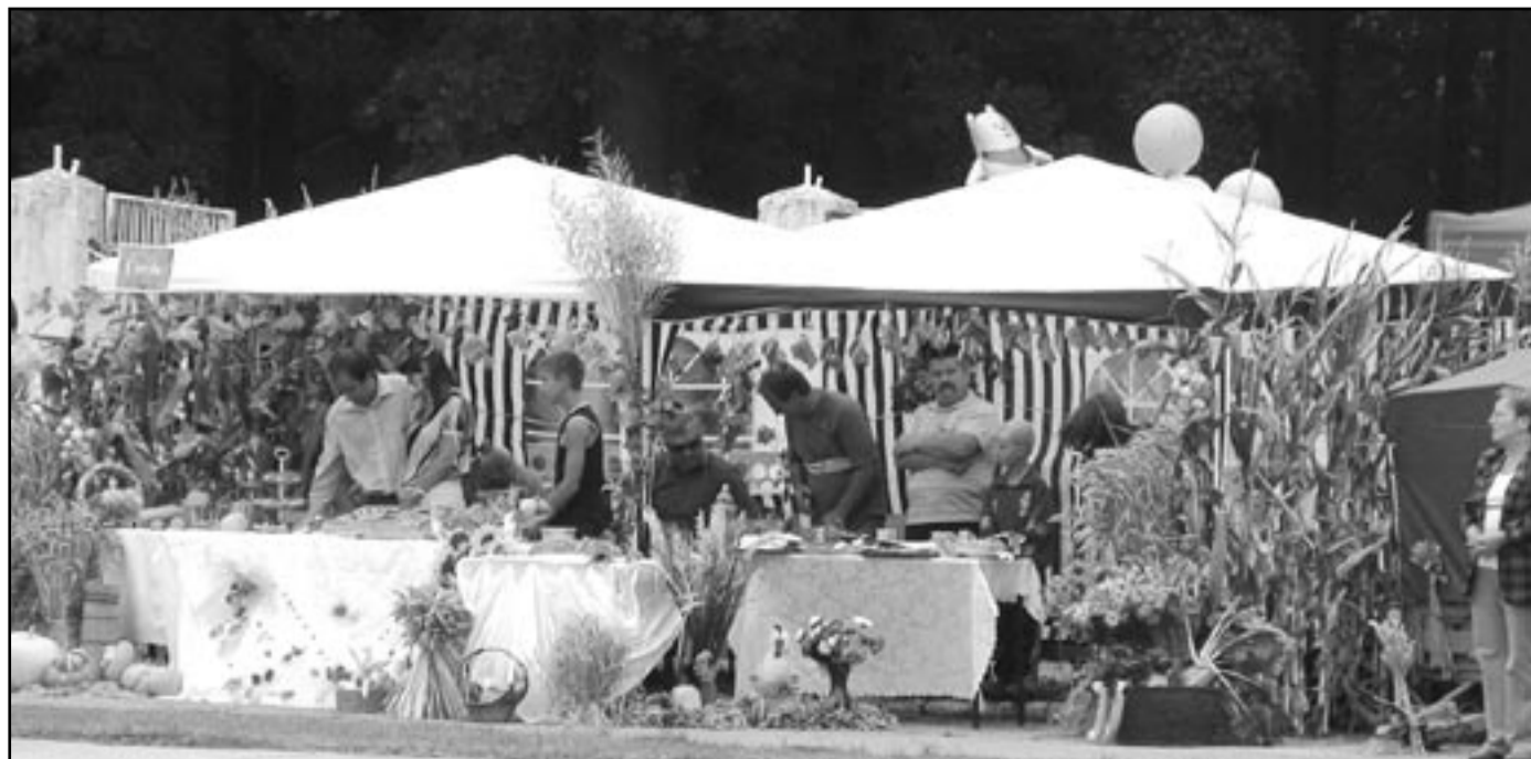
Tradycyjnie podczas dożynek swoje stoiska zaprezentowały wszystkie sołectwa. Można było poprobować najlepszych potraw i oczywiście wspaniałych nalewek

Dziękujemy w imieniu organizatorów przybyłym gościom za uświetnienie swoją obecnością naszej uroczystości, instytucjom, firmom i osobom, które wspomogły nas w organizacji tegorocznych Dożynek (księżom z terenu naszej gminy, ZGKiM, piekarni Profit-Bis, Fermie Drobiu Milikowice i innym). Szczególne podziękowania pragniemy złożyć na ręce sołectw i osób, które przygotowały wspaniałe prezentacje poszczególnych wsi z terenu naszej gminy. To dzięki Państwu tegoroczne dożynki miały tak wspaniałą oprawę.