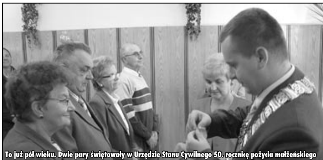
To już pół wieku. Dwie pary świętowały w Urzędzie Stanu Cywilnego 50. rocznicę pożycia małżeńskiego