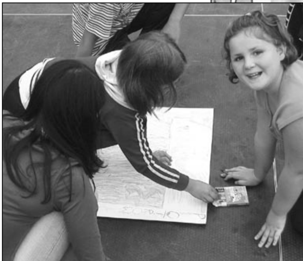
Jak zwykle na takich imprezach najlepiej bawią się dzieci. Były skoki, salta, gra w piłkę i zabawa prawie do rana. Zwłaszcza, że dopisała pogoda

Po zakończeniu obrzędów dożynkowych nadszedł czas na prezentację poszczególnych sołectw, które przygotowały przepiękne stragany, na których eksponowano zebrane plony, wyroby rzemieślnicze, domowe wypieki oraz inne wyroby gastronomiczne. Przybyli goście oraz mieszkańcy Gminy Jaworzyna Śląska byli pod ogromnym wrażeniem przygotowanych wystaw, a smak naturalnych wyrobów, które można było nabyć na każdym stoisku z pewnością długo zapadnie w pamięci wszystkich obecnych na tegorocznych dożynkach.