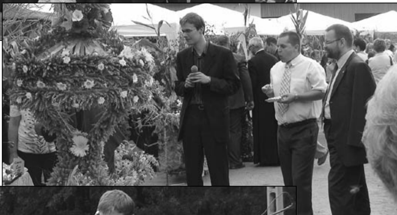
Tegoroczne dożynki ściągnęły na stadion mnóstwo osób. Z pewnością to dlatego, że organizatorzy zapewnili doskonałą zabawę