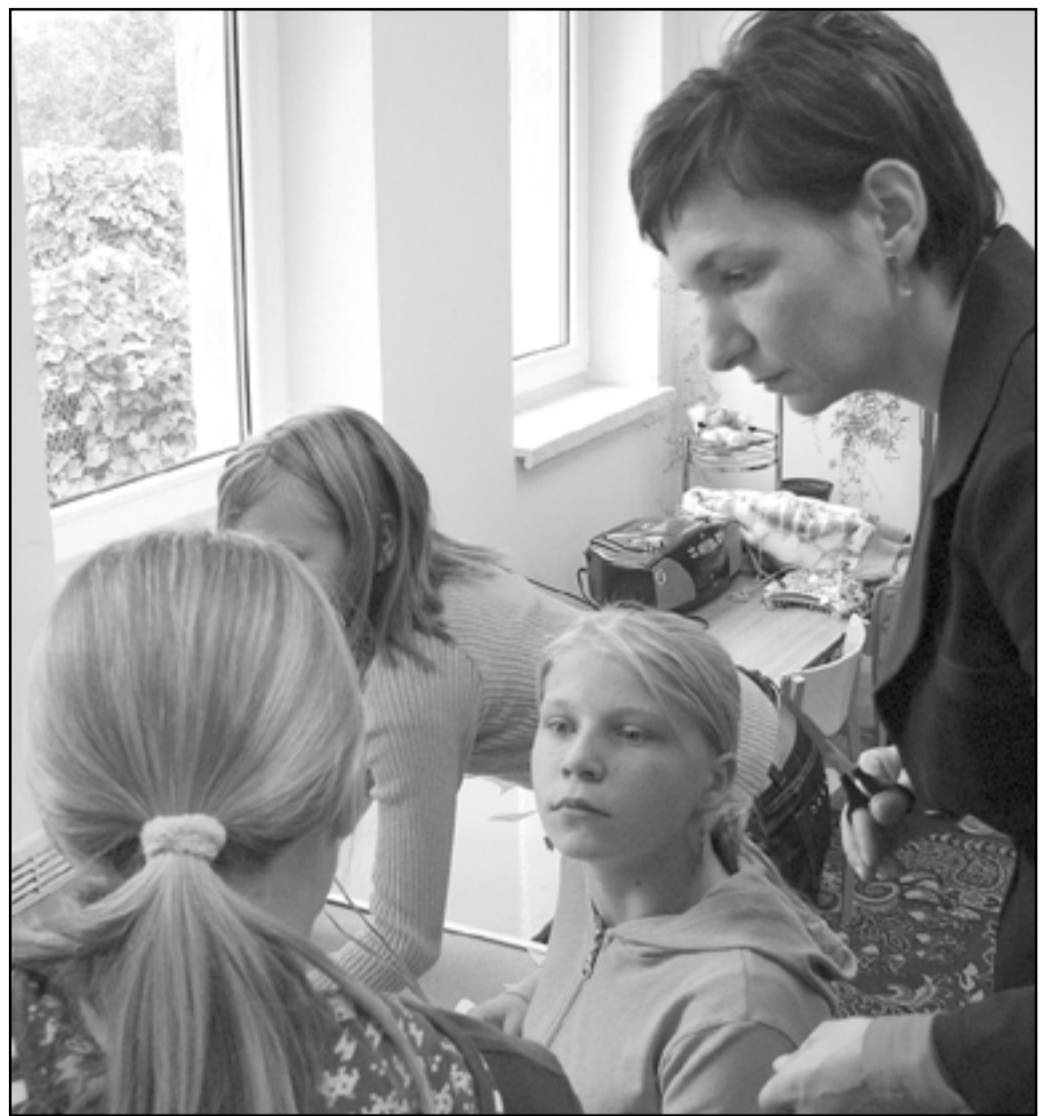
Nie tylko dzieci ze świetlicy otrzymały od banku podarek, wcześniej dostały go też dzieci z innych świetlic środowiskowych w gminie