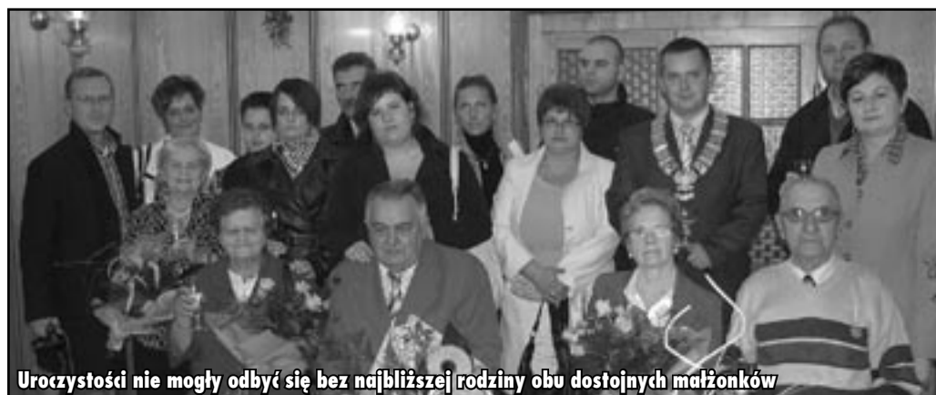
Uroczystości nie mogły odbyć się bez najbliższej rodziny obu dostojnych małżonków