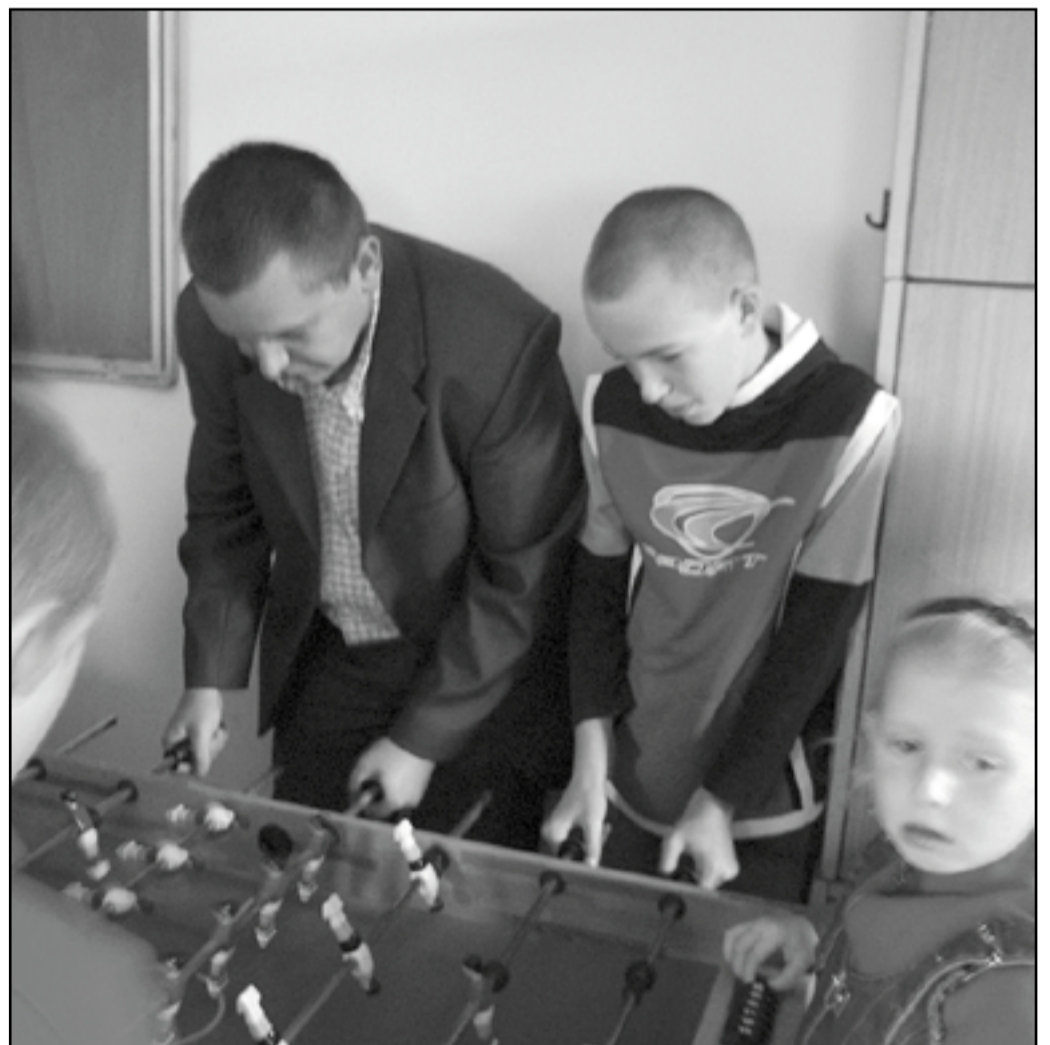
Z burmistrzem można się dobrze bawić. Choć starał się ze wszystkich sił, dzieci i tak pokonały go w grze w piłkarzyki

Bank Dziecięcych Uśmiechów to hasło przyświecające działaniom podejmowanym przez nasz bank w ramach nowych strategii działalności sponsoringowej i charytatywnej. Obie strategię stawiają dziecko i jego potrzeby w centrum swoich działań i podejmowanych przedsięwzięć