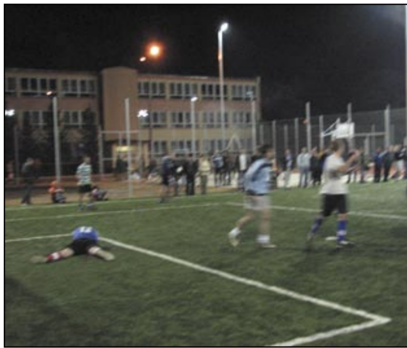
O puchar senatora Stanisława Jurcewicza walczyli uczestnicy turnieju rozegranego na nowym boisku przy Gimnazjum nr 1 w Jaworzynie Śląskiej