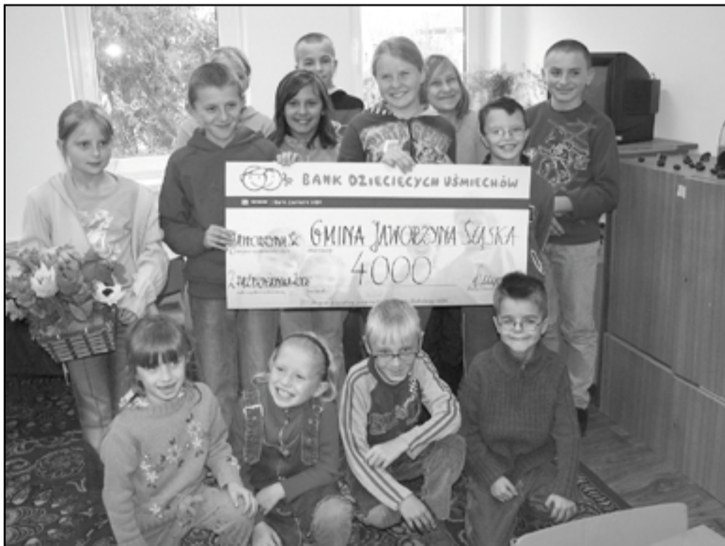
Radość dzieci zawsze liczy się podwójnie. Tak było i tym razem, kiedy Bank Zachodni WBK przekazał czek na 4 tysiące złotych z przeznaczeniem na zakup mebli do świetlicy środowiskowej we wsi Pastuchów

bieżącym roku dla Ośrodka Pomocy Społecznej Fundacja przekazała w ramach „Akcji Zeszyt”. Kolorowe zeszyty i bloki tradycyjnie były całkowicie bezpłatne - sfinansowała je w 100 procentach Fundacja - a głównym założeniem akcji było zapewnienie dzieciom z biednych środowisk godnego rozpoczęcia nowego roku szkolnego. W tym roku Fundacja wyprodukowała rekordową liczbę tych także potrzebnych artykułów szkolnych - bo aż 20.750 zeszytów i 8.000 bloków!