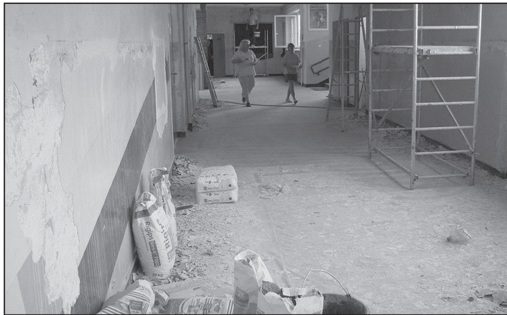
Zakończyły się trwające całe wakacje remonty w placówkach oświatowych na terenie gminy Jaworzyna Śląska

wano wymianę instalacji elektrycznej, wymianę grzejników i malowanie ścian w tych pomieszczeniach. Zakres robót obejmował również remont kuchni głównej, w której ułożono płytki ściennie i podłogowe oraz wykonano gładzie i pomalowano ściany. Oprócz prac remontowych w szkołach i przedszkolu remontu doczekał się również stadion miej-