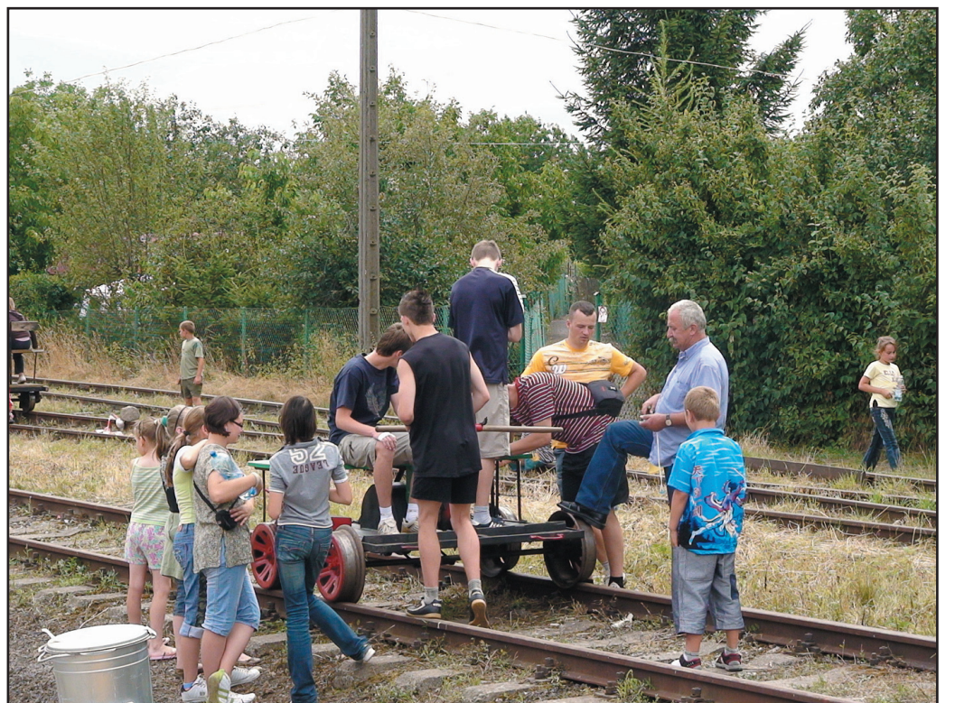
Największą atrakcją zawodów drezynowych rozegranych 12 lipca była możliwość jazdy drezynami motorowymi na trasie Jaworzyna Śląska - Pastuchów

Organizatorami imprezy byli: Urząd Miejski, Stowarzyszenie Miłośników Kolei, Samorządowy Ośrodek Kultury i Biblioteka Publiczna w Jaworzynie Śląskiej. Pragniemy podziękować wszystkim, którzy pomagali nam podczas przygo-