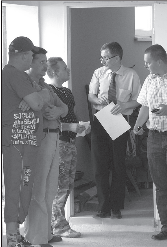
Wieś Piotrowice doczekała się remontu remizy strażackiej. W okresie letnim odbył się odbiór wyremontowanych pomieszczeń

kiem grzybobójczym położono nowy. Wylano również nową podłogę w części garażowej remizy. Po przetarciu sufitu i pomalowaniu ścian obiekt zmienił się nie do poznania. Korzystne wrażenia potęgują wyremontowana w zeszłym roku część socjalna i wymienione okna. W remont remizy mocno zaangażowani byli miejscowi strażacy, za co należą im się słowa uznania.