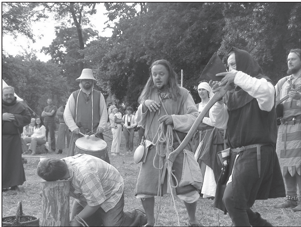
Do Puschkau (Pastuchowa) przybyli na zaproszenie Bractwa św. Barbary działającego przy Samorządowym Ośrodku Kultury i Bibliotece Publicznej w Jaworzynie Śląskiej Bractwo Rycerskie z terenu Dolnego Śląska: Bractwo Zamku Grodno oraz „Cornus Cervi” - Grupa z Osady Kopaniec TEL./FAKS: (074)585-41-36, E-MAIL: ROZMAITOSCI@JAWORZYNA.NET

walk na miecze, wesołych zabaw plebejskich, dźwięków muzyki dawnej oraz śpiewów. Widzowie mieli okazję wziąć czynny udział w festynie. Przygotowano stanowiska, na których można było postrzelać do celu z prawdziwego łuku czy też dać się zakuć w średniowieczne dyby. Chętni mogli zrobić sobie zdjęcie w prawdziwej rycerskiej zbroi i przez chwilę poczuć ciężar, jaki nosili na sobie prawdziwi rycerze w