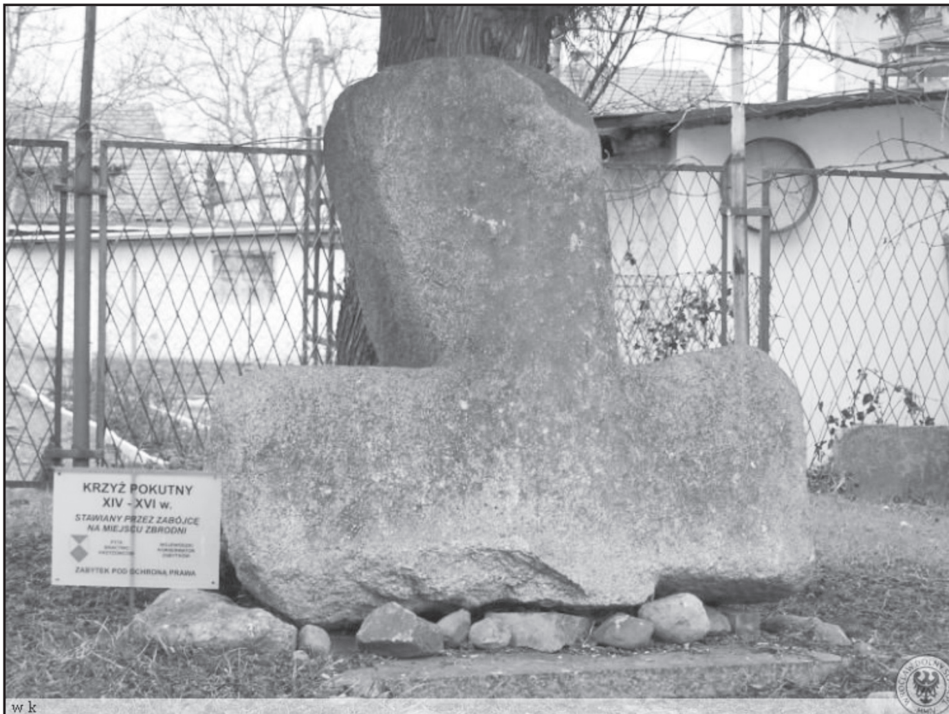
Krzyż pokutny w Stanowicach