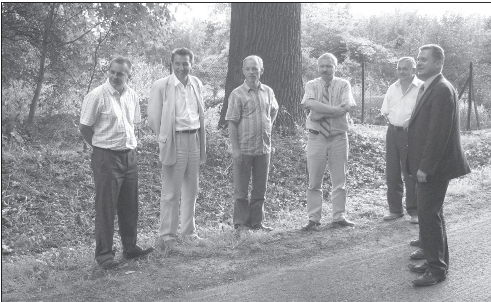
Skończył się trwający wiele lat problem kierowców jeżdżących trasą na odcinku Jaworzyna Śląska - Piotrowice Świdnickie. 1 sierpnia zakończył się remont tej drogi