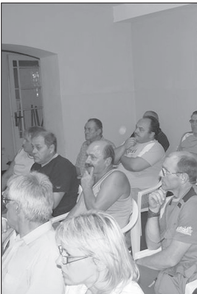
Zakończyły się konsultacje społeczne dotyczące realizacji drogowej inwestycji pod nazwą budowa drogi łączącej Świdnicę z autostradą A4

Konsultacje społeczne są konieczne, ponieważ zmieni-