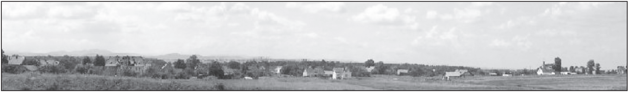
Panorama Pasiecznej od strony Jaworzyny Śląskiej

Pasieczna, mimo że jest małą miejscowością, ma swą ciekawą historię, o której warto napisać kilka zdań.