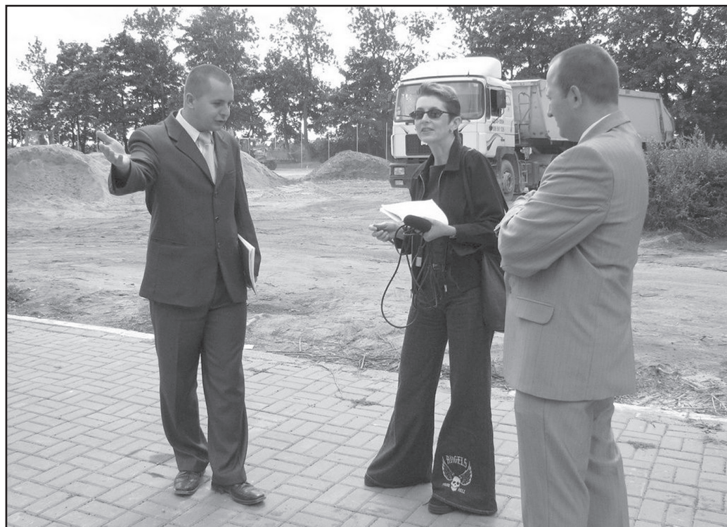
Jaworzyna Śląska jest jedną z wielu gmin w województwie, która buduje boisko w ramach programu unijnego Orlik