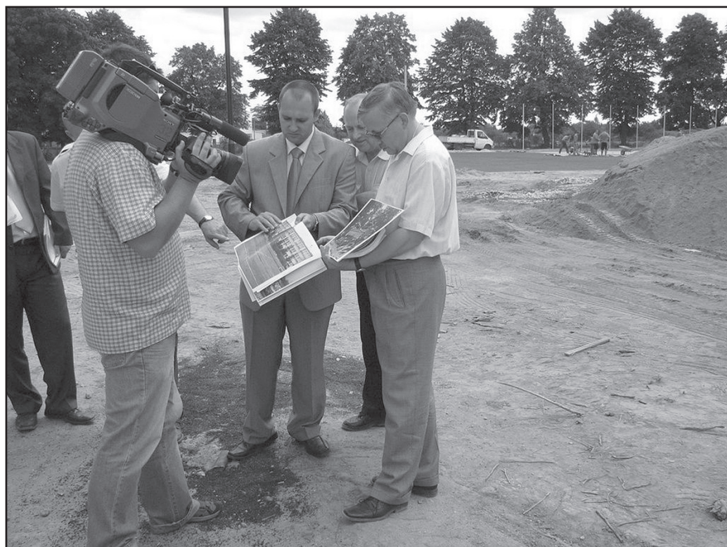
Gmina Jaworzyna Śląska najprawdopodobniej będzie pierwszą w województwie, która już we wrześniu otworzy boisko - zadanie realizowane w ramach programu Moje Boisko - Orlik 2012