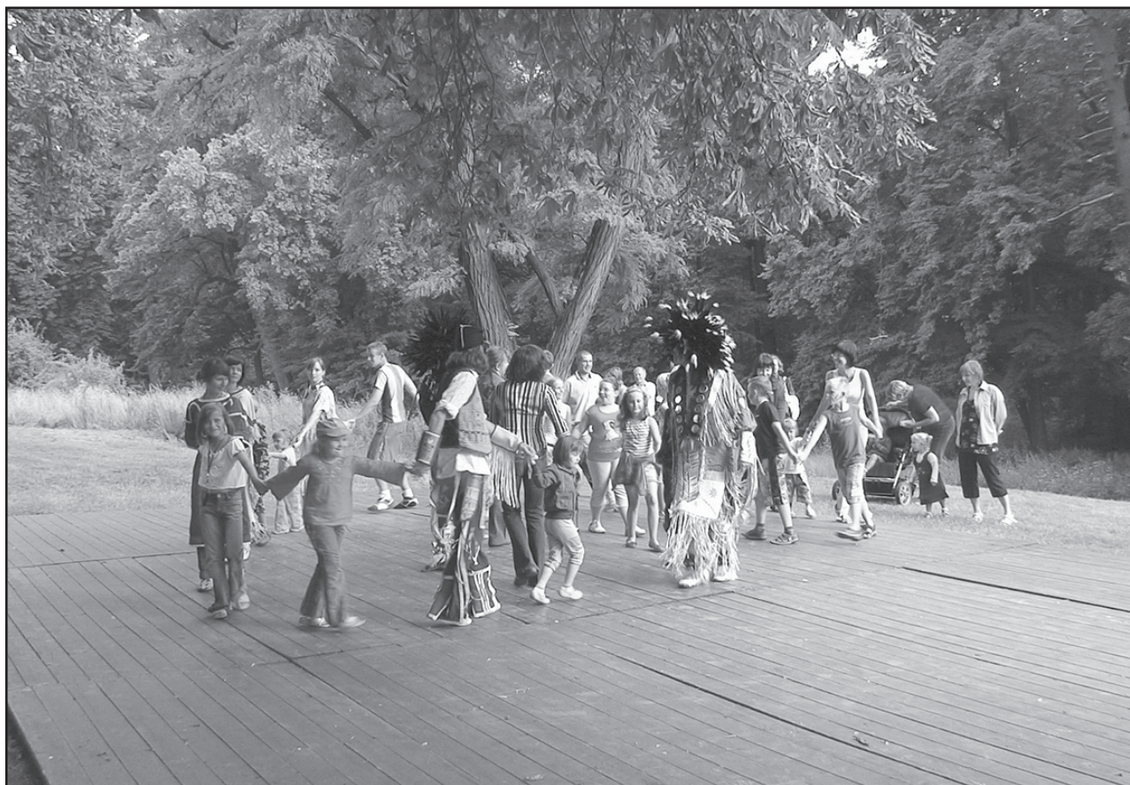
Wspólnym zabawom nie było końca

19 lipca Samorządowy Ośrodek Kultury i Biblioteka Publiczna wspólnie z sołectwem wsi zorganizował imprezę dla mieszkańców, podczas której wszyscy uczestnicy mieli szansę poznać różne aspekty życia Indian Ameryki Północnej. Zarówno dzieci, jak i dorośli mogli spróbować swoich sił w strzelaniu z łuku do tarczy, wsiąść udział w rywalizacji na równoważni Szoszonów czy też upolować bizona. Dla dzieci przygotowano także stanowisko, na którym piękne squaw malowały barwy wojenne na twarzach małych wojowników. Można było obejrzeć oryginalne wyroby rzemieślnicze oraz posłuchać ciekawych opowieści związanych z kulturą Indian północnoamerykańskich. Najatrakcyjniejszym punktem imprezy były jednak pokazy tańców etnicznych, w których wzięli udział także widzowie. Na pikniku bawiły się całe rodziny, a podczas całego popołudnia park w Milikowicach odwiedziło około 300 osób.