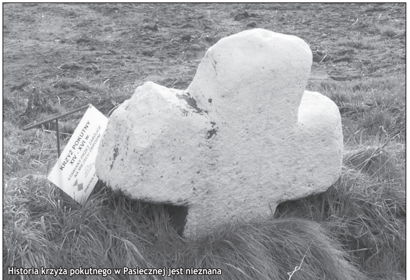
Historia krzyża pokutnego w Pasiecznej jest nieznana