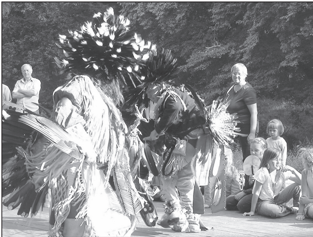
Sołectwo wsi Milikowice przygotowało także kiermasz ciast i swojskiego jadła oraz loterię fantową