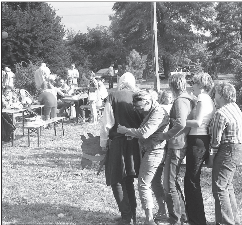
W Pastuchowie wszystko może się zdarzyć... Ostatnio wieś odwiedzili nawet rycerze

czasach średniowiecza. Członkowie bractw chętnie udzielali odpowiedzi na liczne pytania widzów. Salwy śmiechu wywoływały zabawy i scenki rodzajowe. Podczas festynu odbyła się także egzekucja sołtysa wsi Pastuchów. Udało mu się jednak przeżyć ze względu na chwi-