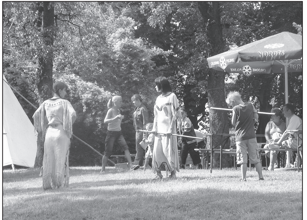
Jak żyją Indianie Ameryki Północnej? Jeśli nie wiedzieliście do tej pory, to zorganizowany dla mieszkańców Milikowic piknik tematyczny z pewnością pomógł poznać ich tradycje

Na jeden dzień Milikowice stały się prawdziwą indiańską wioską. Wszystko za sprawą specjalnie dla mieszkańców zorganizowanego pikniku.