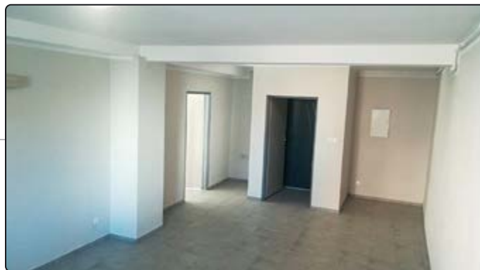
Nowa siedziba emerytów

osuszenie i odgrzybienie murów, nową posadzkę, remont stropu czy remont stopni wewnętrznych. Wykonane zostały nowe instalacje. W ramach prac termomodernizacyjnych wymienione zostały okna i drzwi oraz ocieplono strop.