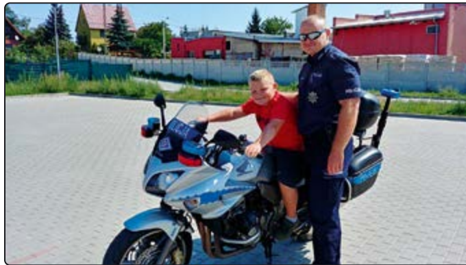
Chłopców najbardziej interesował policyjny motocykl

Z myślą o tym, by kolejny rok szkolny był równie bezpieczny, jak poprzednie, by nasi uczniowie cało i zdrowo docierali na lekcje i z nich wracali Komenda Powiatowa Policji w Świdnicy oraz Centrum Popularyzacji Bezpieczeństwa Ruchu Drogowego