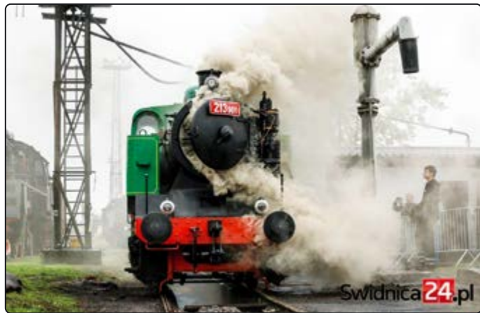
› W Jaworzynie prezentowały się parowozy...

kolejowego. Zobaczyć można było zabytkowe lokomotywy parowe w ruchu, w trakcie przejazdów i wykonywania manewrów na bocznicy. Wzorem lat ubiegłych podczas Gali prezentowane są maszyny, które udało się odrestaurować. Tradycji tej udało się dotrzymać także i w tym roku. Przybyłym odwiedzającym Muzeum zaprezentowany został jeden z pierwszych polskich autobusów szynowych