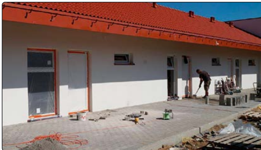
› Budynek szatni w Witkowie na ukończeniu

środków Funduszu Rozwoju Kultury Fizycznej w ramach programu „Sportowa Polska – Program rozwoju lokalnej infrastruktury sportowej” w wysokości 426 400 zł.