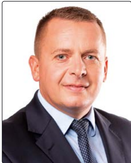
» Burmistrz Grzegorz Grzegorzewicz

- rozmowa z burmistrzem Grzegorzem Grzegorzewiczem, kandydatem w wyborach do Sejmu RP