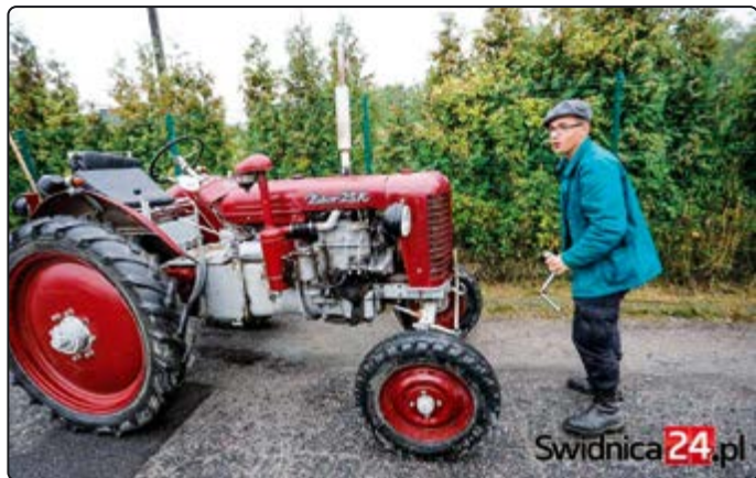
› ...a w Piotrowicach maszyny rolnicze

z upływem lat ułatwiały ludziom pracę w rolnictwie. Zaprezentowane zostały traktory sprzed „kilku epok”, ale i również maszyny, których działanie współczesnym ludziom wydaje się zupełnie obce, a które służyły np. do młócenia zboża. Całość wydarzenia w Piotrowicach dopełniały różnego rodzaju warsztaty o profilu kulinarnym zorganizowane w stodole przy piotrowickim zamku.