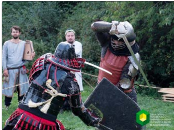
› Jedną z walk jaką stoczyli rekonstruktorzy

Podczas obozu nasi goście sprawdzali swe umiejętności w turniejach: łuczniczym, bojowym lekkobrojnym, bojowym ciężkobrojnym, na miecz i puklerz. Oprócz rywalizacji w konkurencjach bojowych rekonstruktorzy, a także przybyli widzowie mogli spróbować swoich sił w grze w tzw. szachy wikingów