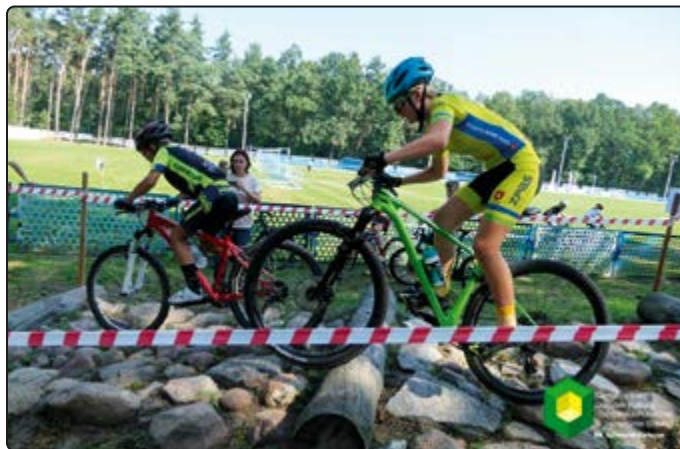
Trasa wymaga dużych umiejętności technicznych...

tury i Bibliotekę Publiczną w Jaworzynie Śląskiej, Zakłady Porcelany Stołowej „Karolina” sp. z o.o. z Jaworzyny Śląskiej. Najlepsi zwodnicy z Gminy