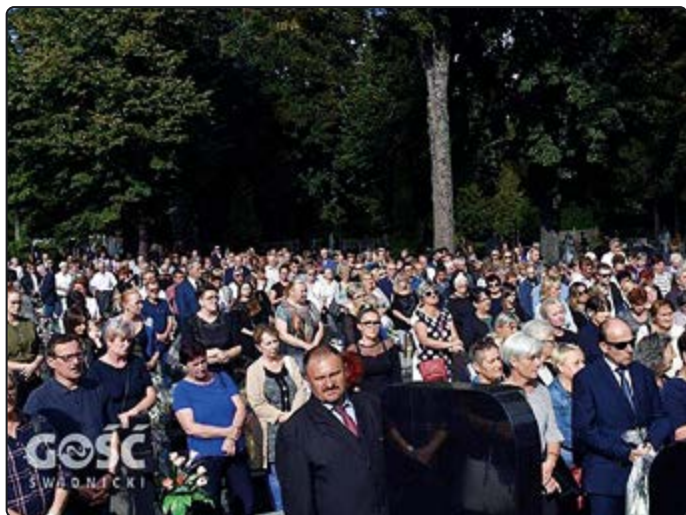
› Tłumy pożegnali zmarłego na jaworzyńskim cmentarzu