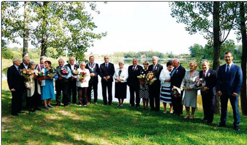
› Jubilaci z burmistrzem i zastępcą burmistrza