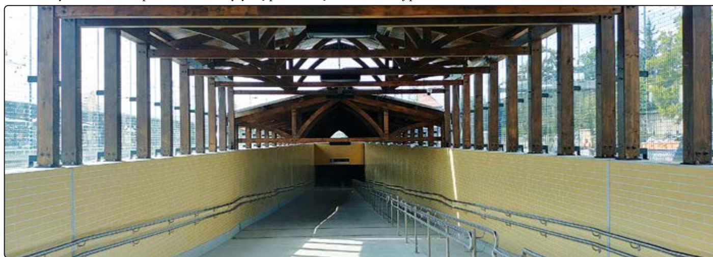
› Tunel pod torami w całej okazałości

Oddawana do użytku tak istotna dla miasta inwestycja jest kolejną, po remoncie dworca kolejowego i kompleksowej modernizacji peronów 1 i 3, którą zrealizowała grupa PKP. Łącznie inwestycje te kosztowały ponad 40 mln zł, za co należą się serdecznie podziękowania władzom kolejowych spółek.