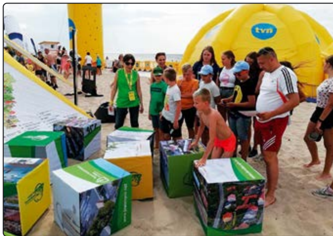
Stoisko gminy licznie odwiedzali turyści

Poza zabawą plażowicze mogli również uzyskać informacje o gminie, naszych walorach turystycznych, znajdujących się u nas ciekawych obiektach, miejscach oraz odbywających się wydarzeniach. Mamy nadzieję, że za kolejny kierunek swoich podróży obiorą Dolny Śląsk i gminę Jaworzyna Śląska.