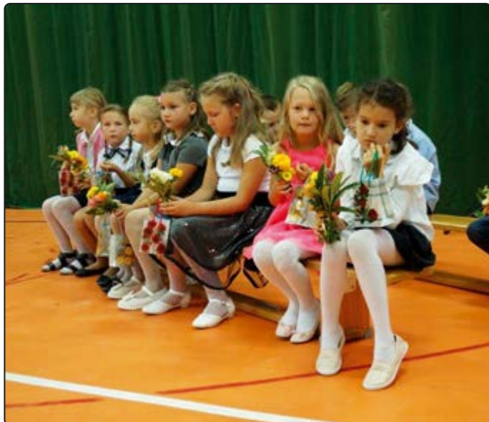
W centrum uwagi były pierwszaki

Nowe otoczenie, nowi koledzy i koleżanki, wreszcie nowa pani i nowe wyzwania... To właśnie uczniowie klas pierwszych byli głównymi bohaterami inauguracji roku szkolnego w szkołach, ale równie serdecznie po wakacjach przywitani zostali wszyscy inni uczniowie starszych klas.