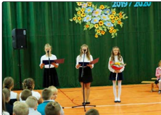
Rok szkolny rozpoczął się od apeli

W tym roku szkolnym do szkół na terenie gminy uczęszczać będzie 734 uczniów (454 w Szkole Podstawowej w Jaworzynie Śląskiej, 141 w Szkole Podstawowej w Pastuchowie, 139 w Starym Jaworowie). Ponad 230 dzieci będzie natomiast korzystać z opieki przedszkolnej. Naukę i opiekę zapewni im 112 nauczycieli oraz 62 pracowników obsługi.