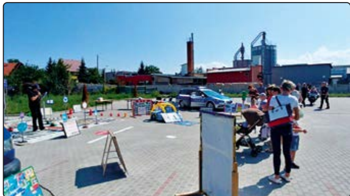
Dla wszystkich dzieci przygotowano liczne konkursy i zabawy

go zorganizowały festyn dla dzieci i młodzieży poświęcony zasadom bezpieczeństwa – „Bezpieczna droga do szkoły”.