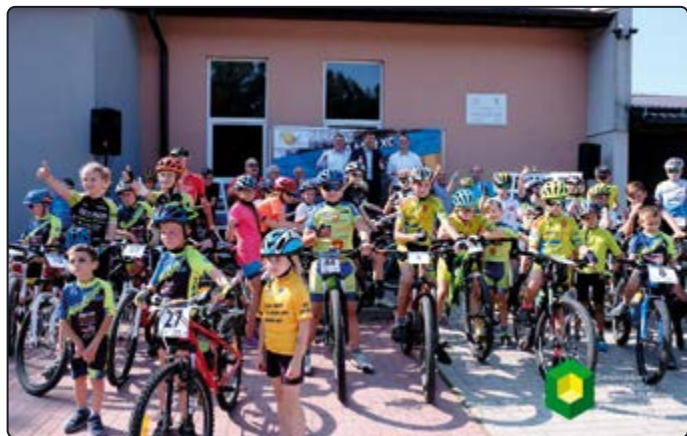
Kolarstwo jest w Jaworzynie bardzo popularne również wśród dzieci

Organizatorzy dziękują wszystkim osobom, które przyczyniły się do udanej organizacji już 15 edycji XV Grand Prix MTB Solidarności. Nadleśnictwu Świdnica za udostępnienie po raz kolejny terenów leśnych, Stowarzyszeniu Sportowo-Rekreacyjnemu Junior z Wałbrzyska, obsadzie sędziowskiej, rodzicom dzieci z sekcji kolarskiej MKS Karolina oraz Zarządowi MKS Karolina i wszystkim wolontariuszom za pomoc w organizacji imprezy, a przede wszystkim najmłodszym zawodnikom i ich opiekunom za liczy udział w wyścigu i rywalizację fair play.