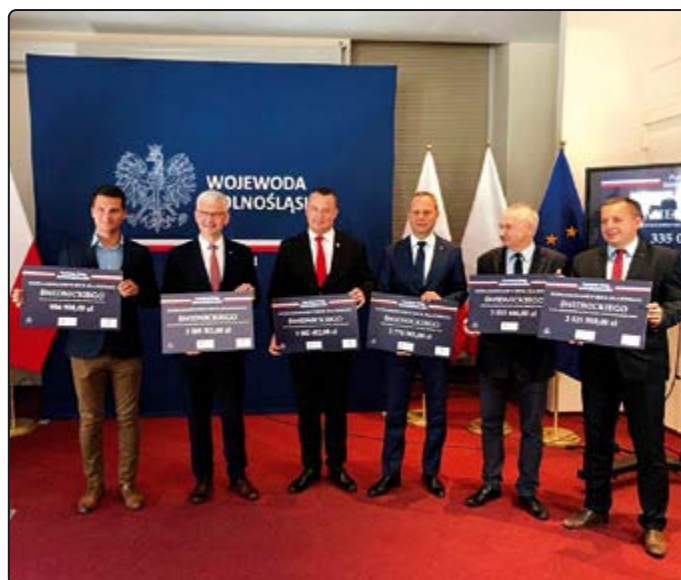
› Burmistrz odebrał promesę

Niezwłocznie po otrzymaniu dokumentów potwierdzających przyznanie środków rozpoczną się prace związane z realizacją zadań.