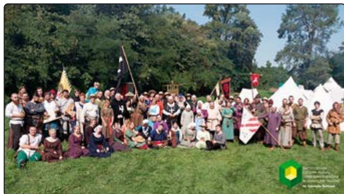
› Uczestnicy 11 edycji Obozu średniowiecznego

Organizatorami imprezy byli: Rota św. Barbary, Samorządowy Ośrodek Kultury i Biblioteka Publiczna w Jaworzynie Śląskiej, Stowarzyszenie Nowice Nasza Wieś, Klub Młodzieżowy przy SOKiBP.