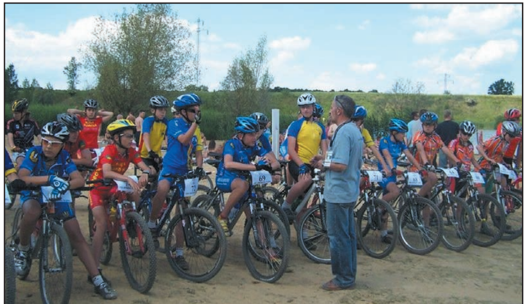
Wyścig odbył się na trudnej technicznie trasie na terenie jaworzynskiej żwirowni