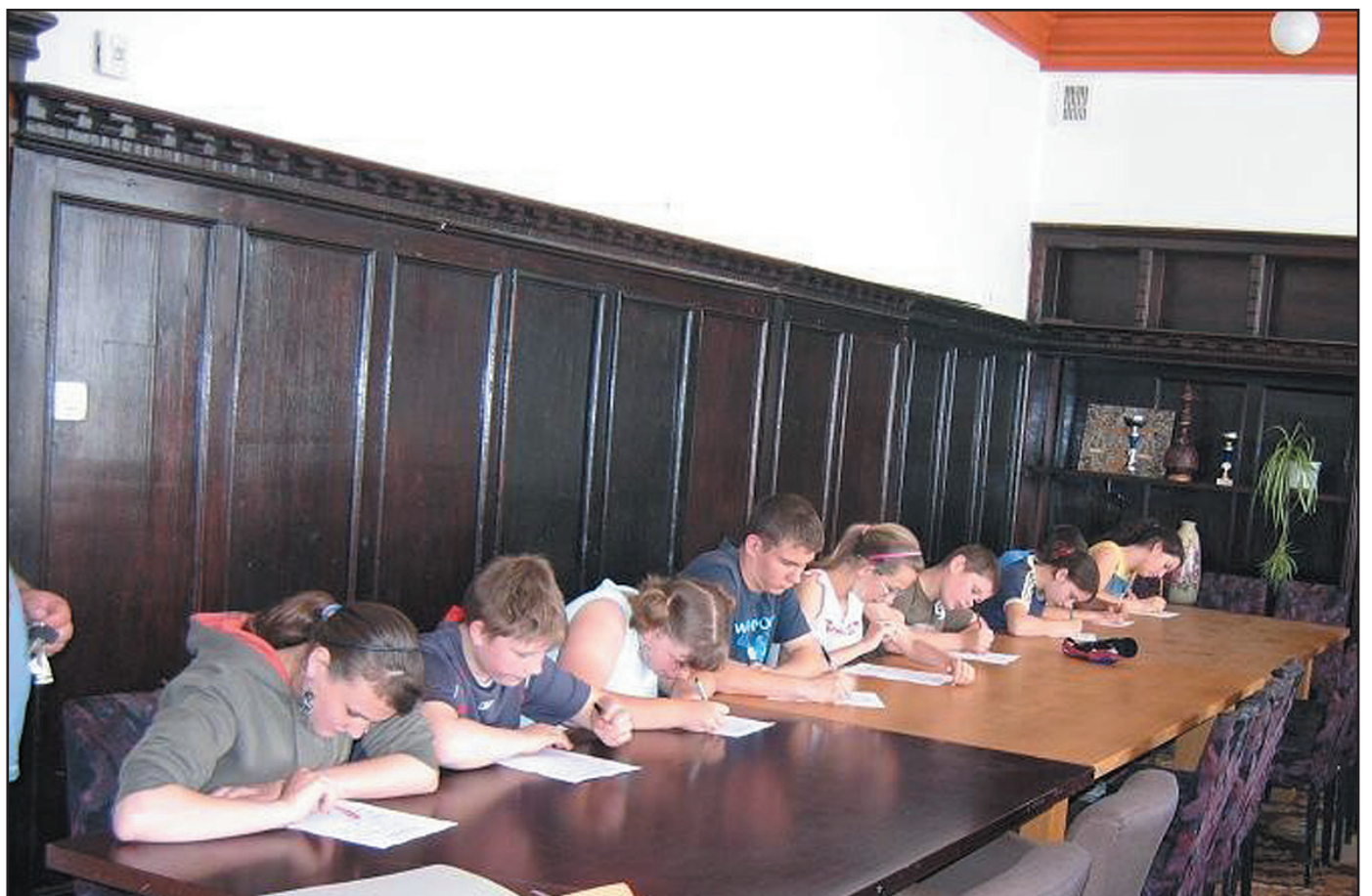
Dzieci z gminy Jaworzyna Śląska wiedzą, jak dbać o bezpieczeństwo udowodniły to podczas Turnieju Wiedzy Pożarniczej rozegranego w czerwcu w Jaworzynie Śląskiej