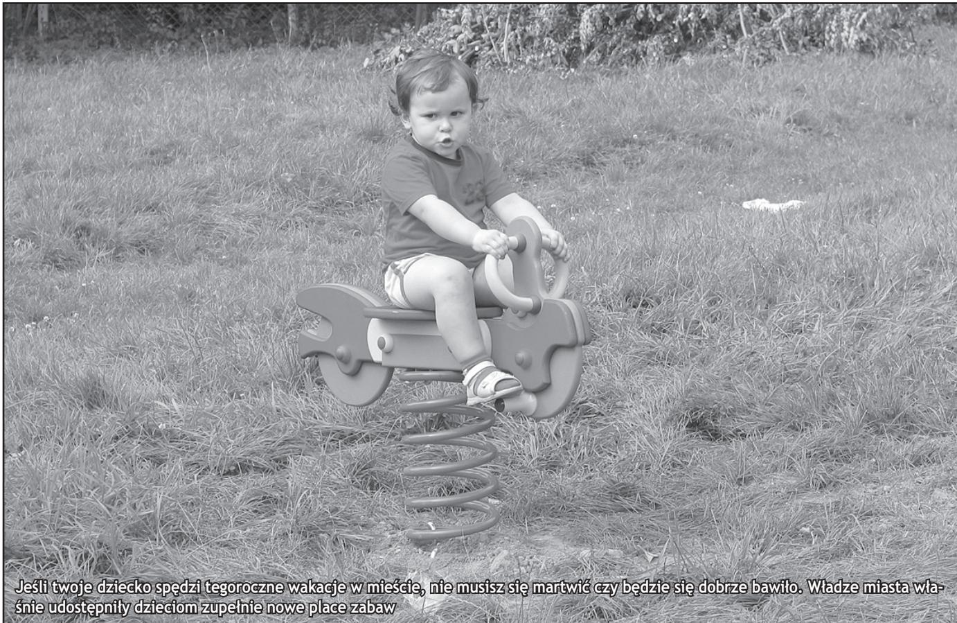
Jeśli twoje dziecko spędzi tegoroczne wakacje w mieście, nie musisz się martwić czy będzie się dobrze bawiło. Władze miasta właśnie udostępniły dzieciom zupełnie nowe place zabaw

To kolejny dowód na to, że wakacje spędzone w domu nie muszą być nudne. Władze miasta dla swoich najmłodszych mieszkańców, udostępniły nowe place zabaw. Montaż urządzeń zabawowych jest kontynuacją ubiegłorocznej inwestycji. Z placów zabaw zniknęły dotychczasowe, stare i często niebezpieczne, metalowe huśtawki i barierki. W ich miejsce pojawią się nowe karuzele, piaskownice, bączki i drabinki. Wszystkie są estetycznie wykonane, głównie z drewna i sztucznego tworzywa, objęte atestami bezpieczeństwa i gwarancją. Nowe urządzenia służą dzieciakom już od dziś.