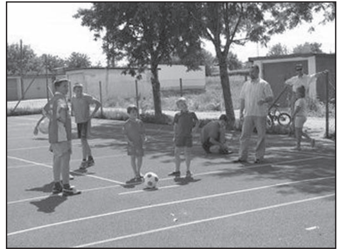
Mieszkańcy Jaworzyny Śląskiej mają powody do radości. Zakończył się remont kortu tenisowego przy ul. Ceglanej

wody i bardzo odporną na ścieranie. Na boisku zostały namalowane linie wyznaczające pola gry w koszykówkę, siatkówkę, tenisa i piłkę ręczną oraz zamontowano na nim bramki. Remont boiska udało zakończyć się przed wakacjami z myślą przede wszystkim o dzieciach i młodzieży spędzających wakacje w Jaworzynie Śląskiej. Zapraszamy wszystkich mieszkańców do korzystania z boiska!