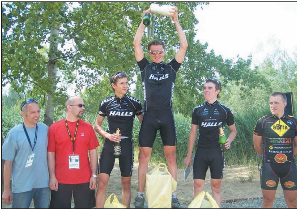
Zawody rozegrano w 10 kategoriach wiekowych