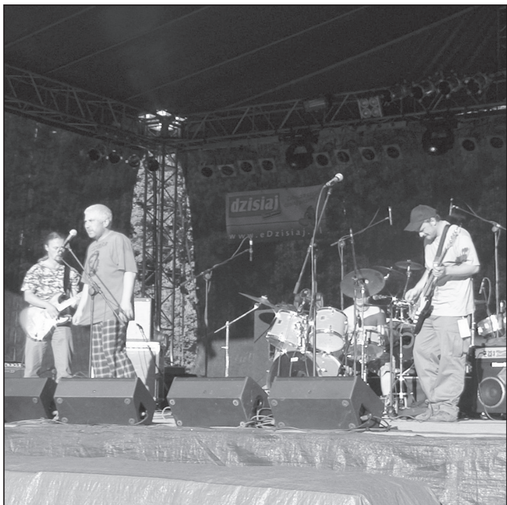
W niedzielę swoje umiejętności na scenie prezentowały kolejne lokalne zespoły