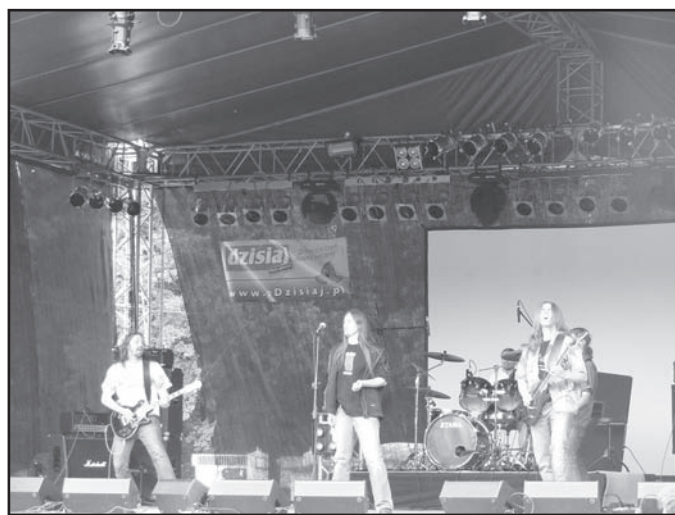
Trzecie miejsce przyznano kapeli Fabryka Napięć (na zdjęciu) z Puław, drugie miejsce zajęła grupa Votum z Warszawa, a najlepszym zespołem przeglądu wybrano grupę Niebo z Wałbrzycha