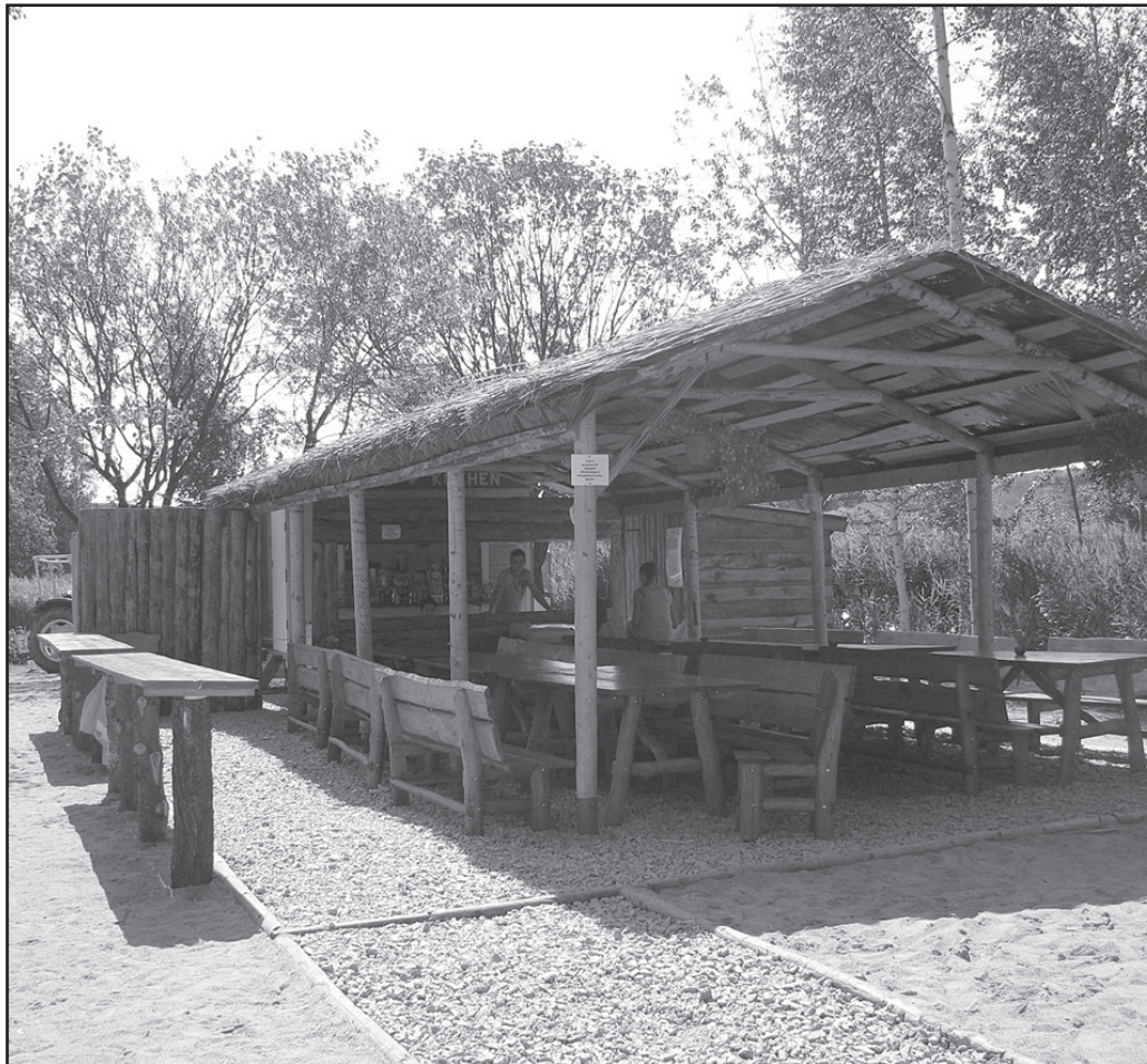
Jaworzyńska żwirownia to w tej chwili jedno z najatrakcyjniejszych miejsc kąpielowych w naszym powiecie. Zapraszamy na żwirownię, tu spędza się miło czas na łonie natury