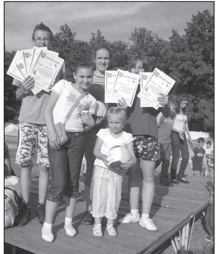
Nim uczestnicy zabaw zorganizowanych przez Młodzieżową Radę Miejską stanęli na podium, musieli zmierzyć się z mnóstwem trudnych konkurencji. Na szczęście dla dzieci z Jaworzyny Śląskiej żadna konkurencja sportowa nie jest straszna...

dla najmłodszych mieszkańców miasta Dzień Młodzieży Jaworzyńskiej. Uczestnicy imprezy mogli rywalizować w takich konkurencjach sportowych, jak: biegi na 60 i 400 m, skoki w workach i na skakance, dmuchanie balonów, jedzenie cytryny na czas, rzuty do kosza oraz bieg z jajkiem. W zamian za świetną zabawę i współzawodnictwo dzieci nagrodzone zostały słodkimi upominkami, a na najlepszych zawodników czekały nagrody rzeczowe – piłki oraz kredki pastelowe.