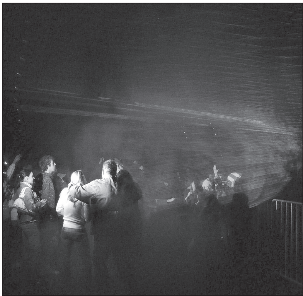
Pokaz laserów - to co mieszkańcy Jaworzyny Śląskiej na pewno zapamiętają na długo. Takiego widowiska jeszcze w mieście nie było

towało się 10 zespołów, a każdy w taki sam sposób zachwycił publiczność. Zapraszamy Państwa na fotorelację z tych dwóch niezwykłych dni.