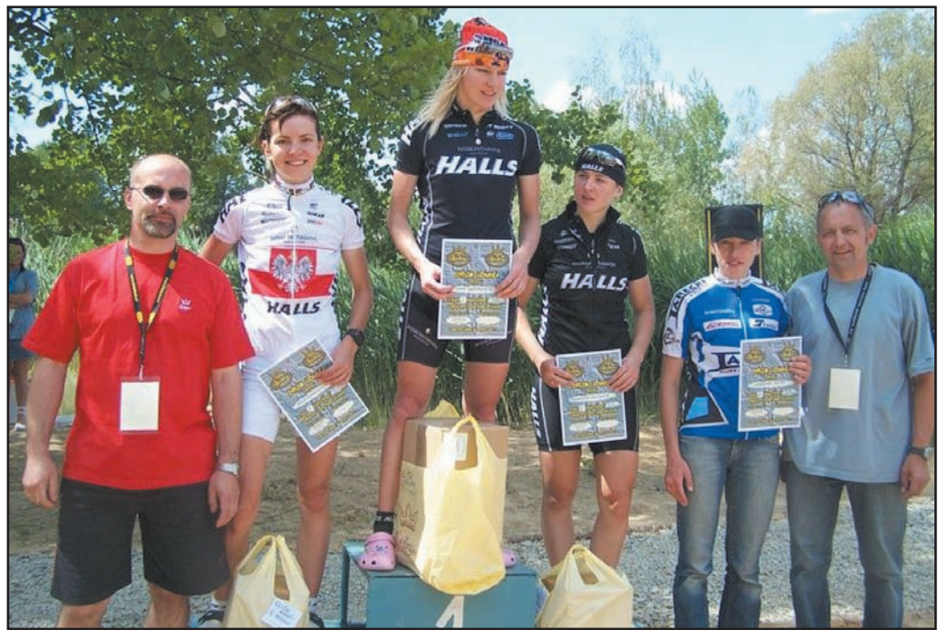
Sporo ponad 100 zawodników i zawodniczek spotkało się, by walczyć o Puchar Prezesa ZPS Karolina