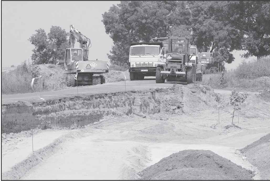
Kolejna gmina dołączyła do jednego z najważniejszych projektów drogowych - budowy drogi łączącej Świdnicę i Żarów z autostradą A4. Swój udział w przedsięwzięciu ma też gmina Jaworzyna Śląska

Wszystko miało być tak pięknie, aż nagle spadła na powiatowych włodarzy jak grom z jasnego nieba informacja, że realizacja inwestycji musi zostać wstrzymana, bo nasze przepisy nie są w stanie sprostać unijnym. Ucierpią na