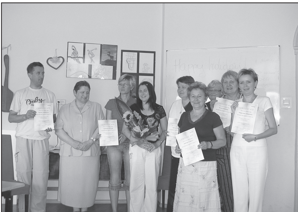
W czerwcu zakończyła się pierwsza edycja kursu nauki języka angielskiego dla dorosłych. Zajęcia rozpoczęły się jeszcze w lutym. Po kilku miesiącach nauki 28 osób odebrało dyplomy

Przypominamy, że od września ponownie rozpoczynamy naukę języków obcych w SOKiBP. Tym razem w dwóch