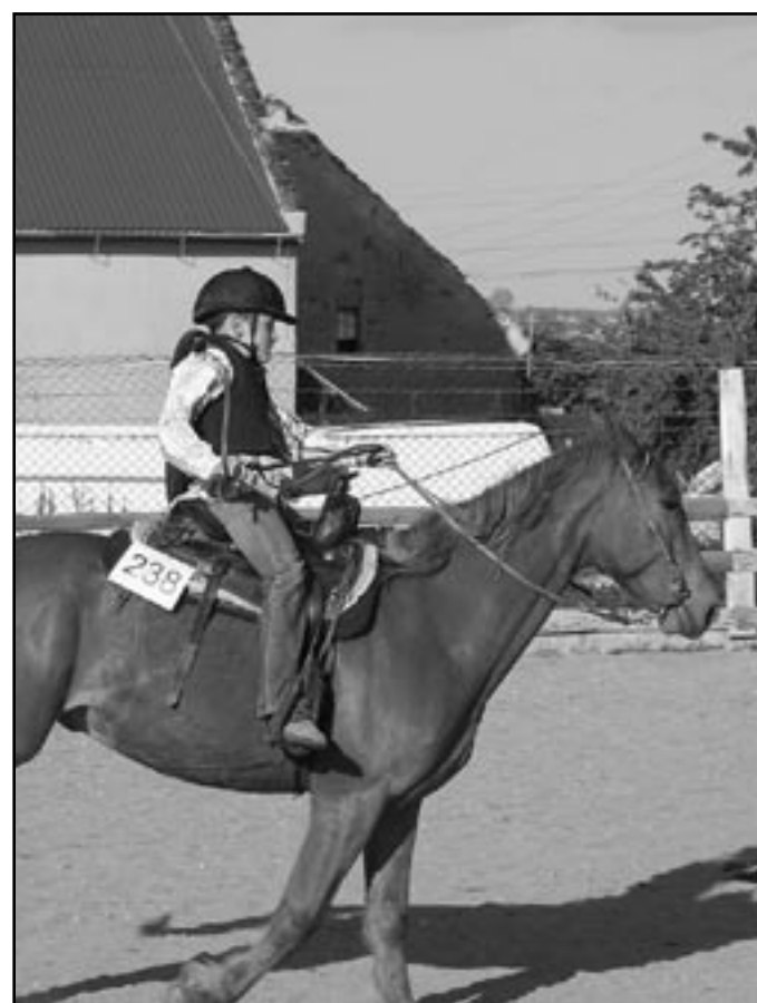
Najwięcej atrakcji organizatorzy zaplanowali oczywiście dla najmłodszych. Okazuje się, że jazda konna wcale nie musi być trudna

TEL./FAX: (074)585-41-36, E-MAIL: ROZMAITOSCI@JAWORZYNA.NET