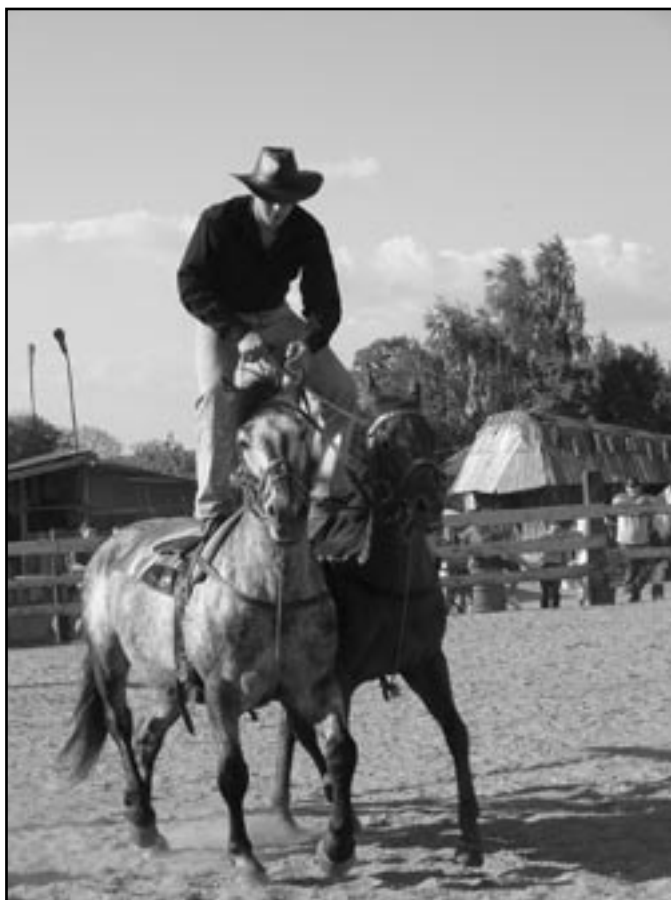
Niewiele stać na takie wyczyny. Prawdziwym mistrzostwem był pokaz kaskaderki konnej w wykonaniu grupy Bonanza Banach