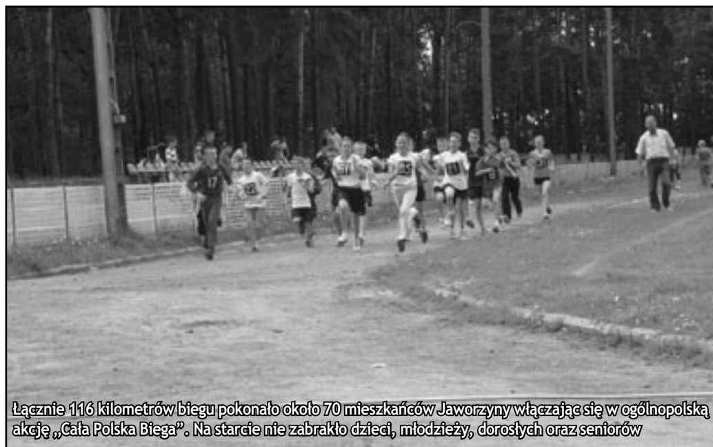
Łącznie 116 kilometrów biegu pokonało około 70 mieszkańców Jaworzyny włączając się w ogólnopolską akcję „Cała Polska Biega”. Na starcie nie zabrakło dzieci, młodzieży, dorosłych oraz seniorów