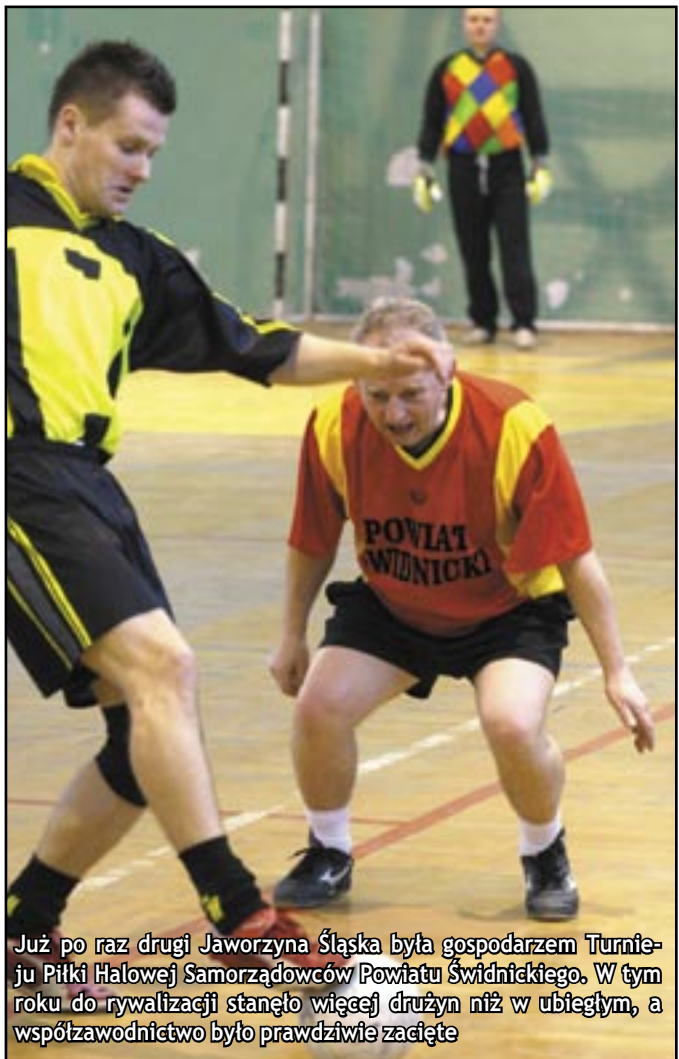
Już po raz drugi Jaworzyna Śląska była gospodarzem Turnieju Piłki Halowej Samorządowców Powiatu Świdnickiego. W tym roku do rywalizacji stanęło więcej drużyn niż w ubiegłym, a współzawodnictwo było prawdziwie zacięte