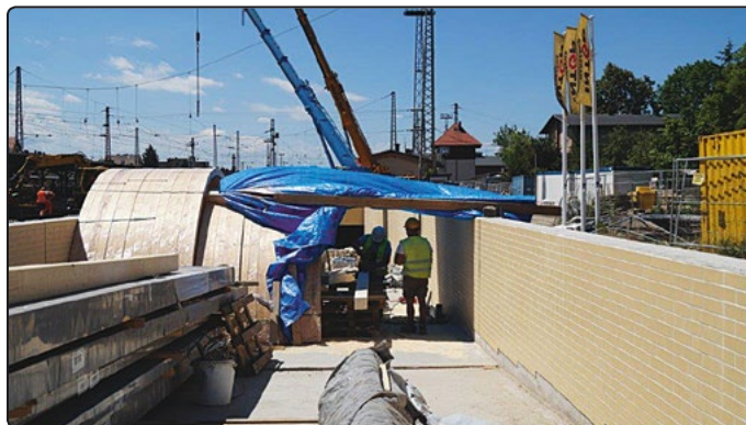
Prace przy montażu wiaty

W najbliższych dniach firma INTOP przystąpi do ostatniego etapu prac. Nastąpi demontaż zamontowanych