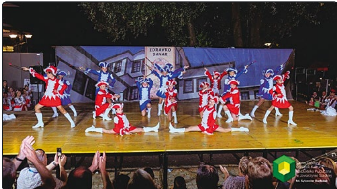
› ... oraz na scenie