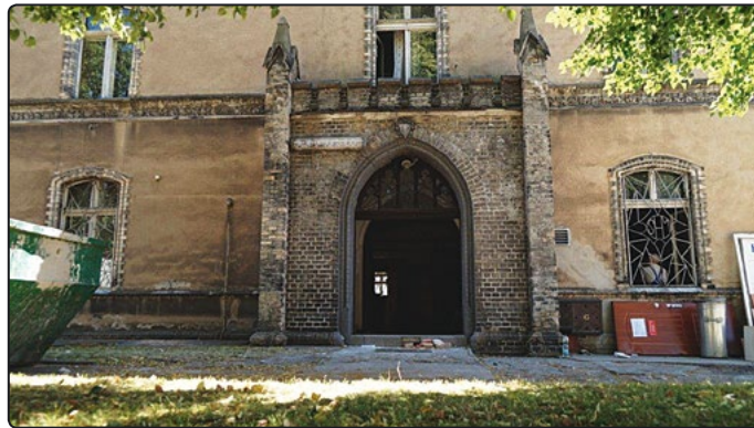
W budynku posterunku rozpoczęto prace

Zadanie realizowane jest przez Komendę Wojewódzką Policji we Wrocławiu pod nazwą „Termomodernizacja Posterunku Policji w Jaworzynie Śląskiej w ramach projektu „Policja też może być EKO” – wzrost efektywności energetycznej w obiektach policji dolnośląskiej – Bolków, Strzegom, Jaworzyna Śląska.”, a dofinansowanie pochodzi ze środków Funduszu Spójności w ramach projektu Zmniejszenie Emisyjności Gospodarki Programu Operacyjnego Infrastruktura i Środowisko 2014-2020. Wykonawcą prac została firma Budmax Alek-