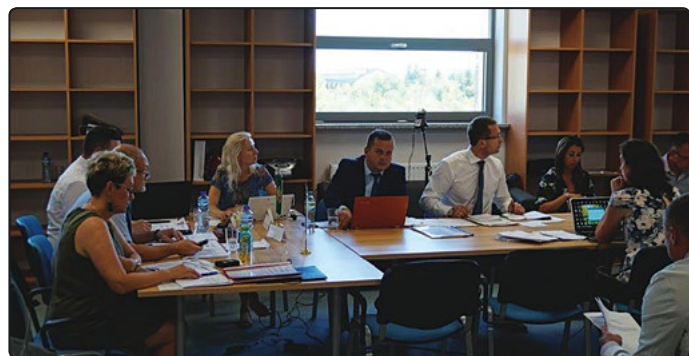
Burmistrz po raz pierwszy przedstawił raport o stanie gminy

Na zakończenie burmistrz podziękował za okazane zaufanie i podkreślił, że to, co udało się osiągnąć jest zasługą pracy całego zespołu, m.in.: pracowników urzędu i jednostek gminnych, radnych oraz sołtysów.