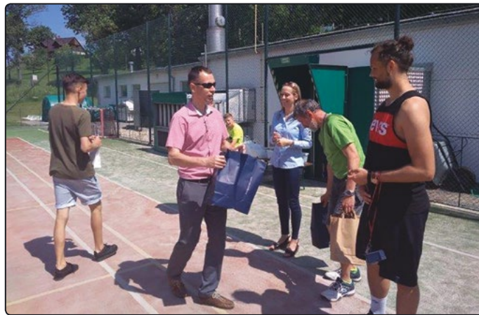
Na zakończenie wizyty w Teplicach wymieniono się upominkami

sportowe: dziewczęta grały w vybijanou, natomiast chłopcy spróbowali swoich sił w hokeja. Ponieważ zasady gry są różne w Polsce i w Czechach – graliśmy na oba sposoby. Następnie był posiłek, a po nim zwiedzanie pustelni i najbliższej okolicy. Uczniowie zobaczyli między innymi „czarną kuchnię” i dowiedzieli się m.in. dlaczego mnisi spali „w trumnach”. Był też czas na prezentację małych robotów, które poruszają się po narysowanej linii.