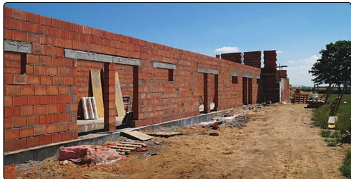
Szatnia Gromu Witków nabiera kształtów

Koszt robót budowlanych to kwota brutto 945 192,69 zł. Gmina na powyższe pozyskała dofinansowanie ze środków Ministerstwa Sportu ze środków Funduszu Rozwoju Kultury Fizycznej w ramach programu „Sportowa Polska – Program rozwoju lokalnej infrastruktury sportowej” w wysokości 426 400 zł.