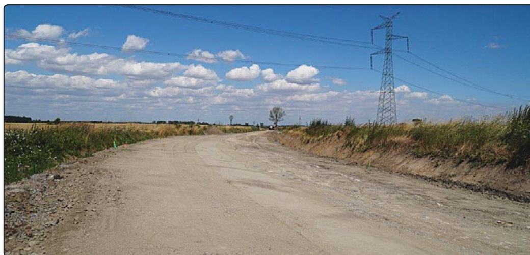
Z drogi usunięto już starą nawierzchnię

chwili obecnej prace przebiegają zgodnie z planem.