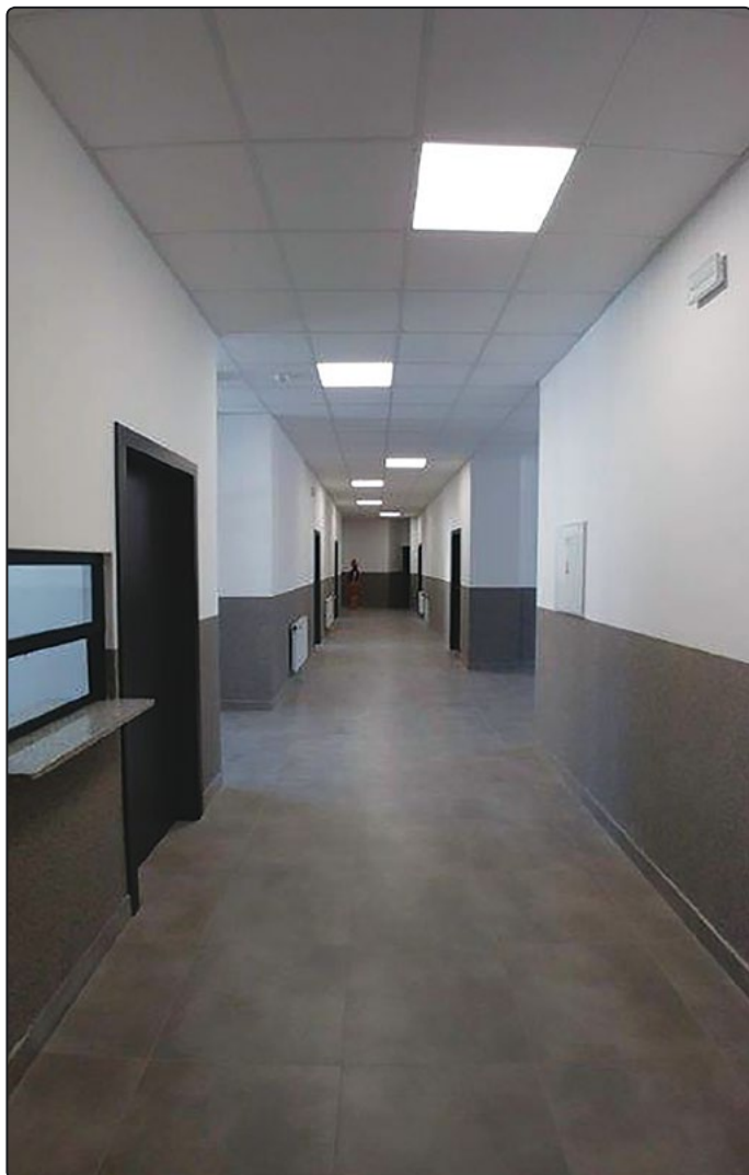
› Na parterze budynku załatwianych będzie większość spraw naszych mieszkańców

trwały nieco ponad rok. Z zewnątrz w ramach prac termomodernizacyjnych budynek zyskał nową elewację, okna oraz dach. Remont obejmował także roboty budowlane polegające na wykonaniu przebudowy kondygnacji parteru z przeznaczeniem na nową siedzibę Urzędu Miejskiego. Zmieniło się również najbliższe otoczenie przed budynkiem. Wykonano również kanalizację sanitarną, do której został przyłączony budynek. Równocześnie, wykonane były prace dotyczące wykonania nowych źródeł ciepła w mieszkalnych lokalach komunalnych.