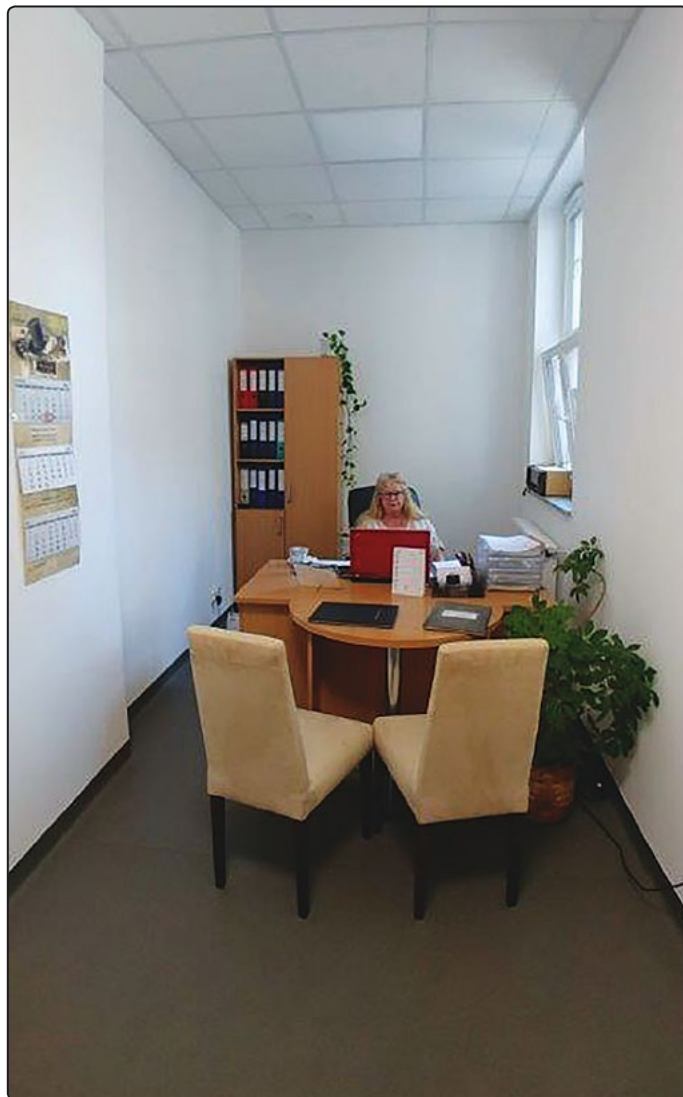
› Na interesantów oczekuje już Referat Gospodarki Mieszkaniowej

Następnie nadszedł czas porządkowania kwestii własnościowych oraz poszukiwania zewnętrznych środków na sfinansowanie tego typu inwestycji. Skutecznie udało się pozyskać dofinansowanie z Regionalnego Programu Operacyjnego Województwa Dolnośląskiego 2014-2020 na dofinansowanie projektu „Termomodernizacji budynku użyteczności publicznej przy ul. Powstańców 3 w Jaworzynie Śląskiej”, w kwocie 1 043 924,42 zł. Roboty budowlane poprzedziły cztery przetargi. Ostatecznie wyłoniony został wykonawca robót, którym została firma „Potoczni Sp. z o.o.”. Prace rozpoczęły się wiosną minionego roku i