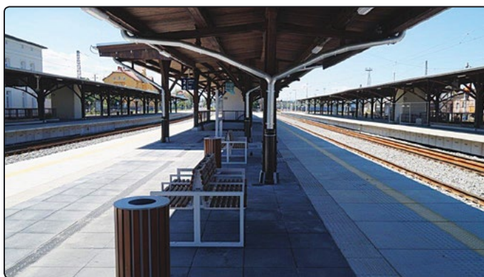
Drugi peron już gotowy

dla pieszych. Również zakończone będą prace związane z kanalizacją deszczową i przepompownią. Wykonaw-