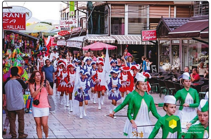
› Nasze Mażoretki na ulicach Ochrydy...

Pobyt w Macedonii to jednak nie tylko występy estradowe i udział w paradach. Mażoretki miały okazję poznać niesamowitą historię regionu Ochrydy, wpisanego na listę światowego dziedzictwa UNESCO. Zabytkowe cerkwie, klasztor św. Nauma, starożytny teatr, średniowieczna forteca cara Samuela to tylko niektóre z zabytków, z którymi mogli obcować uczestnicy wyjazdu. Po wyczerpujących występach nie zabrakło też