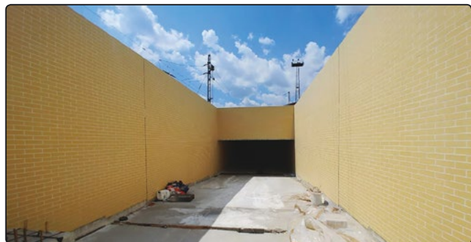
Prace przy tunelu również powoli dobiegają końca

W lipcu planuje się wykonać okładzinę ścian z płytek klinkierowych w tunelu i posadzkę z płyt granitowych. Na początku tego miesiąca powinna również pojawić się konstrukcja drewniana nad pochylnią nowego przejścia