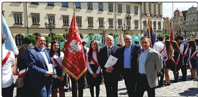
Nasza delegacja z pocztą sztandarowym

Relacja z tegorocznej wyprawy w następnym numerze Rozmaitości Jaworzynskich.