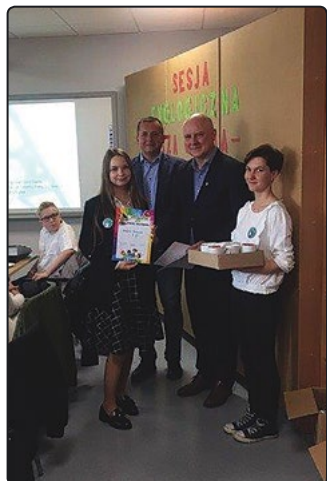
Uczestnikom sesji wręczono nagrody

Po raz pierwszy w naszej gminie, w maju br. odbyła się sesja ekologiczna uczniów pod hasłem „Nasza gmina – nasze środowisko”. Udział w niej wzięli przedstawiciele wszystkich szkół z terenu gminy.