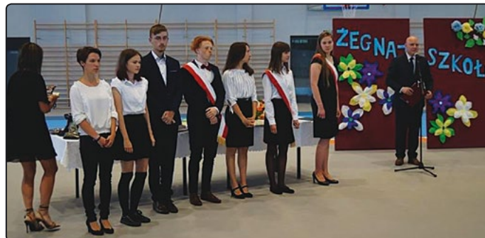
Na ostatnim apelu wręczono nagrody najlepszym uczniom

Serdecznie gratulujemy wszystkim uczniom! Życzymy by czas kanikuły upłynął radośnie i bezpiecznie.