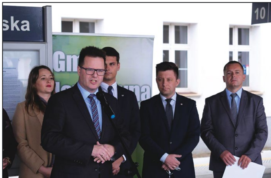
> Wiceminister Infrastruktury Andrzej Bittel przekazał oczekiwaną wiadomość

Z uwagi na obowiązujące przepisy w zakresie zamówień publicznych wyłonienie wykonawcy nieocierało się, ale ostatecznie została nim firma INTOP Warszawa. Wykonawca robót rozpoczął już prace, które powinny zakończyć się za rok.