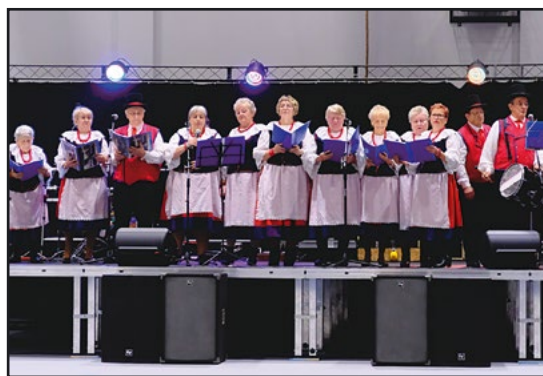
> ... wystąpili również Jaworzynianie