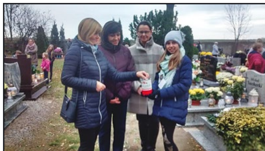
> Kwesta na cmentarzach

Zebrane środki zostaną przeznaczone na kolejny wyjazd w trakcie wakacji, w ramach którego kolejne mogiły na Kresach zostaną oczyszczone, wyremontowane i utrwalone na różny sposób, tak by ocalić pamięć o spoczywających tam Polakach.