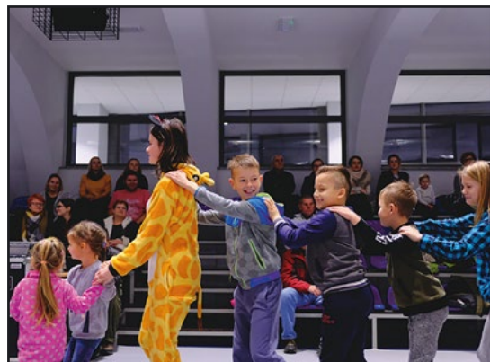
> W trakcie imprezy dla dzieci przygotowano zabawy...

dnia otwartego przyszedł czas na koncerty zespołów „Bielat Sound” i „Nullizmatyka”.