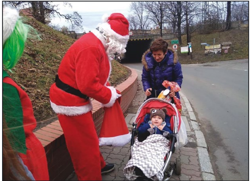
> Święty Mikołaj częstował napotkanych mieszkańców gminy cukierkami