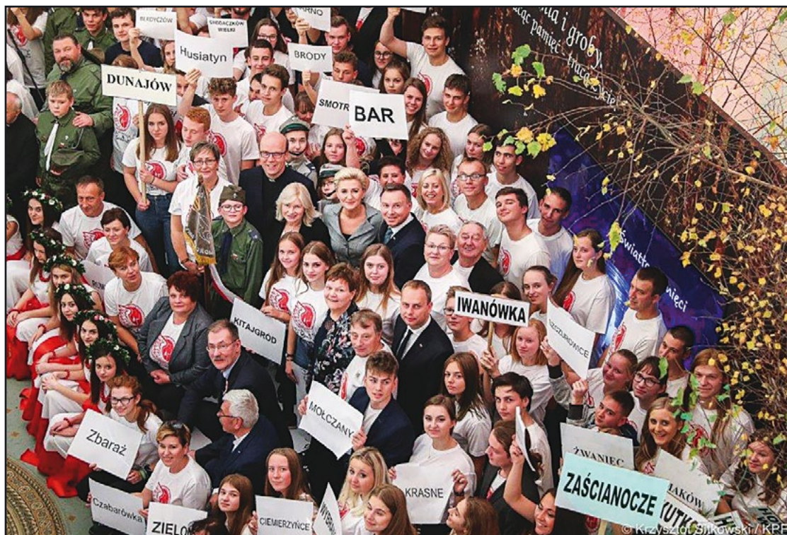
> Spotkanie młodzieży z parą prezydencką