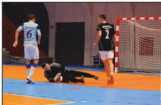
> Zwycięska drużyna Chaos Witków

Rywalizacja trwała do wieczora, by na jej końcu zwycięzcą okazała się drużyna „Chaos” z Witkowa. Pokonała ona w zaciętym finale 2:1 jaworzyńskie „B-Clasito”. Trzecie miejsce po wygranych rzutach karnych przypadło „Ebueee Ehee”. Kolejne miejsca zajęły drużyny: „Tabaluga Reactivation”, „Zebra Team”, „Venus Nowice”, „Znajomi Fryzjera”,