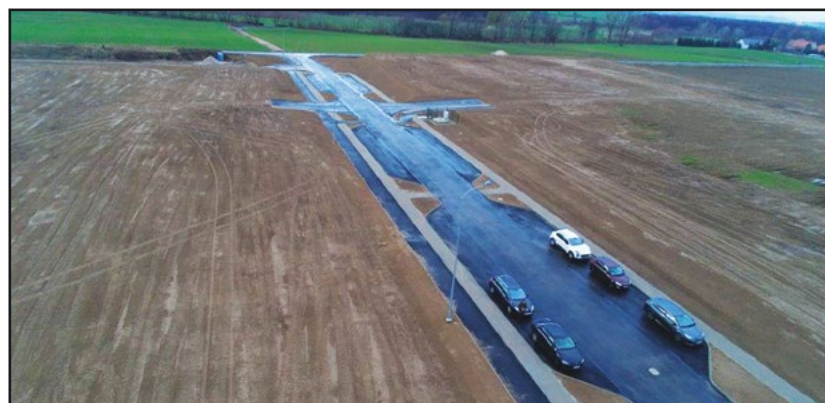
> Tereny inwestycyjne z lotu ptaka

podsumowującej konferencji podkreślił, że „teren obejmujący prawie 6 hektarów gruntów ma wiele atutów, a jednym z nich jest lokalizacja – niedaleko do autostrady A4 i drogi S3. Przygotowanie terenów inwestycyjnych to jedno z naszych priorytetowych zadań, które udało się zrealizować. Dodatkowo tylko jedynej gminie z całej aglomeracji, czyli właśnie Jaworzynie Śląskiej, udało się otrzymać wsparcie na realizację tego typu zadania. Kolejnym etapem projektu będzie promocja terenów inwestycyjnych, mająca na celu przyciągnięcie nowych inwestorów, nad czym pracujemy”.