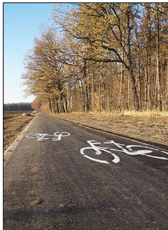
> Ścieżka rowerowa Jaworzyna Śląska-Nowice

Najistotniejsze jest jednak to, że ścieżka już służy mieszkańcom naszej gminy do rekreacji: spacerów, biegania, jazdy na rolkach czy rowerze. Mamy nadzieję, że jej atrakcyjny przebieg między lasem a polami sprawi, że wraz z nadjeściem wiosny liczba jej użytkowników, aktywnie spędzających wolny czas, jeszcze bardziej się zwiększy.