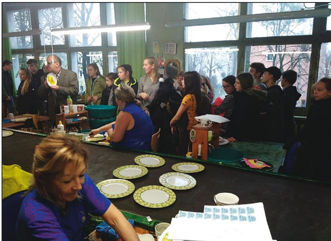
> W trakcie wizyty młodzież zwiedziła fabrykę porcelany