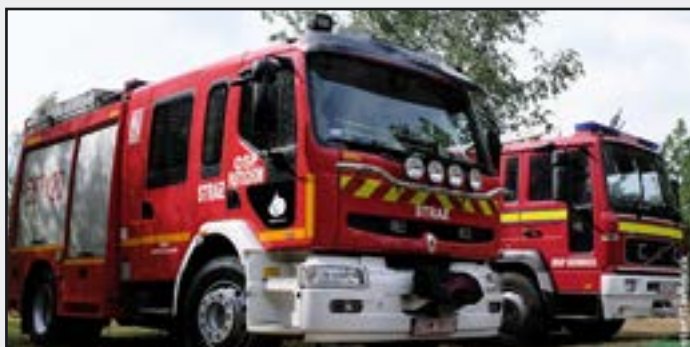
Zakup samochodu gaśniczego MAN dla jednostki OSP Jaworzyna Śląska