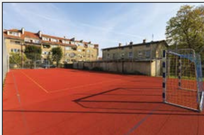
Boisko Sportowe ul. Ceglana w Jaworzynie Śląskiej