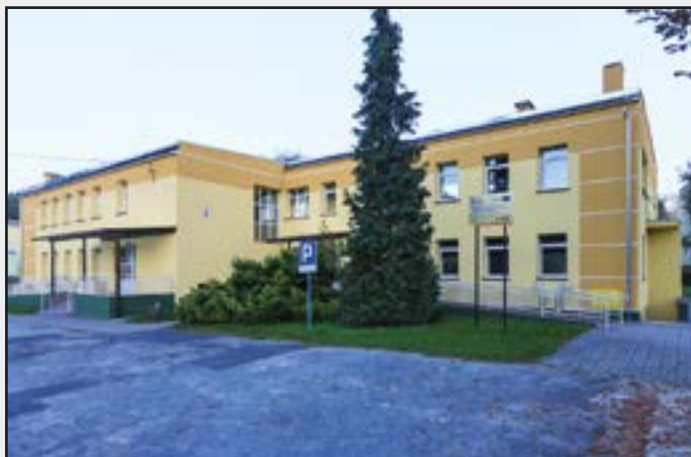
Samorządowa Przychodnia Zdrowia