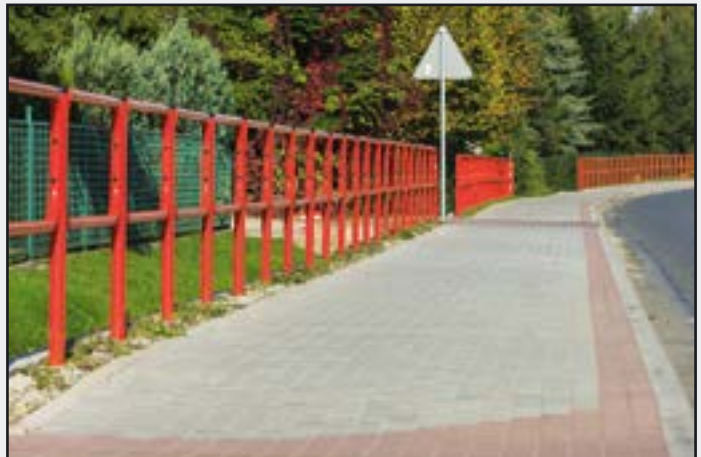
Chodnik w Witkowie