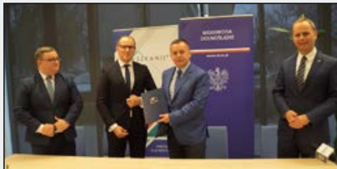
Mieszkanie Plus w Jaworzynie Śląskiej