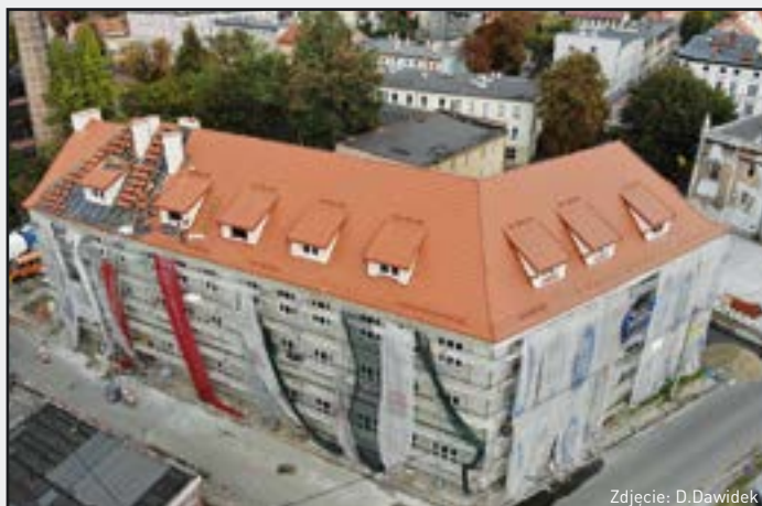
Budynek użyteczności publicznej przy ul. Powstańców 3