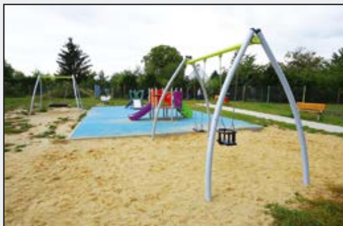
Plac zabaw ul. Ekerta w Jaworzynie Śląskiej