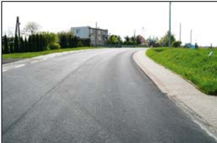
Droga w Pasiecznej