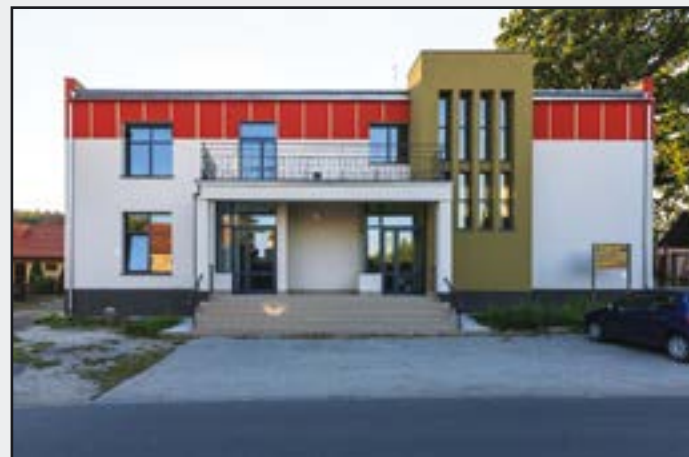
Remiza OSP w Bolesławicach