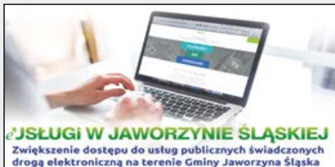
E-usługi w Gminie Jaworzyna Śląska