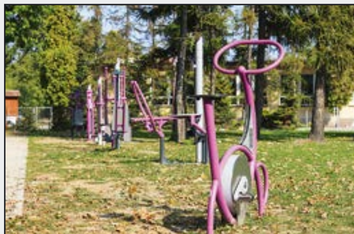
Siłownia zewnętrzna przy ul. Jana Pawła II w Jaworzynie Śląskiej