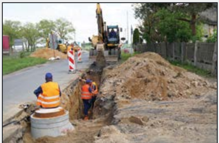
Budowa kanalizacji sanitarnej w Piotrowicach Świdnickich