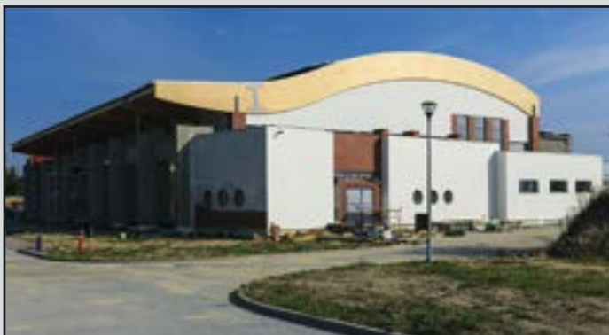
W trakcie realizacji

Budowa sali sportowej i edukacyjnej w Jaworzynie Śląskiej