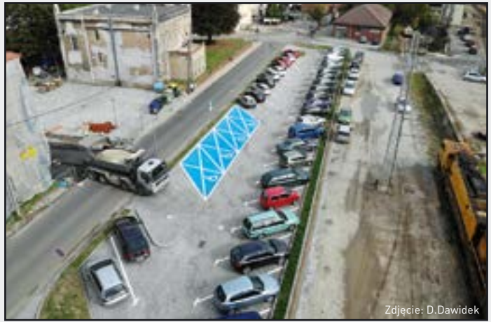
Parking przy ul. Powstańców