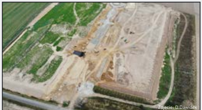
W trakcie realizacji