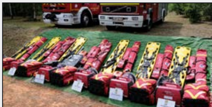
Wypożyczenie OSP z terenu gminy w urządzenia ratownicze