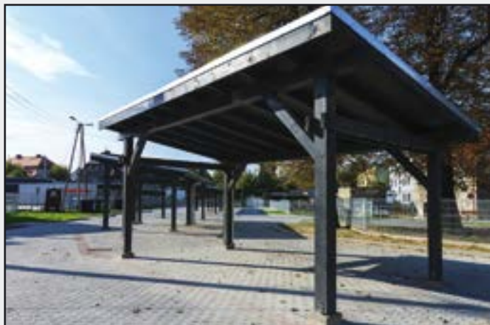
Targowisko w Jaworzynie Śląskiej po przebudowie