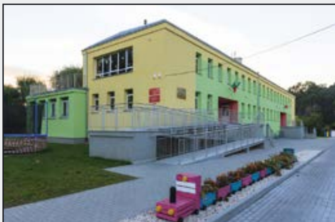
Przedszkole Samorządowe im. „Chatka Puchatka” w Jaworzynie Śląskiej