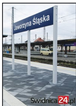
> ... przynoszą widoczny efekt