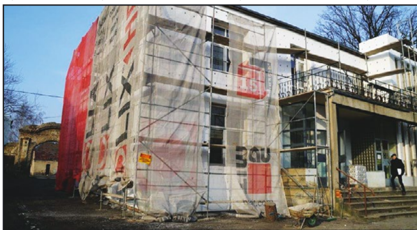
> W Bolesławicach prace trwają

Zadania finansowane są z Regionalnego Programu Operacyjnego Województwa Dolnośląskiego 2014-2020 współfinansowany ze środków Unii Europejskiej, Europejskiego Funduszu Rozwoju Regionalnego RPO WD 2014-2020 ZIT AW, Poddziałanie 3.3.4.