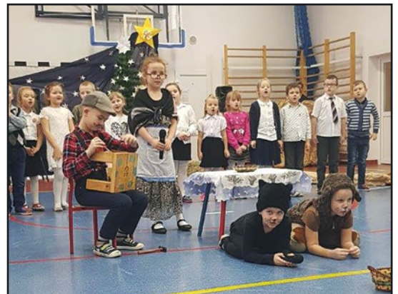
> Wnuczka zaprezentowały swoje zdolności artystyczne...

kłó również tańców. Po części artystycznej na wszystkich czekało pyszne ciasto oraz kawa i herbata.