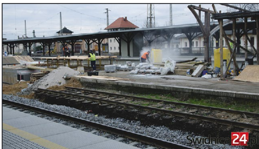
> Roboty na peronach...

ku lat mogli korzystać z wyremontowanego obiektu. Następnie przyszedł czas na remont peronów, wymianę ich nawierzchni, odrestaurowanie wiat wymianę oświetlenia. Odnowione zostały przejścia tunelowe na poszczególne perony. W trakcie realizacji tych inwestycji zrodził się pomysł powiększenia zakresu tych robót i przedłużenia przejścia podziemnego, tak, by wiodło ono z jednej strony miasta na drugą. W międzyczasie udało się pozyskać środki na zasadniczą przebudowę i remonty północnej części miasta przylegającej do torowisk. Zbudowany zostanie nowy parking, w miejsce dotychczasowego