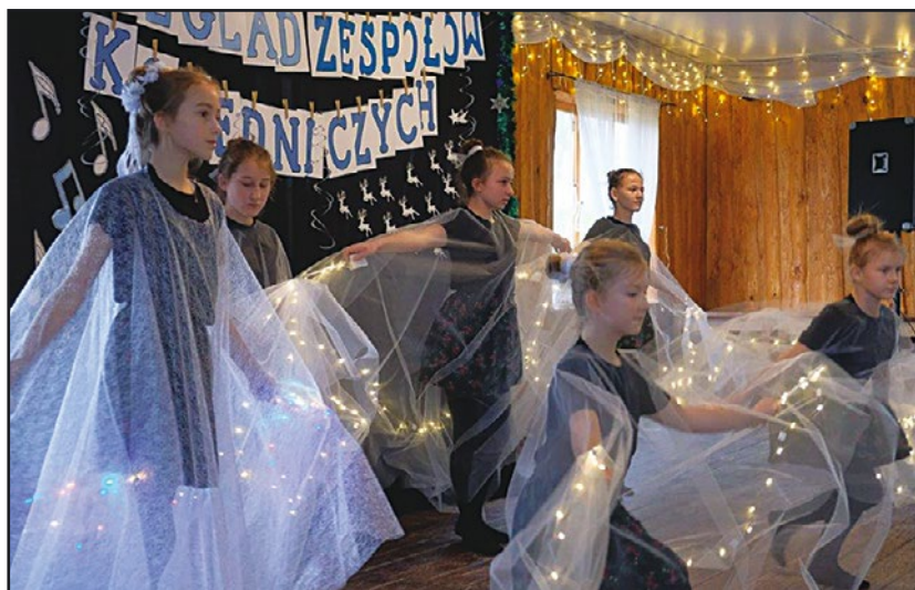
> i nieco starsi artyści

laureaci przeglądu nagrody rzeczowe ufundowane przez SOKiBP. Dodatkową atrakcją tegorocznej imprezy był występ grupy dziewcząt ze Szkoły Podstawowej w Starym Jaworowie, które przedstawiły zjawiskowy taniec aniołów. Pragniemy serdecznie podziękować wszystkim zespołom za udział w konkursie, jednocześnie już dziś zapraszając na kolejną edycję przeglądu, podtrzymującego kołędnicze tradycje.