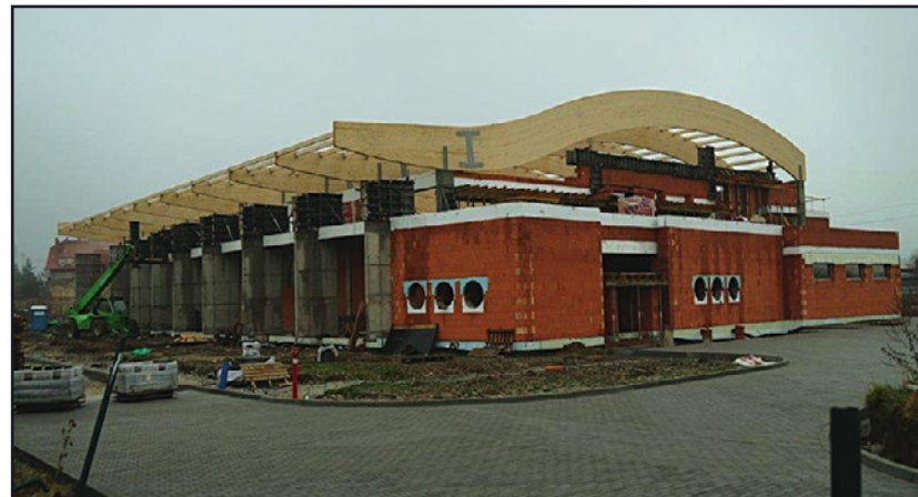
> Efekt prac jest już widoczny zarówno na zewnątrz...

(instalacji sanitarnych, elektrycznych i ogólnobudowlanych). Zadanie finansowane jest ze środków pochodzących