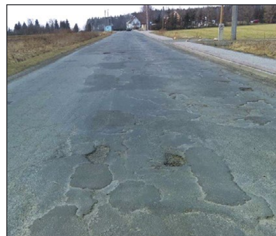
> Obecnie stan drogi pozostawia wiele do życzenia

wierzchnia asfaltowa, a w jej miejsce położona zostanie nowa warstwa ścieralna z mieszanek mineralno-bitumicznych. Uporządkowane zostaną również pobocza oraz zostaną one uzupełnione kruszywem. Prace powinny zostać zrealizowane do 15.07.2018 r.