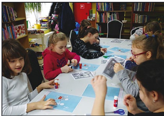
> Zajęcia plastyczne cieszyły się dużym zainteresowaniem

Moc atrakcji i wiele pozytywnych emocji przyniosły dzieciom wycieczki organizowane przez SOKiBP. Uczestniczyło w nich blisko 50 dzieci. W pierwszym tygodniu ferii był to tradycyjny wyjazd do kina, w drugim zaś niezapom-