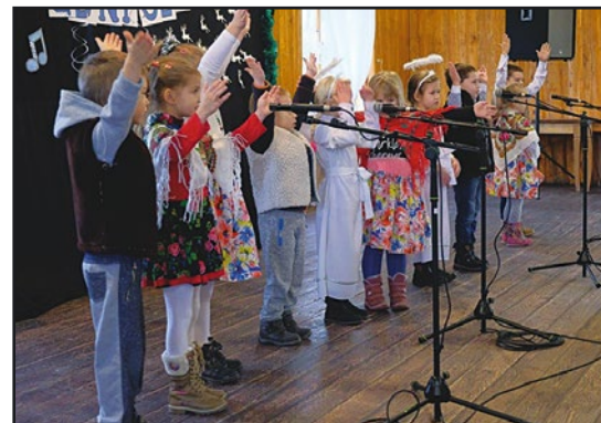
> W ramach Przeglądu wystąpili najmłodsi