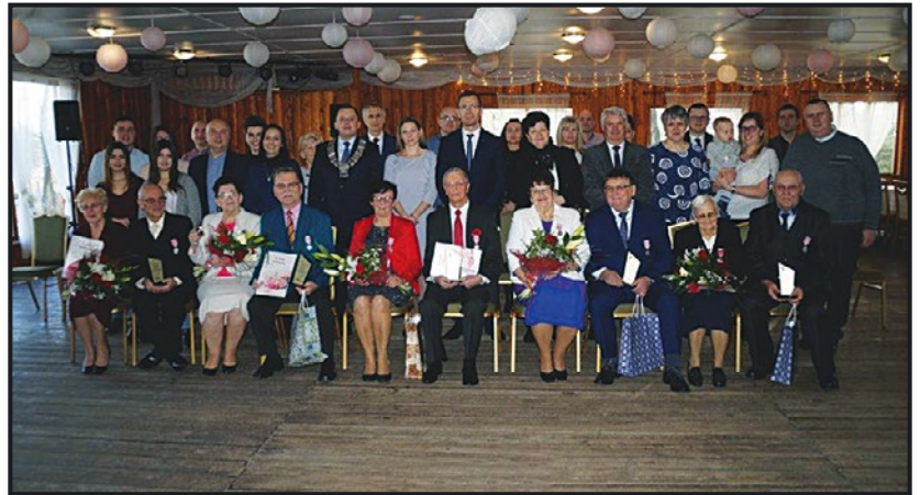
> Dostojni Jubilaci w gronie najbliższych

Szanownym Jubilatom życzymy kolejnych jubileuszy, zdrowia i wszelkiej pomyślności.