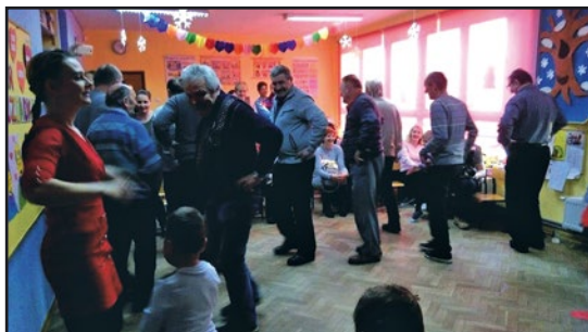
> Dziadkowie całkiem dobrze radzili sobie w tańcu

Spotkanie z okazji Dnia Babci i Dnia Dziadka odbyło się również w Witkowie. Przybyłym Babciom i Dziadkom wnuczki i wnuczki złożyły serdeczne życzenia pomyślności i zdrowia. Oprócz życzeń nie zabrakło również części artystycznej. W trakcie na scenie pojawiły się wnuczka, które w prezencie zaśpiewały kilka znanych utworów oraz zaprezentowały swoje talenty artystyczne w kabarecie. Nie zabra-