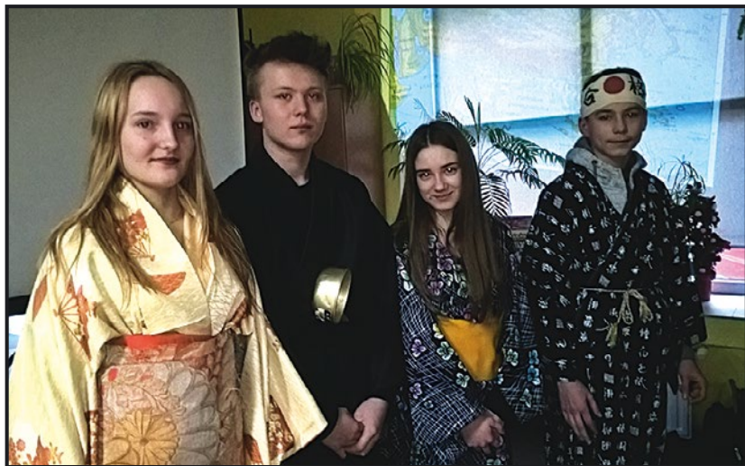
> Uczestnicy spotkania w tradycyjnych strojach japońskich

nii, w szkole spędzają 12 godzin, do szkoły chodzą w mundurkach i nie znają takiego pojęcia jak spóźnienie. Młodszych obowiązuje wyrażanie szacunku dla starszych, przede wszystkim gestem świadczącym o wyrazie szacunku jest ukłon. Dzieci niepytane nie zabierają głosu. Japonia to kraj bardzo zamożny, a przez to niestety drogi. W metropolii Tokio żyje kilkanaście milionów ludzi, a