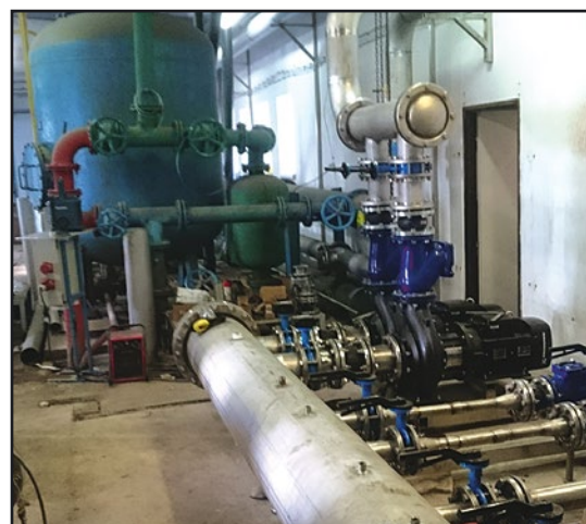
> Urządzenia w stacji uzdatniania wody w Jaworzynie Śląskiej

merytoryczną drugiego stopnia i uzyskał nieco więcej punktów, niż wniosek dla Piotrowic Świdnickich. Planowana sieć w Pastuchowie będzie mieć długość 7,38 km z możliwością przyłączenia do niej 142 budynków (1063 mieszkańców). Roboty planowane są na lata 2018-2019.