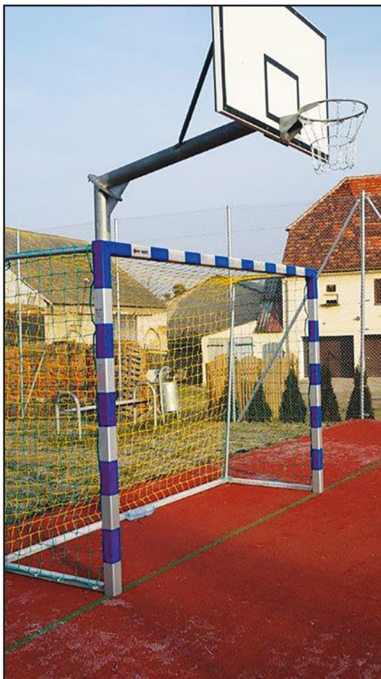
> Boisko w Czechach w nowej odsłonie

z siatki ocynkowanej o wysokości 4 m oraz montażu ławek. Całość inwestycji zamknęła się kwotą blisko 100 tys. zł brutto. Inwestycja