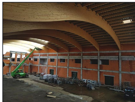
> ... jak i wewnątrz obiektu

finansowana była ze środków gminy oraz Funduszu Sołeckiego. Mamy nadzieję, że wraz nadejściem wiosny boisko będzie się cieszyć dużym powodzeniem mieszkańców Czech.