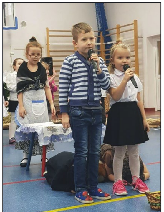
> ... oraz śpiewając piosenki i recytując wierszyki

kłó również tańców. Po części artystycznej na wszystkich czekało pyszne ciasto oraz kawa i herbata.