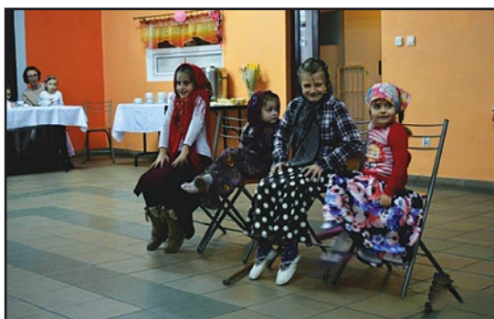
> ... występując w kabarecie...

i radości dostarczyły babciom i dziadkom przedszkolaki, które zaprezentowały życzenia, wiersze, piosenki, taniec oraz zabawną scenkę pt. „Dziadek, stołek i rosołek”. Na zakończenie dzieci