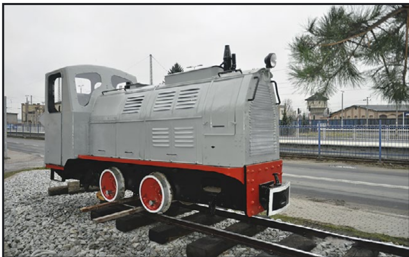
> ... i ustawiony na skwerze

lokomotywa trafiła do Jaworzyny Śląskiej z nieczynnego Zakładu Wienerberger Cera-mika Budowlana w Złocińcu. Pojazd wy-