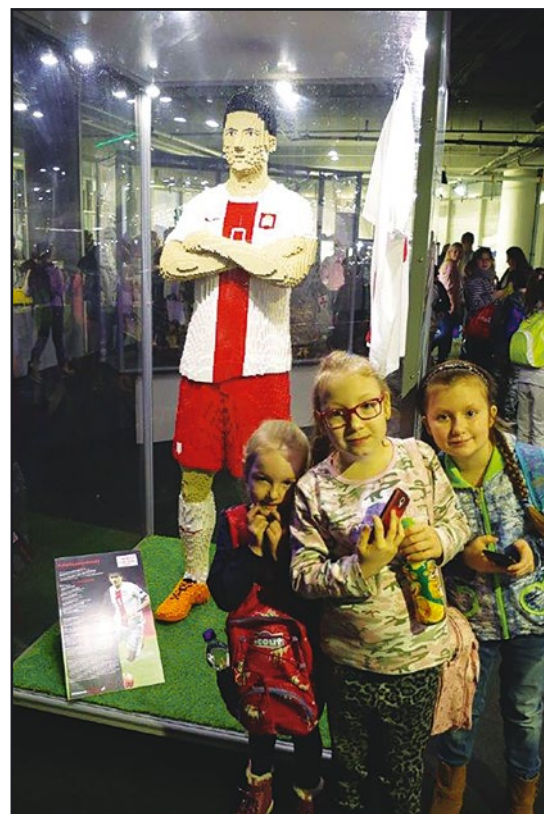
> Na wystawie klocków LEGO

mniana i pełna wrażeń wycieczka na Wystawę Klocków Lego do Wrocławia.