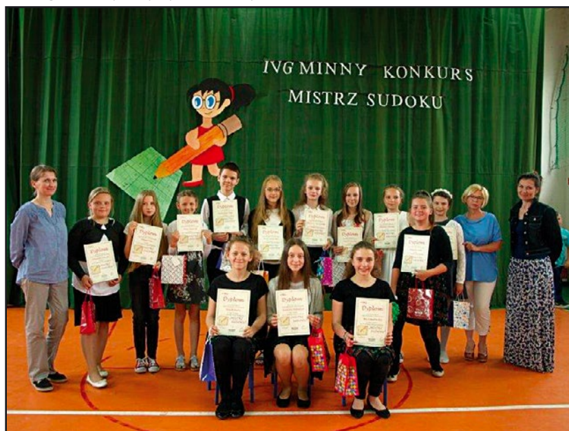
> Mistrzowie Sudoku