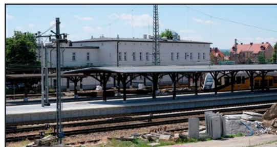
> Remont stacji kolejowej

zabudowę wind. Renowacji i rozbudowanie poddany zostanie istniejący system odwodnienia. Wymienione zostaną tory kolejowe. Na stacji pojawią się nowe urządzenia megafonowej informacji podróżnych oraz sy-