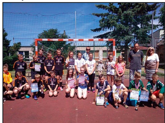
> Uczestnicy Koloryt Cup 2017

tworzą bardzo dobrą atmosferę turnieju. W tym roku oprócz chłopców z klas IV-VI w ramach rozgrywek na boisku rywalizowały także dziewczęta. W turnieju dziewcząt zwyciężyły „gospodynie” czyli uczennice SP Pastuchów pokonując drużynę z SP Stary Jaworów 2:0.