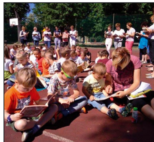
> Wspólne czytanie odbyło się na boisku szkolnym

Szkoła Podstawowa w Pastuchowie przystąpiła do tej ogólnopolskiej akcji po raz pierwszy. Celem tego przedsięwzięcia jest przede wszystkim promowanie czytelnictwa wśród dzieci i młodzieży, a więc przyjemne z pożytecznym. Pomysłodawcą i głównym organizatorem jest redakcja miesięcznika „Biblioteka w Szkole”, a organizatorami przedsięwzięcia w poszczególnych miastach i wsiach – biblioteki szkolne i publiczne.