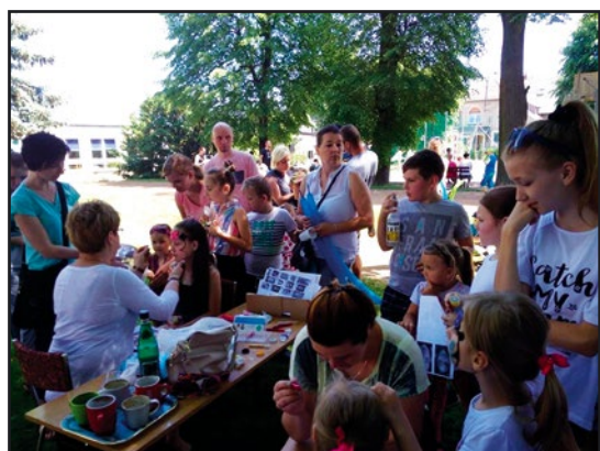
> ... a w Pastuchowie malowano twarze

Wspaniała zabawa, piękna pogoda, uśmiechnięte twarze dzieci oraz rodziców to obrazki, jakie można było zauważyć podczas Festynu Rodzinnego, który odbył się na terenie ogrodu naszego Przedszkola.