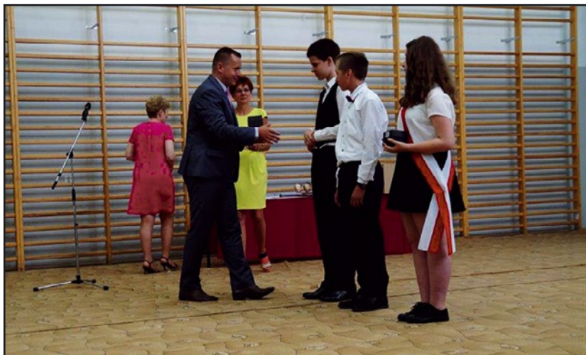
> Nagrody najlepszym uczniom wręczył Burmistrz

Grono uczniów, którzy uzyskali bardzo wysokie średnie ocen było całkiem spore.