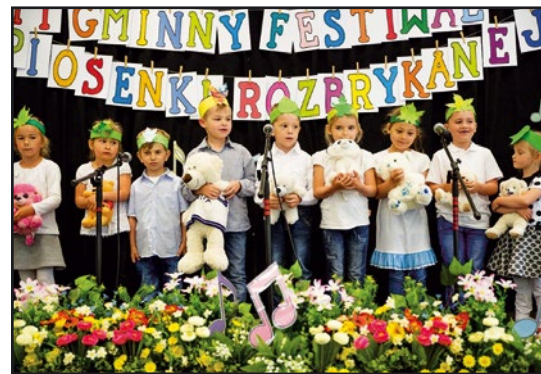
> W trakcie Festiwalu artyści występowali zarówno zespołowo...