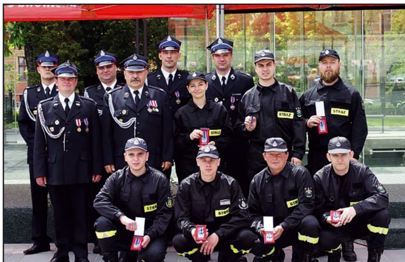
> Strażacy Ochotnicy na obchodach Dnia Strażaka we Wrocławiu

zwyciężyła OSP Pastuchów. OSP z Pastuchowa otrzymała od dyrektora Generalnego Coal Holding Spółka z o.o. czek o wartości 2000 zł na zakup sprzętu i umundurowania.