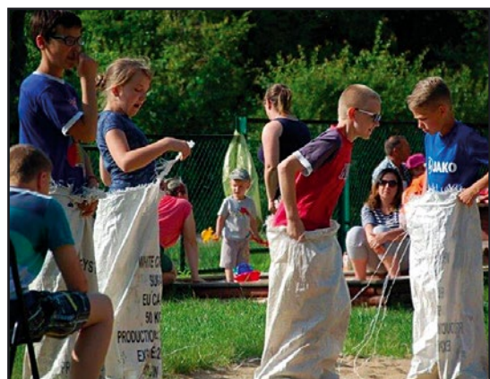
> Najwięcej emocji wywołały biegi w workach

Organizatorzy zadbał o atrakcyjny program. Przygotowali sporo gier i zabaw, w których dzieci brały bardzo chętnie udział. Najwięcej emocji wywołały biegi w workach i na czas oraz strzały do celu. Wspólna zabawa dostarczyła wiele radości i uśmiechu.