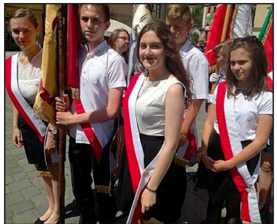
> Poczet sztandarowy jaworzyńskiego gimnazjum

skierowane zostały do uczniów, ich rodziców i pracowników jaworzyńskiego gimnazjum oraz do wszystkich mieszkańców naszej gminy, której społeczność bardzo pieczołowicie kultywuje pamięć o Kresach. Podczas kwestu przeprowadzonych na cmentarzach w dniu 1 listopada i na wiosnę w kościołach zebraliśmy bowiem 10100 zł zajmując I miejsce na Dolnym Śląsku. Wszystkim uczestnikom akcji podziękowali również: