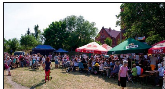
> Frekwencja w trakcie festynu dopisała

Część artystyczną festynu rozpoczęły występy najmłodszych mieszkańców naszej gminy, których następnie na scenie zastąpił zespół Bethel. Nie zabrakło również wielu gier i zabaw dla dzieci przygotowanych przez wolontariuszy Klubu Młodzieżowego i pra-