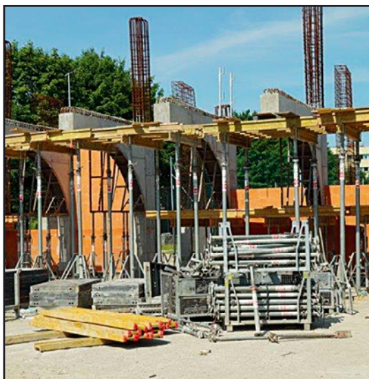
> Na budowie hali

Na tą chwilę, realizacji inwestycji przebiega zgodnie z harmonogramem i nie ma zagrożenia przedłużenia terminu wykonania zadania, ustalonego w umowie.