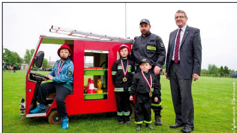
> Prawdziwą furorę zrobił mini wóz strażacki zbudowany przez strażaków z Bolestawice