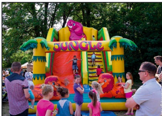
> Nie mogło zabraknąć atrakcji dla najmłodszych

jednak loteria fantowa. Do tych, do których uśmiechnęło się szczęście powędrowały atrakcyjne nagrody takie jak: telewizor, zmywarka, tablet, ufundowane przez sponsorów imprezy.