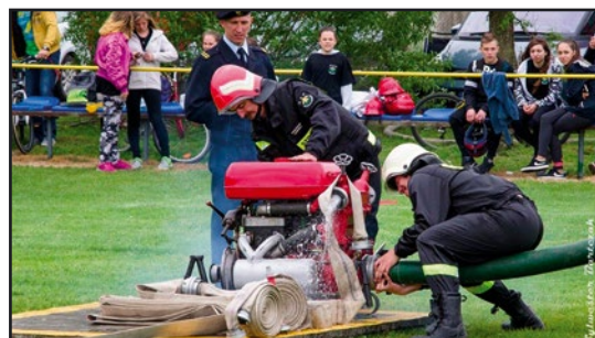
> W zawodach rywalizowali zarówno seniorzy...

Połowę uczestników stanowiły drużyny młodzieżowe i dziecięce, co daje powody do optymizmu. W zawodach, wzorem ubiegłego roku, wystąpiła drużyna ochotników złożona z pracowników firmy ZEBRA Sp. z o.o. w Jaworzynie Śląskiej. Zawody przyciągnęły liczne grono gości i kibiców. Nad ich prawidłowym przebiegiem czuwała