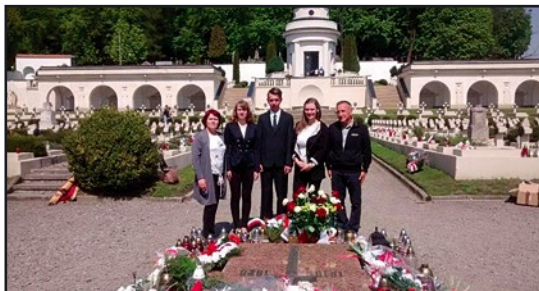
> Delegacja z Jaworzyny Śląskiej na Cmentarzu Orłąt we Lwowie