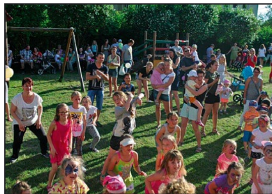
> Przedszkolaki tańczyły Zumbę...

Przedszkolaki wraz z rodzicami bawili się podczas festynu 9 czerwca. Dzieci wystąpiły z bogatym repertuarem artystycznym, pokazując jak potrafią pięknie tańczyć i z wielkim zaangażowaniem śpiewać piosenki. Były również wspólne tańce Zumby. Atrakcjami dla najmłodszych