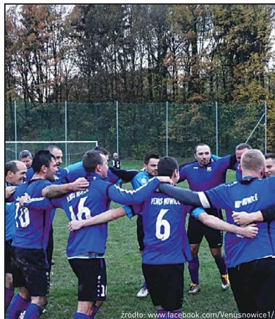
Venus Nowice - mistrz jesieni w klasie „A”

Bardzo dobrze radziły sobie nasze drużyny grające na szcze-