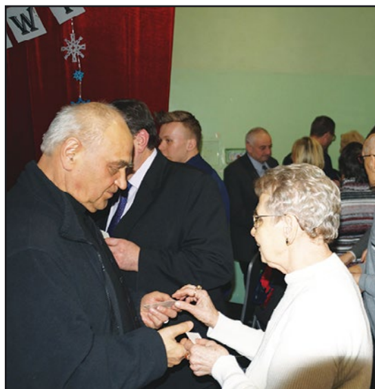
> Składanie życzeń...

otrzymał upominki, przygotowane przez Gminę Jaworzyna Śląska.