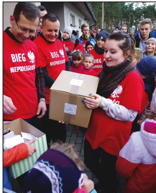
> Wśród uczestników rozlosowano atrakcyjne nagrody

W dniu 11 listopada obchody rozpoczęły się uroczystą Mszą Św. odprawioną w kościele parafialnym w Jaworzynie Śląskiej w intencji Ojczyzny. Świę-