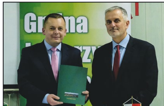
> Burmistrz Grzegorz Grzegorzewicz otrzymał promesę od Prezydenta Wałbrzycha Romana Szelemeja

szarze Gminy Jaworzyna Śląska. Do dyspozycji przedsiębiorców zostanie przekazane 5,72 ha uzbrojonego w sieć: wodociągową, kanalizacji sanitarnej i kanalizacji deszczowej, kanały pod linie energetyczną zasilającą, infrastrukturę komunikacyjną terenu inwestycyjnego. Projekt zakłada również niwelację terenu i budowę platform.