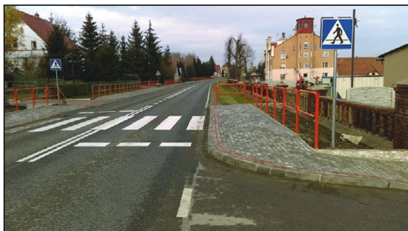
> Chodnik w Starym Jaworowie

Dobiegł również końca długo oczekiwany remont odcinka drogi wojewódzkiej nr 382 wraz z budową mostu na rzece Pełcznica. Objazd na czas remontu dawał się już we znaki, szczególnie mieszkańcom Pasiecznej. Szczęśliwie inwestycja prowadzona przez Dolnośląską Służbę Dróg i Kolei przeszła już niezbędne odbiory. Kierowcy mogą już jeździć najkrótszą trasą do Strzegomia.