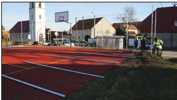
> W Czechach trwały prace przy montażu ogrodzenia

Odbiór techniczny przeszedł również budynek Przedszkola. Wykonane zostały prace związane z termomodernizacją (naprawa dachu, wymiana okien, wymiana instalacji centralnego ogrzewania). Także wewnątrz budynku wykonany został szereg prac remontowych i naprawczych. Pozwoliło to zainaugurować działalność żłobka samorządowego, w którym od 20 listopada opiekę znajduje siedemnaścioro najmłodszych mieszkańców gminy.