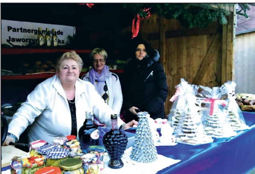
> Stoisko przygotowane przez naszą delegację

smakoliki. Przygotowane stoisko i serwowane na nim wyroby cieszyły się dużym zainteresowaniem mieszkańców Dolnej Bawarii. Wyjazd przebiegł szczęśliwie a nasza delegacja powróciła z życzeniami świątecznymi dla wszystkich mieszkańców gminy Jaworzyna Śląska od przyjaciół z partnerskiego miasta Pffeffenhausen.