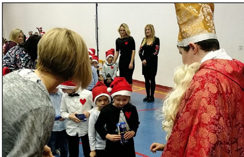
> Patron Szkoły Św. Mikołaj z najmłodszymi uczniami

rocznym trudzie przygotowania podarków byli oczywiście rodzice, ale także sponsorzy, których grono co roku się powiększa i którym szkoła jest bardzo wdzięczna.