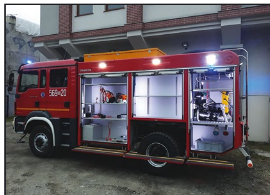
> Nowy wóz strażacki OSP Jaworzyna Śląska