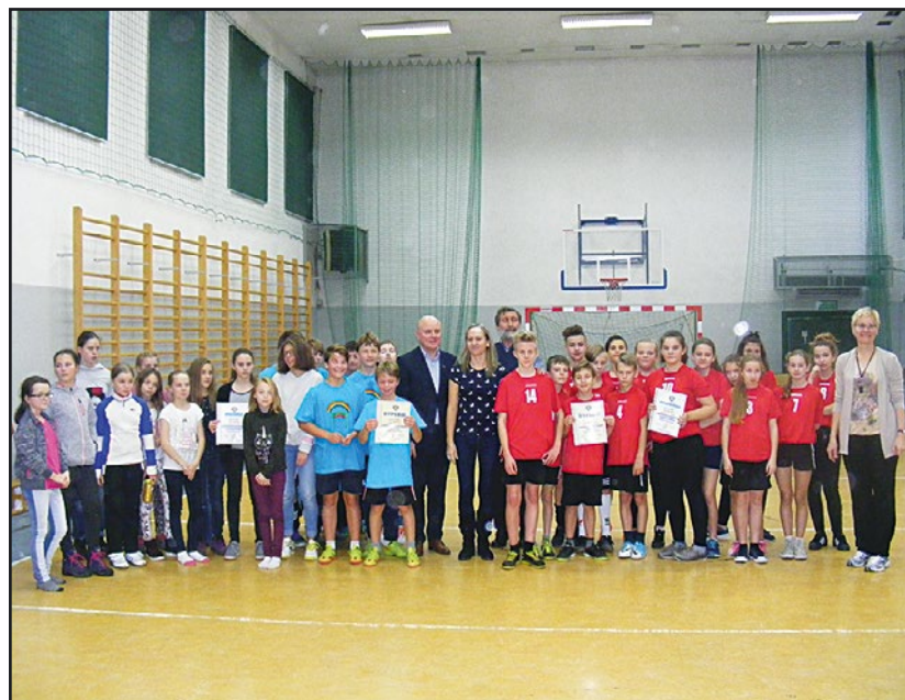
> Uczniowie ze Szkoły Podstawowej w Jaworzynie Śląskiej wraz z rówieśnikami z Czech

Następnie przyszedł czas na zwiedzenie Kościoła Pokoju, zabytku wzniesionego z drewna, gliny i słomy, który po częściowym remoncie robi ogromne wrażenie. Na świecie są tylko 2 takie obiekty.